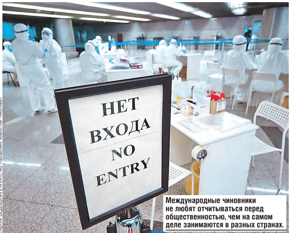
Международные чиновники не любят отчитываться перед общественностью, чем на самом деле занимаются в разных странах.

тается добраться до их детей через смартфоны. Мы обязаны оградить их с помощью патриотического воспитания. В семейном кругу нужно объяснять самым младшим, что происходит в мире. Я постоянно разговариваю с сыном на актуальные темы. Наши дети умные. Они все поймут и сделают правильные выводы.