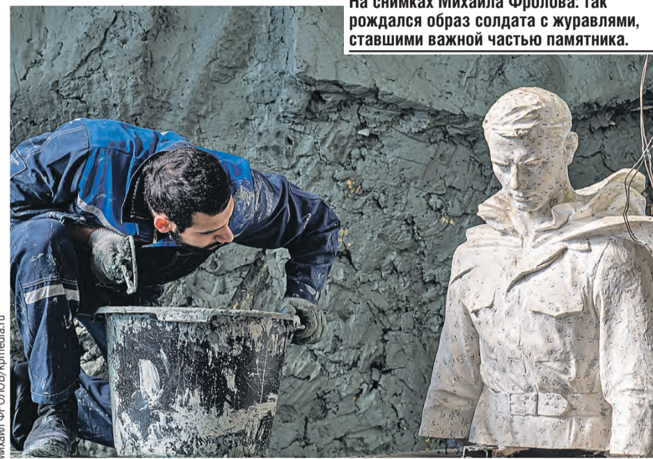
На снимках Михаила Фролова: так рождался образ солдата с журавлями, ставшими важной частью памятника.

Читаешь, и слезы наворачиваются. Возле каждого стенда с уникальными кадрами стоят люди: обсуждают что-то личное, связанное с этими местами.