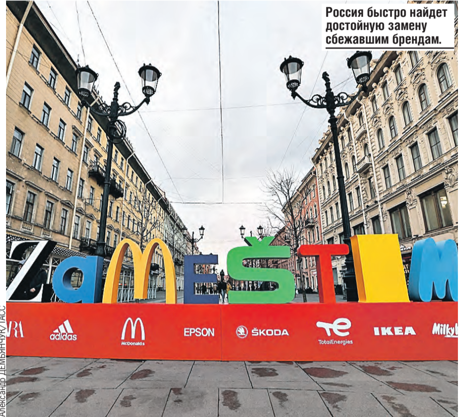
Россия быстро найдет достойную замену сбежавшим брендам.

Украине придется платить. Мотивы Вашингтона понятны. Ленд-лиз позволит увеличить прибыль американских военных корпораций в несколько раз. Так было и в период Второй мировой. Вдумайтесь: СССР получал оружие от США по ленд-лизу. Об этом говорили как о помощи союзников. Наша страна спасла мир от фашизма дорогой ценой – 27 миллионов погибших. Возвращали долги, ограничивали себя многие годы, поставляя в США по взаиморасчетам платину, золото, лес, бесплатно ремонтировали американские суда и т.п. Но только спустя 61 год после Великой Победы, в 2006-м, были завершены эти выплаты! Ленд-лиз – это товарный кредит, причем недешевый: за все боеприпасы, технику и продовольствие, которые поставят США, рас-