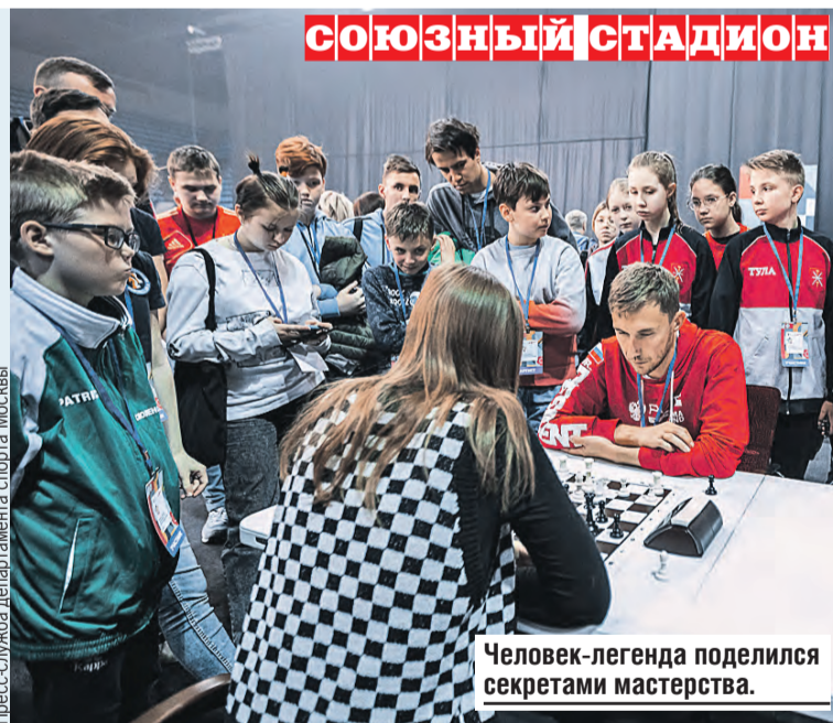
Человек-легенда поделился секретами мастерства.

— Ничего страшного в таком шаге точно нет. С соревновательной точки зрения только выигрыш. Все-таки сильных мастеров в Азии больше, чем