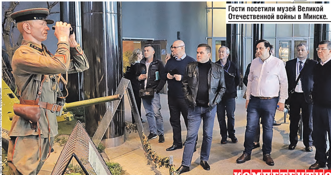
Гости посетили музей Великой Отечественной войны в Минске.

– Он поставил себе цель запустить 40 тысяч спутников на орбиту, чтобы поддержать интернет. 11 уже там. Любая болванка весом 40 тонн может быть не только передатчиком для сети, но и оружием, управляемым в ручном режиме. Оно несет опасность космическим аппаратам других стран.