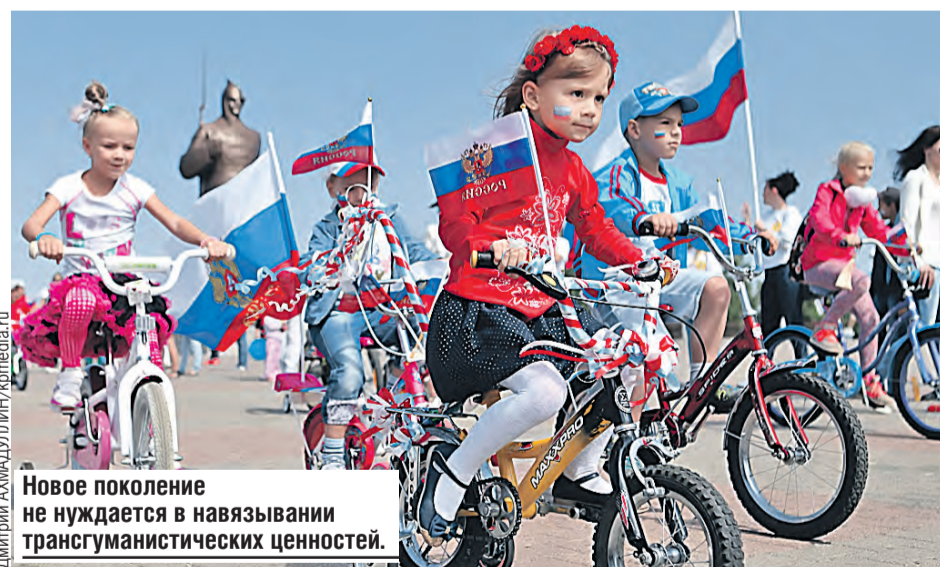
Новое поколение не нуждается в навязывании трансгуманистических ценностей.

Геи, лесбиянки – это все вчерашний день. Вы слышали что-нибудь о фурри? Если вкратце, дети приходят в школу, объявляют себя животными, и могут потребовать лоток для естественных нужд. Ведь так они себя якобы воспринимают.