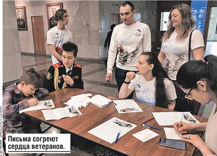
Письма согреют сердца ветеранов.