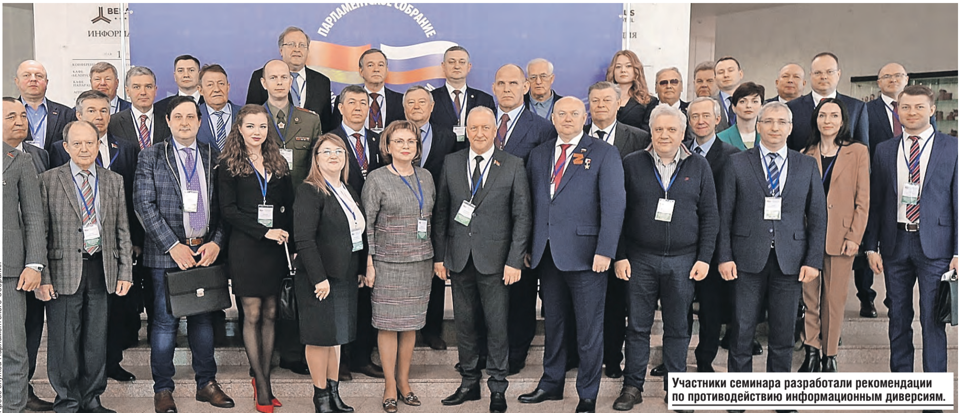
Участники семинара разработали рекомендации по противодействию информационным диверсиям.