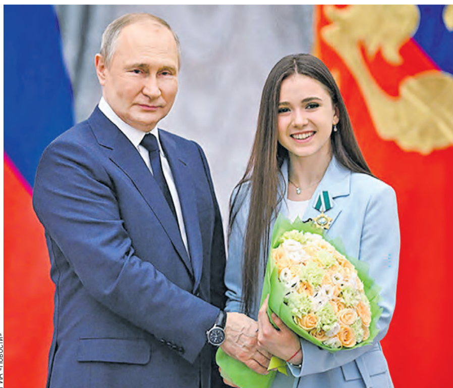
Владимир Путин встретился в Кремле с олимпийцами и паралимпийцами, вручил госнаграды. Особое внимание Президент России уделил Камиле Валиевой.

● Наши недруги форсировали изготовление нового «геополитического оружия» – сделали ставку на русофобию и неонацистов, бесцеремонно превращали соседнюю с нами Украину в «анти-Россию». Когда Россия благосклонно, по-братски отнеслась к созданию независимого украинского государства, исходили из того, что это будет именно дружеское государство. Но уж, конечно, на создание на исторических российских территориях «анти-России» никто не рассчитывал, да и допустить мы этого не можем. В конце концов подтолкнули Украину и к прямому столкновению с Россией. А украинскому народу уготовили судьбу «расходного материала». Я думаю, что осознание этого приходит к большей части народа Украины.