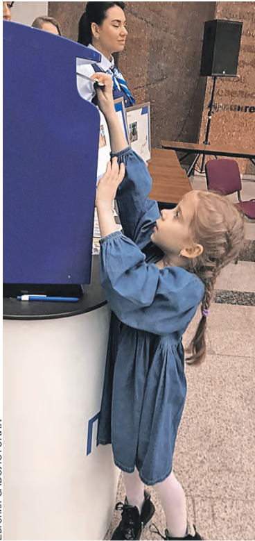
Малышка отправляет открытку родным.