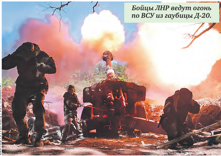
Бойцы ЛНР ведут огонь по ВСУ из гаубицы Д-20.

встретят уже не те войска мирного времени, которые до этого участвовали в СВО, а отлаженная, подготовленная, мощная группировка, готовая к выполнению задач уже стратегической операции.