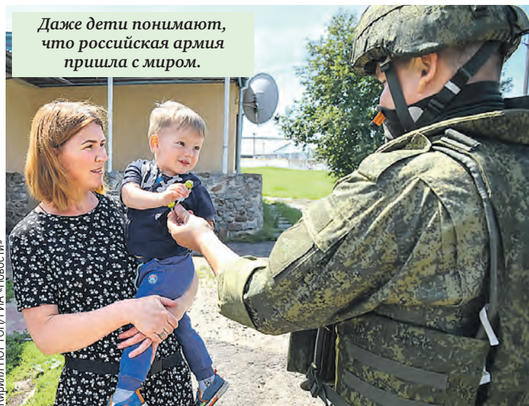
Даже дети понимают, что российская армия пришла с миром.

сией? И это в самом начале девяностых. Накачка началась уже тогда.