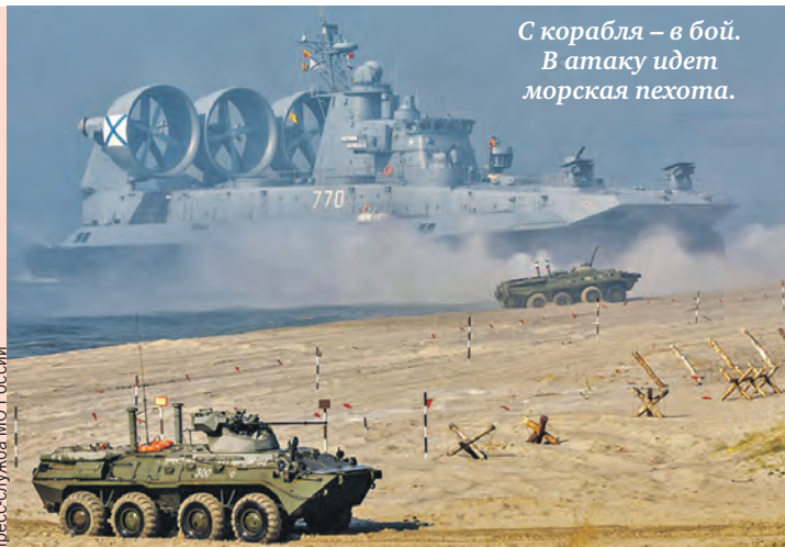
С корабля – в бой. В атаку идет морская пехота.

– Может сложиться такая обстановка, когда сил и средств региональной группировки будет недостаточно, чтобы гарантировать безопасность Союзного государства, и мы должны быть готовы к ее быстрому усиле-