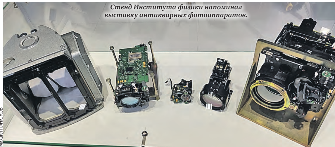
Стенд Института физики напоминал выставку антикварных фотоаппаратов.