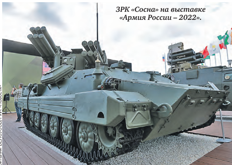
ЗРК «Сосна» на выставке «Армия России – 2022».

– Это глупое польское бахвальство известно на весь мир. У серьезных экспертов оно вызывает лишь насмешку. Белорусская армия – одна из сильнейших в Европе, несмотря на свою компактность. Она обладает самыми современными видами вооружений. Ее боевой потенциал сильно вырос после того, как усилили военно-техническую интеграцию с Россией. Почти все, что требуется Минску, Россия предоставляет. Ну разве что еще не поставили