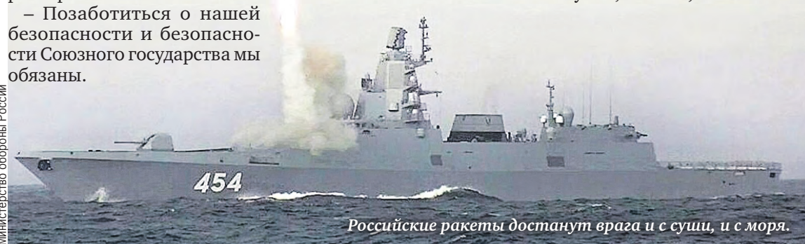
Российские ракеты достанут врага и с суши, и с моря.