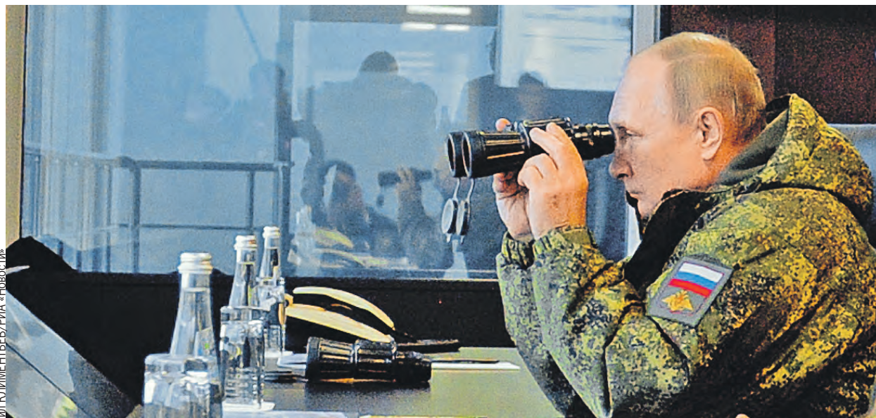
Наши главнокомандующие держат ситуацию под контролем и всегда на связи.