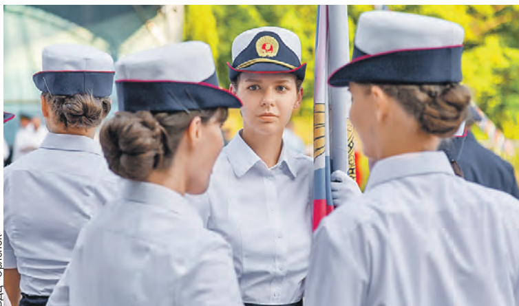
Девушки из пансиона Минобороны не уступают парням в каких-либо испытаниях.