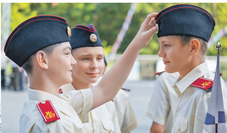
Кадеты тщательно следят за внешним видом.

Смена суворовских военных и кадетских училищ проходит ежегодно с 2007 года по инициативе Парламентского Собрания. С 2016-го ее принимает Всероссийский детский центр «Орленок». В 2022 году на нее из бюджета Союзного государства выделили 31,8 миллиона российских рублей. В смене участвовали 335 ребят и девчат.