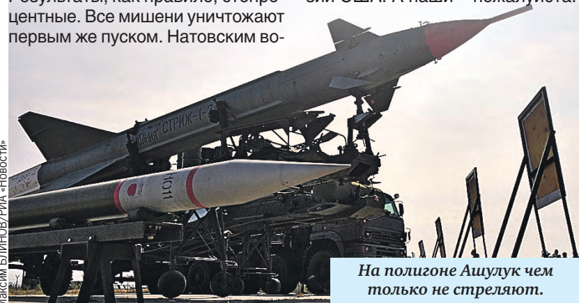
Максим БЕЛИНОВ/РИА «Новости»

Десантники вообще давно сроднились – по несколько совместных маневров каждый год. Задачи интересные, но дико сложные – для настоящих мужиков. Другие в десанте просто не приживаются. Попробуй-ка с полной выкладкой побегать по бескрайним полесским болотам или по песочку «Сахары» на полигоне под Брестом. Но это только цветочки. Российские и белорусские парни, которые служат «в продуваемых всеми ветрами войсках», не однажды доказывали, что способны выполнить боевую задачу в любых условиях обстановки, как говорят люди в погонах. Хоть на Северном полюсе. И не раз уже совершали совместное десантирование на ледяной купол Земли. Натовские военные на такой экстрим пока не отважились, даже хваленые «кричащие орлы» из 101-й дивизии США. А наши – пожалуйста.