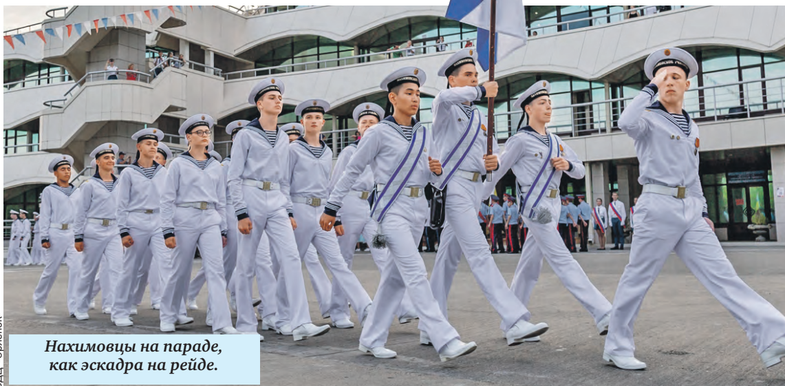
Нахимовцы на параде, как эскадра на рейде.