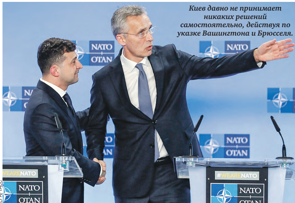
Киев давно не принимает никаких решений самостоятельно, действуя по указке Вашингтона и Брюсселя.

Мы наследники Советского Союза, где у Беларуси и России был весомый военно-промышленный потенциал и устойчивые хозяйственные связи между предприятиями. За годы независимости мы не только их не потеряли, но во многом даже укрепили. Москву и Минск связывают договоры о развитии военно-технического сотрудничества, в двух странах вместе проводят работы по модернизации