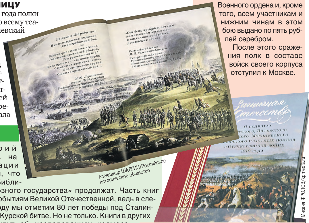
В издании собраны уникальные документы той эпохи.

Эти полки прошли всю войну 1812 года, сражались у Смоленска, Малоярославца и Тарутино, гнали французов через Березину, участвовали в заграничных походах русской армии, причем четыре из пяти в итоге браво промаршировали по Парижу.