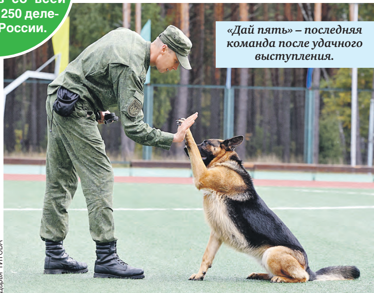
«Дай пять» – последняя команда после удачного выступления.

– Вы что, «Зубренок» не перестает радовать. Такую тренировку со служебными собаками видим впервые, – рассказывают ребята. – Как вернулись в прошлый раз домой, поставили себе цель снова попасть в лагерь, чтобы встретиться с нашими минскими братьями. Пришлось потрудиться, показать себя в школе, чтобы получить путевку. Смена супер, увидели товарищей, с которыми переписывались с прошлой осени. Уже побывали на экскурсии в Брестской крепости, Хатыни – было очень интересно. А День Союзного государства – наш любимый праздник.