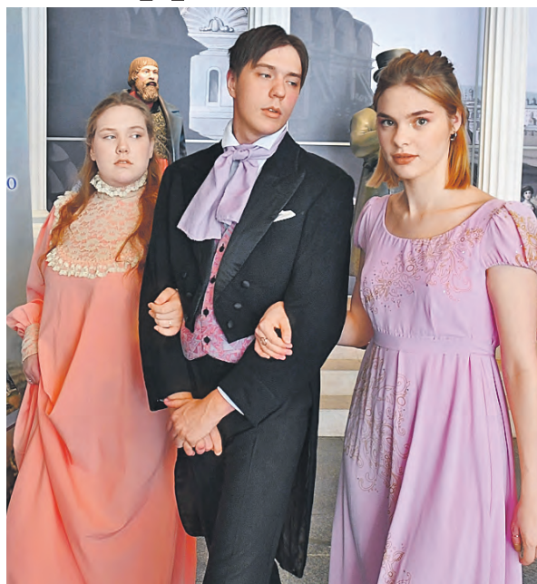
На презентации первого тома «Библиотеки Союзного государства» атмосфера была исторической.

В составе полков были представители разных народов. Рекрутская повинность, по которой главным образом осуществлялось пополнение армии, ложилась на плечи населения разных губерний. Количество солдат, в основном православного вероисповедания, которое должен был поставить регион, зависело от его численности населения. В войну 1812 года с 500 душ мужского