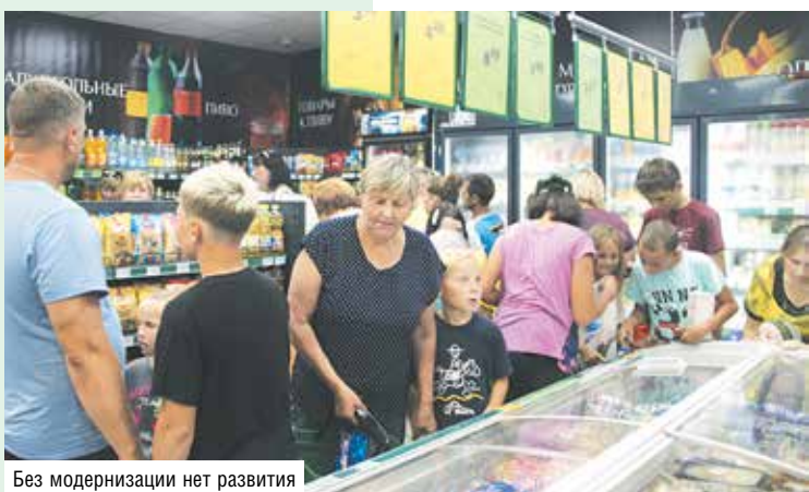
Без модернизации нет развития