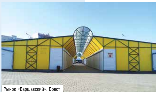
Рынок «Варшавский». Брест