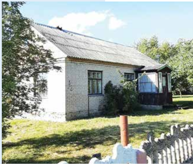
Жилой дом в агрогородке Остромичи Кобринского района