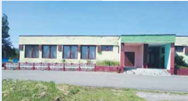
Здание столовой в агрогородке Русиновичи Ляховичского района