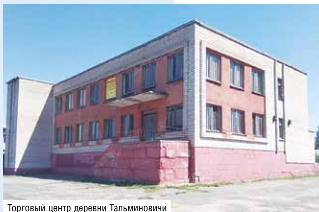
Торговый центр деревни Тальминовичи

Постановлением Правления Белкоопсоюза от 3 марта 2023 года № 71 утверждена новая редакция Рекомендаций по отчуждению имущества организациями потребительской кооперации, утвержденной постановлением Правления Белкоопсоюза от 30 августа 2019 года № 263. Обсудим основные новшества.