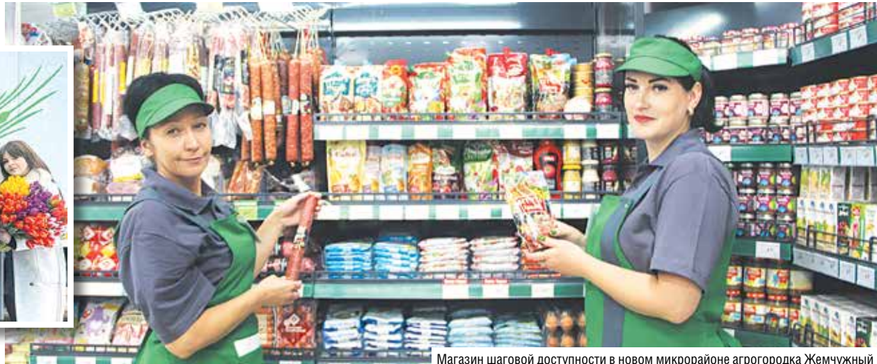
Магазин шаговой доступности в новом микрорайоне агрогородка Жемчужный