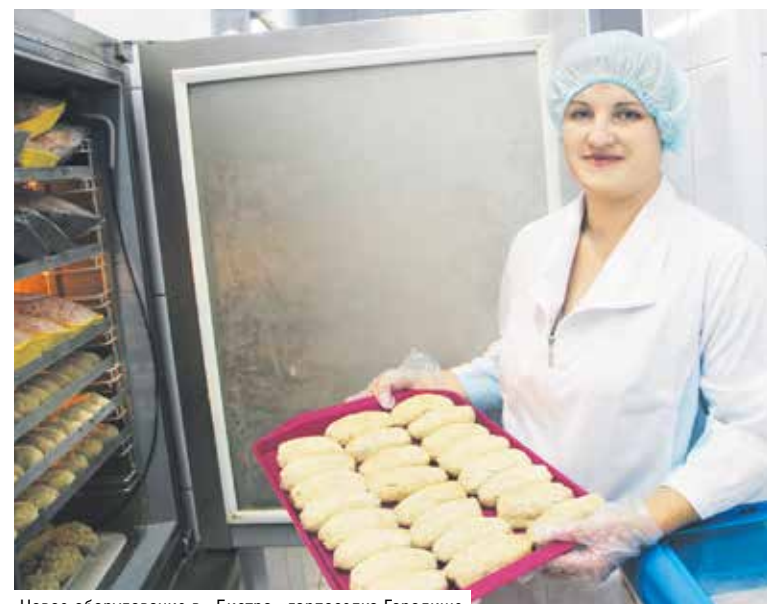
Новое оборудование в «Бистро» горпоселка Городище

Новое дыхание обрели горячий и холодный цеха «Бистро» в городском поселке Городище, где сделали ремонт и заменили оборудование. С появлением аппа-