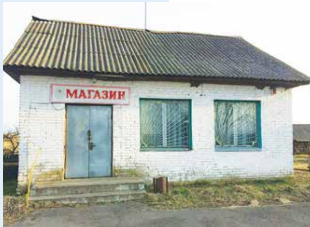
Магазин в деревне Пигасы Дрогичинского района