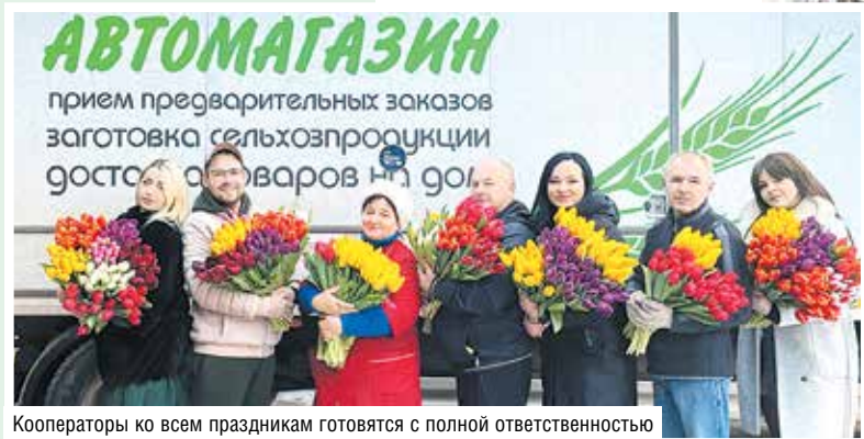
Кооператоры ко всем праздникам готовятся с полной ответственностью