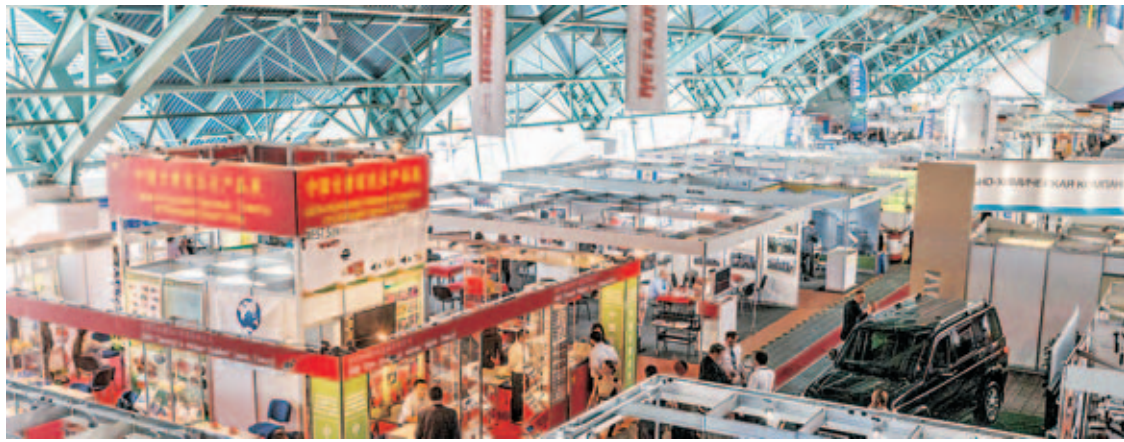
■ Панорама «Белагро-2015».

ликанский конкурс «Лучшая племенная корова молочной породы».