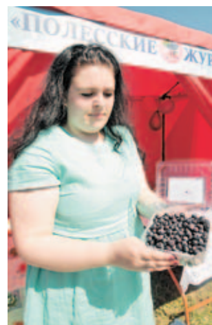
■ Продукция ОАО «Полесские журавинь».

Консервные предприятия Белкоопсоюза, кроме традиционной продукции из дикорастущего сырья, представили возможность продегустировать такие новые продукты, как ассорти белорусское, перец в томатной заливке, березовый сок без добавления сахара и лимонной кислоты и множество хлебобулочных изделий.