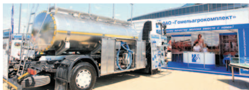
■ ОАО «Гомельагрокомплект» представил цистерну для транспортировки молока.

изделиям. Кроме традиционного российского, вышли на рынки Евросоюза и Китая.