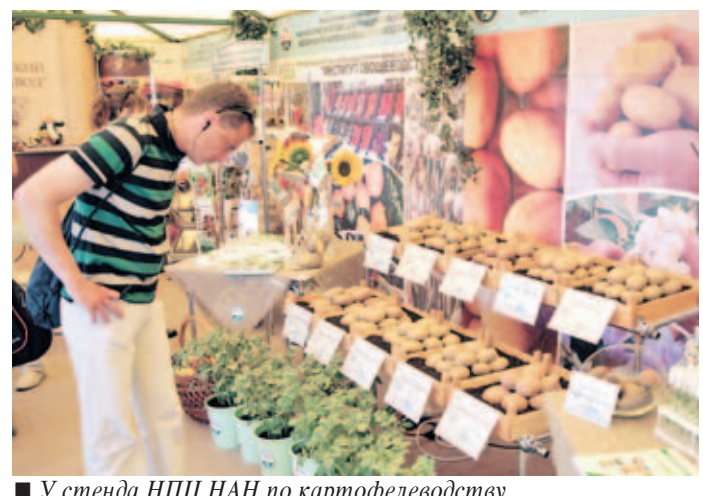
■ У стенда НПП НАН по картофелеводству и плодовоовощеводству.