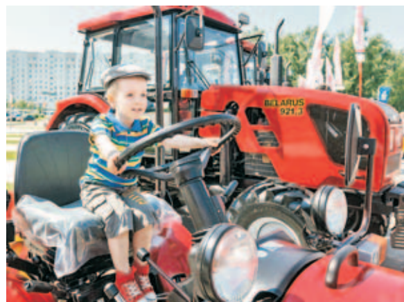
■ Белорусскую технику оценили будущие механизаторы.