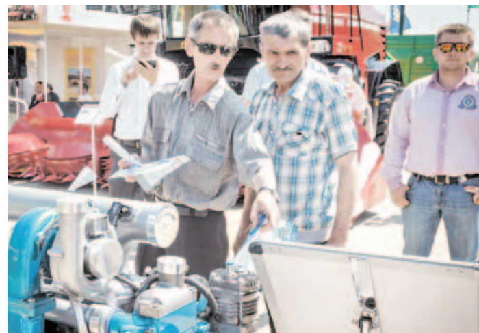
■ Посетители осматривают новый двигатель.

ют высокие урожаи: выпущена опытная партия машин «КЗС-16» с роторным обмолотом, которым не страшны самые тяжелые урожаи хлеба. После освоения серийного производства появится возможность отказаться от закупок импортных комбайнов, считает на-