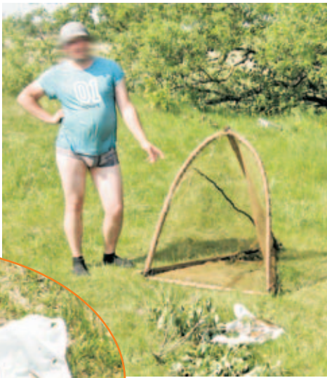
■ Житель Кличева нелегально рыбачил самодельной сетевой ловушкой-топтухой на реке Ольсе.