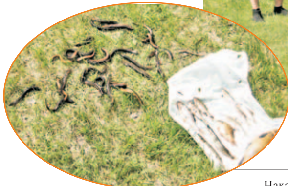
■ Незаконный улов кличевлянина — 39 особей различных видов рыб, в том числе 27 вьюнов.

300 метров сетей и лодку. Те даже не пытались выкручиваться: как будешь спорить, если есть документальный фильм об особенностях твоей горе-рыбалки в нерестовый период.