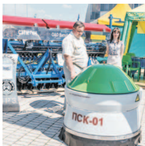
■ Продукция ОАО «Гроднопромтехника».