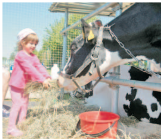
■ Стенд племпредприятий Беларуси.