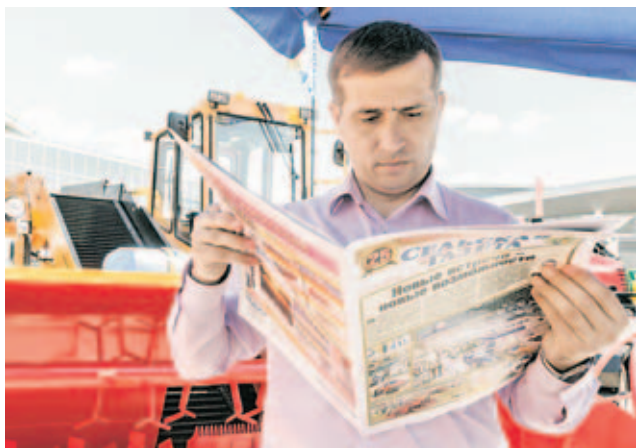
■ «Сельская газета» издала к выставке специальный 32-страничный рекламно-информационный выпуск, который имеет успех.

Кооператоры показали посетителям 300 видов товаров.