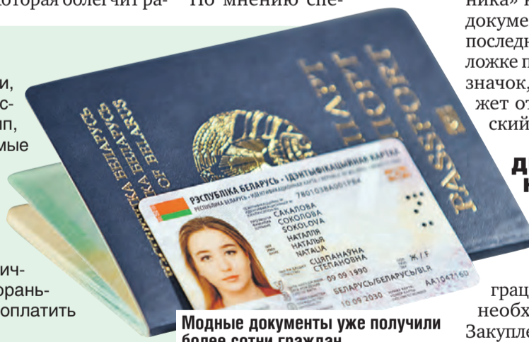
Модные документы уже получили более сотни граждан.

На изготовление новых удостоверений личности уйдет до 15 рабочих дней. Хотите пораньше? Нет проблем! За скорость придется доплатить 800 рос. рублей.