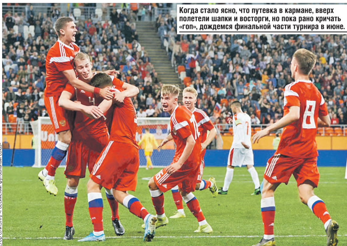
Когда стало ясно, что путевка в кармане, вверх полетели шапки и восторги, но пока рано кричать «Гоп!», дождемся финальной части турнира в июне.

На чемпионат Европы-2008 российская первая команда прошмыгнула лишь благодаря хорватам, сенсационно обыгравшим англичан. Теперь та история в какой-то мере повторилась уже на уровне молодежи. Руку помощи протянули сербы. Потеряв даже теоретические шансы пробиться на Евро, они сенсационно грохнули главных соперников России поляков. После чего судьба первого ме-