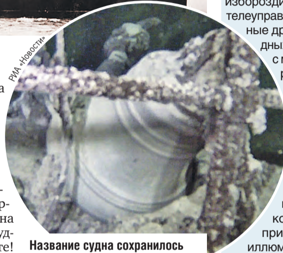
РМН, Новости Название судна сохранилось только на рынде, бортовую надпись разъела морская соль.

Бомба угодила в носовую часть судна, разворотив мостик. «Армения» потеряла ход и стремительно стала погружаться, зарываясь в волну. У людей, находившихся в трюме и на нижних палубах, шансов не было. Сколько человек вообще спаслось — загадка. После войны выживших очевидцев катастрофы специально никто не разыскивал. Сама тема «Армении» была табу — слишком неудобная для флотского ко-