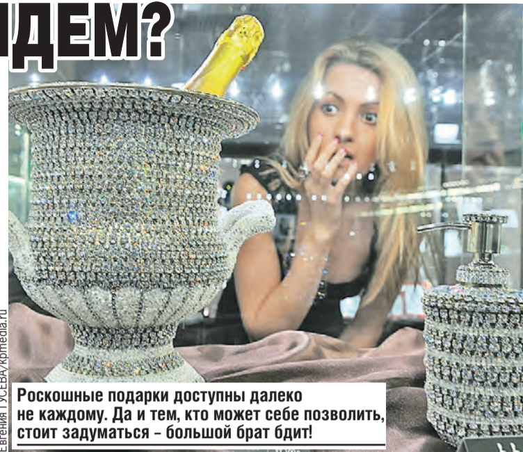
Роскошные подарки доступны далеко не каждому. Да и тем, кто может себе позволить, стоит задуматься – большой брат бдит!

Если вдруг налоговая или другие органы заблокируют его, тогда предприниматель сможет переключиться на запасной счет. Обычно таким ресурсом пользуются те, кто обналчивает деньги. Они специально заводят десятки счетов в разных местах. Если движений по депозиту нет, банки обязаны прекратить брать деньги за обслужива-