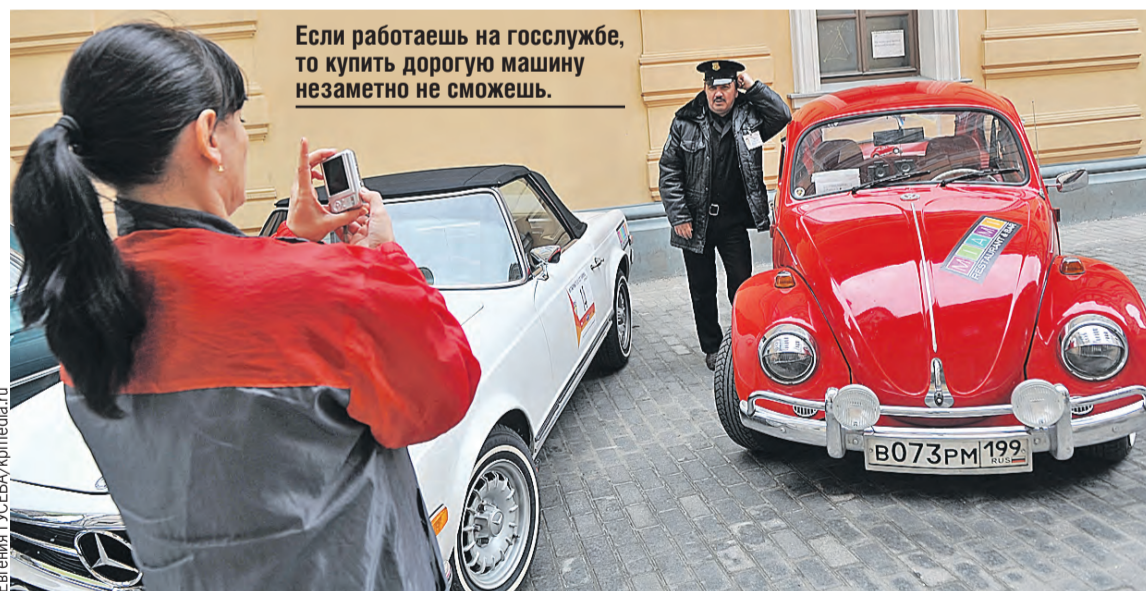
Если работаешь на госслужбе, то купить дорогую машину незаметно не сможешь.

Правда, в международной практике есть несколько методик, которые активно применяются. Как вариант – создается специальный банк забытых вкладов. Например, тех, по которым клиента найти не удалось в течение пяти и более лет. Все деньги сразу перечисляются в бюджет. Но если вдруг находится сам вкладчик или его наследники, то ему возвращается полная сумма.