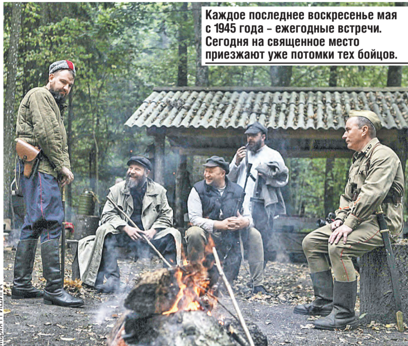
Каждое последнее воскресенье мая с 1945 года – ежегодные встречи. Сегодня на священное место приезжают уже потомки тех бойцов.

А скрывать от врага было что. Посреди леса партизаны построили целый город со штабом, обкомом партии, лесной школой, санчастью, семейным лагерем и редакцией газеты «Заря».