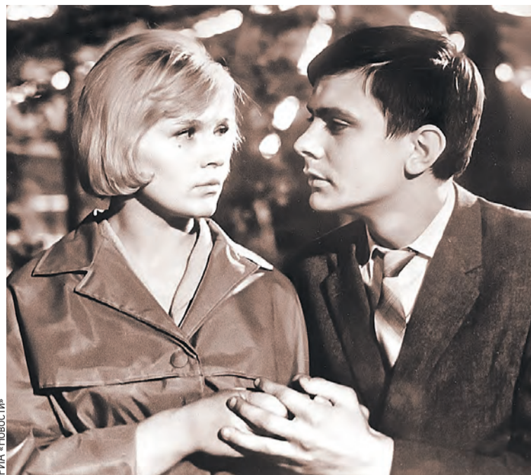
На съемках «Я шагаю по Москве» будущему режиссеру было всего восемнадцать, но сыграть драматичную роль юный возраст не помешал.

– Перенес несколько операций, но, к сожалению, играть не смог, – рассказывает актер. – Никита ждал меня некоторое время. Потом стало понятно, надо лечиться дальше, он позвонил мне в Прагу. Говорил, что пробовал разных артистов. А я ему сказал: «Играй только сам». Он так и сделал.