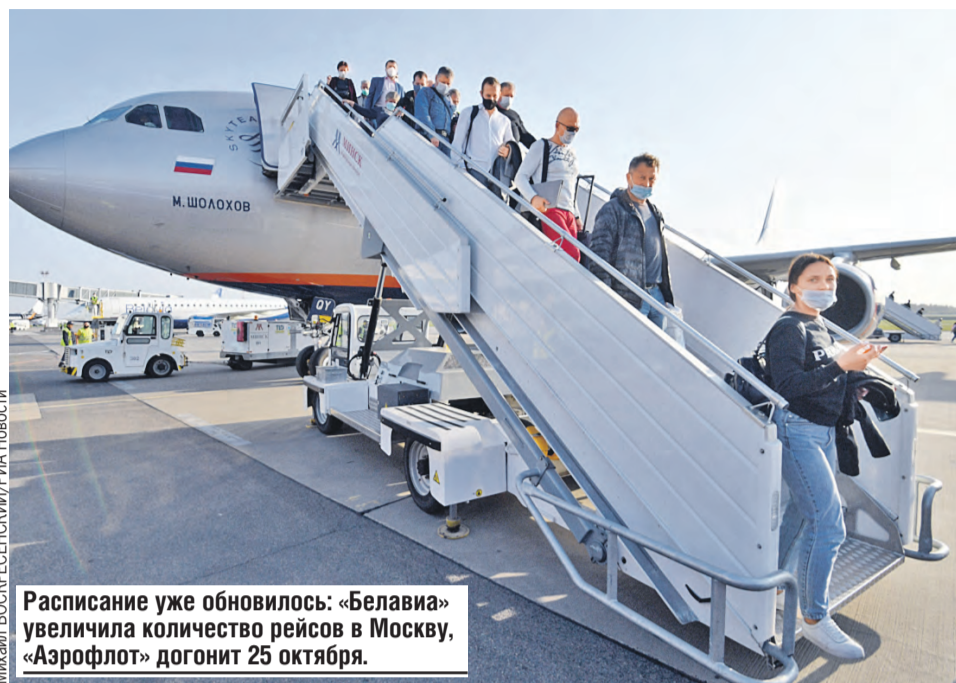
Расписание уже обновилось: «Белавиа» увеличила количество рейсов в Москву, «Аэрофлот» догонит 25 октября.