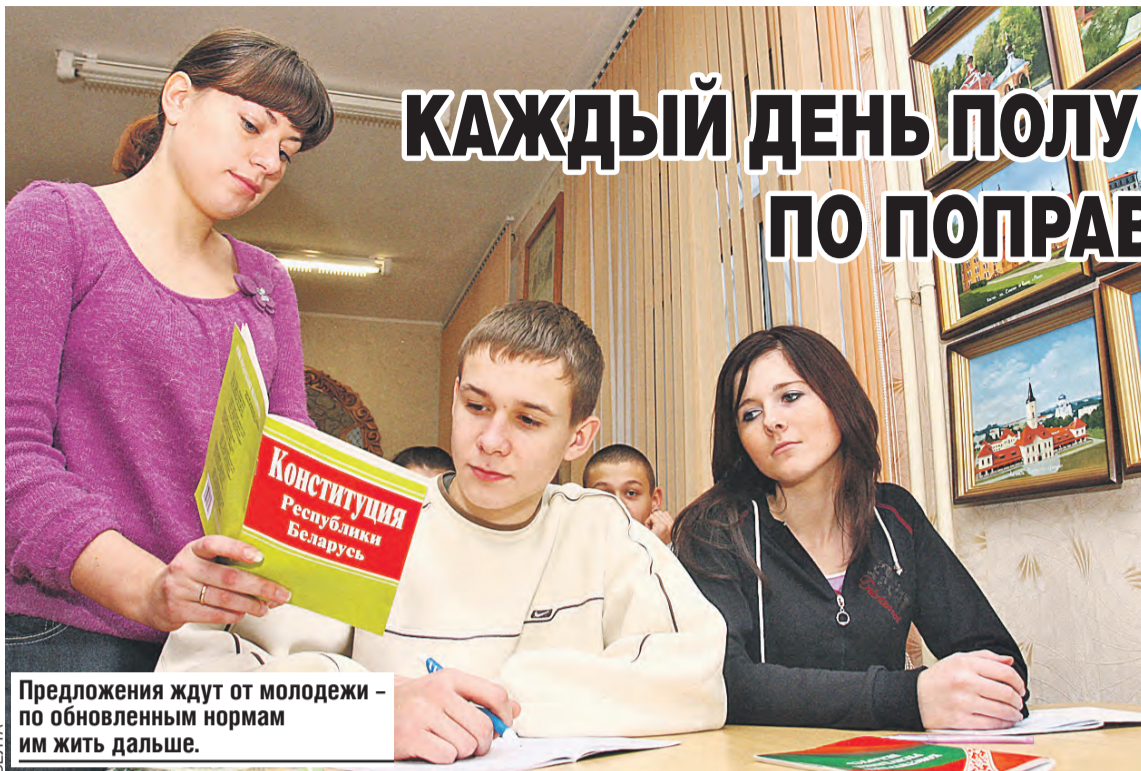
Предложения ждут от молодежи – по обновленным нормам им жить дальше.