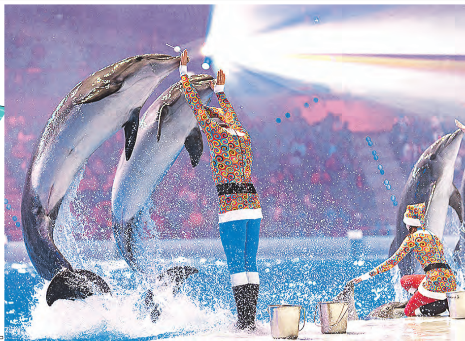
Вместо оленей у Санты помощники – дельфины.

Мощный свет и звук, невероятные иллюзии и могущественные маги – вместе с ними можно будет совершить полет на огромной биомашине, перенестись во времени