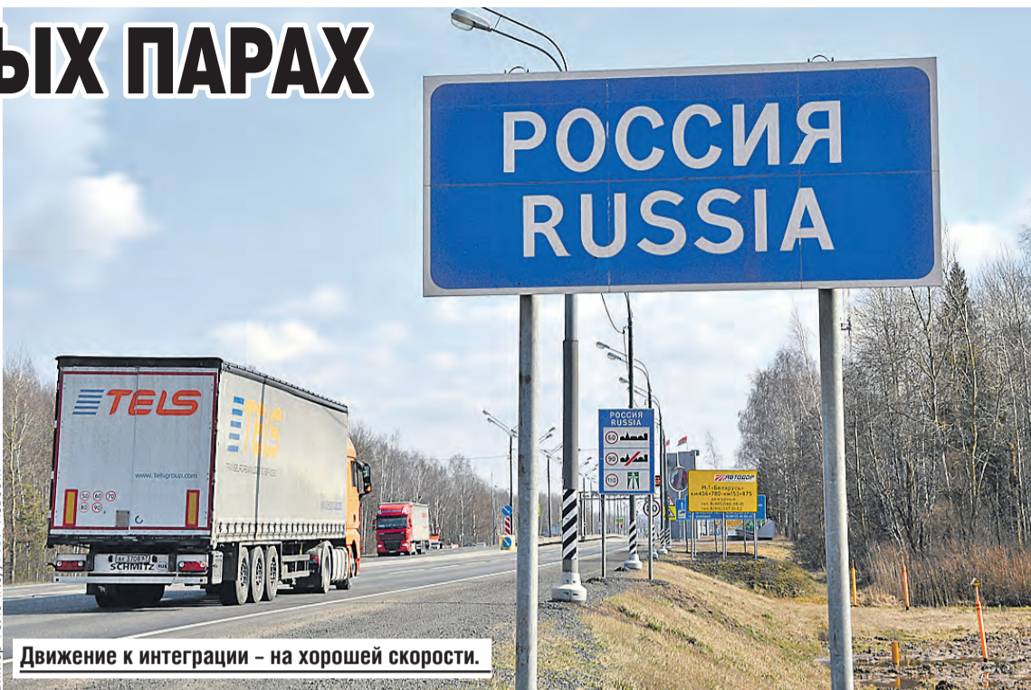
Движение к интеграции – на хорошей скорости.

Усиление интеграции помогло нарастить торговлю и в целом смягчить экономический спад и последствия санкций. Динамика ВВП Союзного государства оказалась существенно лучше прогнозов МВФ и Всемирного банка. ВВП Беларуси сократился на 4,7 процента по итогам 11 месяцев, у нас оценка по итогам десяти – сокращение на 1,9 процента.