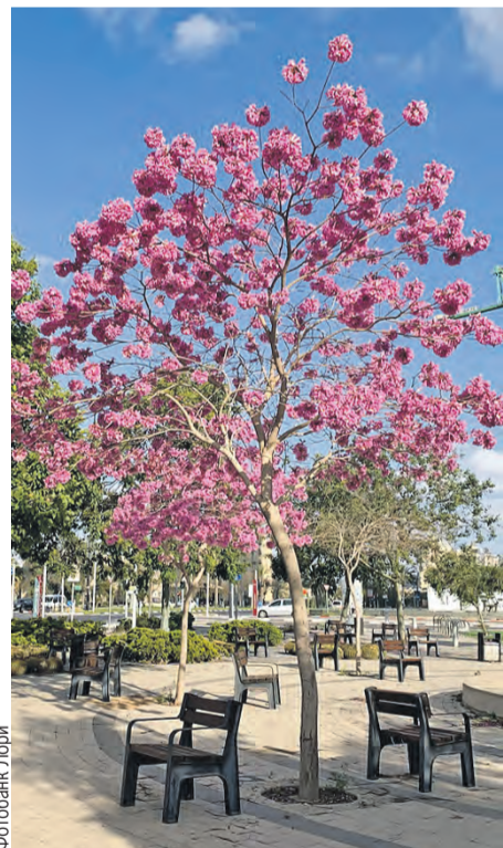
Та самая азиатская красавица – родственница сакуры.

В Союзном государстве выстроили четкую систему поддержки молодежного инновационного предпринимательства. В БНТУ развивают научно-технологический парк «Политехник», где воплощают в жизнь перспективные стартапы. Уже запатентованы десятки изобретений: разработки в области травматологии и ортопедии, сосудистой и кардиохирургии, протезирования.