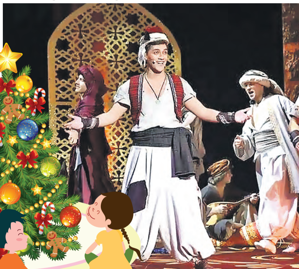
Восточный волшебник – тоже спец по чудесам.

или сотворить настоящее чудо своими руками.