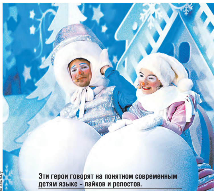
Эти герои говорят на понятном современным детям языке – лайков и репостов.

На манеже Белгосцирка закружится зимняя сказка, наполненная неповторимым колоритом и захватываю-