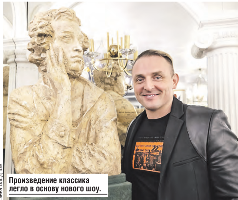
Произведение классика легло в основу нового шоу.

— Наверное, уже нет. Они понимают, что такое праздник и что такое реальность. И про себя не могу сказать, что не верю в Деда Мороза. Я хочу верить. У меня все рационально, но в то же время я романтик.