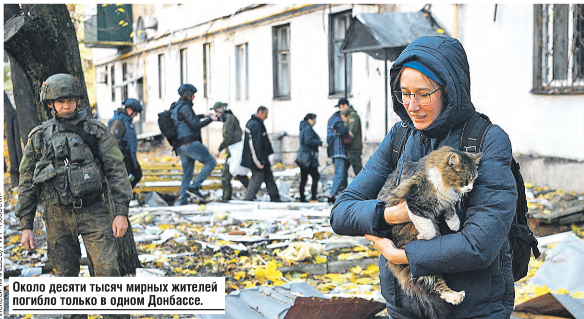
Около десяти тысяч мирных жителей погибло только в одном Донбассе.