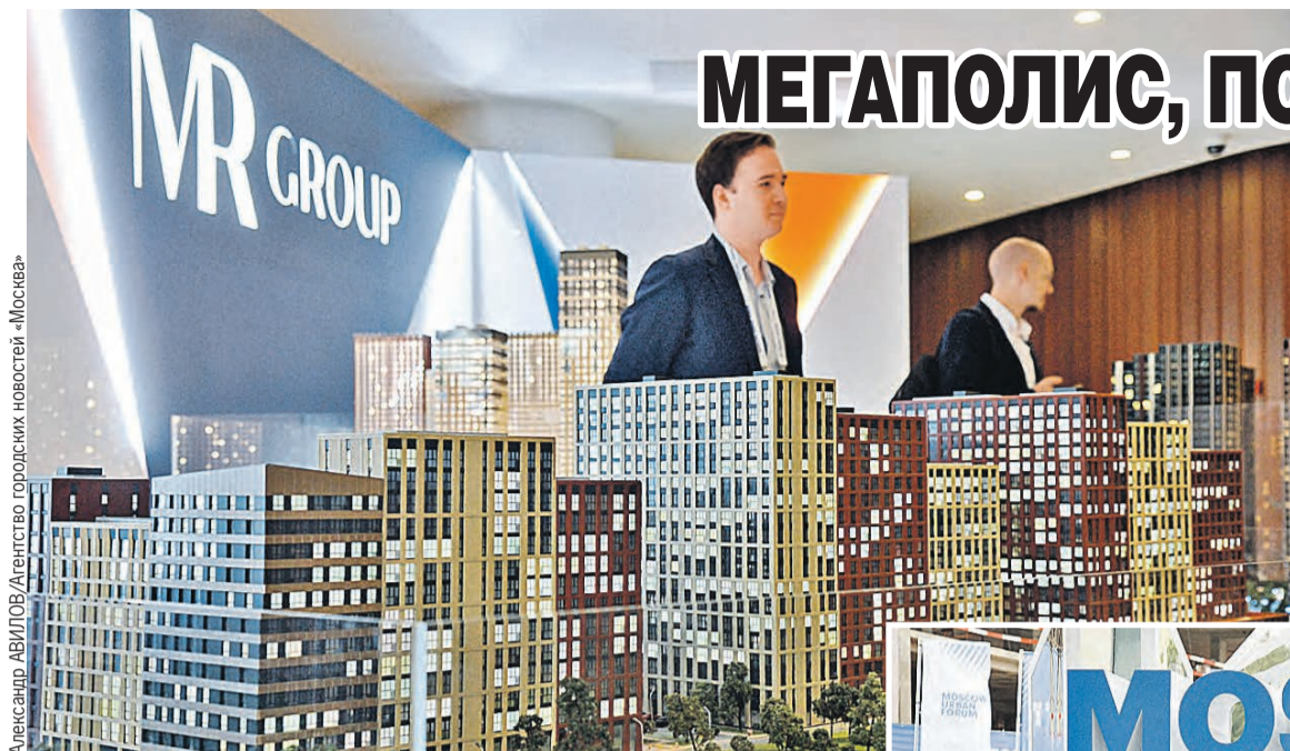
Мало построить новые кварталы, надо еще сделать их уютными.