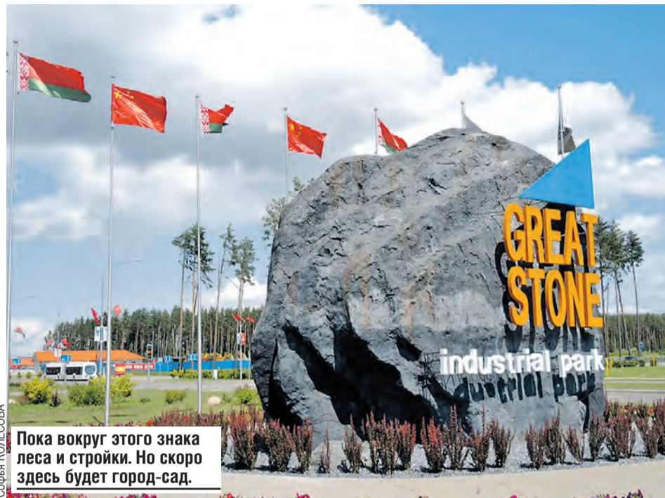
Пока вокруг этого знака леса и стройки. Но скоро здесь будет город-сад.