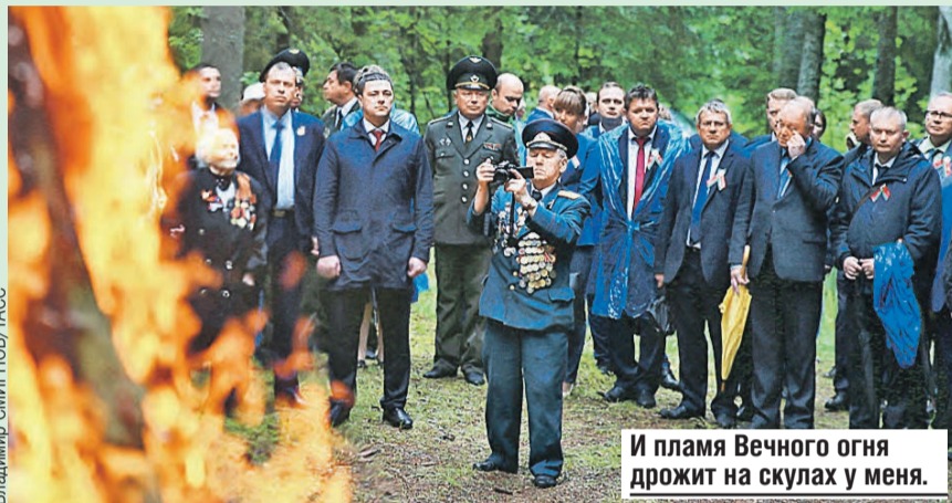
И пламя Вечного огня дрожит на скулах у меня.

До самого вечера у костра дружбы звучали партизанские песни, в том числе и знаменитая «Смуглянка».