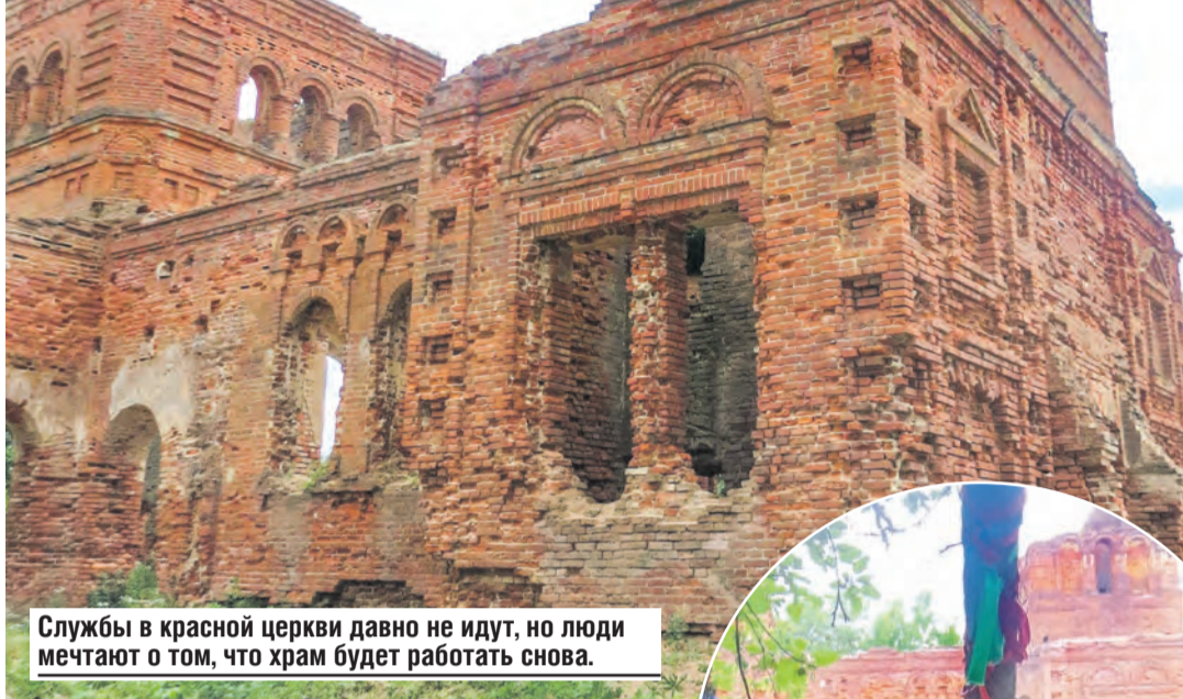
Службы в красной церкви давно не идут, но люди мечтают о том, что храм будет работать снова.

всерьез занялся изучением его «биографии». Сведения искал повсюду в архивах. Тщетно. Оказалось, что храм в Шарипах не внесен даже в энциклопедию, где собрана информация обо всех православных святынях страны – существующих и утраченных. То есть когда он был возведен – до сих пор загадка. Похоже, что вообще строился без благословения. Единственное место, где могли бы пролить свет на его возникновение, – архив Святейшего правительствующего синода в Санкт-Петербурге. Но чтобы отправиться туда, поднять и изучить документы, нужно немало времени и денег.