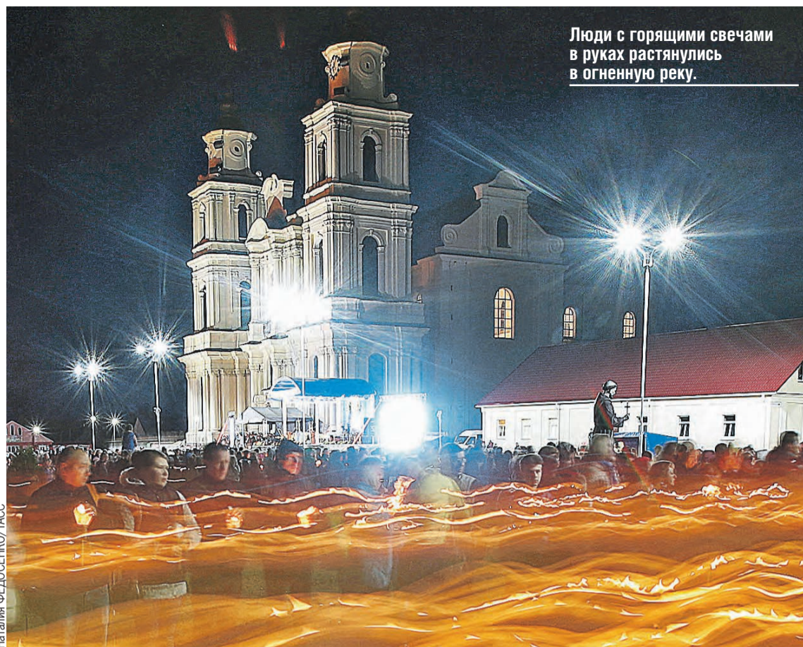
Люди с горящими свечами в руках растянулись в огненную реку.

– Мы молимся за вас и очень рады, что вы нашли силы приехать в Будслав. Вы дарите нам «витамины» духовные, примите от нас витамины