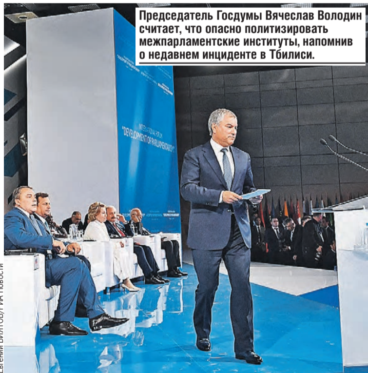
Председатель Госдумы Вячеслав Володин считает, что опасно политизировать межпарламентские институты, напомнив о недавнем инциденте в Тбилиси.