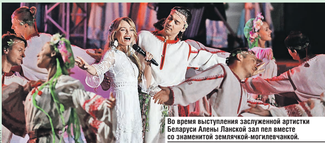
Во время выступления заслуженной артистки Беларуси Алены Ланской зал пел вместе со знаменитой землячкой-могилевчанкой.

Многие из тех, кто был здесь впервые, наверняка загадали желание вернуться снова. Неудивительно – Александрия не отпускает. Александрия собирает друзей.