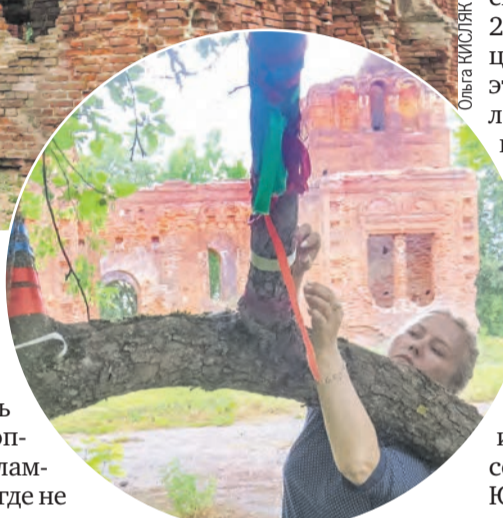
На дерево желаний у красной церкви туристы вешают ленты, прося о самом сокровенном.