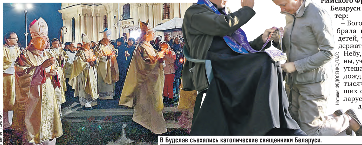
В Будслав съехались католические священники Беларуси.

Говорят, из такого паломничества человек никогда не возвращается прежним.