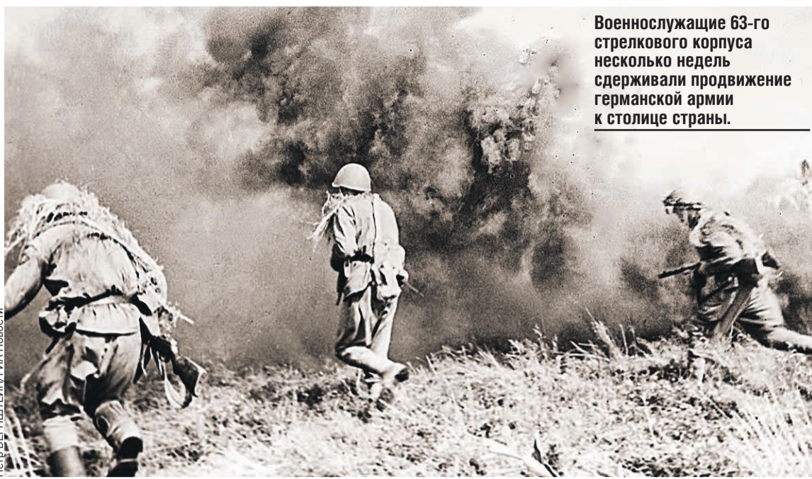
Военнослужащие 63-го стрелкового корпуса несколько недель сдерживали продвижение германской армии к столице страны.