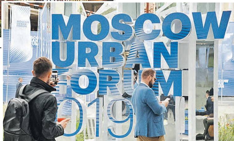
Деловая программа соседствовала с фестивальной: после дискуссий можно было прогуляться по «Зарядью» или послушать рассказы о городах и людях.