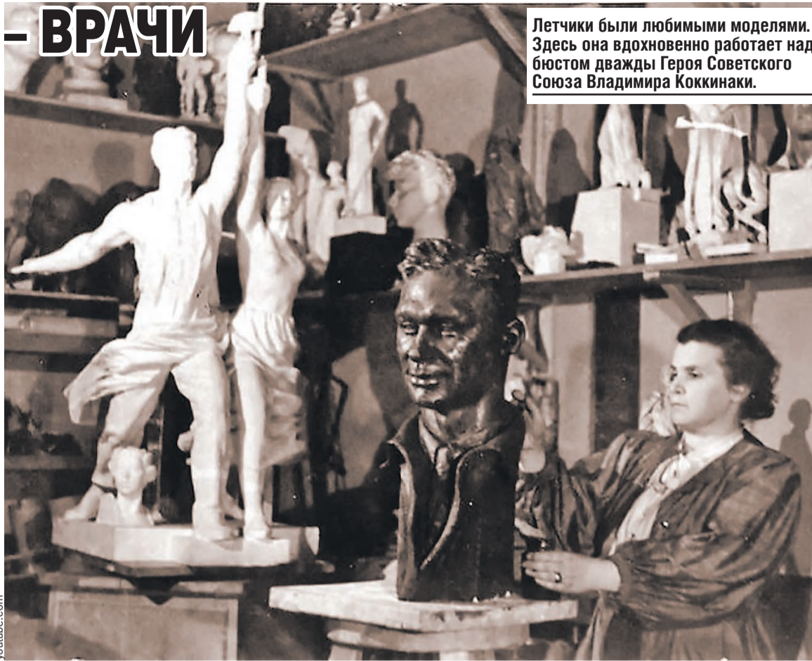
Летчики были любимыми моделями. Здесь она вдохновенно работает над бюстом дважды Героя Советского Союза Владимира Коккинаки.

Травма не помешала Мухиной выйти замуж. По любви и счастливо. Будущего супруга