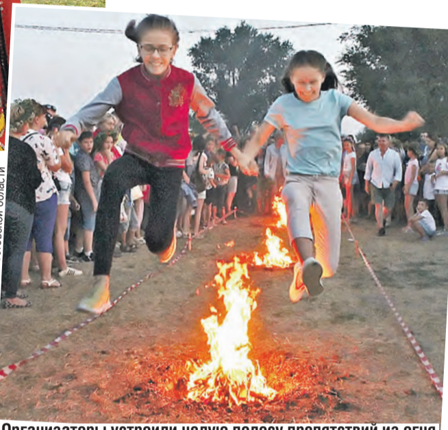
Организаторы устроили целую полосу препятствий из огня.

– Просто замечательный праздник – настоящий фестиваль всей славянской культуры, – поделилась депутат Госдумы России Лариса Тутова. – Это повод вспомнить нам всем свои славянские корни и исторические традиции, а также посмотреть необыкновенно яркие выступления национальных коллективов. Хотя мы и не делаем акцент именно на славянском происхождении праздника, поскольку все живем дружной многонациональной семьей.