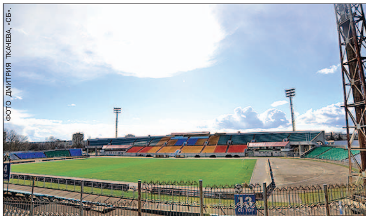
ФОТО ДМИТРИЯ ТКАЧЕВА, «СБ»

Впрочем, всех потребностей столичного футбола 3-тысячный «Камвольщик» не способен удовлетворить по определению. Да и сборная на нем «не поместится». Поэтому даже во время открытия, высокие гости нет-нет да и вспоминали о национальном стадионе. Планы по возведению которого теснейшим образом связаны с судьбой основной на сегодняшний день футбольной арены столицы — «Трактором». Проект реконструкции этого стадиона существует уже не один год, преобразившись за это время до неузнаваемости. Начав свой путь с идеи Владимира Романова о преобразовании «Трактора» в центр культурной и спортивной жизни города и пройдя несколько будораживших умы и чувства болельщиков трансформаций, идея перетекала в завершившийся накануне футбольно-строительный тендер. Участие в нем решили принять 9 компаний, результаты обещают объявить в конце мая. Если все сложится удачно, то к сентябрю 2018 года в белорусской столице должна будет появиться современная арена на 30 тысяч мест. Однако главной ареной запланированного уже на нынешнее лето чемпионата Европы среди девушек до 17 лет станет находящийся одной ногой на стройплощадке «Трактор». Да и на внутреннем уровне стадион не собирается на пенсию: проводящему здесь домашние матчи минскому «Динамо» переезжать просто некуда. Результа-