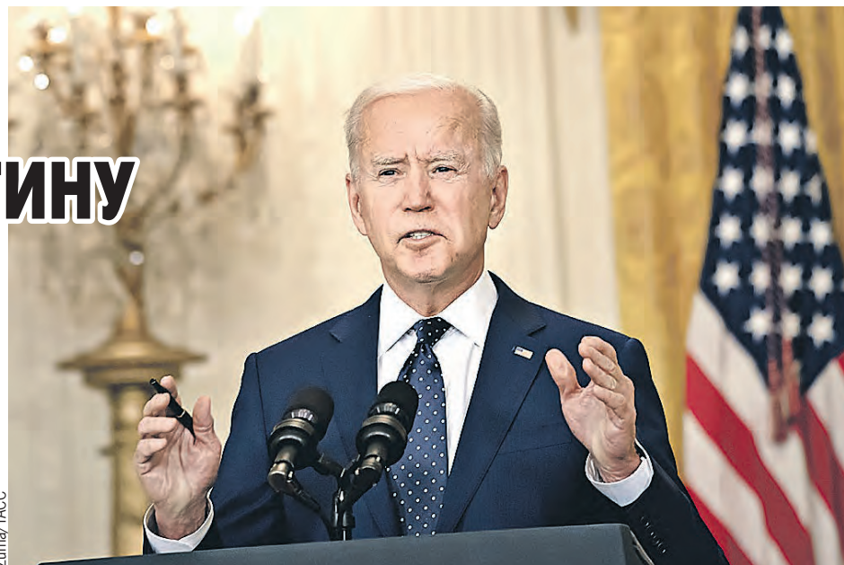
Союзные депутаты уверены: Джо Байден за счет России решает проблемы Штатов. А следующие запреты могут затронуть российскую промышленность и топливно-энергетический комплекс.

Видя, что экономика развивается даже в ситуации с пандемией, предполагаю, что удары будут направлены на нашу промышленность, топливно-энергети-