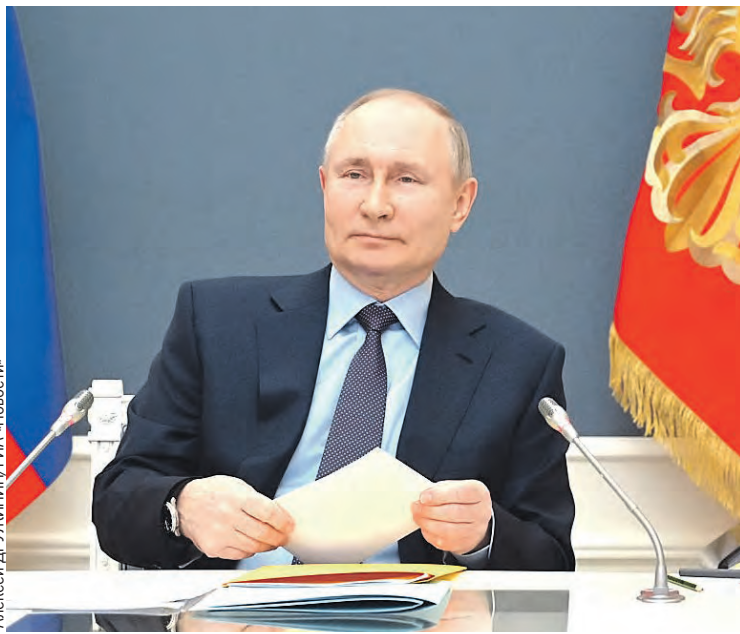
Президент напомнил американскому коллеге, что путь к политическому урегулированию в Украине лежит через минские договоренности.

Владимир Путин в ответ изложил своему собеседнику «базирующиеся на минском комплексе мер» подходы к политическому урегулированию в Украине.