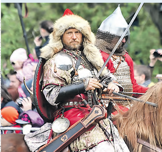
По преданию, из оврага вдруг появились... степные всадники.

По легенде, именно в Коломенском произошла знаменитая битва Георгия Победоносца, покровителя Москвы, со змием. Овраг появился там, где чудовище ударило хвостом. Коня святого Георгия разорвало пополам, и обе его части превратились в камни. В Голосовом овраге их два – Гусь-камень и Девий камень. Первый помогает мужчинам, второй – женщинам. Говорят, достаточно просто посидеть, и сбудутся желания, а болезни отступят.