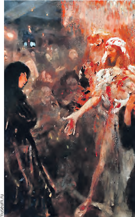
«Неверие Фомы» художник перерисовывал несколько раз.