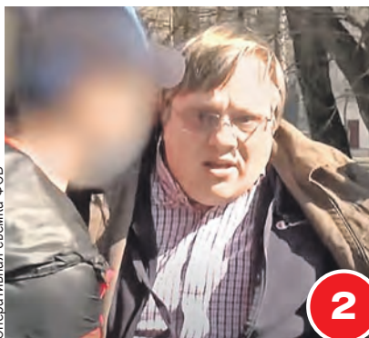
Оперативная съемка ФСБ

Спецслужбы сорвали государственный переворот в Беларуси