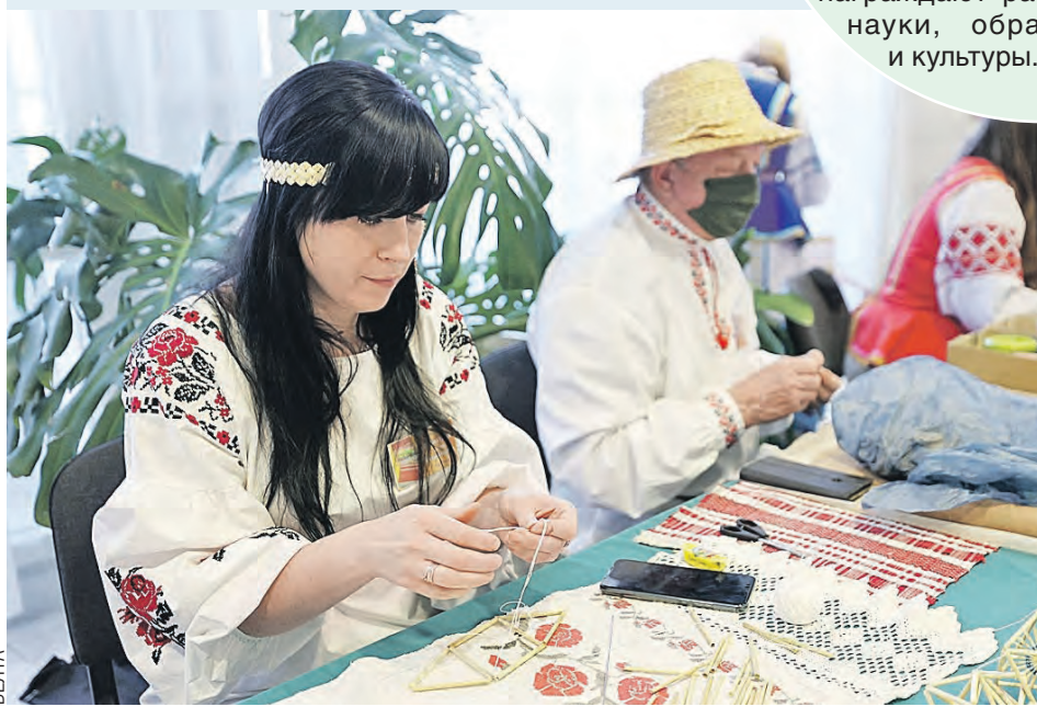
В этом году звание Центра культур у Борисова. Познакомиться с мастерицами дистанционно смогли и в Москве.

– Сегодня надо активнее работать с юношеством. И со стороны нашей автономии, и в Беларуси. Последние события показали, очень многое упущено. Нужно проводить совместные мероприятия, поддерживать связь с белорусской молодежью, со студенчеством. Семья, которое засеяли в молодую голову, быстро всходит. Как плохое, так и хорошее. А хотелось бы, чтобы хорошего оказалось больше.