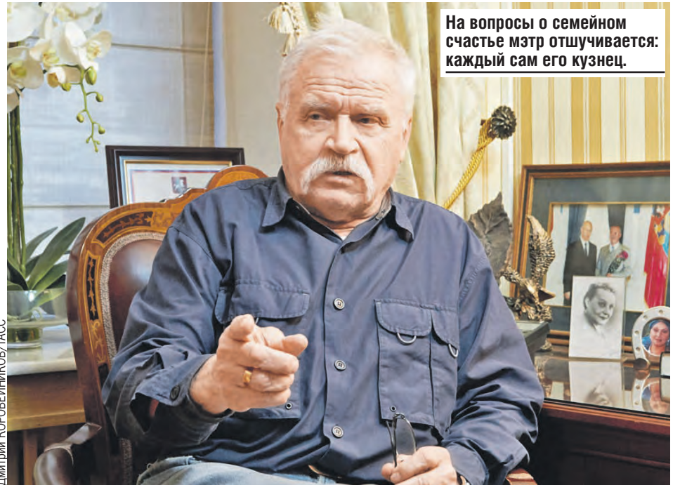
На вопросы о семейном счастье мэтр отшучивается: каждый сам его кузнец.

Он не только актер, но и режиссер. Ставил несколько отрывков, еще обучаясь в институте. А когда был распределен на киностудию «Мосфильм», то понял, что актерская профессия ненадежная.