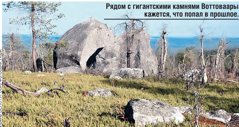
Рядом с гигантскими камнями Воттоваары кажется, что попал в прошлое.

В почве Медведицкой грядки совсем нет микроорганизмов. Зато археологи нашли захоронения двухметровых людей.