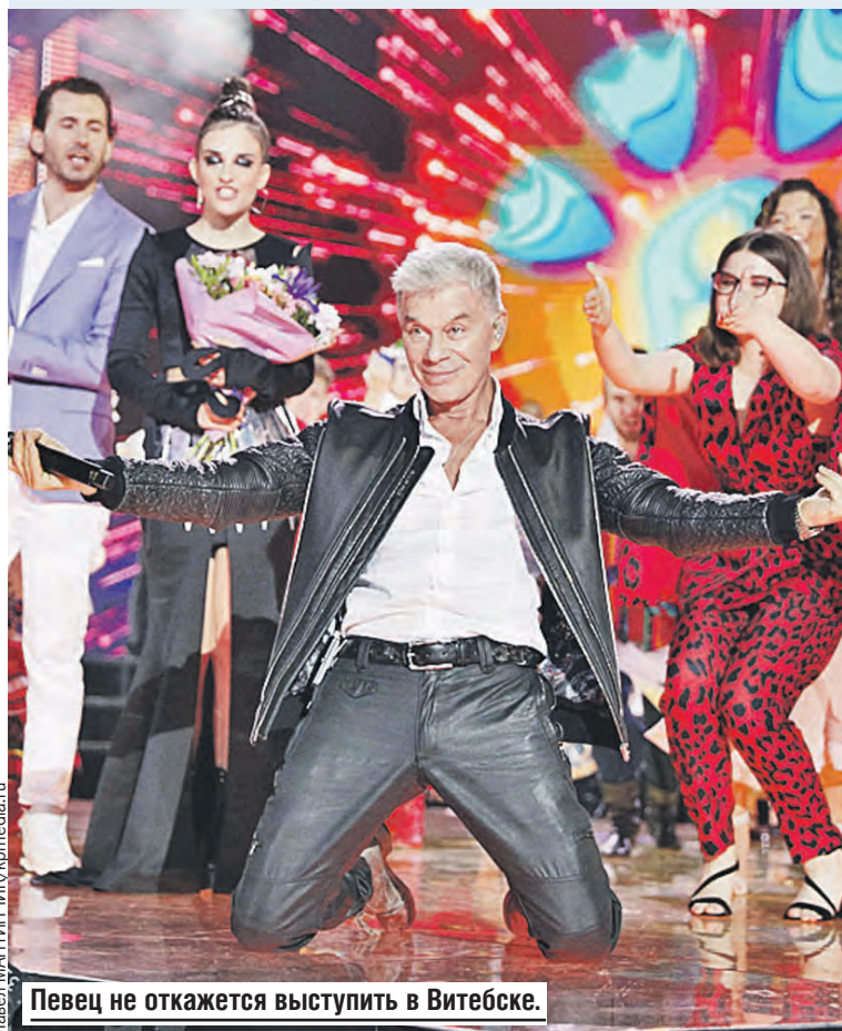
Певец не откажется выступить в Витебске.

Николай Басков и Димаш Кудайберген – постоянные участники фестиваля.