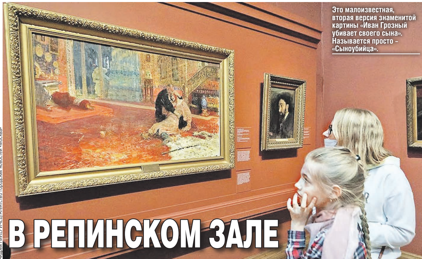
Андрей НИКЕРИЧЕВ/Агентство городских новостей «Москва»

В основном они – «неизвестные», как называют их сотрудники Третьяковки. Относятся к «пенатскому» периоду творчества Репина. Много портретов. Художник любил их писать и не повторялся в технике исполнения. Картины не выставляли в 2019 году.