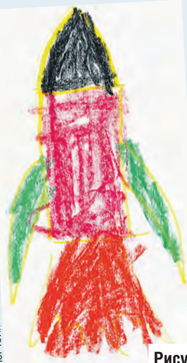
Рисунок для папы.

что ваш дедушка хотел стать космонавтом. Естественно, его не приняли, но он попытался хотя бы». И каково было наше удивление, когда спустя месяц он без проблем прошел всех врачей. Однако впереди было самое главное. Межведомственную госкомиссию, утверждавшую кандидатов, назначили на 11 октября. А 12 октября мужу исполнилось 35 лет – порог для допуска в отряд космонавтов. Я не люблю слово «последний», говорю всегда «крайний», но здесь был именно последний вагон уходящего поезда, в который надо заскочить. Возраст мог стать формальной причиной для отказа. Однако так удачно все сложилось – его утвердили. С тех пор мы всегда говорим, что надо использовать любую возможность, которую тебе предоставляет жизнь. Ничего случайного не бывает. Надо все пробовать. Надо пытаться. И тогда твоя мечта может осуществиться.