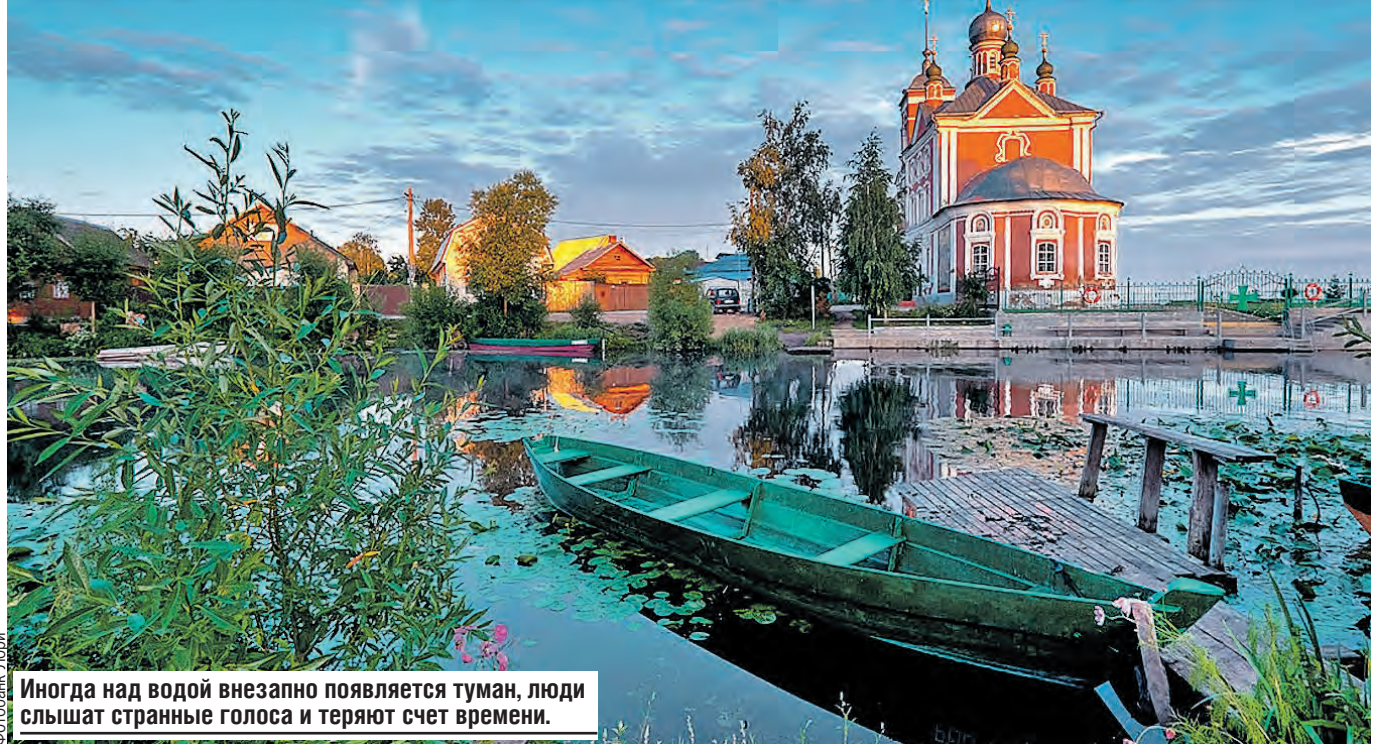
Иногда над водой внезапно появляется туман, люди слышат странные голоса и теряют счет времени.