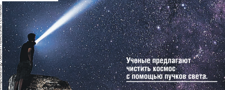
Ученые предлагают чистить космос с помощью пучков света.

– Петаватт – это сколько? Электрический чайник – примерно киловатт.