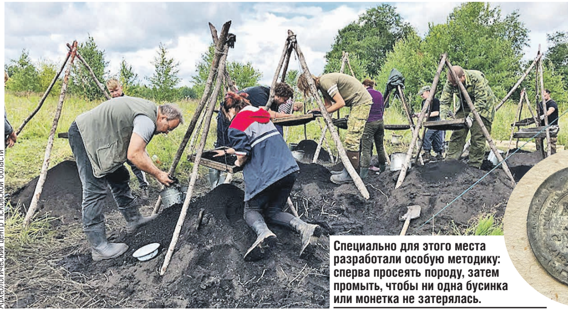
Специально для этого места разработали особую методику: сперва просеять породу, затем промывать, чтобы ни одна бусинка или монетка не затерялась.

Исследовать этот удивительный памятник, признаются археологи, можно еще долго. Огромная площадь поселения и множество неразрешенных вопросов подталкивают к дальнейшей работе. А потому в следующем году планируют вернуться на раскоп в Новоскольничском районе и вновь собрать помощников-добровольцев.