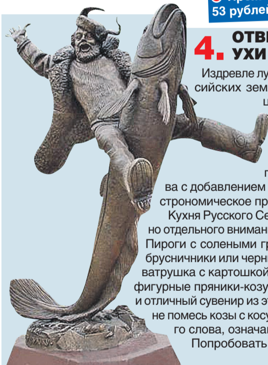
Веселый памятник архангельскому мужику тоже говорит о том, что это рыбный край. Прототипом оседлавшего налима персонажа стал герой сказок Степана Писахова – Сеня Малина.

Попробовать все и сразу можно на ежегодном фестивале блюд северной кухни «Помор-Этнофуд», который проводят в Архангельске в начале лета.