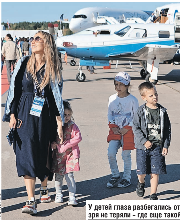
У детей глаза разбегались от обилия техники. А девушки времени зря не теряли – где еще такой фон для фото найдешь?!