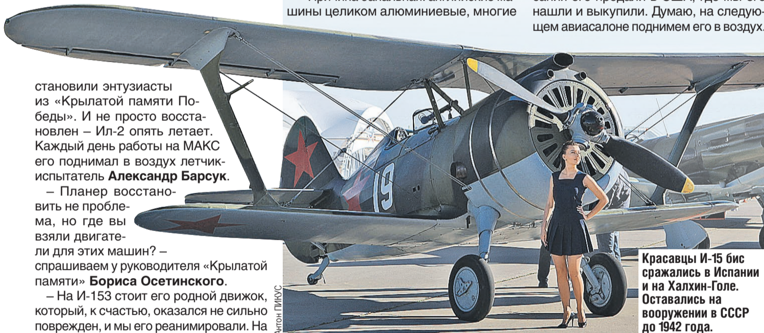
Красавцы И-15 бис сражались в Испании и на Халхин-Голе. Оставались на вооружении в СССР до 1942 года.

– На И-153 стоит его родной движок, который, к счастью, оказался не сильно поврежден, и мы его реанимировали. На