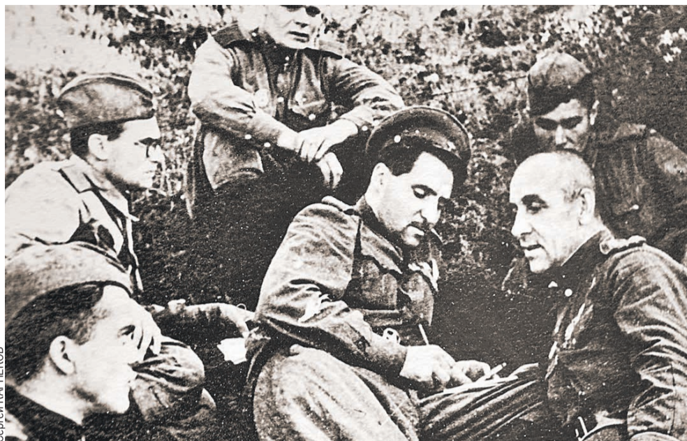
Константин Симонов (в центре) стал символом обороны Могилева.

В 1941-м 25-летний Константин Симонов работал военным корреспондентом. Сюда он приехал по заданию редакции. Это была первая его военная командировка. Когда прибыли, узнали невероятную новость о том, как на Буйничском поле во время ожесточенного боя наши бойцы подбили 39 фашистских танков и отстояли рубеж. Совет-