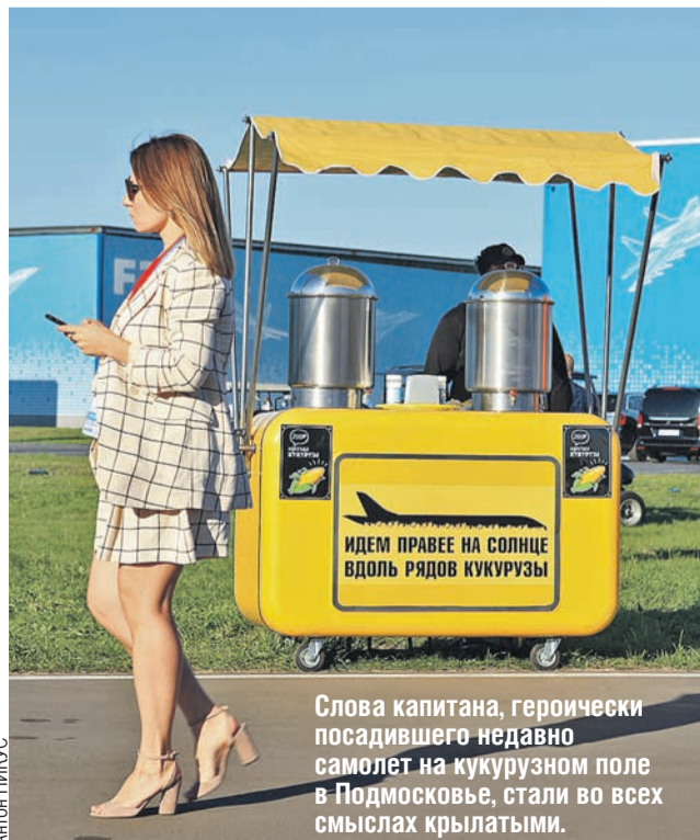
Слова капитана, героически посадившего недавно самолет на кукурузном поле в Подмоскowie, стали во всех смыслах крылатыми.