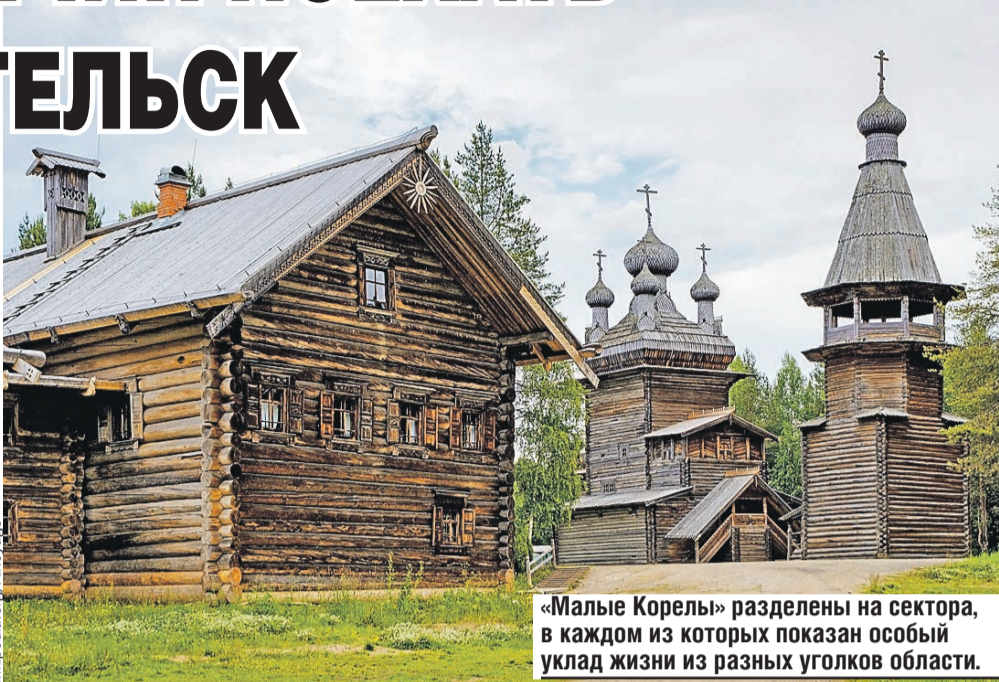
«Малые Корелы» разделены на сектора, в каждом из которых показан особый уклад жизни из разных уголков области.

Об этом, а также о роли в освоении Русского Севера, о том, как заработала на широкую ногу первая верфь, как с 1941 по 1945 год сюда прибывали караваны грузов по ленд-лизу, можно узнать в богатом на экспонаты Северном морском музее. Стоит он на набережной, которая здесь – и главная городская улица, и исторический центр, и лучшая смотровая площадка.