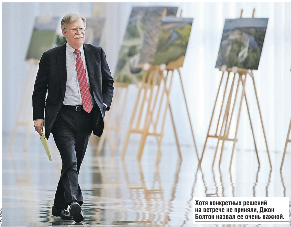
Хотя конкретных решений на встрече не приняли, Джон Болтон назвал ее очень важной.

— Никто никого ни к чему не призывал, стороны высказывали свои точки зрения и об-