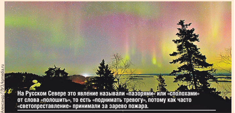
На Русском Севере это явление называли «пазорями» или «сплохами» от слова «полошить», то есть «поднимать тревогу», потому как часто «светопреставление» принимали за зарево пожара.

Кстати, начало изучению полярных сияний положил выросший под Архангельском Михайло Ломоносов. Он считал, что причина явления – в электрических разрядах в разреженном воздухе.