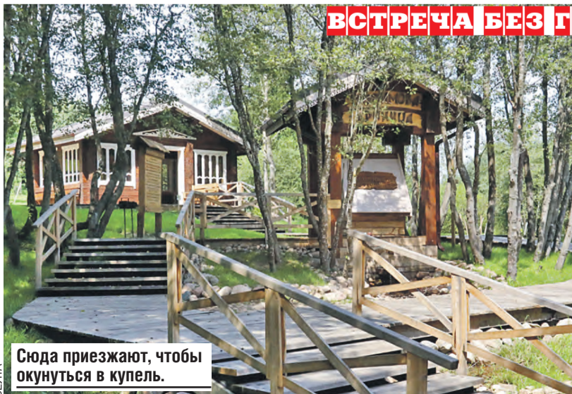
Сюда приезжают, чтобы окунуться в купель.

А еще в следующем году пригласили на традиционный праздник «Александрия собирает друзей». Каждое лето расположенный на берегу Днепра агрогородок погружается в атмосферу волшебства и старинных легенд.