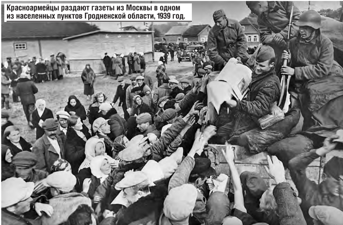
Красноармейцы раздают газеты из Москвы в одном из населенных пунктов Гродненской области, 1939 год.