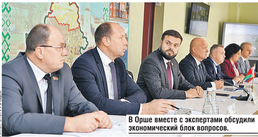
В Орше вместе с экспертами обсудили экономический блок вопросов.

Эксперты и парламентарии настаивают: даже если процесс будет длительный и технически непростой, двигаться в сторону гармонизации законодательств необходимо.