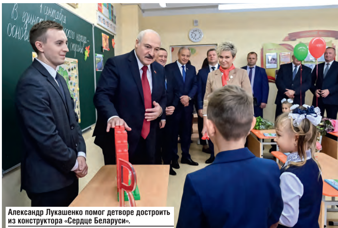
Александр Лукашенко помог детворе достроить из конструктора «Сердце Беларуси».

— Самое современное оборудование. Мы дооснастимся. Если мы увидим на учениях, что нам нужно что-то еще, значит, мы купим у России и поставим на вооружение.