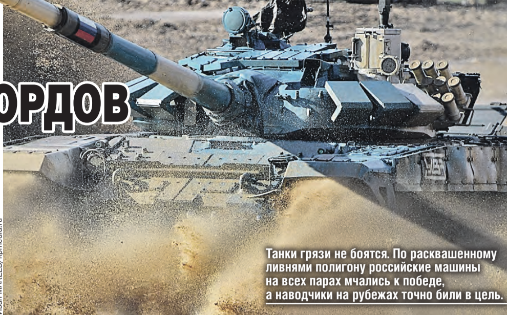
Танки грязи не боятся. По расквашенному ливнями полигону российские машины на всех парах мчались к победе, а наводчики на рубежах точно били в цель.

Кстати, расхожее выражение «ревут моторами» применительно к современным машинам – не что иное, как нафталиновый анахронизм. Успех любого боя предопределяет скрытность, а скрытность – это тишина. За сто метров Т-72,