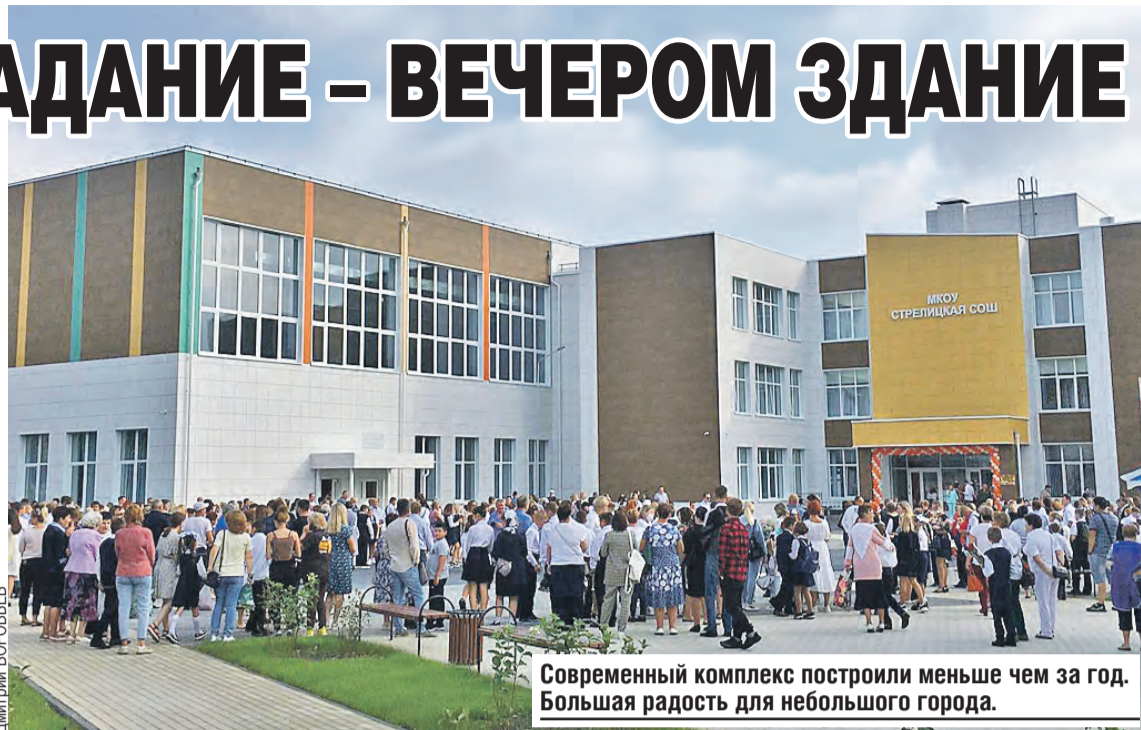
Современный комплекс построили меньше чем за год. Большая радость для небольшого города.

Залитая солнечным светом новая Стрелицкая школа словно пасхальное яйцо. Белорусы