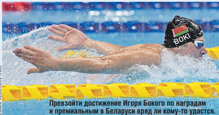
Превзойти достижение Игоря Боккого по наградам и премиальным в Беларуси вряд ли кому-то удастся.

вес – каждая награда тянет почти на 700 граммов.