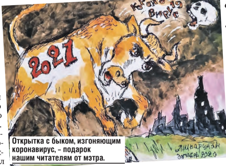
Открытка с быком, изгоняющим коронавирус, – подарок нашим читателям от мэтра.

– Сталина, когда ходили на демонстрацию на Красную площадь. На большом расстоянии. Это было 1 Мая. Он стоял на мавзолее Ленина. А уже в послевоенное время, в 1980-е годы, в командировке в Братиславе, видел Брежнева. Приехал на выставку наших работ мультипликации. Она проходила в Доме Советско-Чехословацкой дружбы. И туда же на съезд Коммунистической партии Чехословакии прилетел Брежнев. И директор музея ему меня представил. Пожимал ему руку, но не