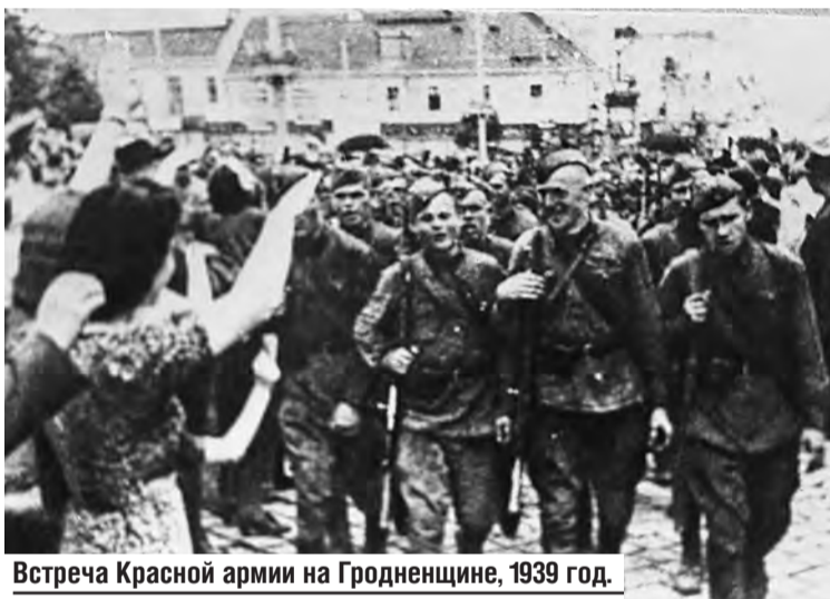
Встреча Красной армии на Гродненщине, 1939 год.

ние объединенной, свободной, советской Белоруссии будет определять дорогу ее быстрого развития».