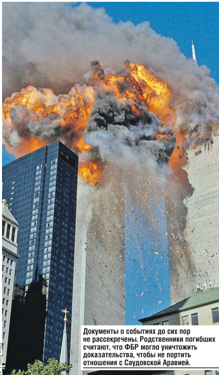
Документы о событиях до сих пор не рассекречены. Родственники погибших считают, что ФБР могло уничтожить доказательства, чтобы не портить отношения с Саудовской Аравией.

А Беларусь?! Никому не угрожала, не вела подрыв-