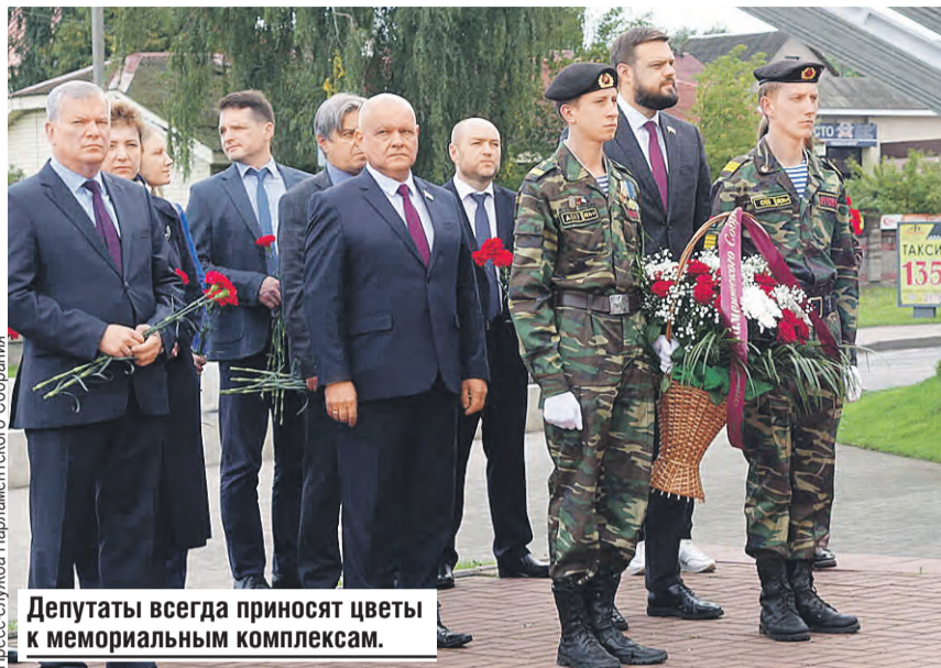
Депутаты всегда приносят цветы к мемориальным комплексам.