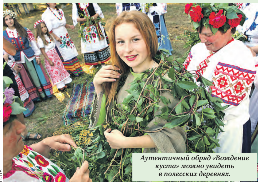
Аутентичный обряд «Вождение куста» можно увидеть в полесских деревнях.

Здесь ласковое и теплое море, приятный климат, доступные цены. В городе есть песчаные и галечные пляжи. Популярностью пользуются и экскурсии к дольменам или водопадам. Почему бы не устроить познавательную