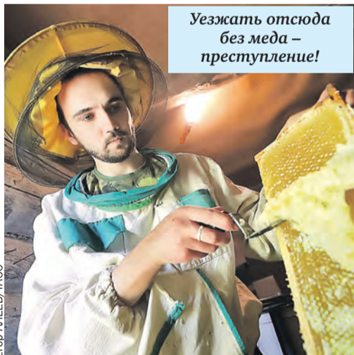
Уезжать отсюда без меда – преступление!

Липовый, цветочный, гречишный, каштановый, акациевый. Есть и совсем экзотичные вариации, с орехами или ягодами. Пробуйте понемногу, выбирайте на свой вкус и смело везите всем в качестве сувенира. Заряд бодрости и здоровья на долгую зиму обеспечен.