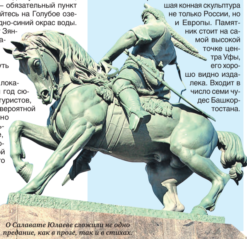
О Салавате Юлаеве сложили не одно предание, как в прозе, так и в стихах.

не только России, но и Европы. Памятник стоит на самой высокой точке центра Уфы, его хорошо видно издали. Входит в число семи чудес Башкортостана.