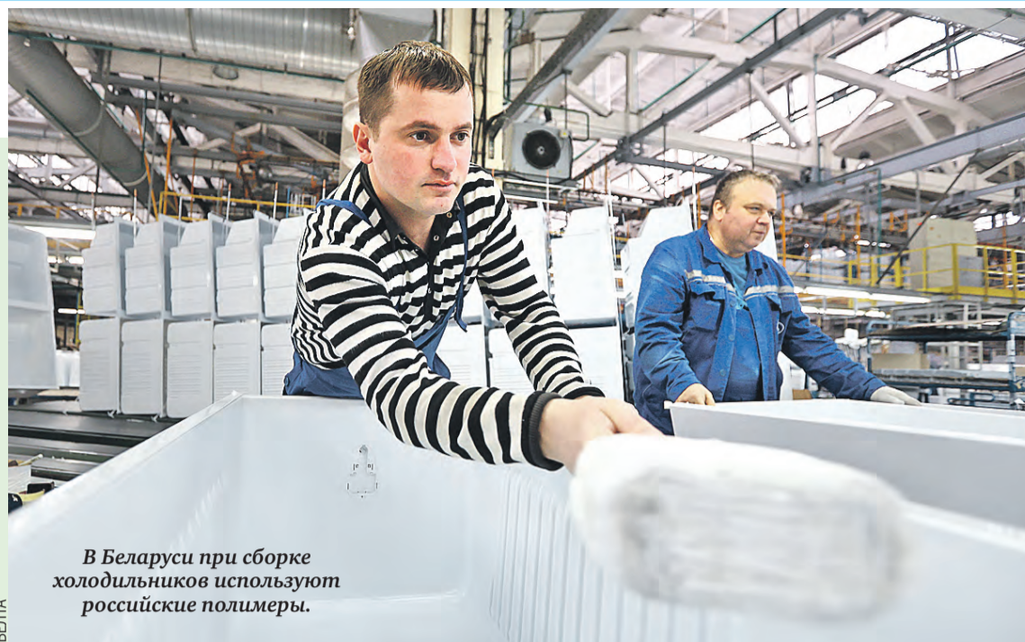
В Беларуси при сборке холодильников используют российские полимеры.

– В прошлом году запустили модернизацию парка коммунальной техники и пассажирского транспорта, – расска-