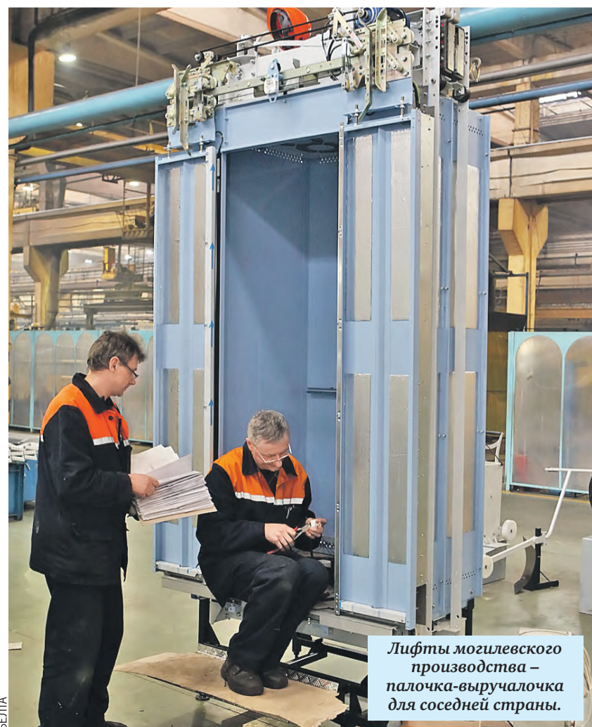
Лифты могилевского производства – палочка-выручалочка для соседней страны.

– В последние годы большая часть белорусского авторынка формировалась за счет машин российского производства, – добавил Азаров. – «Лада» входит в тройку лидеров.