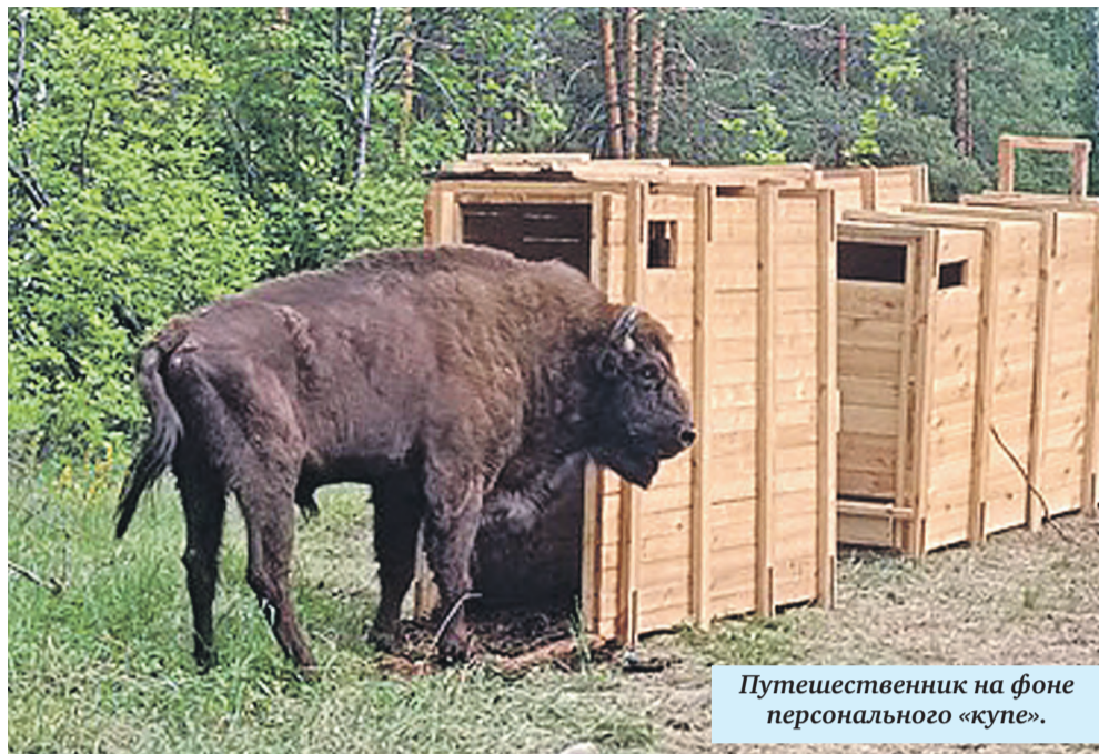
Путешественник на фоне персонального «купе».

Поскольку зубры человеческой речью не владеют, за комментариями мы обратились к заместителю директора Особо охраняемых природных