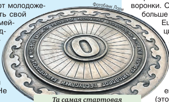
Та самая стартовая отметка.

Здесь приезжают молодые люди, чтобы сделать свой первый шаг в семейной жизни, предприниматели становятся на него и пожимают руки, заключая соглашения, прохожие бросают монеты «на счастье». Не проходите мимо!