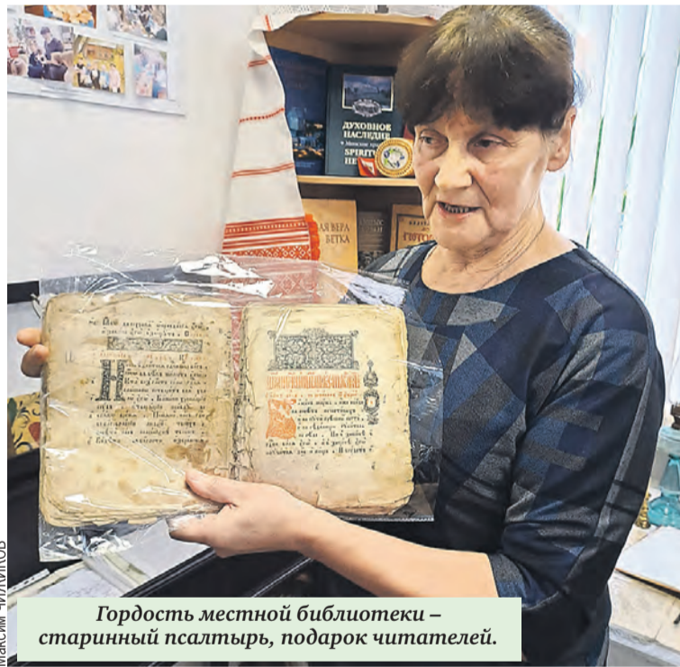
Гордость местной библиотеки – старинный псалтырь, подарок читателей.

моучка, способный сыграть виртуозно на любом инструменте. Целый уголок в музее посвящен ему. Поют в «Сябрах» в основном женщины. Причем не только белоруски. Да так хорошо, что ни один праздник без них не обходится. Не раз ездили они в Беларусь, в Александрию – на «Купалье».