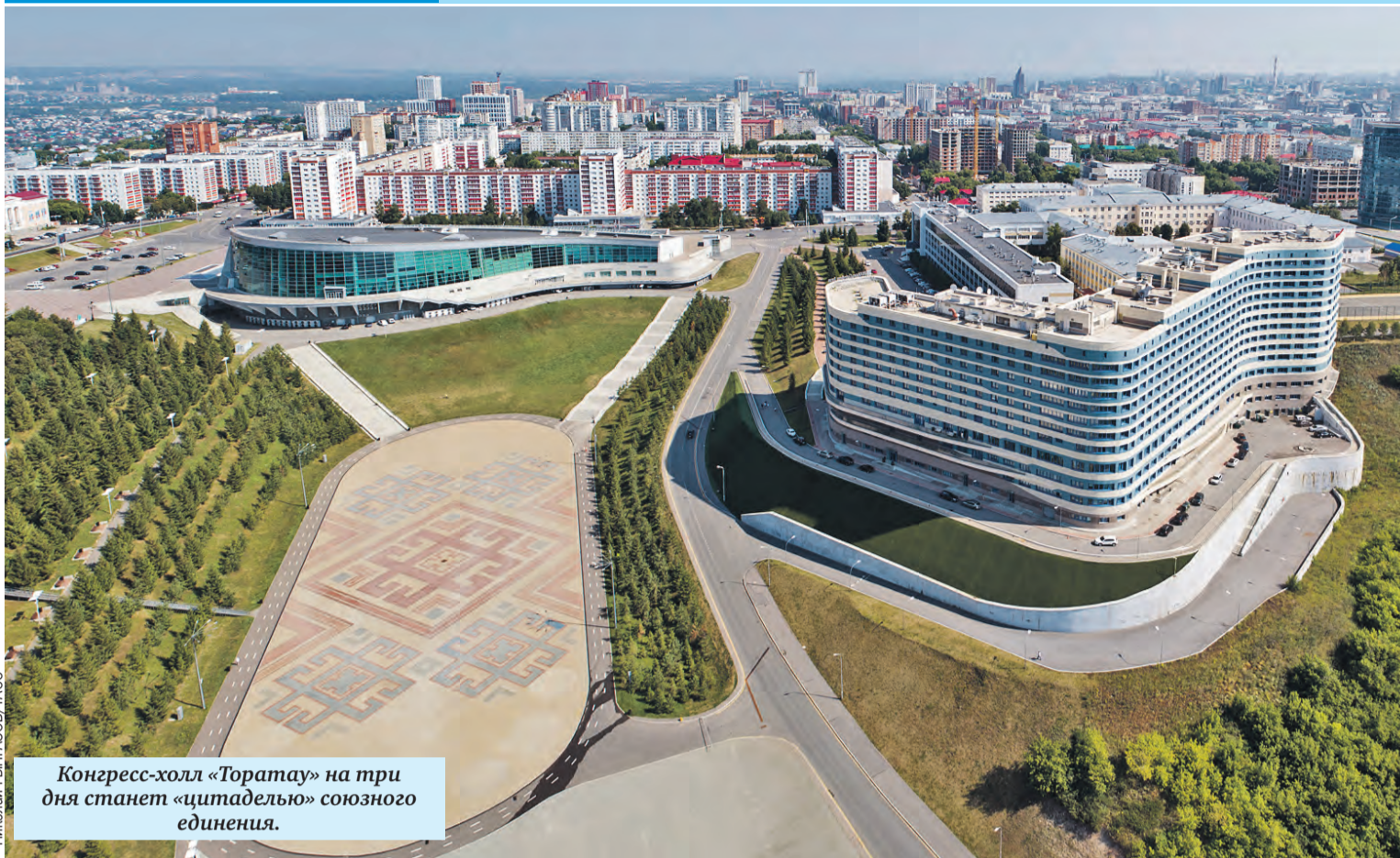
Конгресс-холл «Торатау» на три дня станет «цитаделью» союзного единения.