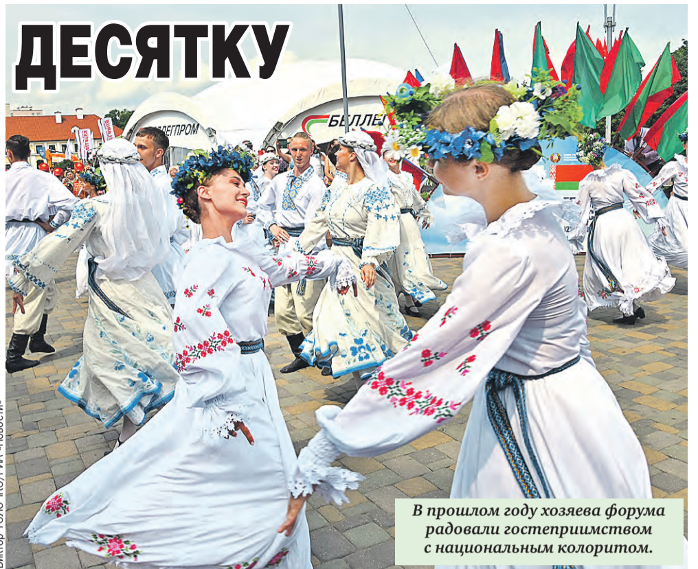
В прошлом году хозяева форума радовали гостеприимством с национальным колоритом.