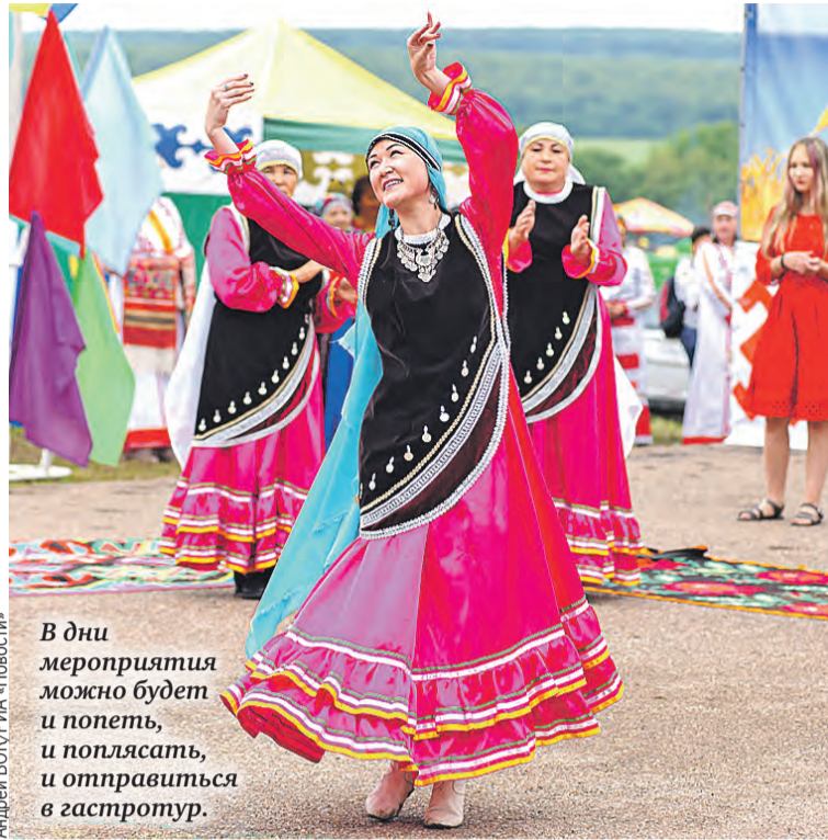
В дни мероприятия можно будет и попеть, и поплясать, и отправиться в гастротур.

Можно отправиться в село, где живут башкирские белорусы. И продегустировать блюда национальной белорусской