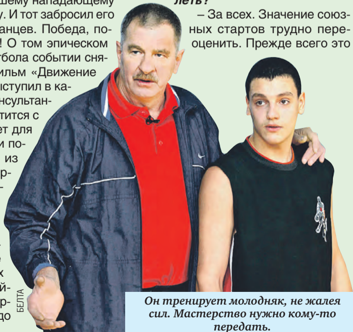
Он тренирует молодяка, не жалея сил. Мастерство нужно кому-то передать.

Кстати, если бы не мама, не бывать мне баскетболистом. Мальчишкой еще упал неудачно, сломал руку. Сложнейшее повреждение. Врачи хотели вообще ампутировать, но она не позволила: «Что хотите делайте, но превращать сына в калеку не дам». Несколько операций. Рука срослась. Долго очень разрабатывал, пока вернулся на площадку. Так что видите: в жизни случаются разные ситуации, но никогда не надо вешать нос и сдаваться обстоятельствам. Нужно верить в себя и наперекор всему идти к своей цели. Тогда все получится. Об этом я тоже обязательно скажу ребятам на фестивале в Уфе.