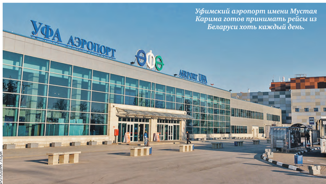
Уфимский аэропорт имени Мустая Карима готов принимать рейсы из Беларуси хоть каждый день.