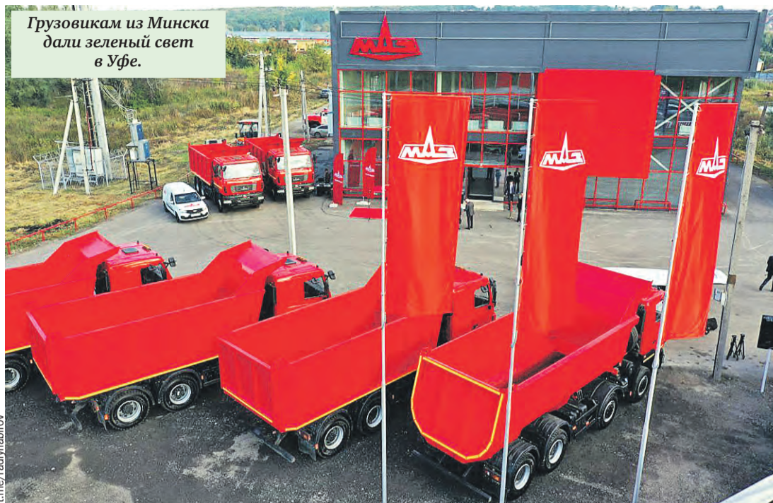
Грузовикам из Минска дали зеленый свет в Уфе.