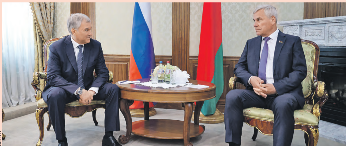
Председатель Парламентского Собрания и его первый заместитель придают большое значение сотрудничеству на местах, понимая, что интеграция идет от малого к большому.

– Десятилетиями отработанные Западом алгоритмы и деструктивные методики оказались неэффективны против Союзного государства. Внешнее давление и санкции дали дополнительный импульс двустороннему сотрудничеству и интеграции, подтвердили правильность выбранного нашими странами пути. Совместные шаги России и Беларуси позволили сохранить стабильность и создать условия для роста. Оперативные меры по импортозамещению, устойчивому функционированию предприятий, недопущению ухудшения