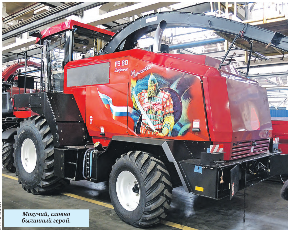
Могучий, словно былинный герой.

В экономике самый объективный показатель – цифры. «Брянсксельмаш» – один из лидеров российского машиностроения. Каждый третий комбайн, работающий на полях страны, произвели именно здесь. Только в прошлом году выпустили 1,2 тысячи