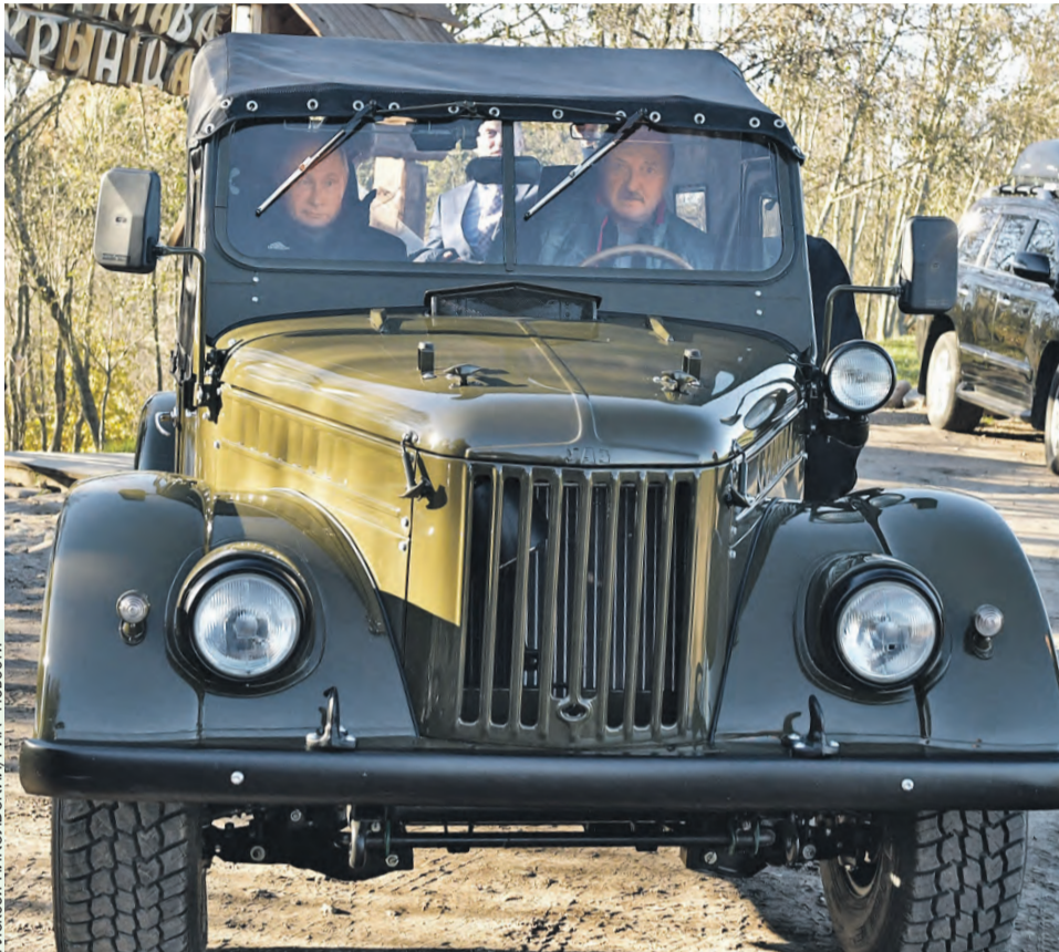
На одном из прошлых мероприятий президенты посетили агрогородок Александрия. По малой родине белорусского лидера они передвигались на модернизированном ретроавтомобиле.

В нынешних геополитических реалиях форум выполняет важную миссию – способствует созданию прочной эко-