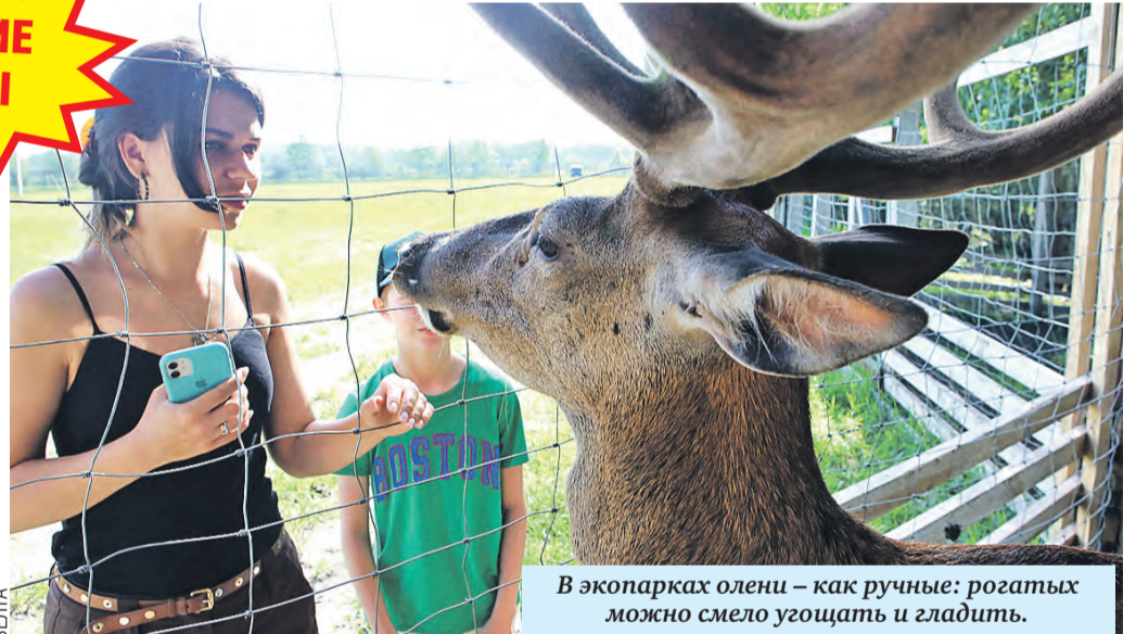
В экопарках олени – как ручные: рогатых можно смело угощать и гладить.