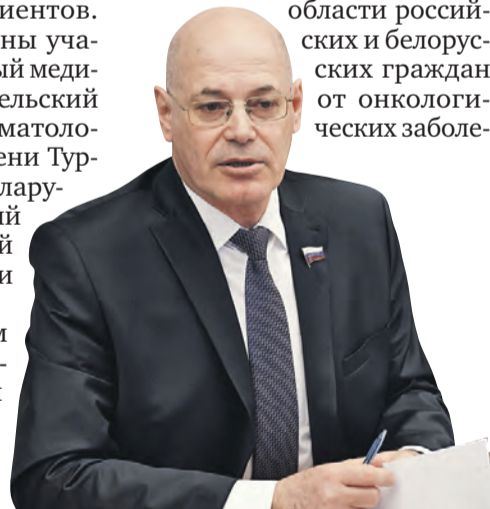
Парламентарий – за борьбу с ненужной бюрократией.

– Например, компания «БИОКАД» поставляет в Беларусь современные лекарства, проводит обучающие семинары, клинические исследования. У властей города есть планы по локализации производства тринадцати международных непатентованных наименований лекарств, которые выпускают в Беларуси, но не производят в России. Будут производить дженерики – не под торговой маркой, а под названием химической формулы. Разумеется, с соблюдением всех технических процедур – регистрация на территории России, проведение повторных клинических испытаний. Эти процессы тоже активно идут. Мы справляемся.