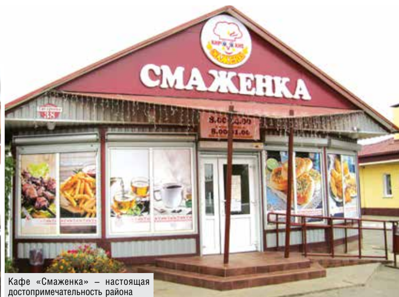
Кафе «Смаженка» – настоящая достопримечательность района