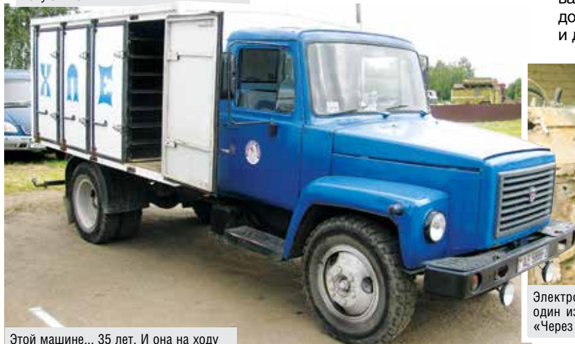
Этой машине... 35 лет. И она на ходу