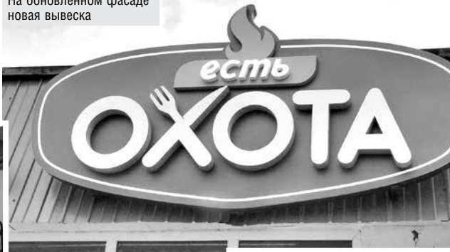
На обновленном фасаде новая вывеска

листов райпо. Выслушали всех и сделали выбор – кафе будет называться «Есть охота». Новая вывеска появилась с декабря прошлого года. Работают в кафе семь человек. Все, кто ра-