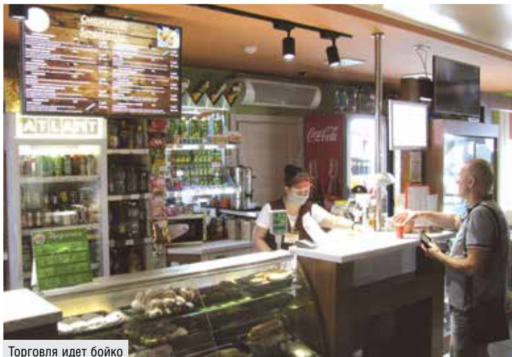
Торговля идет бойко