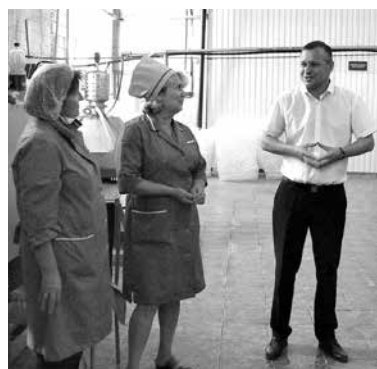
Работники высказывали предложения руководству

Летом работают в две смены. Небольшой коллектив выдает нагору более десяти наименований ароматных напитков, которые пользуются большим спросом не