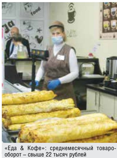
«Еда & Кофе»: среднемесячный товарооборот — свыше 22 тысяч рублей