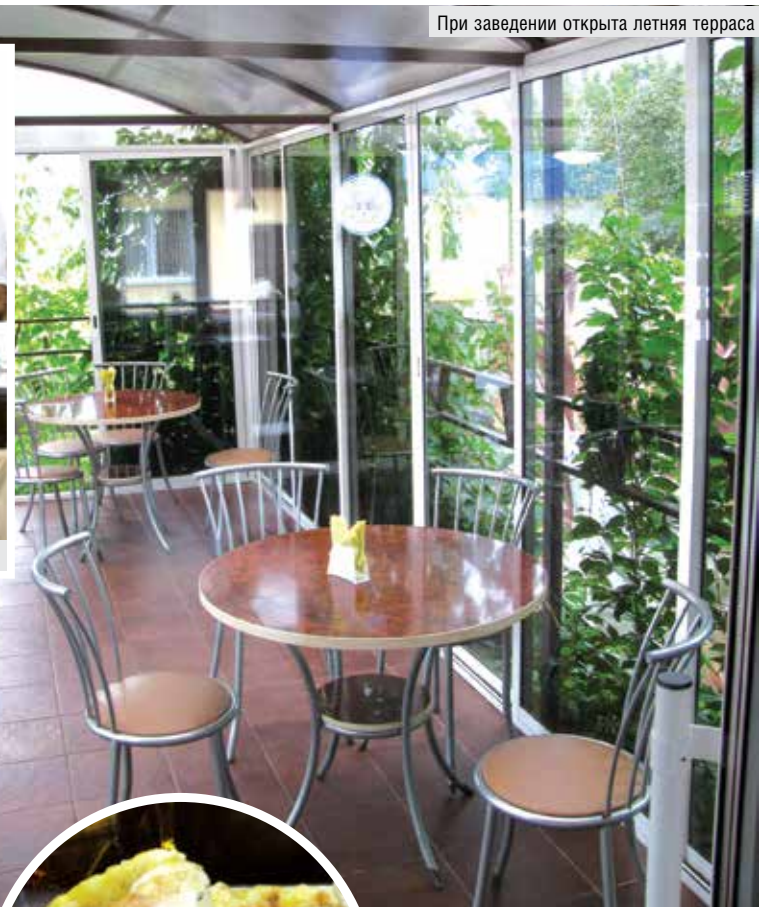
При заведении открыта летняя терраса

компьютеризации нужно использовать по максимуму: умная программа сама определит, сколько нужно завезти в магазин товаров той или иной группы, посчитает дневной объем продаж с учетом остатков, сформирует заявку. Плюс статистика для анализа. Работы по автоматизации магазинов на Кировщине завершаются, впереди объекты Бобруйского района.