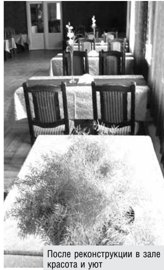
После реконструкции в зале красота и уют