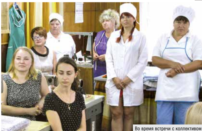
Во время встречи с коллективом