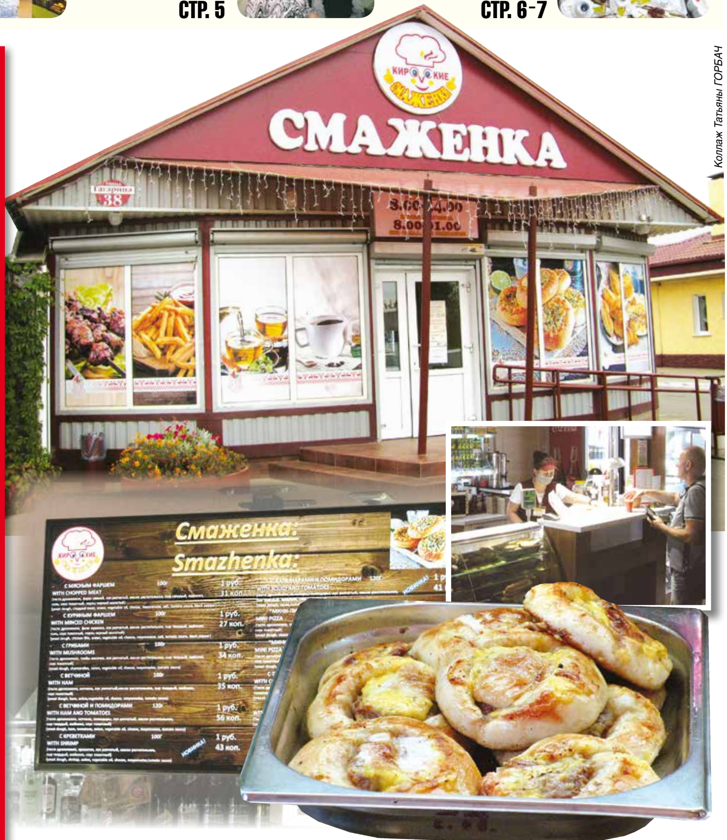
Коллаж Татьяна ГОРБАЧ