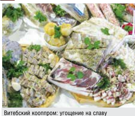
Витебский кооппром: угощение на славу