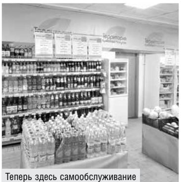
Теперь здесь самообслуживание

В связи с коронавирусом количество покупателей нынешним летом в Журавинке выросло. Если в среднем товарооборот в этом году был 36 000 рублей в месяц (темп роста к аналогичному периоду года – 121,7 процента), то в июле наторговали почти на 44 000 рублей. Чаще стали заходить дачники, и местным новый интерьер и экстерьер «Роднага кута» приглянулся.