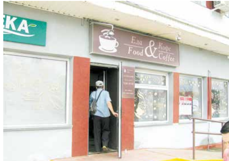
Вопреки всем вирусам на свете, двери в заведение не закрываются

Яблок на Витебщине нынче столько, что подобного урожая не помнят и старожилы. Кооперативная промышленность в состоянии переработать лишь четверть объема, который намерена закупить. А значит, важно активнее работать с внесистемными переработчиками, больше реализовывать яблок в магазинах сети и на экспорт.