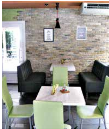
Знакомиться с кировской смаженкой нужно обстоятельно: в кафе созданы для этого все условия