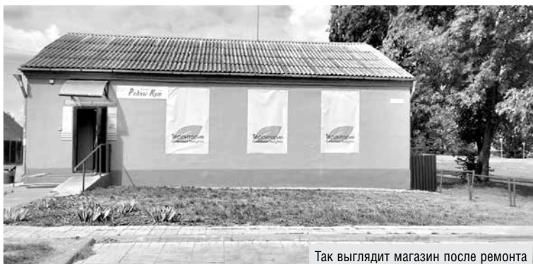
Так выглядит магазин после ремонта

Валентина ЛАВРИКОВА