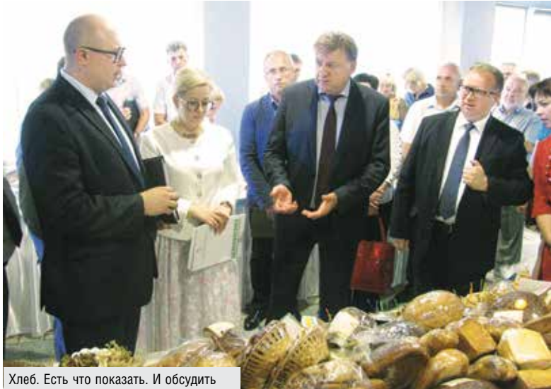
Хлеб. Есть что показать. И обсудить

С сентября минувшего года функционирует Витебское облпотребобщество, объединившее семь филиалов: Бешенковичский, Верхнедвинский, Докшицкий, Лепельский, Поставский, Сенненский и Ушачский. Работают они не только на территории своих районов. Тот же Лепельский филиал свои горизонты расширил основательно: обслуживает жителей не только своего и соседнего Чаш-