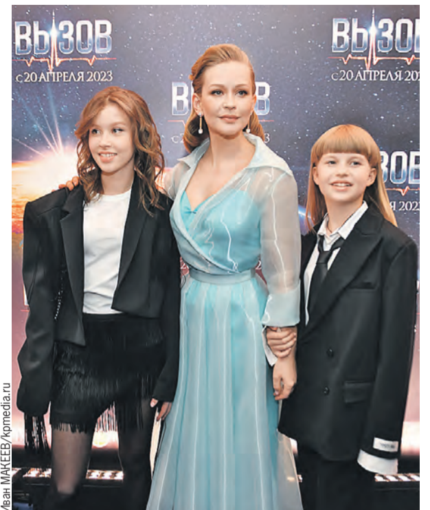
Две дочки – в маму. Она надеялась, что они станут врачами, но девочки хотят пойти по ее стопам.