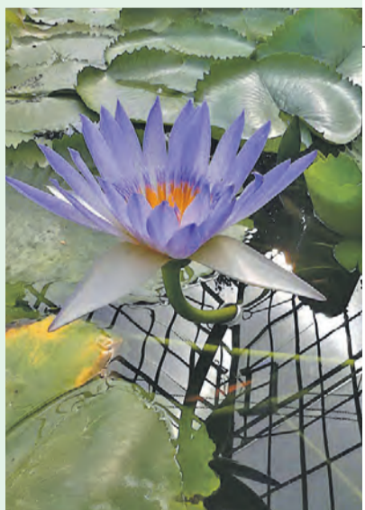
Голубой лотос выглядит даже эффектнее белого.

Он располагает внушительной коллекцией. Общее число видов – до 23 тысяч. Здесь собрали тропические, субтропические, степные, луговые, декоративные растения. В саду четыре лаборатории, каждая занимается изучением и выращиванием определенных видов.