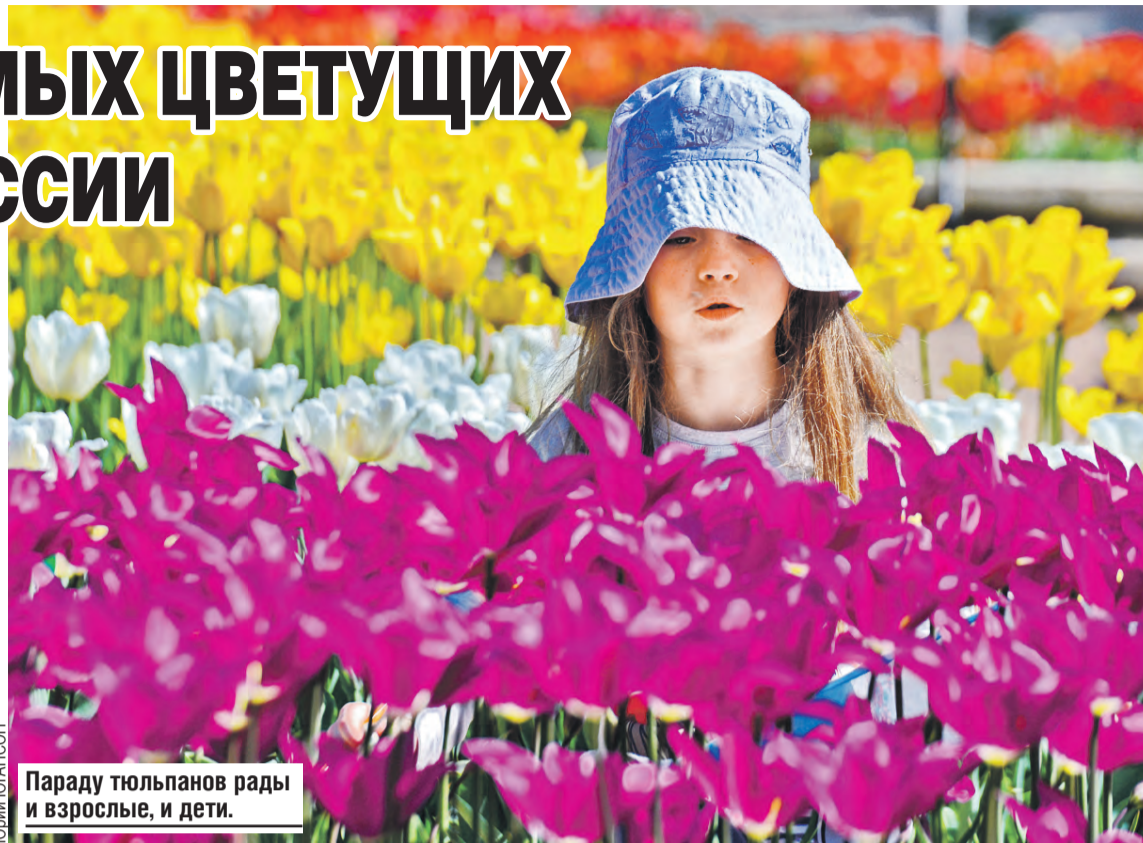
Параду тюльпанов рады и взрослые, и дети.

Стевен с энтузиазмом взялся за работу – нашел декоративные деревья и растения, которые прижились бы в Крыму. Он же начал селекцию винограда. Сад стал одним из ведущих научных центров России. Сейчас занимает территорию в 40 гектаров, на которых растут больше 19 тысяч видов. Здесь есть и оранжереи, но большинство растений – на открытом воздухе. В саду проводят «Парады тюльпанов», «Балы хризантем» и другие праздники цветов.