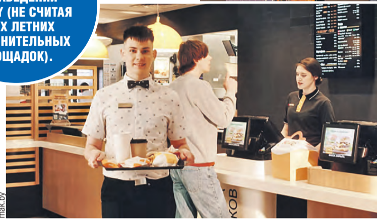
Бургеры «Родны» и «Беларускі» – наш ответ американским макчикенам.

СЕЙЧАС В БЕЛАРУСИ 25 ЗАВЕДЕНИЙ МАК.ВУ (НЕ СЧИТАЯ ДВУХ ЛЕТНИХ ДОПОЛНИТЕЛЬНЫХ ПЛОЩАДОК).