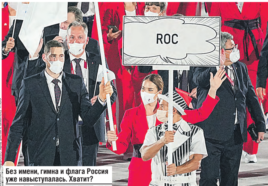
Без имени, гимна и флага Россия уже навывступалась. Хватит?