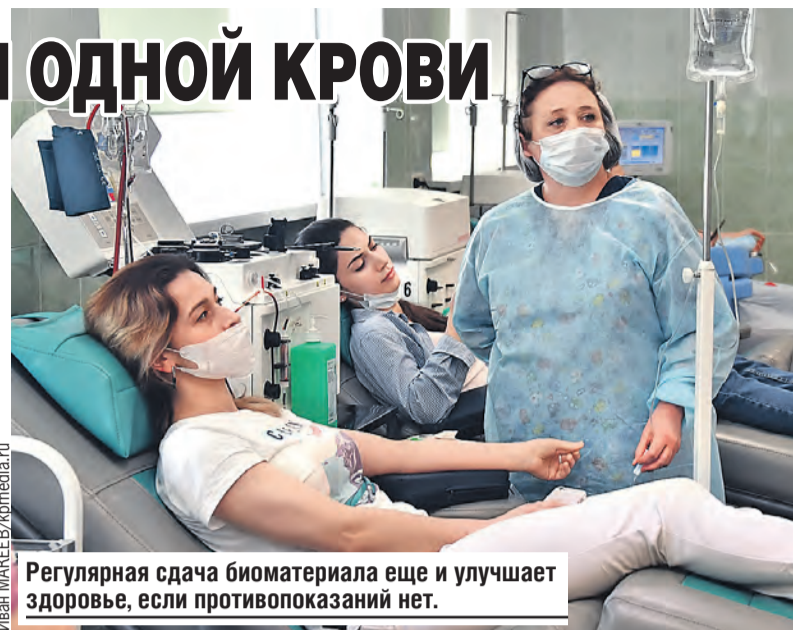
Регулярная сдача биоматериала еще и улучшает здоровье, если противопоказаний нет.

Стать ими могут здоровые люди от 18 до 60 лет. Они не должны болеть туберкулезом, сифилисом, гепатитом, сахарным диабетом, онкологией, страдать ишемической болезнью сердца и язвой желудка. Перед донацией выдают вкусные наборы. В них сладости, печенье, вода.