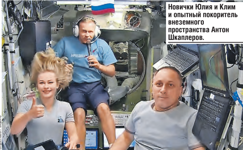
Новички Юлия и Клим и опытный покоритель внеземного пространства Антон Шкаплеров.

Картина стала вызовом всем землянам. Еще никто не устраивал съемок в космосе. Пересильд и Шипенко – первопроходцы в мировом кинематографе. Причем Юлия –