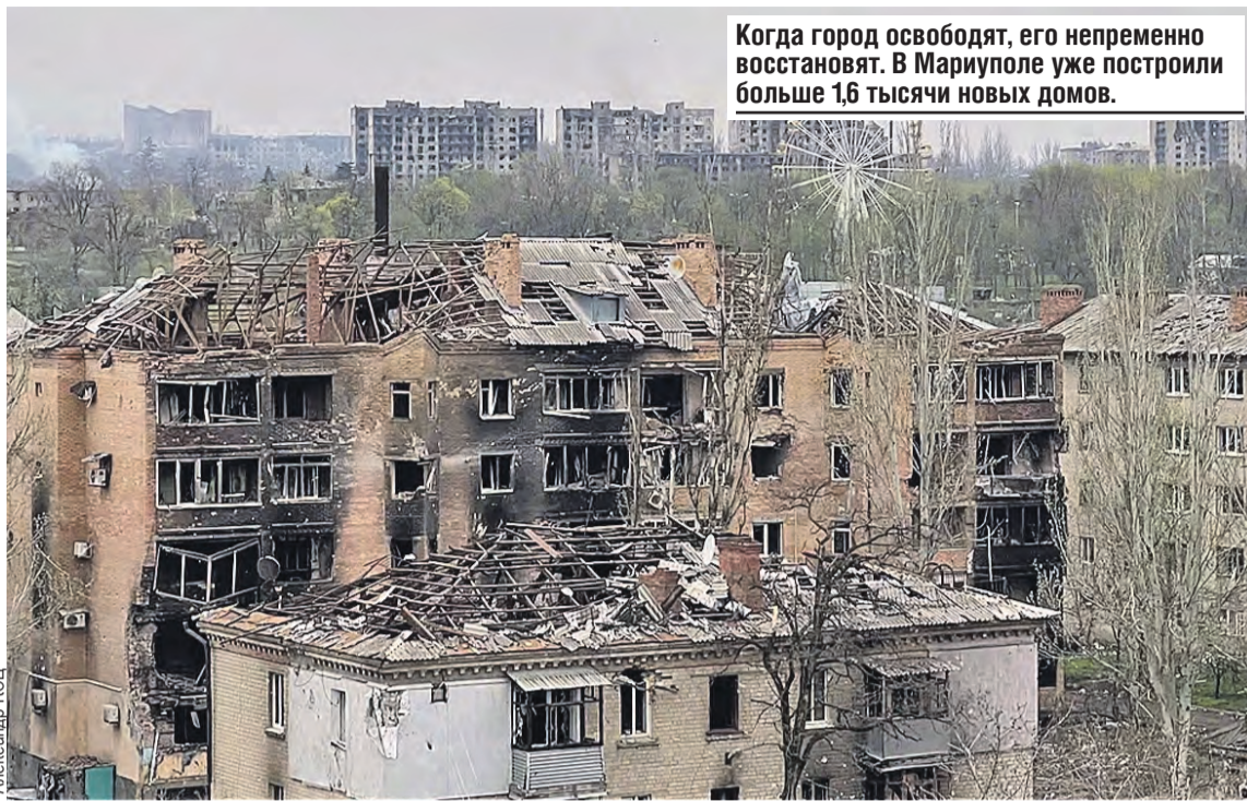
Когда город освободят, его непременно восстановят. В Мариуполе уже построили больше 1,6 тысячи новых домов.

Теперь перемалывать будут еще с помощью модифицированных авиабомб. Благодаря специальным устройствам УМПК (универсальным модулям планирования и коррекции) есть возможность наносить удары по противнику, не входя в зону его ПВО. Такие снаряды могут планировать на дальность 50–70 километров, и враг пока их сбивать не научился. Сейчас в основном используют мощные полутонные бомбы ФАБ-500. Но то ли еще будет, когда