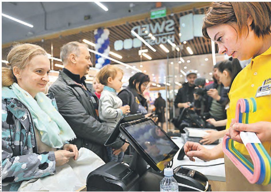
Посетители спешат приобрести товары, по которым уже успели соскучиться.

рах. Популярность и кассу компании сделали сбалансированный ассортимент, грамотная экспозиция и хороший мерчендайзинг.