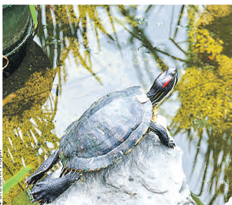
Приятно отдохнуть в тени дальневосточного сада.

Сегодня здесь цветы со всего мира. На площади 450 квадратных метров закрытого грунта растут тропические и субтропические растения. И в каждом уголке оранжереи своя атмосфера. Приходите и убедитесь сами. Кстати, рядом расположился павильон, в котором можно купить экзотические экземпляры и наслаждаться их красотой.