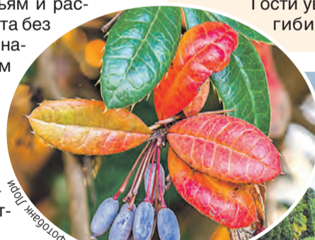
Барбарису Юлианы очень уютно в тропиках.

Парку больше 130 лет. Сейчас здесь 24 вида пальм, 80 видов дубов, 76 видов сосен, огромное количество субтропических растений, хлебное, мыльное, конфетное, железное, земляничное и другие деревья. Всего около 1800 видов растений со всех уголков земли.