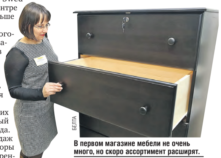
В первом магазине мебели не очень много, но скоро ассортимент расширят.

Подготовили Софья АРСЕНЬЕВА, Руфина ЖАЛЯЕВА, Евгения ЗАБОЛОТСКИХ.