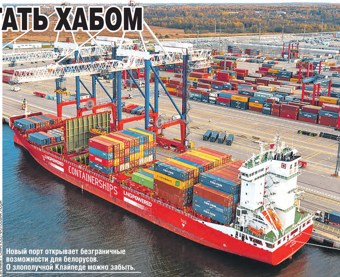
Новый порт открывает безграничные возможности для белорусов. О злополучной Клайпеде можно забыть.

– Смогли благодаря ей начать очень важные для города реформы – транспортную и в сфере ЖКХ. Беларусь помогла нам выйти на новый единый стандарт социальных перевозок. Вывели на линии в 2022 году 2,5 тысячи экологических низкопольных автобусов на газовом топливе. Из