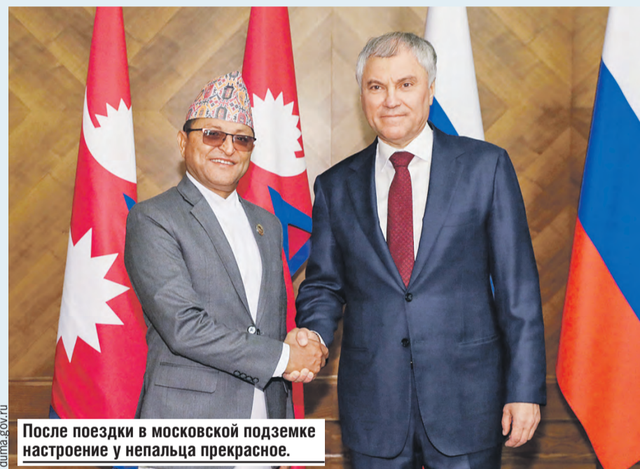
После поездки в московской подземке настроение у непальца прекрасное.

Несмотря на давление, Непал не присоединился к антироссийским санкциям. Вячеслав Володин также