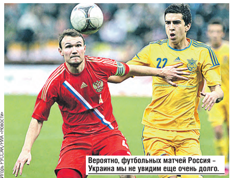
Вероятно, футбольных матчей Россия – Украина мы не увидим еще очень долго.

Спорных моментов хватает и на клубном уровне. Что, например, делать полузащитнику «Марселя» Руслану Малиновскому, который играет в одном чемпионате – французском – с россиянином Александром Головиным из «Монако»? Добровольно садиться в запас? Похожая загогулина и в итальянской серии А, где россиянин Алексей Миранчук из «Торино» выходит на поле против украинца Виктора Коваленко из «Специи». Миранчук, Коваленко и Малиновский не так