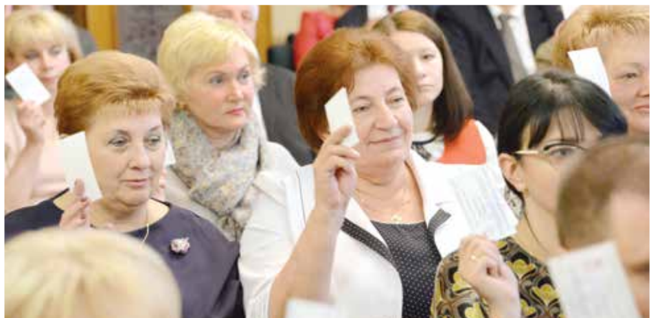
Участники собрания признали удовлетворительной работу правления облпотребсоюза в отчетном периоде.

Александр РУДНИЦКИЙ