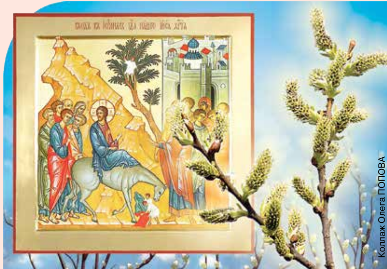
Коллаж Олега ПОГОВА

З ападные христиане, живущие по григорианскому календарю, 14 апреля отмечают один из важнейших праздников – Вход Господень в Иерусалим (Пальмовое воскресенье). Пасха для западных христиан в этом году наступит 21 апреля.