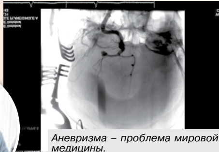
Аневризма — проблема мировой медицины.

Разрыв аневризмы и, как следствие, инсульт — тот случай, когда малейшее промедление смерти подобно. Чтобы изменить печальную картину и еще больше сэкономить столь драгоценное для пациента время, хирурги БСМП внедрили гибридную операцию на головном мозге. По масштабу действия это не просто хирургическое вмешательство, а настоящий операционный театр, где разворачивается остродраматический сюжет по спасению жизни.