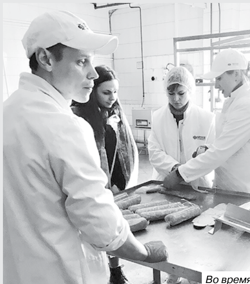
Во время семинара.

В конце марта Брестский облпотребсоюз провел областной семинар-учебу по отработке технологии изготовления колбасных изделий и мясных полуфабрикатов с применением ингредиентов немецкого производства. В это же время состоялся второй этап семинара-учебы по производству книжки