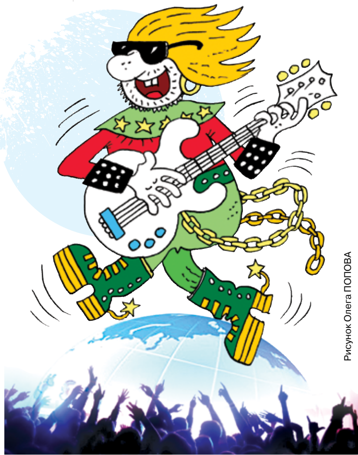
Рисунок Олега ПОГОВА

Р ок-н-ролл – воплощение свободной, зажигательной, наполняющей сумасшедшим драйвом музыки. Взорвав своим появлением размеренные 1950-е, он давно считается классическим жанром и не уступает другим направлениям по уровню популярности и силе любви поклонников. Всемирный день рок-н-ролла официально так и не признается Генеральной Ассамблеей ООН. Но это совершенно не мешает почитателям жанра праздновать 13 апреля очередную годовщину.