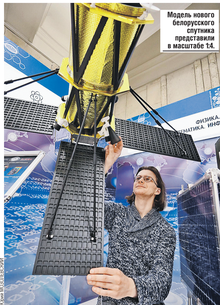
Модель нового белорусского спутника представили в масштабе 1:4.

Но если электровелосипеды, скутеры и байки только начинают путь к потребителю, электробусы в белорусских городах уверенно теснят дизельных и бензиновых собратьев. К лету на столичных улицах будут работать уже около сотни желтых экоавтобусов на электричестве. Сделать белорусский электротранспорт