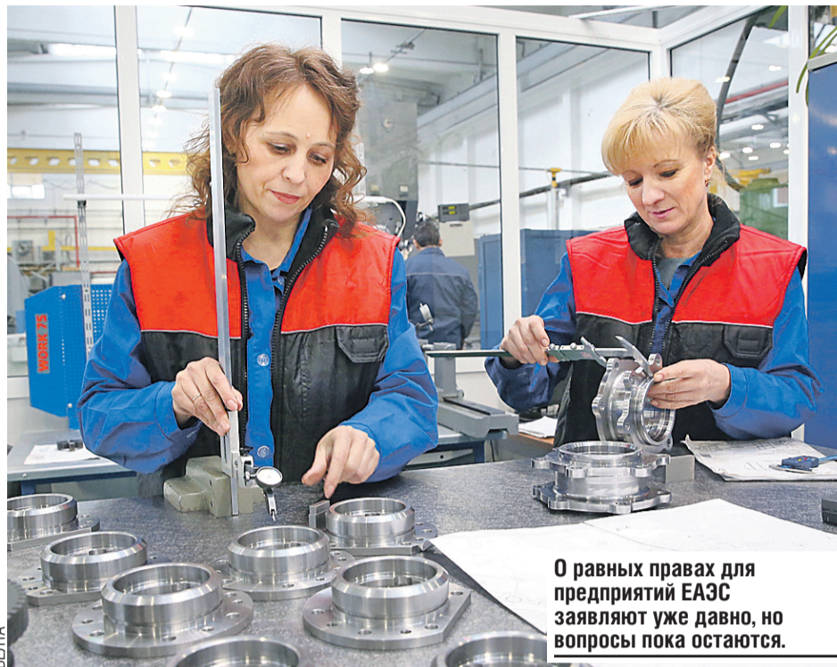
О равных правах для предприятий ЕАЭС заявляют уже давно, но вопросы пока остаются.

О недавней отмене одного из них на днях заявила белорусская сторона. Речь идет о действовавшей ранее в Беларуси дополнительной санитарно-гигиенической экспертизе отдельных