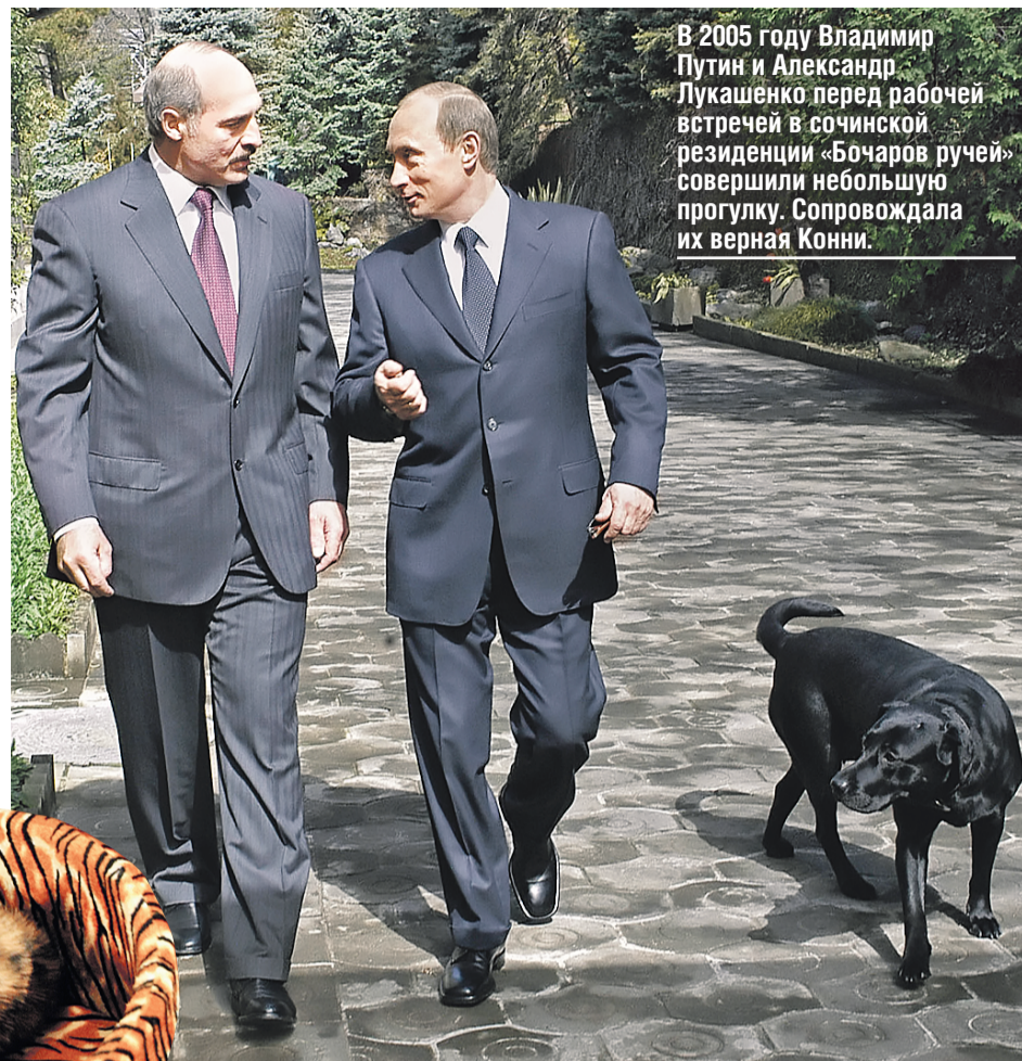
В 2005 году Владимир Путин и Александр Лукашенко перед рабочей встречей в сочинской резиденции «Бочаров ручей» совершили небольшую прогулку. Сопровождала их верная Конни.

Самый известный хвостатый питомец Владимира Путина — черный лабрадор Конни, подарок