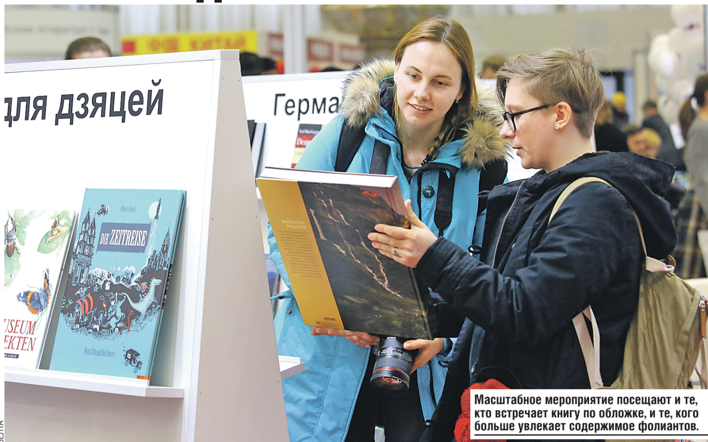
Масштабное мероприятие посещают и те, кто встречает книгу по обложке, и те, кого больше увлекает содержимое фолиантов.