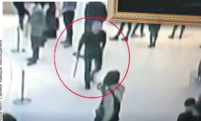
Кадр с камеры наблюдения: вор спокойно шел по залам с полотном «Ай-Петри. Крым», и никто из охранников даже не посмотрел в его сторону.