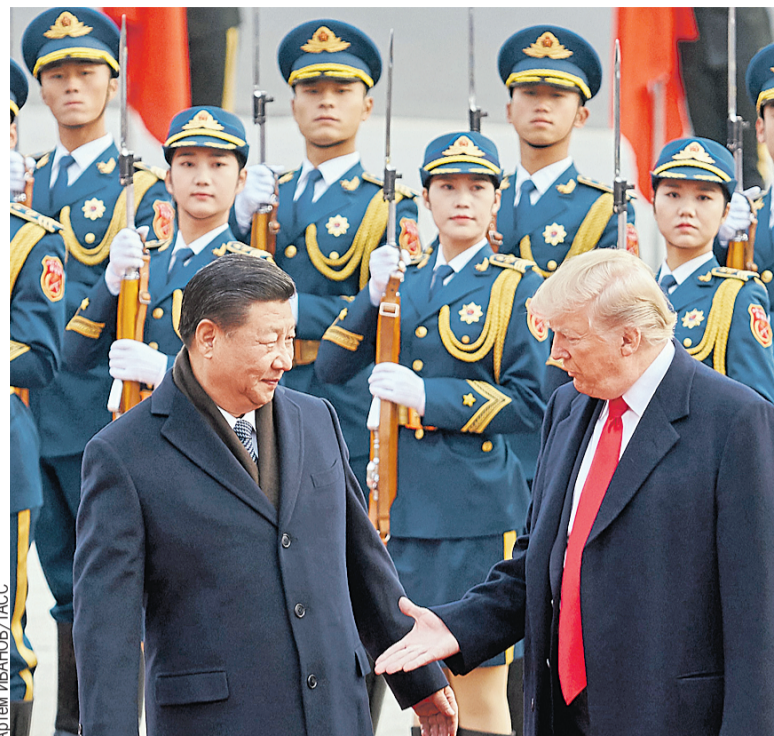
Рыночная перепалка Дональда Трампа и Си Цзиньпина показала, что влияние организации не безгранично. Конфликт разрешился, а осадочек остался.

Во Всемирную торговую организацию входят 164 страны. На их долю приходится примерно 98 процентов мировой торговли. Грубо говоря, почти вся планета внутри этой большой организации. Штаб-квартира находится в Женеве (Швейцария). В теории все страны внутри ВТО торгуют по одним правилам. Чтобы соответствовать требованиям, российские чиновники в свое время изменили 52 федеральных закона и 450 нормативных актов Правительства. Переговоры велись восемнадцать лет и завершились только в 2012 году. Россия выторговала себе неплохие условия участия. Но последующие годы показали, что членство в ВТО никак не помогло отстаивать свои интересы на международном рынке.