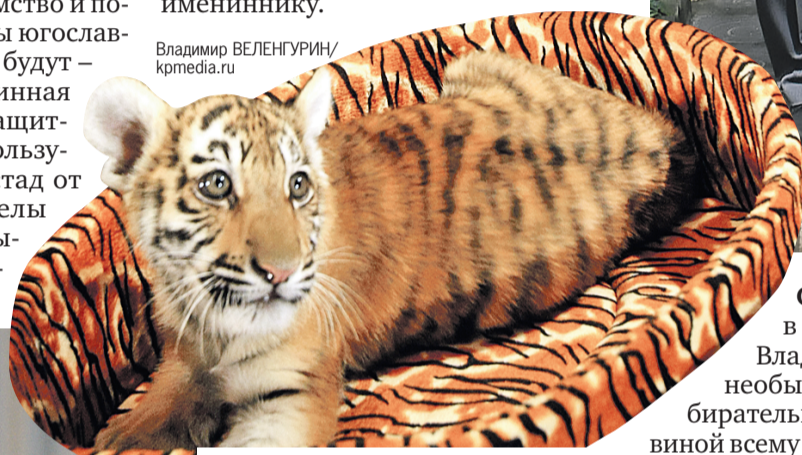
Полосато-хвостатая Маруся новому хозяину доверилась сразу.