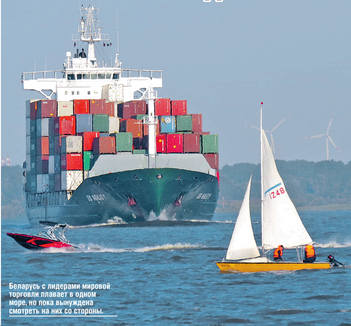
Беларусь с лидерами мировой торговли плавает в одном море, но пока вынуждена смотреть на них со стороны.