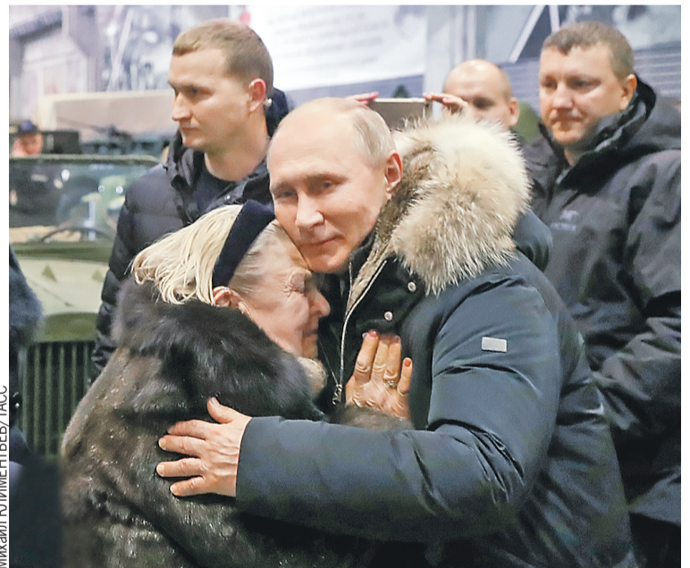
Когда нахлынули воспоминания... Владимир Путин на выставке в «Ленрезерве».

– Родители старались не говорить о тех тяжелых годах, старались меня от этого оградить, – рассказал Президент.