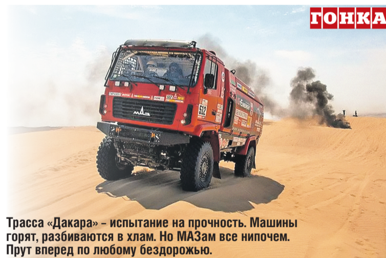
Трасса «Дакара» – испытание на прочность. Машины горят, разбиваются в хлам. Но МАЗам все нипочем. Прут вперед по любому бездорожью.

КамАЗ же впервые бросил в бой на дакаровской трассе свою новинку – грузовик с 13-литровым двигателем. Машина с новым мотором