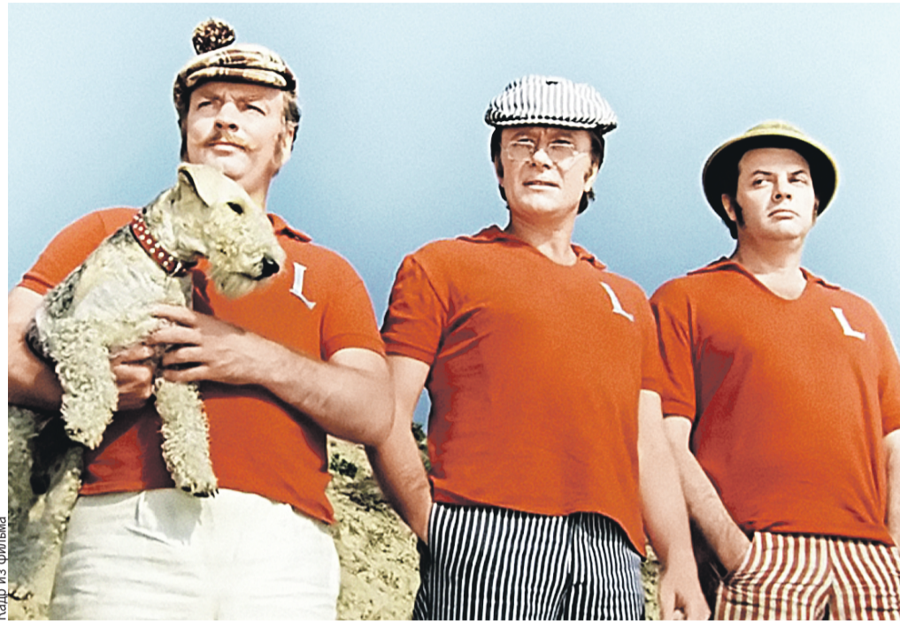
Джордж, Джи и Харрис в исполнении блистательного трио надолго стали для зрителей воплощением английских джентльменов, а их репризы ушли в народ.

«Для большинства телезрителей наши дурашливые, порой наивные сценки и репризы служили отдушиной в их зарегламентированной жизни, – говорил про «Кабачок» сам актер. – Это был оазис, свет