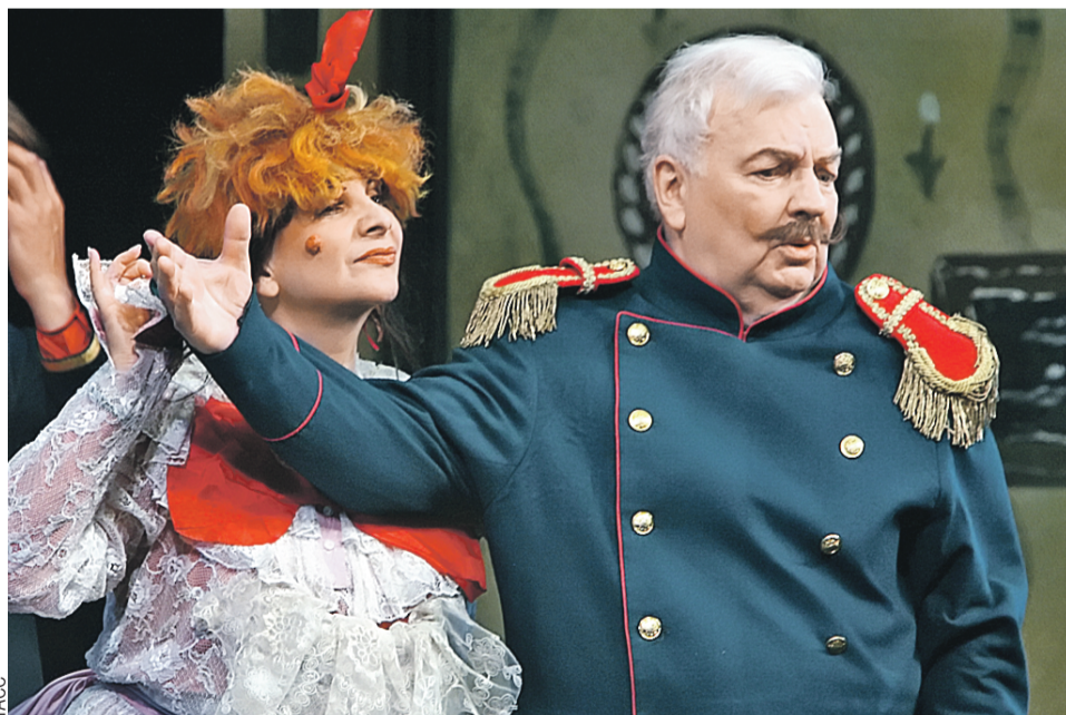
«Ромео мне уже не сыграть, как в молодости хотелось», – не раз говорил артист, но исполнил много других прекрасных ролей на сцене Театра сатиры.

Актер театра и кино, Михаил ДЕРЖАВИН родился в 1936 году в Москве. Окончил театральное училище имени Щукина. Работал в Московском театре имени Ленинского комсомола («Ленком»). С 1967 года – в Театре сатиры, где служил 49 лет и сыграл в десятках спектаклей. Самые яркие фильмы с его участием: «Трое в лодке, не считая собаки», «Зимний вечер в Гаграх», «Бабник», «Настоящий мужчина», «Старые клячи». Народный артист РСФСР, в Москве на Аллее российского кино рядом с «Мосфильмом» была открыта именная звезда Михаила Державина. Награжден орденом «За заслуги перед Отечеством» III степени, орденом Почета и орденом Дружбы.