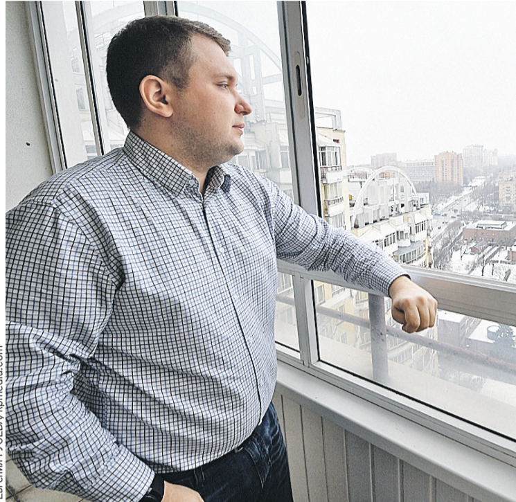
Евгения ГУСЕВА, Kpmedia.com

– Члены нашей комиссии посещали и частные, и государственные школы. Преподаватели-мужчины есть и в России, и в Беларуси, но их мало. На