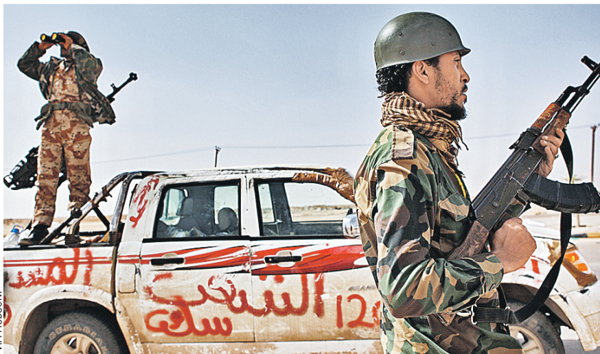
После свержения режима Каддафи жизнь в стране превратилась в хаос.