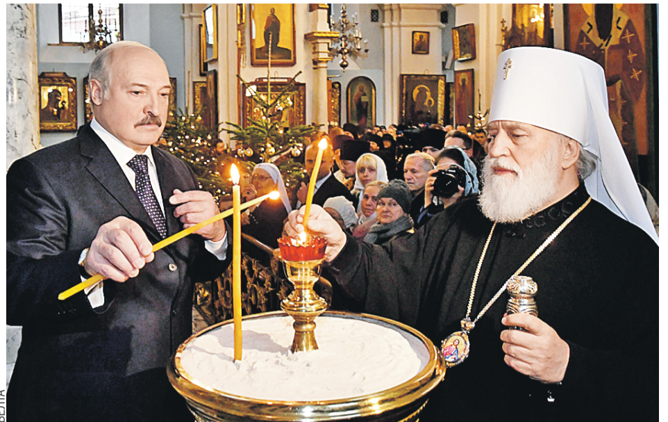
Александр Лукашенко вместе с Митрополитом Павлом зажег рождественскую свечу у Минской иконы Божией Матери в Свято-Духовом кафедральном соборе.

Среди лауреатов – Белорусский союз женщин, который возглавляет заместитель Председателя Парламентского