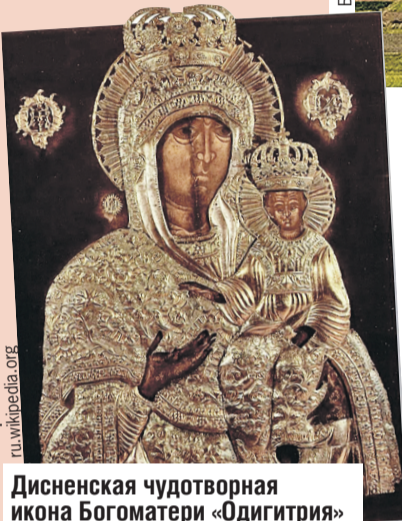
Дисненская чудотворная икона Богоматери «Одигитрия» хранит город и его жителей.

Есть в городе свои чудеса. В белоснежную Свято-Воскресенскую церковь стекаются тысячи паломников. Просят покровительства и заступничества у чудотворной иконы Богоматери «Одигитрия».