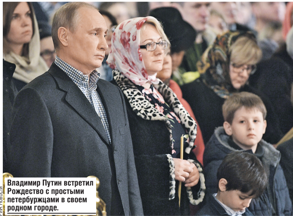
Владимир Путин встретил Рождество с простыми петербуржцами в своем родном городе.