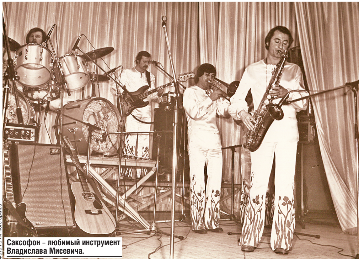
Фото из личного архива