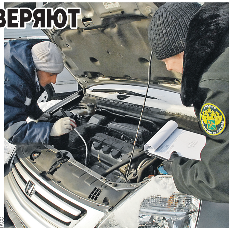
Пограничники смотрели не только документы пассажиров, но и сверяли данные на машины и грузы.

Очевидно, что причиной задержек и очередей на границе в праздники стал большой поток автомобилей, хлынувший из России в Беларусь и европейские страны на каникулы, а потом возвращающихся обратно. Поэтому и пришлось ввести особый