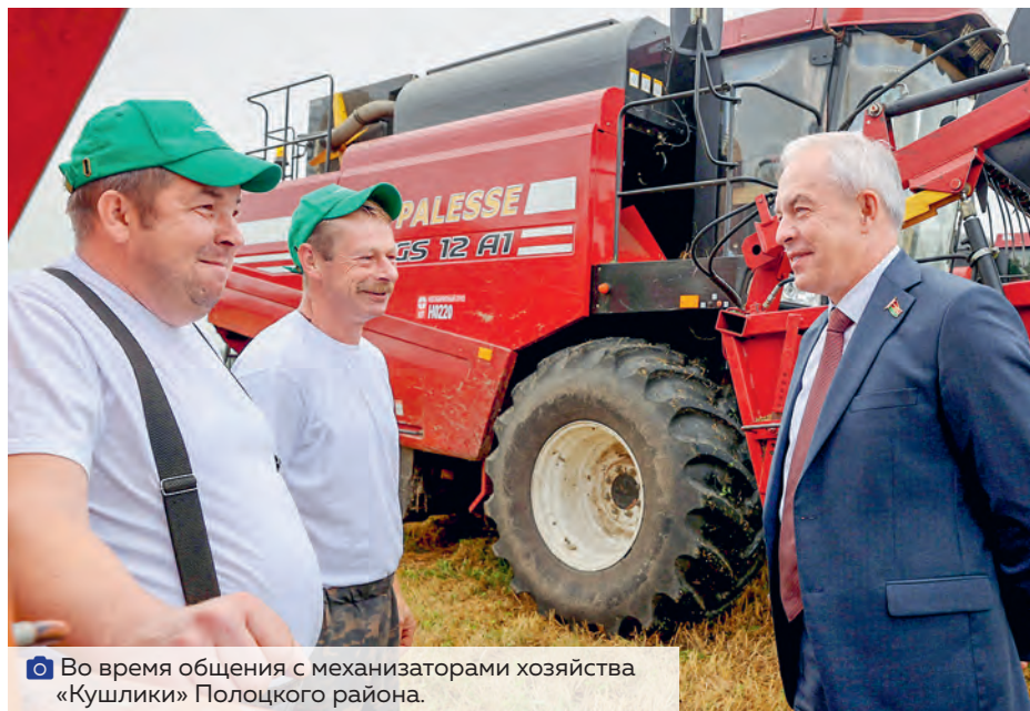
Во время общения с механизаторами хозяйства «Кушлики» Полоцкого района.