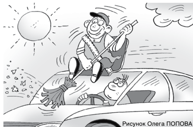
Рисунок Олега ПОПОВА

Компания Tesla получила патент на систему лазерной очистки стекол, которая заменит привычные дворники. Также она сможет очищать солнечные панели на крыше и внешние камеры. Технология получила название «импульсная лазерная очистка». По задумке производителя она сможет самостоятельно распознавать загрязнения и моментально устранять их без какого-либо участия человека. Патент был подан в начале прошлого года. Предполагается, что в условиях хорошей погоды лазеры вполне могут заменить обычные дворники, очищая поверхности без использования химикатов. Однако как они поведут себя в дождь или снег, пока непонятно. Кроме того, лазеры направлены в сторону водителя, что также может мешать вождению. Учитывая, что даже обычные дворники немного отвлекают от дороги, есть высокий риск того, что яркие пучки света станут еще большей помехой. Неизвестно также и будущее этой технологии. Многие системы и функции в итоге не доходят до серийных версий, и посмотреть на них можно максимум на шоукарах.