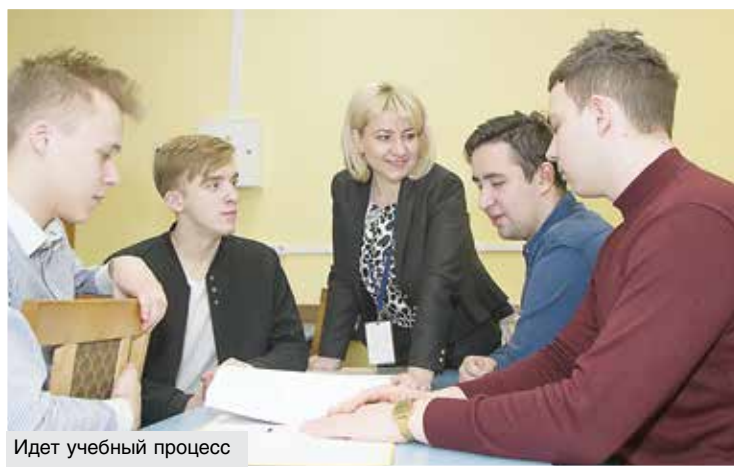
Идет учебный процесс

Валентина ЛАВРИКОВА