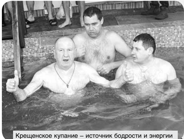
Крещенское купание – источник бодрости и энергии

Многие работники потребкооперации окунулись в проруби