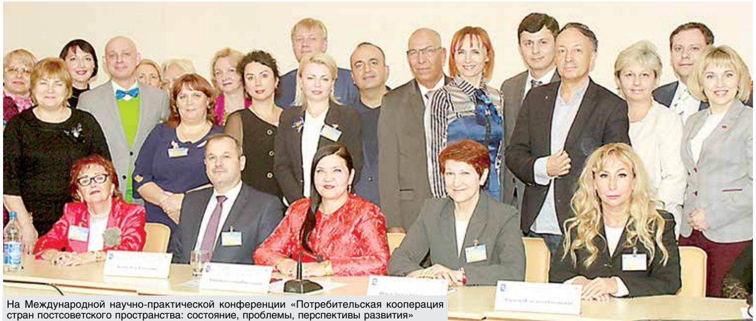
На Международной научно-практической конференции «Потребительская кооперация стран постсоветского пространства: состояние, проблемы, перспективы развития»

Университет славится своими научно-педагогическими школами, известными как в Беларуси, так за рубежом. Совместная