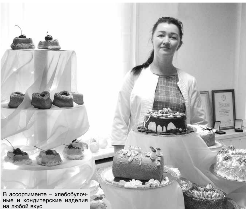
В ассортименте – хлебобулочные и кондитерские изделия на любой вкус

сортимента здесь стало нормой. Ведь, согласитесь, не дело, что до недавних пор выпускалось 4,6 тонны продукции в сутки, а производственные мощности использовались лишь на 36 процентов.