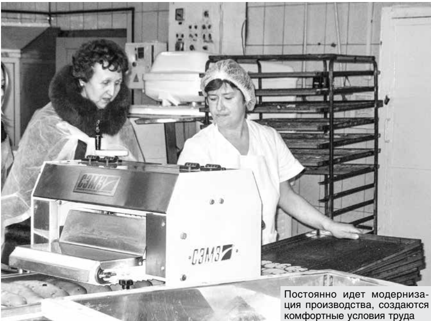
Постоянно идет модернизация производства, создаются комфортные условия труда