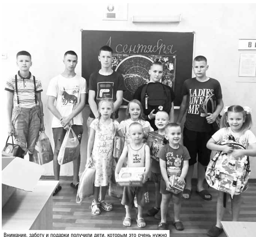
Внимание, заботу и подарки получили дети, которым это очень нужно

РЕБЯТА ИЗ ЧЕРВЕНСКОГО РАЙОННОГО СОЦИАЛЬНО-ПЕДАГОГИЧЕСКОГО ЦЕНТРА ПОЛУЧИЛИ ОТ КООПЕРАТОРОВ ПОДАРКИ К 1 СЕНТЯБРЯ