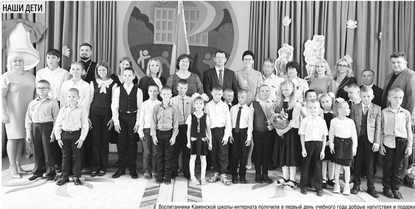
Воспитанники Каменской школы-интерната получили в первый день учебного года добрые напутствия и подарки