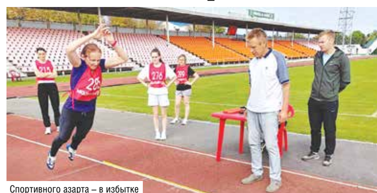
Спортивного азарта – в избытке

В этом году участники и команды в целом показали хороший уровень подготовки, причем