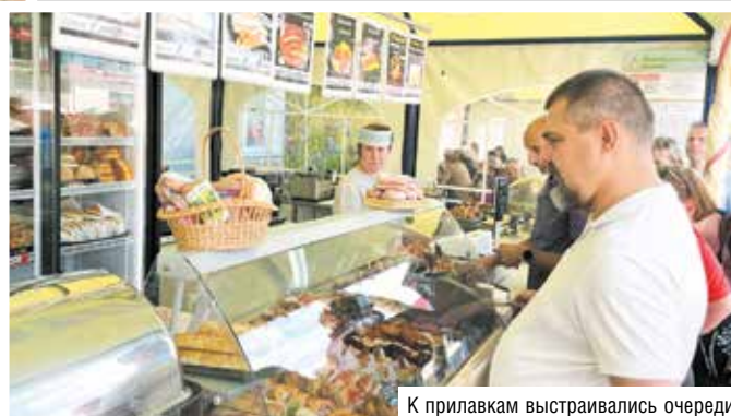
К прилавкам выстраивались очереди