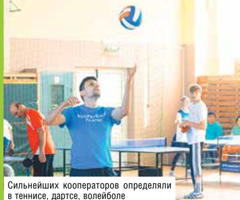
Сильнейших кооператоров определяли в теннисе, дартсе, волейболе