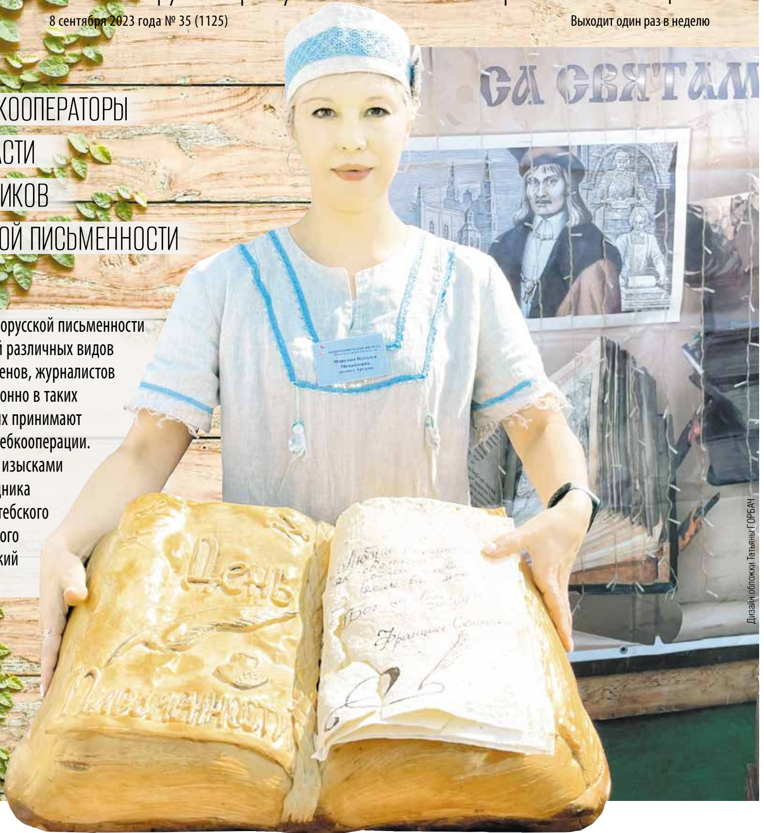
Дизайн обложки Татьяна Г. ОРБАЧ