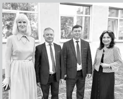
Гостей с подарками принимал и Могилевский торговый колледж