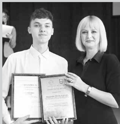
Лучшие учащиеся Барановичского технологического колледжа получили награды