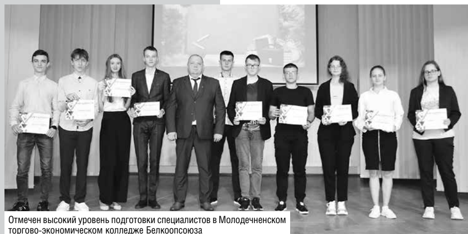
Отмечен высокий уровень подготовки специалистов в Молодечненском торговом-экономическом колледже Белкоопсоюза