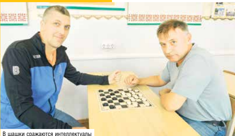
В шашки сражаются интеллектуалы