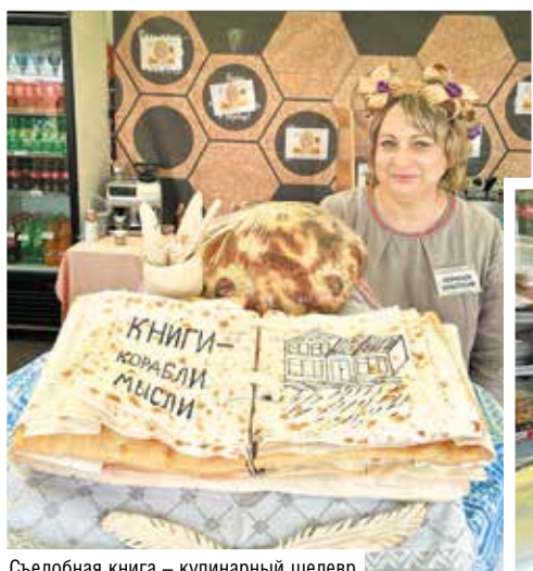
Съедобная книга – кулинарный шедевр