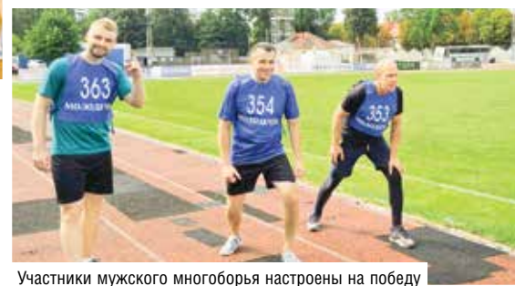
Участники мужского многоборья настроены на победу