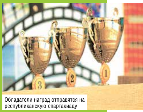
Обладатели наград отправятся на республиканскую спартакиаду