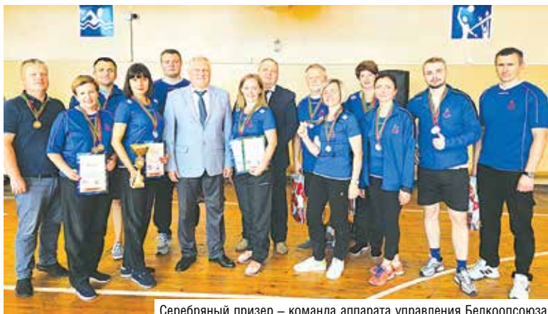
Серебряный призер – команда аппарата управления Белкоопсоюза