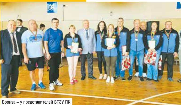
Бронза – у представителей БТЭУ ПК