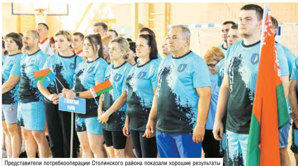
Представители потребкооперации Столинского района показали хорошие результаты

– На работе одни, а здесь совсем другие: раскрепощенные, смеются. На мой взгляд, это здорово. Такие мероприятия для коллектива – это возможность пообщаться и здоровый отдых. Я меньше года работаю в райпо, поэтому мне необходимо немного расслабиться от напряжения новичка, в неформальной обстановке познакомиться с коллегами.