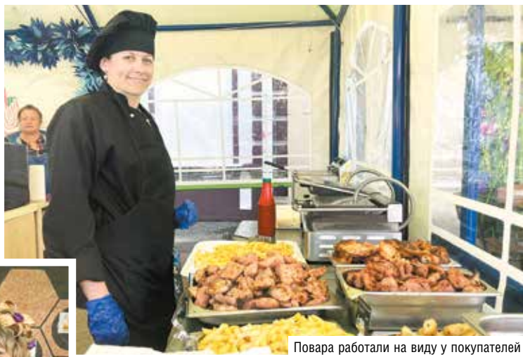
Повара работали на виду у покупателей