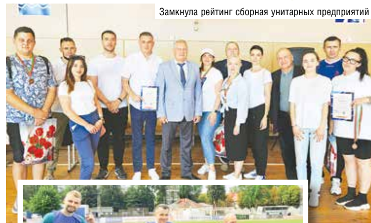
Замкнула рейтинг сборная унитарных предприятий