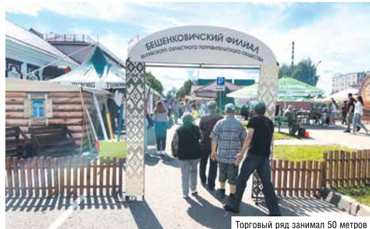
Торговый ряд занимал 50 метров

Это не единственная новинка, которую испекли кооператоры специально для праздника. Каждый желающий мог на па-