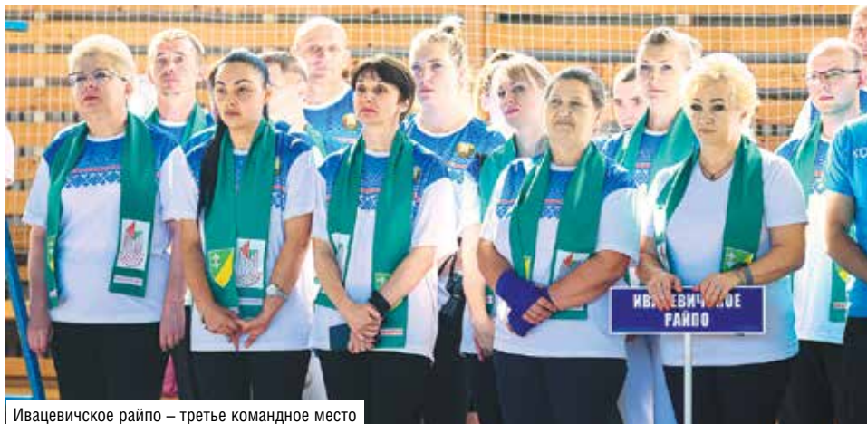
Ивацевичское райпо – третье командное место