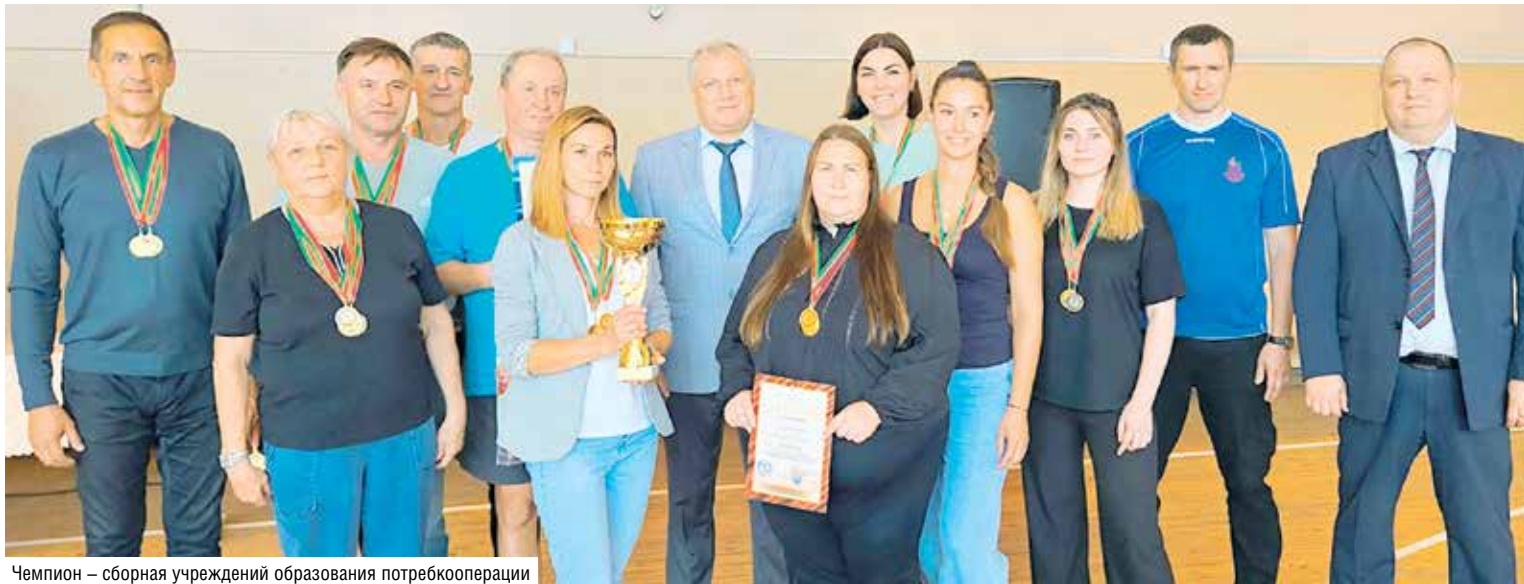
Чемпион – сборная учреждений образования потребкооперации

На днях в Молодечненском торгово-экономическом колледже царила оживленная атмосфера, причем это никак не связано с началом нового учебного года. Здесь проходила спартакиада работников аппарата управления, унитарных предприятий и учреждений образования Белкоопсоюза, собравшая более 100 человек.