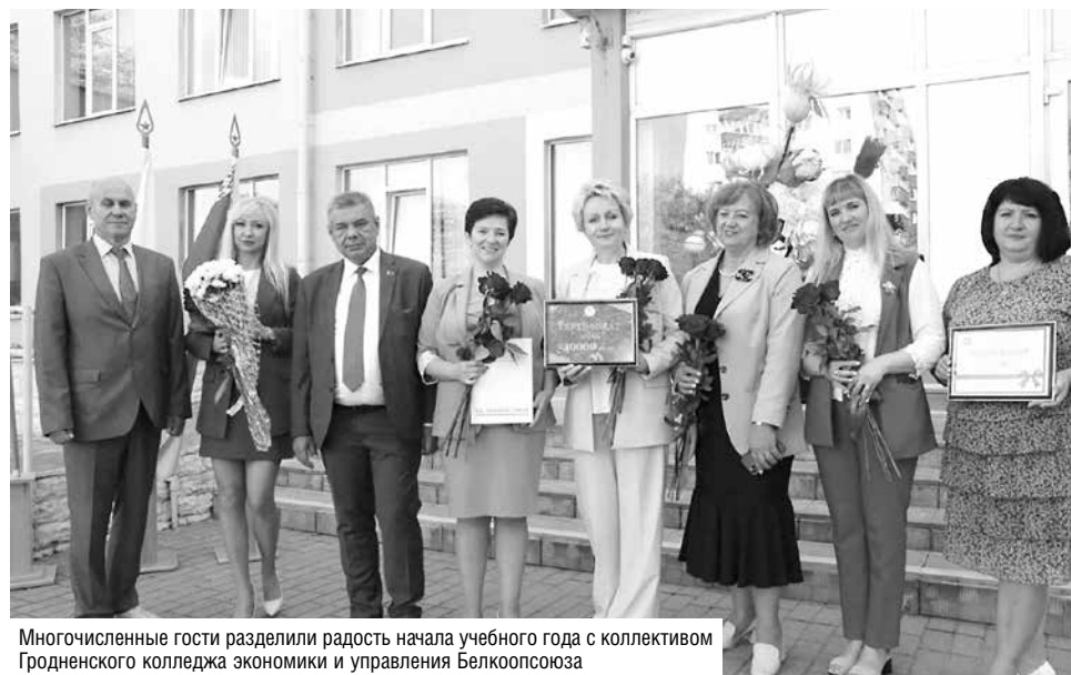
Многочисленные гости разделили радость начала учебного года с коллективом Гродненского колледжа экономики и управления Белкоопсоюза