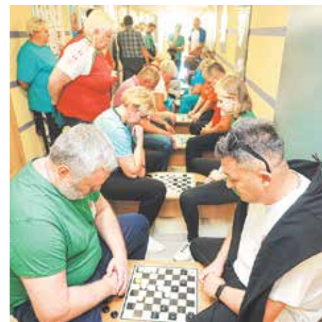
Нешуточные баталии разгорелись на шахматных и шашечных полях

– Спортивный дух у потребкооперации силен. Как показали соревнования по многоборью, бегунов у вас хороших много, они точно не подведут Брестский обл-