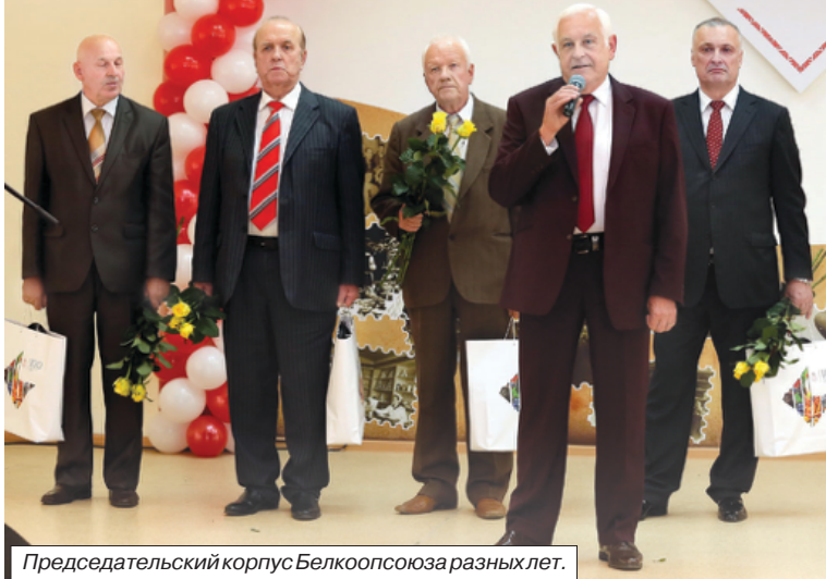
Председательский корпус Белкоопсоюза разных лет.