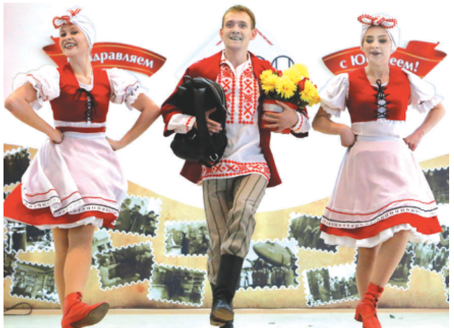
Большую концертную программу для участников юбилейных торжеств подготовили самодеятельные артисты.