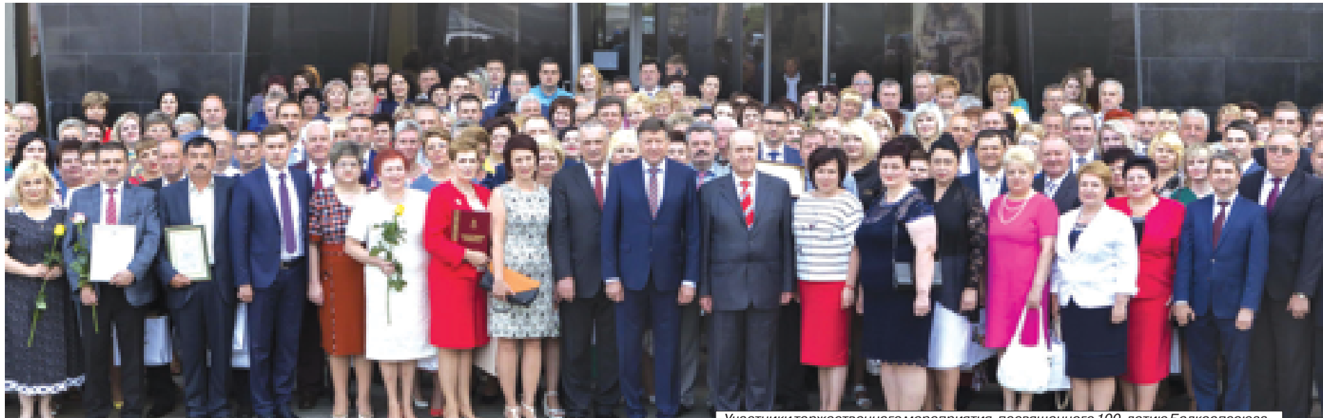
Участники торжественного мероприятия, посвященного 100-летию Белкоопсоюза.