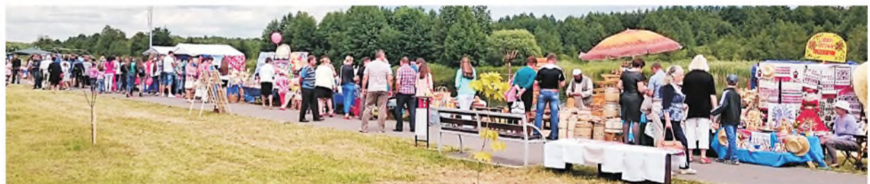
Город ремесленников и подворья хозяйств во время празднования Дня города.

Яна МИЦКЕВИЧ, «СТ» mizkevich@sb.by