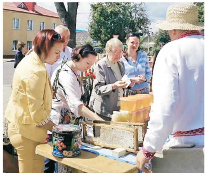
Делегация из Азнакаево пробует продукцию местного лесхоза.

Словом, «Пад адзіным небам», как в этом году назвали праздник, Ивье собрало в буквальном смысле людей не только из разных уголков Ивьевщины и Беларуси, но и всего мира. Впрочем, иначе в этом городке быть не может. Ивье веками считалось местом мирного сосуществования людей разных национальностей и конфессий, Нас поразили ваша чистота и порядок. Благоустройство города, его озеленение, использование малых архитектурных форм — многое мы подсмотрели у вас, и теперь будем думать, как это реализовать у себя. А вообще, когда мы попали на белорусскую землю, то чувствовали себя как дома, потому что ваша природа не так уж сильно