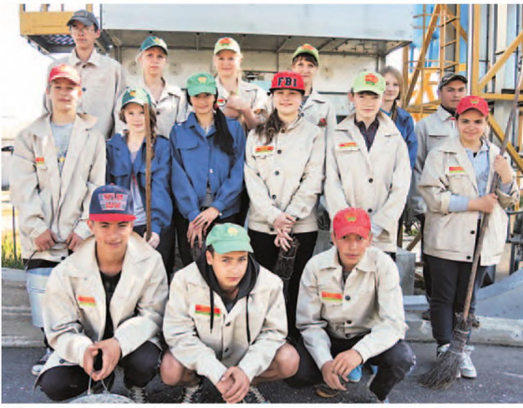
Комсеничский трудовой «десант».

Татьяна БИЗЮК, «СТ» bizuk@sb.by