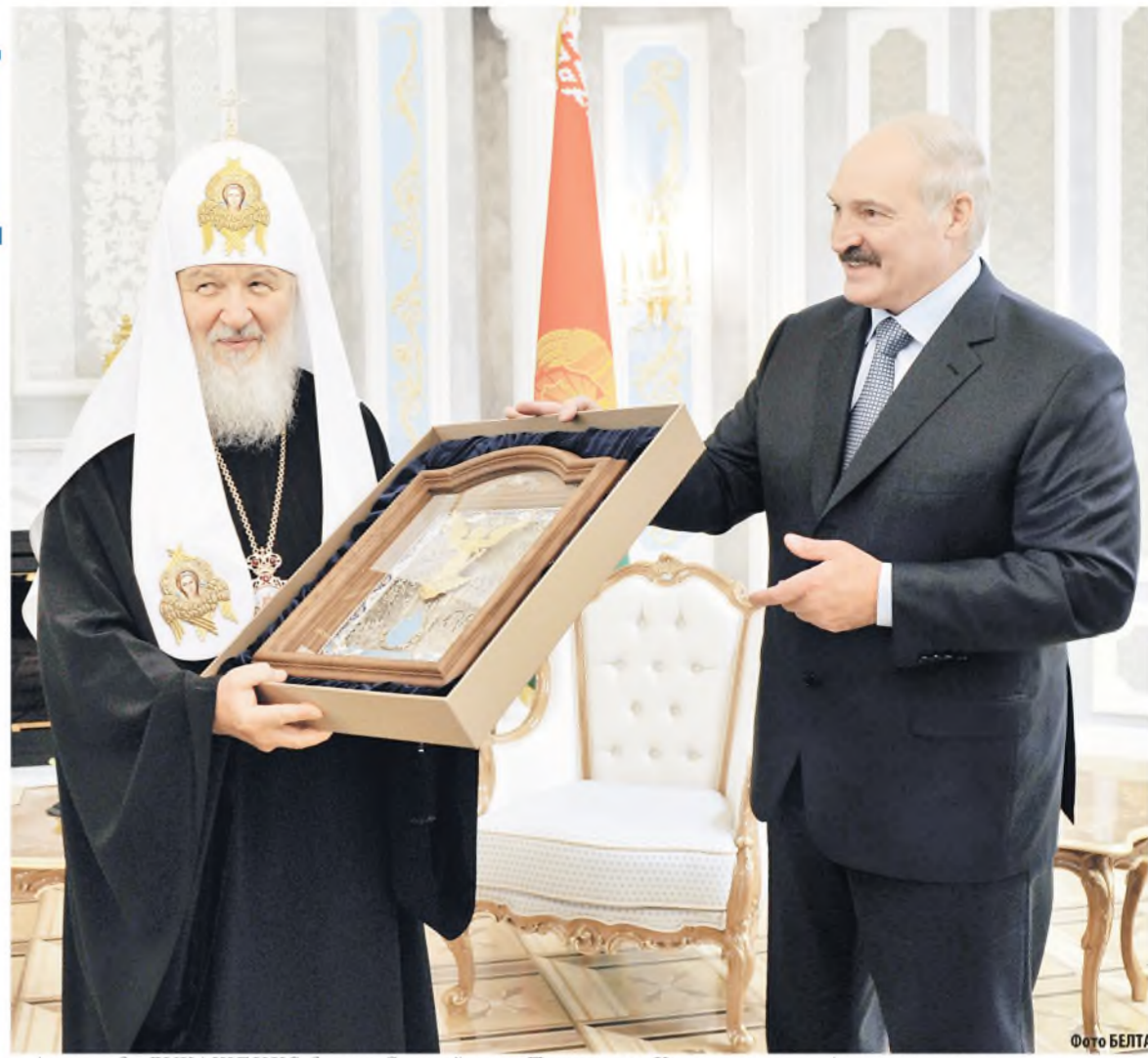
Александр ЛУКАШЕНКО дарит Святейшему Патриарху Кириллу икону «Ангел-хранитель».

является единственной организацией в Украине и единственной силой, которая сохранила миротворческий потенциал, потому что она себя не отождествила ни с одними, ни с другими. Ведь невозможно разделить паству по политическому принципу. Особое тепло минской программе Патриарха и его встрече с Президентом придал душевный обмен подарками. Святейший Патриарх Кирилл вручил Александру Лукашенко орден преподобного Серафима Саровского I степени — награду, которой в разное время удостоивались известные государственные, общественные и религиозные деятели. И передал в дар икону святого равноапостольного князя Владимира. Президент передал в дар Патриарху Кириллу икону «Ангел-хранитель», изготовленную гомельскими мастерами.