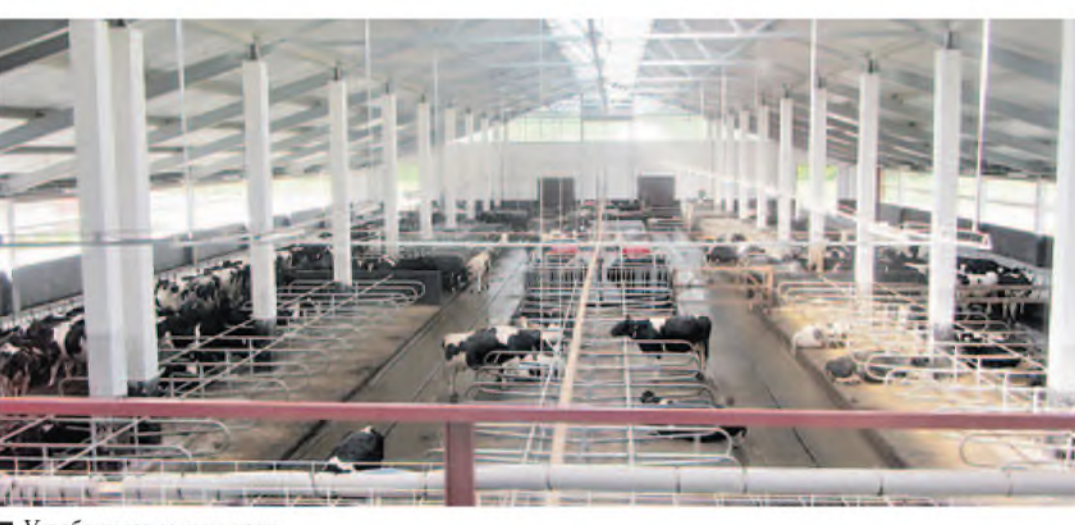
У робатызаваным цэху.

ПАУГОДА назад на ўнітарным вытворчым прадпрыемстве «Вушыца-Агра» Верхнядзвінскага раёна пачаў дзейнічаць малочна-товарны комплекс, дзе дойны статак абслугоўваюць дванаццаць робатаў. Электронна-механічных памочнікаў набыло падшафнае прадпрыемства — мясавы масларызавод, які ўклаў у новабудуёлы больш за сто сорок мільярдаў рублёў. Пакуль на комплексе ўтрымліваецца 630 кароў. Сорок працэнтаў дойнага статака даваўся купіць, астатніх (не ўсякая жывёліна падыходзіць робатам для абслугоўвання) выбіралі ў сабе дома. Камплектаванне комплекса высокаўдойных каровамі працягваецца. Аператары ў цэхах адны мужчыны: Януш Багдановіч, Яўген Хамінскі, Аляксей Лапіцкі, Віктар Іваноў і Сяргей Іжык. Начальнік комплекса Микалай Іваноў, калі падбіраў каманду, улічваў і