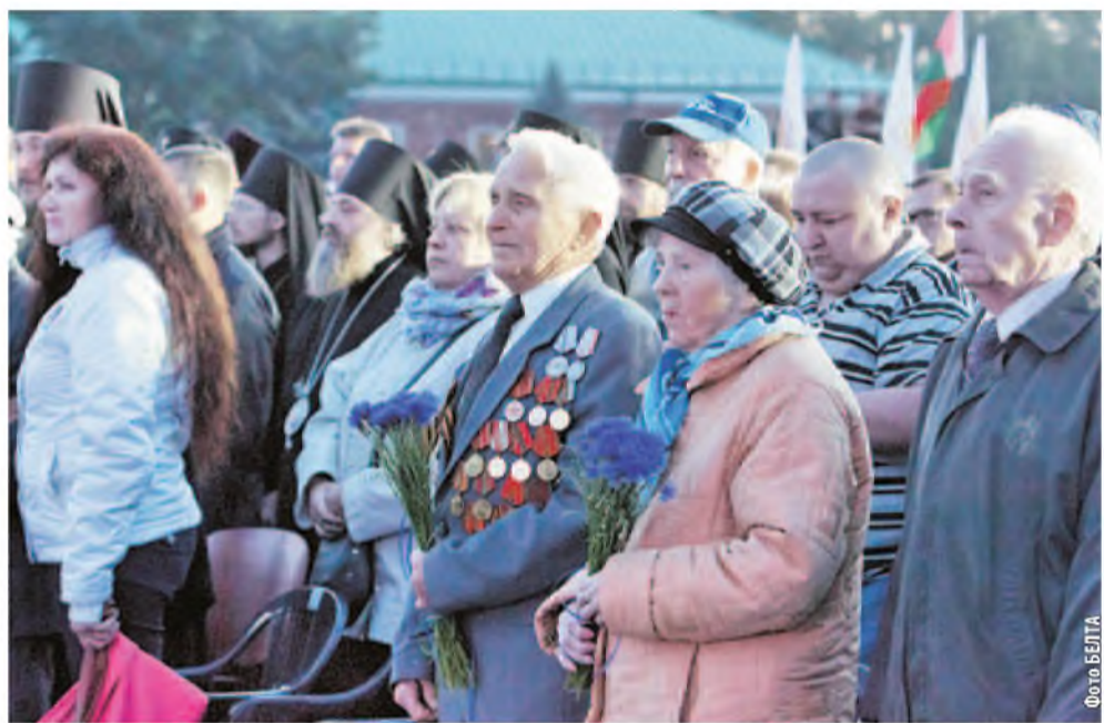
Во время митинга-реквиема.

А накануне Дня всенародной памяти жертв Великой Отечественной войны Брест погрузился в атмосферу предвоенной жизни. По улицам прошли маршем участники военно-исторических клубов, проехала колонна военной техники времен войны. Кроме того,