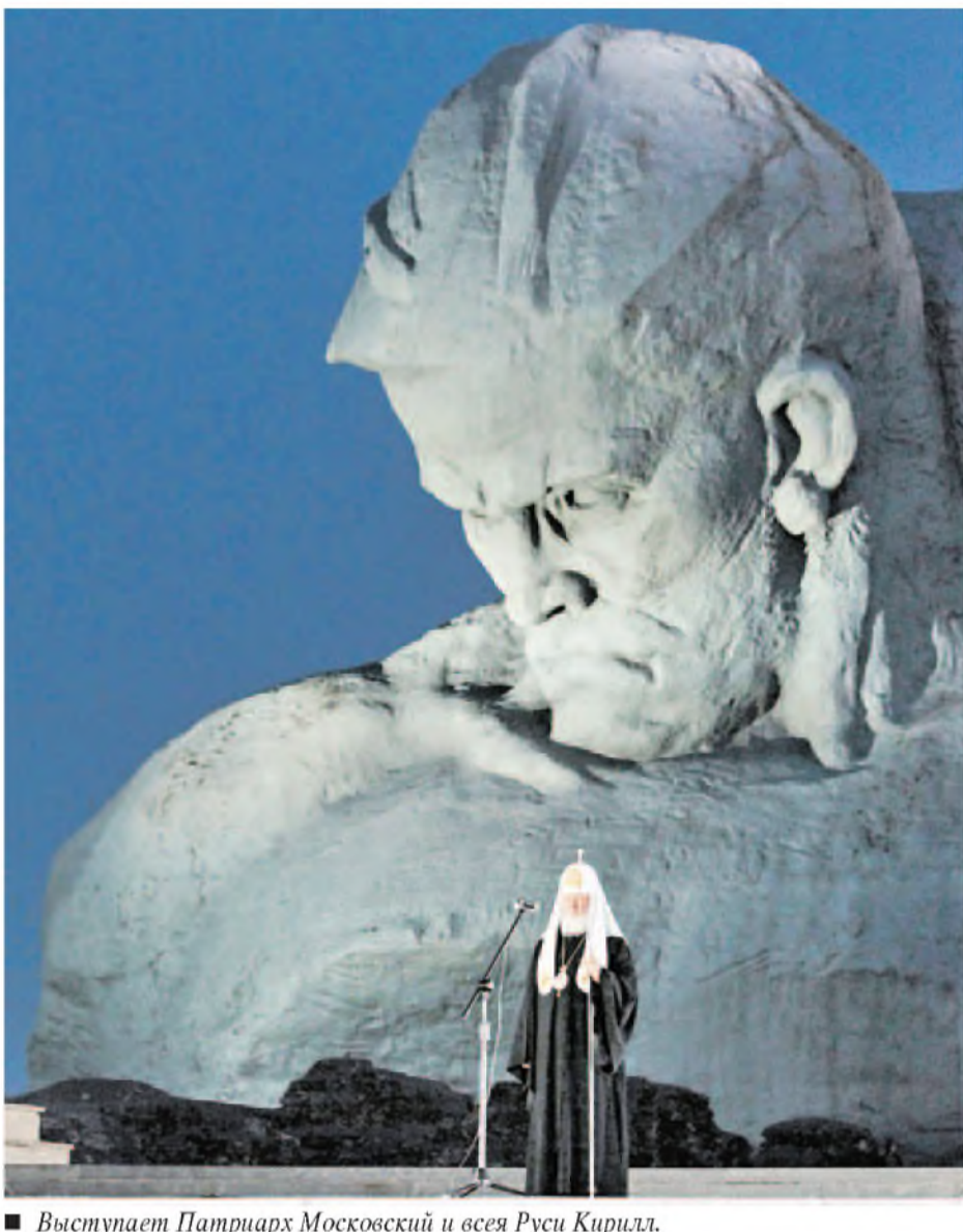
Выступает Патриарх Московский и всея Руси Кирилл.

ПЕРВЫЕ посетители начали приходить в цитадель за два часа до начала траурной церемонии. По предварительным данным, всего в ней участвовали 12 тысяч человек. Символическая дорога памяти, ведущая от главного входа, воссоздавала последние часы мирной жизни: в секции ОСОВИАХИМ стрелки учились разбирать винтовки, напротив, в солдатском клубе 85-го полка, на танцах играл патефон, неподалеку вслух читали доверенные письма красноармейцев на родину. Все было, включая военный патруль и символический КПШ со шлагбаумом, как и тогда, 22 июня 1941 года.