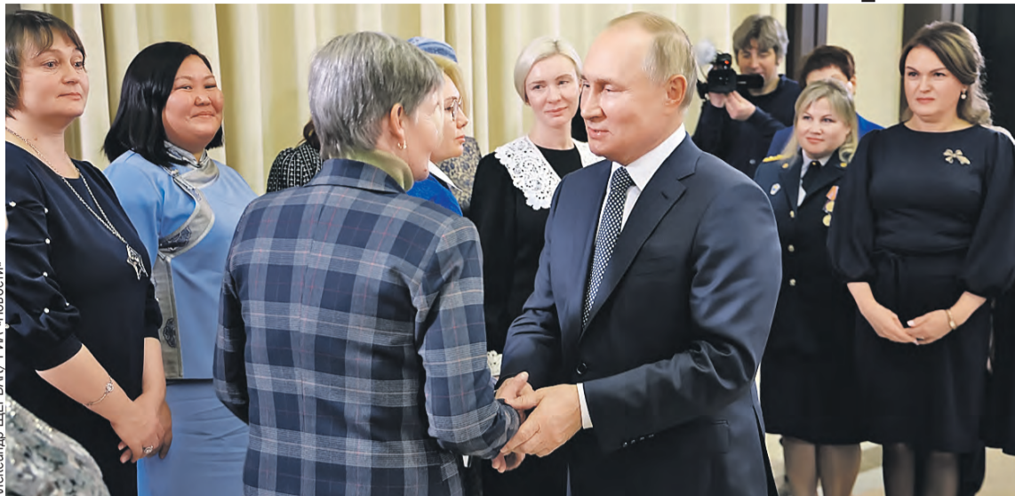
Владимир Путин поблагодарил матерей за то, что они вырастили истинных сынов Родины. И заверил, что цели СВО будут достигнуты.

Это значит, что он из жизни не зря ушел.