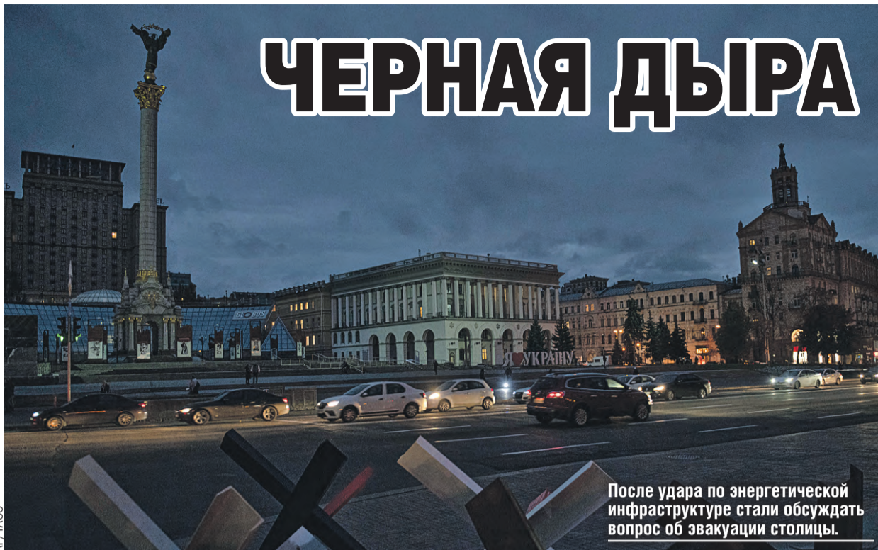
После удара по энергетической инфраструктуре стали обсуждать вопрос об эвакуации столицы.