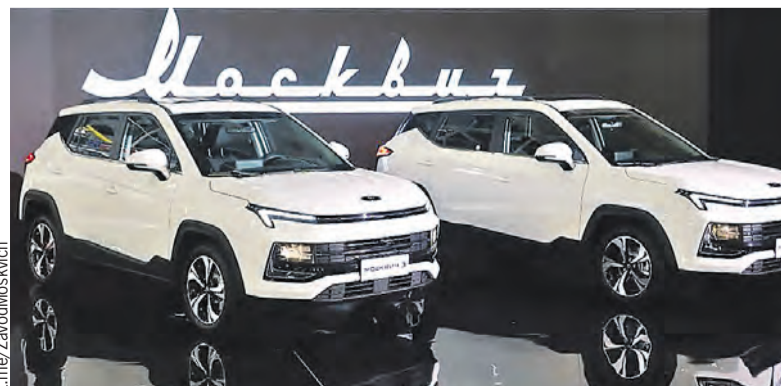
Новинка – компактный кроссовер с мотором мощностью 150 лошадиных сил.