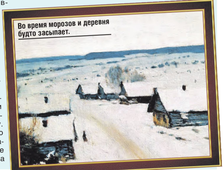
Во время морозов и деревня будто засыпает.

«Зима. Деревня» была написана в 1878 году. Исааку тогда было 18 лет, и это первая из его известных картин. Сейчас она выставлена в Тульском художественном музее.