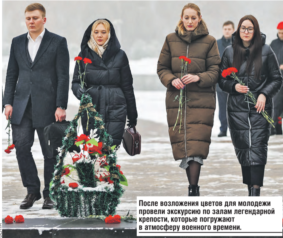
После возложения цветов для молодежи провели экскурсию по залам легендарной крепости, которые погружают в атмосферу военного времени.

– У меня большой опыт в реализации государственной молодежной политики в Беларуси. С 14 лет состою в БРСМ, был вторым секретарем Брестского областного комитета. У меня есть опыт в реализации патриотических мероприятий, волонтерских проектов, организации студотрядовского движения.