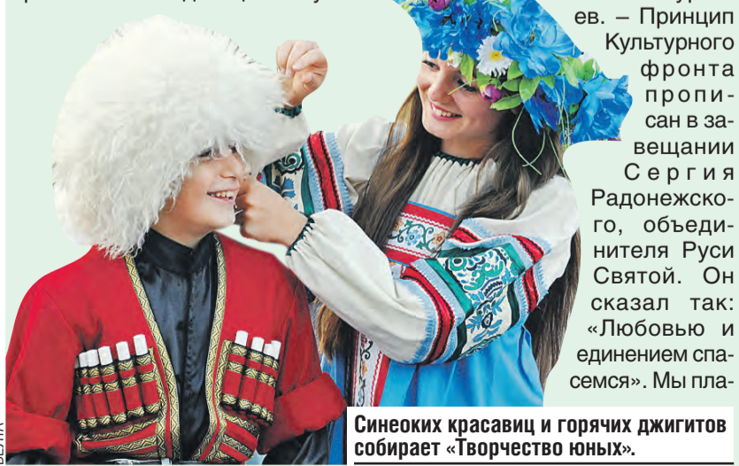
Синеоких красавиц и горячих джигитов собирает «Творчество юных».

О союзной «автогражданке» читайте подробнее в следующем номере «Союзного вече».