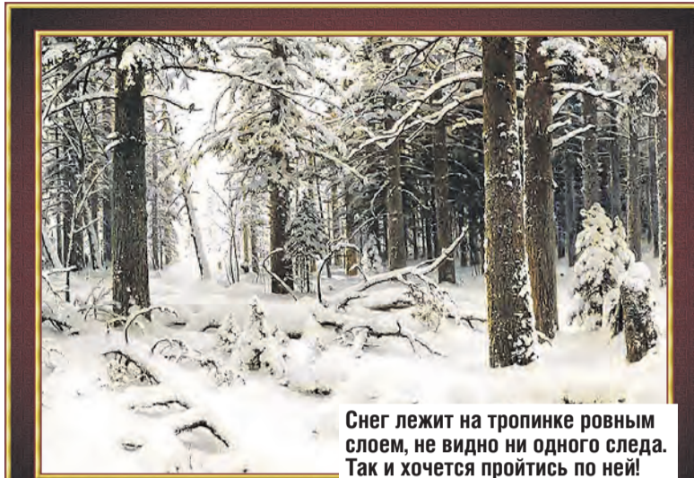
Снег лежит на тропинке ровным слоем, не видно ни одного следа. Так и хочется пройти по ней!

Пластов вообще любил изображать сюжеты из сельской жизни. А это полотно написал в 1946 году в деревне Прислонихе Ульяновской области. Сейчас оно находится в постоянной экспозиции Тверской картинной галереи, но и попутешествовало по миру немало. В том числе побывало на биеннале в Венеции.