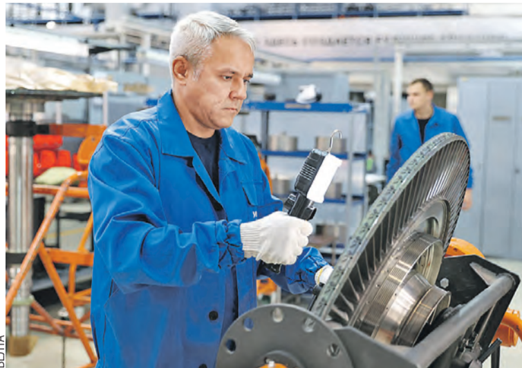
С комплектующими проблемы решаются, даже помогают заводам в Беларуси.

Сейчас СВО. Думали, наш автопром не поднимется. А у нас четыре предприятия в Белебее работают на авто-