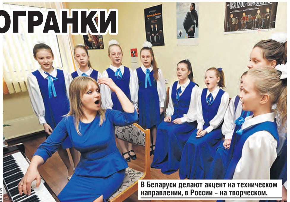
В Беларуси делают акцент на техническом направлении, в России – на творческом.

– Оркестр состоит из 112 человек. Семьдесят из них россияне, тридцать – белорусы. Вместе с ними в коллектив входят 12 пре-