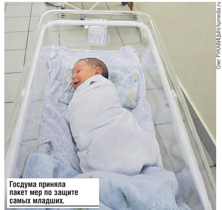
Госдума приняла пакет мер по защите самых младших.