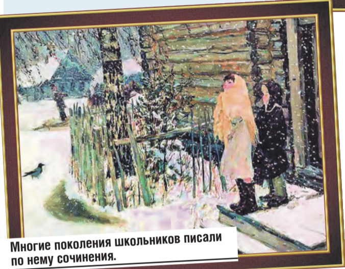
Многие поколения школьников писали по нему сочинения.

Картина «Зима» была написана в 1890 году. Достаточно одного взгляда на полотно, чтобы почувствовать всю красоту, холодное спокойствие и по-своему торжественную атмосферу. Мастерски переданная Шишкиным с помощью серых и желтых тонов игра света показывает, что зимний лес все-таки не совсем безжизненный. Присмотревшись, можно заметить на ветке небольшую птичку. Полотно находится в Русском музее.