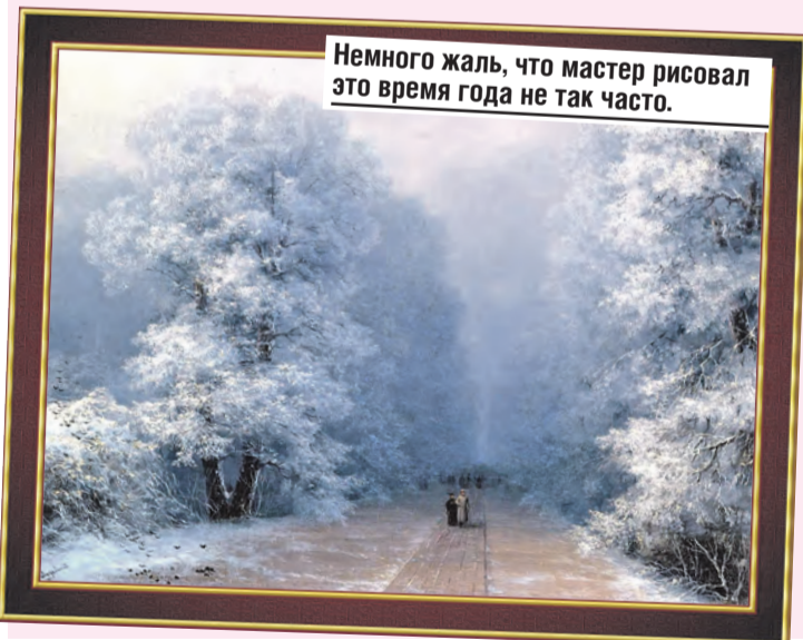
Немного жаль, что мастер рисовал это время года не так часто.

Чтобы создать покрытый снегом лес, мастер использовал серебро – так он добился эффекта отражающегося холодного солнца. Картина озарена светом, исходящим от заснеженных крон деревьев. В «Зимнем пейзаже» множество оттенков – белого, голубого, розового, серого, черного цветов. Их умелое сочетание дает возможность передать оглушающую тишину этого времени года. Полотно находится в частной коллекции, оно было продано на русских торгах Sotheby's.