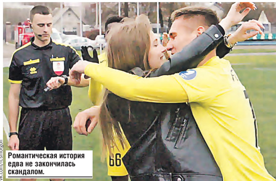
Романтическая история едва не закончилась скандалом.

В следующем году ребятам предстоит сыграть в Д2, а там, глядишь, и до элиты недолго. Уникальность ситуации в том, что Долбизно – это... маленький поселок (буквально пара улиц) в Брестской области на самой границе с Польшей. Одна из главных его достопримечательностей – современный фитнес-центр, стадион и команда «Нива». За всей этой спортивной радостью стоит бывший колхоз имени Дзержинского (сейчас – «АгроНива»). Живут и трудятся в Долбизно реалисты, но и им не запрещено мечтать и воплощать чаяния в реальность.