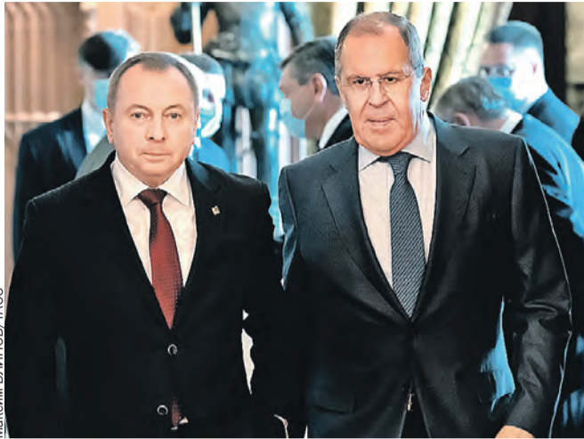
Владимир Макей и Сергей Лавров были не просто коллегами, за десять лет они стали единомышленниками.

– Дипломат, патриот и настоящий друг России. Он немало усилий прилагал для сохранения и развития дружественных отношений между нашими странами, всег-