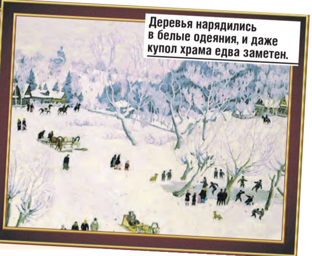
Деревья нарядились в белые одеяния, и даже купол храма едва заметен.

С 1908 по 1958 год у художника был дом в подмосковном Лигачеве. Многие прекрасные картины написаны именно там, как и «Волшебница». Ее он создал в 1912 году – тогда Юон был молодым, полным сил художником, который искал собственные темы и пробовал новое. Шедевр тоже выставлен в Русском музее.