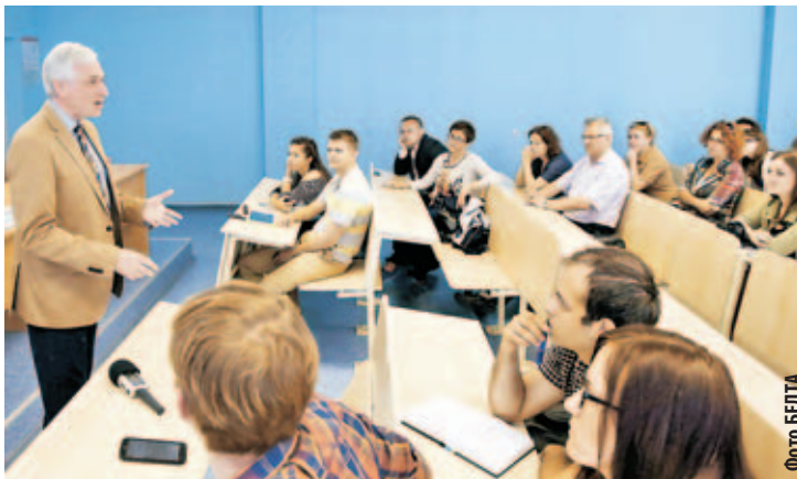
■ Международный обозреватель, ведущий телепрограммы «Документальное кино Леонида Млечина» на телеканале «ТВ Центр» Леонид МЛЕЧИН дает студентам журфака мастер-класс.

Главный редактор газеты «Вечерняя Москва» Александр Куприянов свой урок посвятил влиянию блогосферы на традиционную журналистику и тому, какие могут быть последствия в результате такого сосуществования. Способна ли традиционная печатная журналистика принять современные вызовы? Александр Иванович в этом не сомневается: «Люди верят мнениям экспертов, опубликованным на страницах газет, они хотят читать материалы, написан-