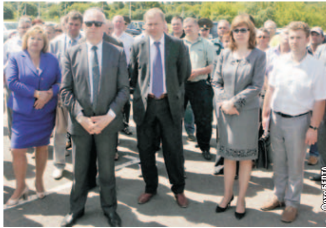
■ Участники заседания на месте проведения праздника.

Празднование, как передает БЕЛТА, начнется 4 июля с открытия выставки-ярмарки. Наградят во время форума и передовиков агропромышленного комплекса Могилевской области.