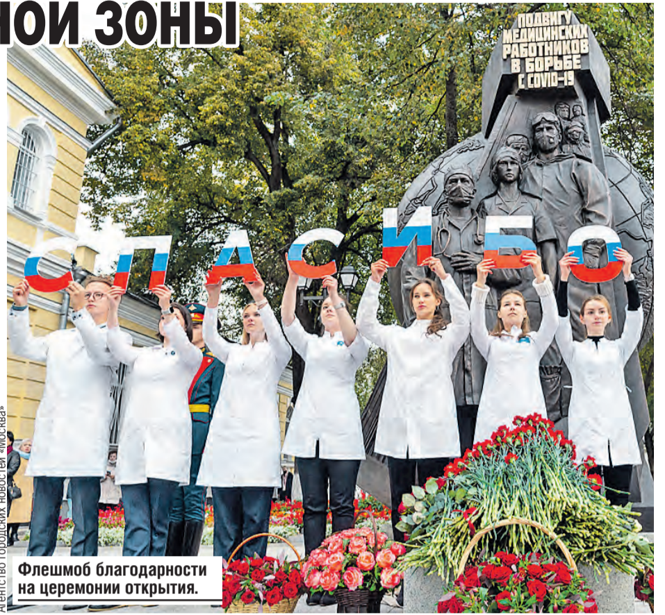
Флешмоб благодарности на церемонии открытия.

– К сожалению, кого-то из них не стало – потому, что они были на боевом посту, – сказала она. – Но память о победителях останется в веках.