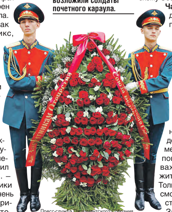
Пресс-служба Парламентского Собрания

Венок от депутатов возложили солдаты почетного караула.