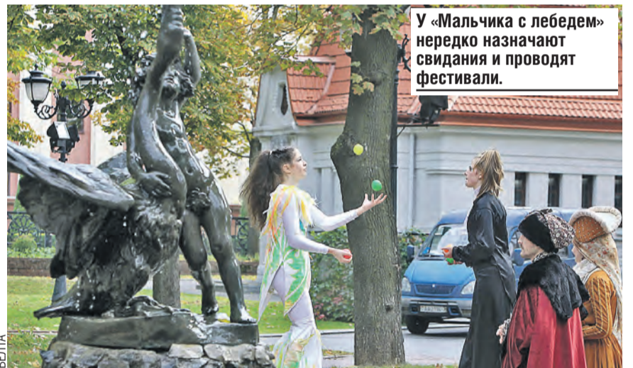
У «Мальчика с лебедем» нередко назначают свидания и проводят фестивали.

Сохранились в городе и дом полководца, и деревянная церковь, в которой он молился по воскресеньям, и даже его любимый парк. Среди усыпанных разноцветной листвой дорожек разгуливают павлины. А любой современный житель Кобрин укажет на пруд, где купался Александр Васильевич. Не миф, исторический факт!