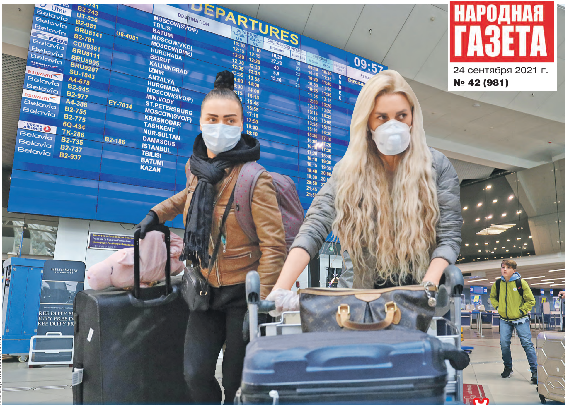
Александр КУЛЕВСКИЙ, БЕЛТА

НАРОДНАЯ ГАЗЕТА 24 сентября 2021 г. № 42 (981)