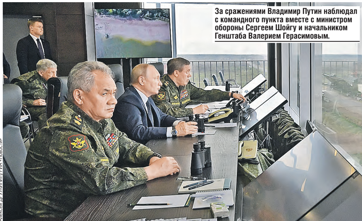
За сражениями Владимир Путин наблюдал с командного пункта вместе с министром обороны Сергеем Шойгу и начальником Генштаба Валерием Герасимовым.