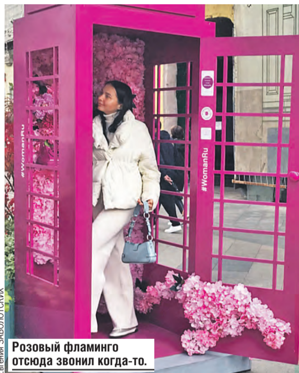
Розовый фламинго отсюда звонил когда-то.

Двое победителей конкурса получили в подарок планшеты. Вручался и приз зрительских симпатий – набор садовых инструментов. Эти награды получили те, кто создал интересные цветники, а также творчески подошел к работе. Так, участники из Вешняков переоделись в Лису Алису и Кота Базилио. После того как «Цветочный джем» завершится, цветники пересадят в парки.