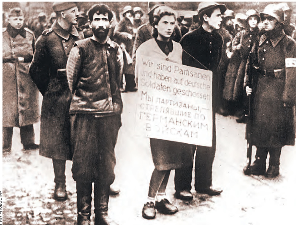
Минское подполье сопротивлялось фашистам, несмотря на террор и казни.

здания, объекты инфраструктуры. Все ценное оборудование – паровые котлы, турбины, передвижные электростанции, металлорежущие станки, деревообрабатывающее оборудование – вывозили в западном направлении. Такая же участь постигла и колхозы. Имущество, скот, зерно вывозили в Германию.