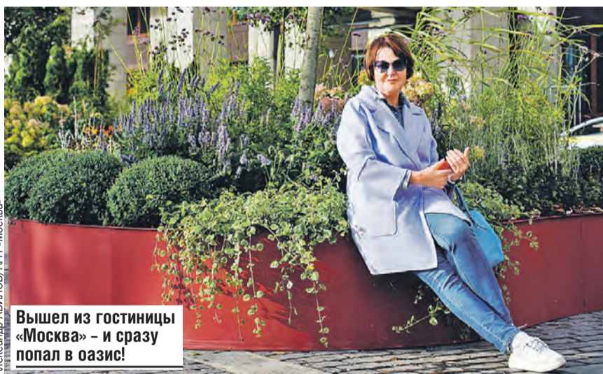
Вышел из гостиницы «Москва» – и сразу попал в оазис!

При этом, когда находишься в саду, озеро воспринимается как пол. А на нем стоят кубы-аквариумы с нимфеей, лилиями и другой водной флорой.