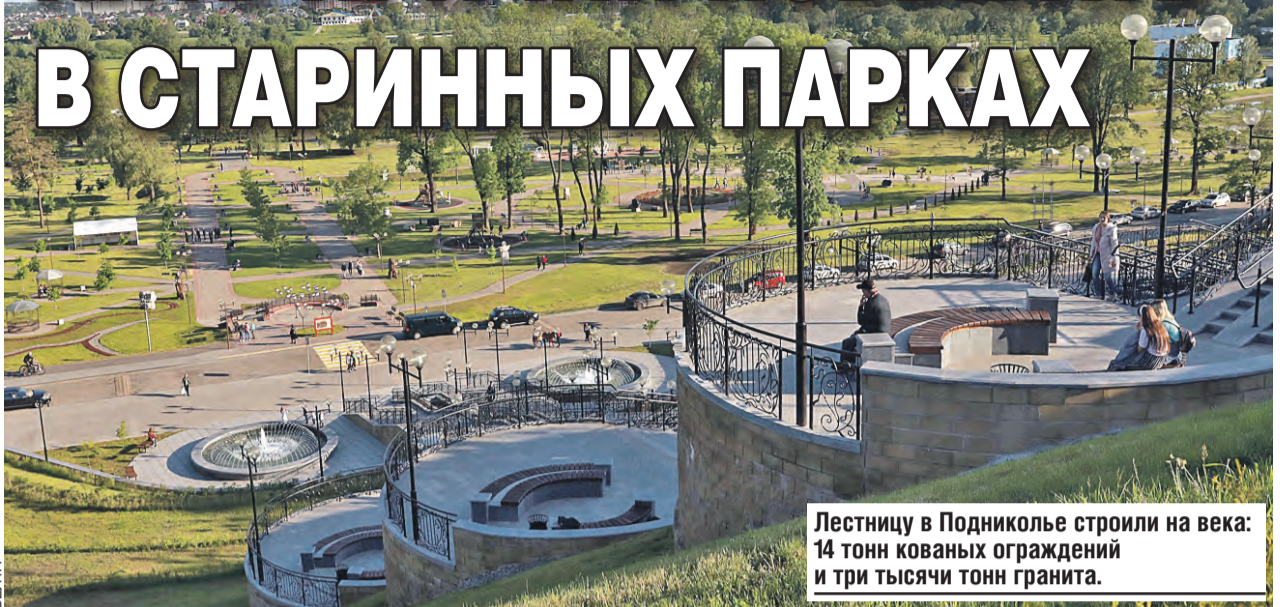
Лестницу в Подниколье строили на века: 14 тонн кованых ограждений и три тысячи тонн гранита.