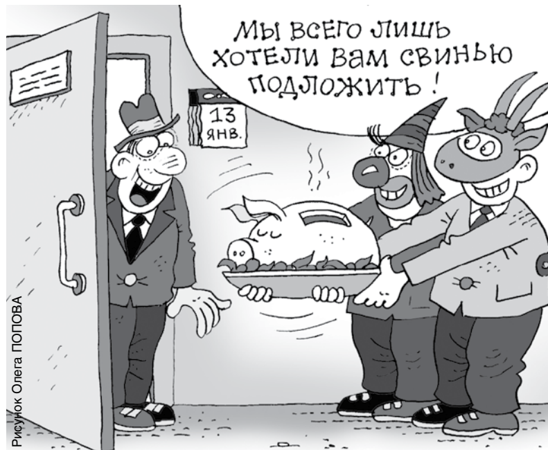
Рисунок Олега ПОПОВА

В эти дни славяне отмечают один из самых любимых периодов года – Большие зимние святки, которые продолжаются двенадцать дней.