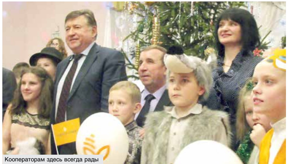
Кооператорам здесь всегда рады

В школе 74 ученика. Прямо в день утренника оформили еще двоих – таковы, увы, реалии жизни. Педагоги и воспитатели