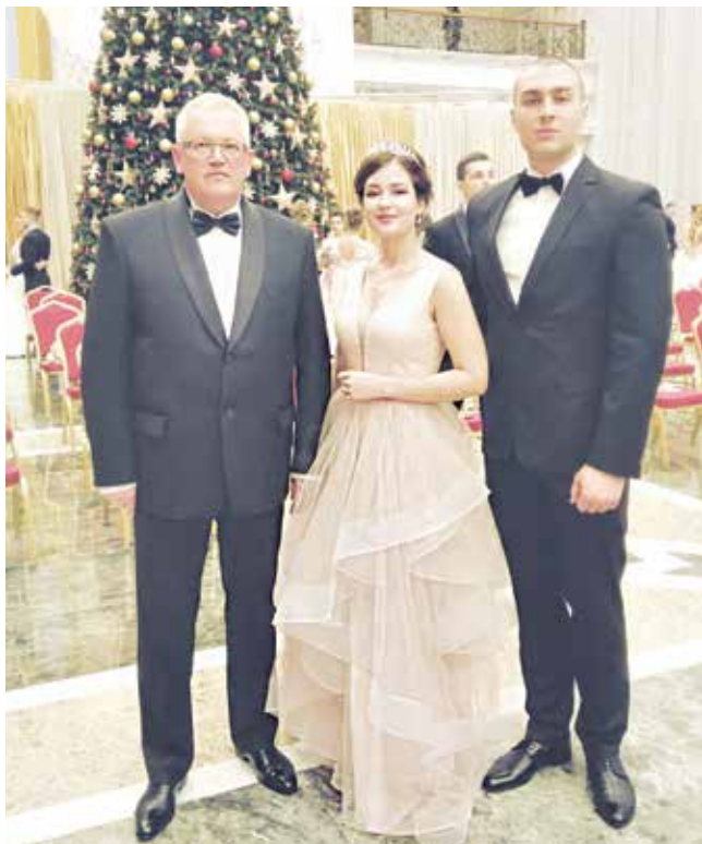
Дарина и Никита с министром образования Игорем КАРПЕНКО

– Будучи совсем маленькой, я обожала сказки, в которых девушки, превращаясь в прекрасных принцесс, отправлялись на бал, где танцевали ночь напролет. Так у меня появилась мечта. Время шло, я выросла и наконец осуществила ее. Я на настоящем балу! В первые минуты пребывания во Дворце Независимости невозможно не изумиться великолепию и атмосфере, которая царит там. Два месяца под-