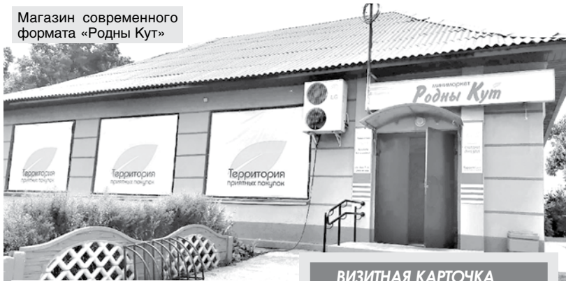
Магазин современного формата «Родны Кут»

– У магазинов райпо много конкурентов других форм собственности. Поэтому мы ведем активную работу по модернизации торговых