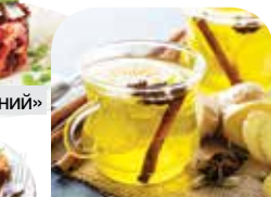
Напиток горячий с имбирем и лимоном