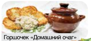
Горшочек «Домашний очаг»