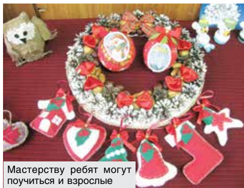
Мастерству ребят могут поучиться и взрослые