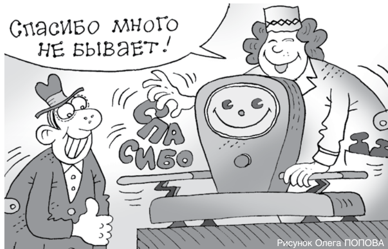
Рисунок Олега ПОПОВА

11 января можно без преувеличения назвать одной из самых «вежливых» дат в году – это Международный день «спасибо».