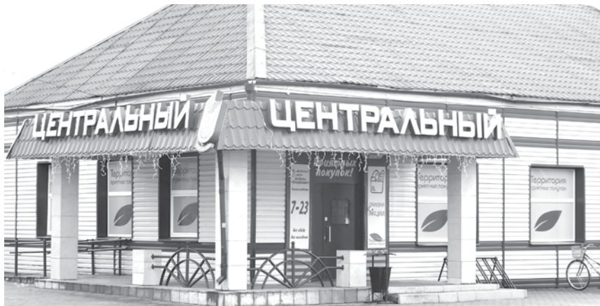
В магазине «Центральный» в Дрибине заменили оборудование

Современный магазин – не только территория покупок, но еще и источник новых эмоций и хорошего настроения. Причем неважно, в мегаполисе или в сельской глубинке. Как сделать, чтобы ожидания покупателя не расходились с реальностью? Чем заинтересовать? Ответы на эти вопросы знают в Дрибинском райпо, которое по итогам 2017-го было отмечено на Доске почета родной Могилевщины. А еще через год стало одним из победителей в республиканском соревновании.