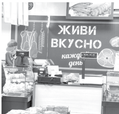
Для покупателей создали максимум комфорта

Сегодня практически у каждого жителя Дрибины есть карта лояльнос-