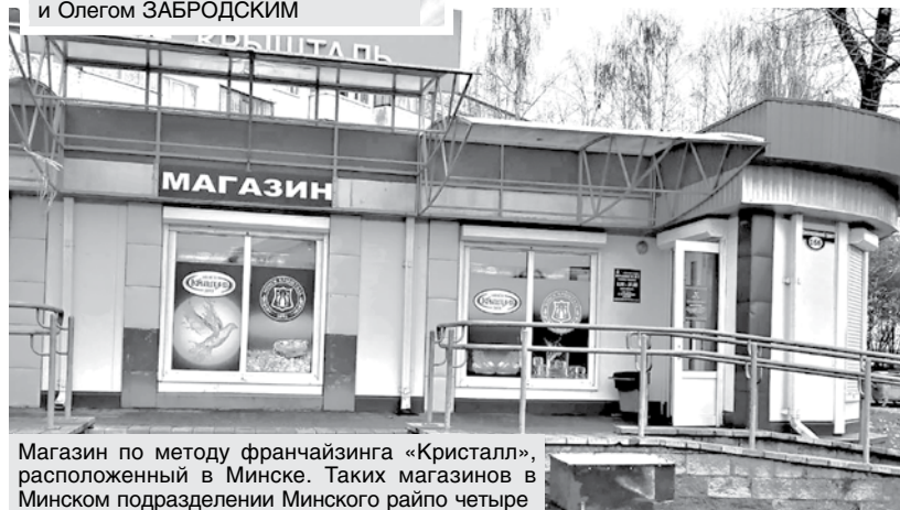
Магазин по методу франчайзинга «Кристалл», расположенный в Минске. Таких магазинов в Минском подразделении Минского райпо четыре