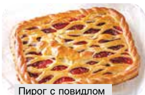
Пирог с повидлом