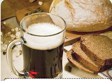
Напиток «Колосок» — 0,89 руб.

Еженедельно Белкоопсоюз проводит акцию «Блюдо недели» белорусской кухни в сети ресторанов потребительской кооперации. Так, в июне 2017 года посетителям предлагаются следующие блюда по специальной цене: