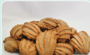
Печенье «Витебское» (1 кг) — 5,29 руб.

С 1 по 31 июня 2017 года Белкоопсоюз предлагает своим покупателям в каждом универсаме потребительской кооперации, расположенном в г. Минске, областных и районных центрах, а также в крупных населенных пунктах, по доступным специальным акционным ценам кондитерские и кулинарные изделия: