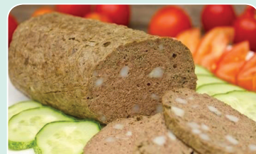
Колбаса из печени (полуфабрикат, 1 кг) — 7,09 руб.

Рады вас видеть в торговых объектах Белкоопсоюза! Ирина ЖИГАЛКО, главный технолог отдела общественного питания Белкоопсоюза