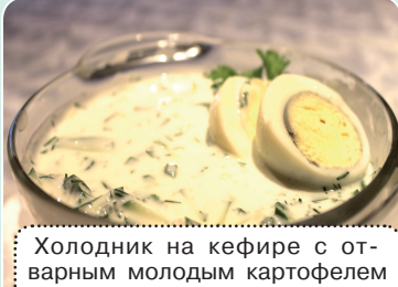
Холодник на кефире с отварным молодым картофелем — 1,39 руб.