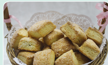
Печенье «Домашнее» (1 кг) — 4,99 руб.