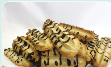
Печенье «Королевское» (1 кг) — 6,59 руб.