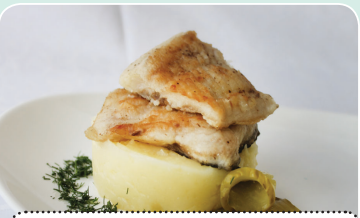
Карп жареный на подушке из картофельного пюре с соленым огурцом — 2,59 руб.

Эти вкусные блюда можно попробовать в ресторанах потребительской кооперации по всей республике. Приходите к нам и открывайте для себя блюда белорусской кухни!