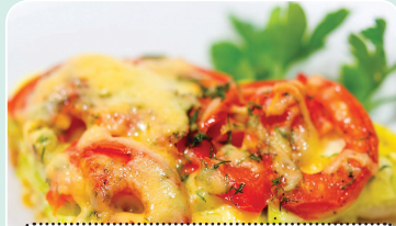
Птица, запеченная с помидорами, с капустой цветной под соусом — 2,69 руб.