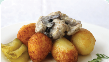
Поджарка «Любительская» с картофелем «Радзивиловским» и соленым огурцом — 3,19 руб.