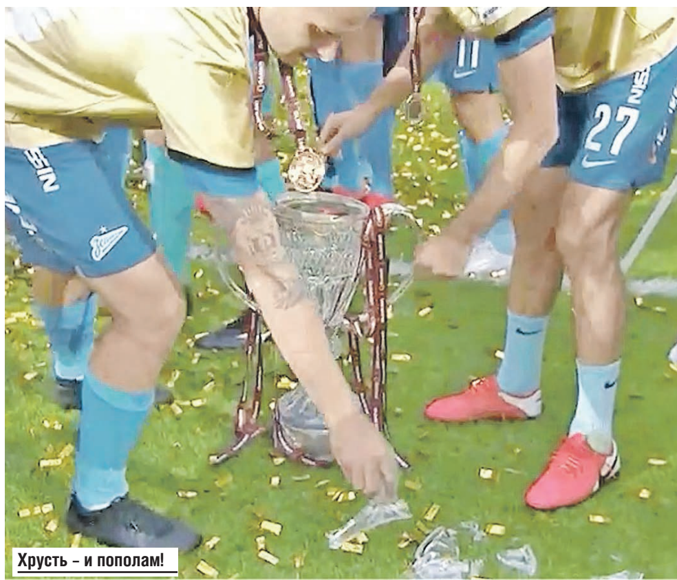
Хрусть – и пополам!