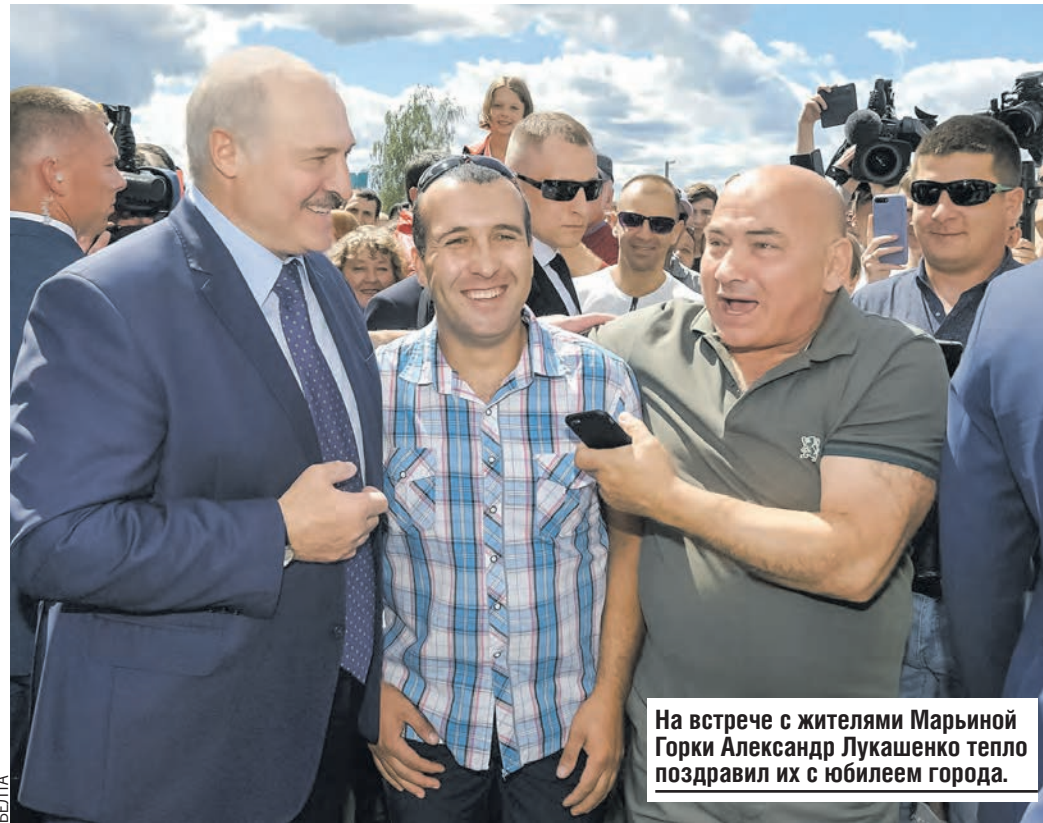
На встрече с жителями Марьиной Горки Александр Лукашенко тепло поздравил их с юбилеем города.

– Принято, что гости приходят с подарком, а хозяйка всегда угощает чем-то вкусным. Чем известна Марьина Горка? Мороженым своим, – председатель Минобл-