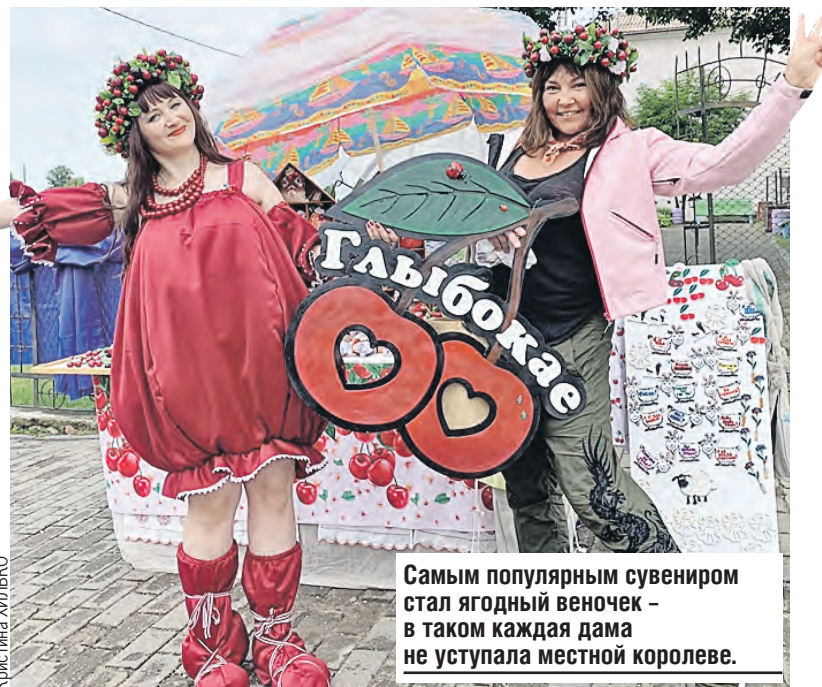
Самым популярным сувениром стал ягодный венок – в таком каждая дама не уступала местной королеве.

Вишневые ритмы подхватили популярные белорус-