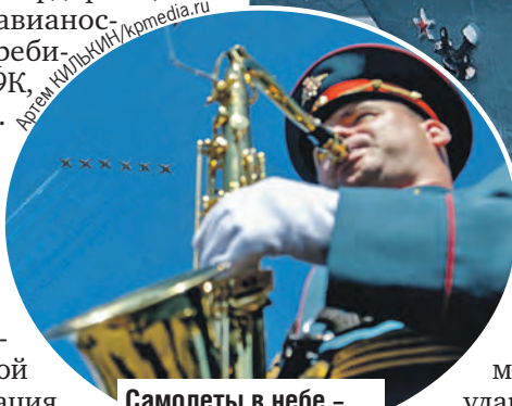
Самолеты в небе – это всегда музыка.

крейсер «Петр Великий». Самый мощный по ударным возможностям военный корабль в мире.