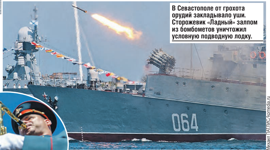
В Севастополе от грохота орудий закладывало уши. Сторожевик «Ладный» залпом из бомбометов уничтожил условную подводную лодку.

В Североморске парадный строй кораблей Северного флота возглавил тяжелый атомный ракетный