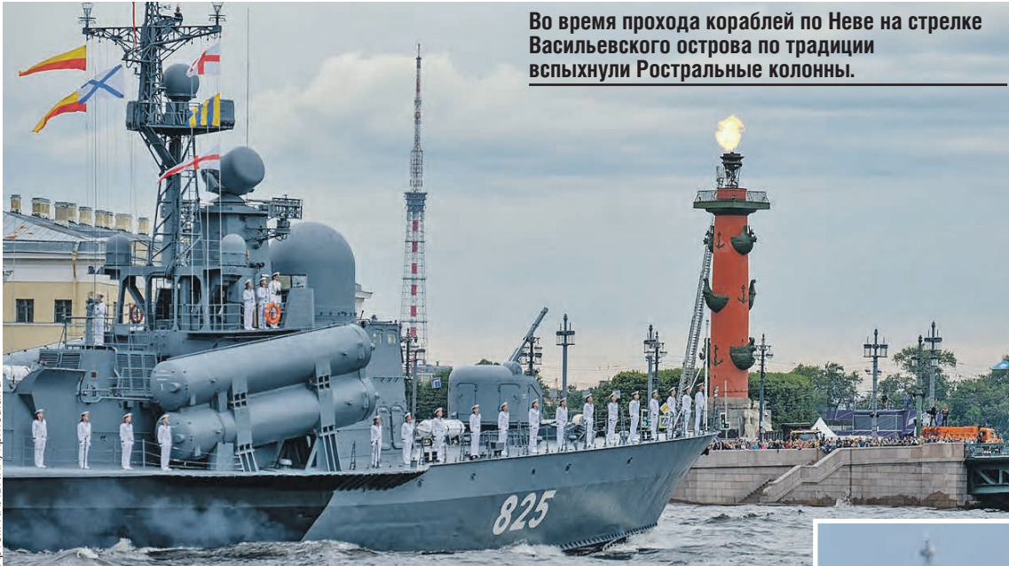
Во время прохода кораблей по Неве на стрелке Васильевского острова по традиции вспыхнули Ростральные колонны.