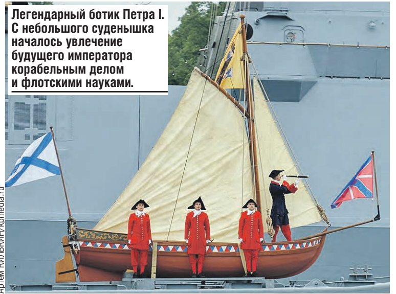
Легендарный ботик Петра I. С небольшого суденышка началось увлечение будущего императора корабельным делом и флотскими науками.