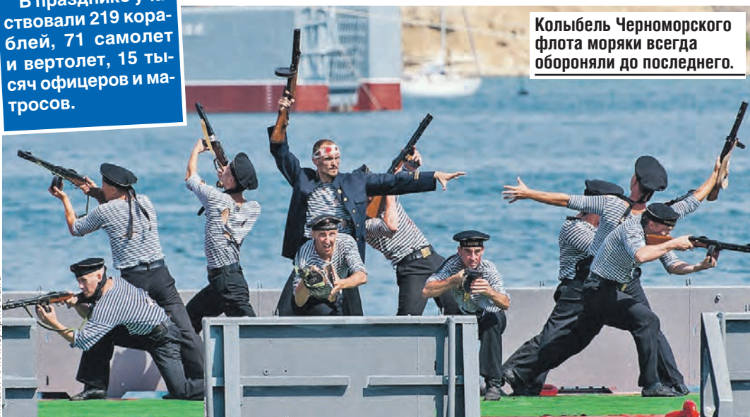
Колыбель Черноморского флота моряки всегда обороняли до последнего.

ЦИФРЫ В празднике участвовали 219 кораблей, 71 самолет и вертолет, 15 тысяч офицеров и матросов.