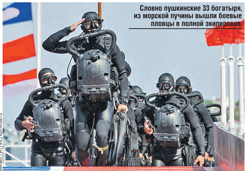
Словно пушкинские 33 богатыря, из морской пучины вышли боевые пловцы в полной экипировке.