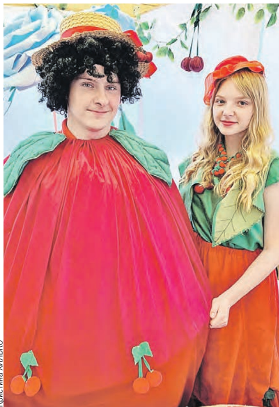
Розовощекый Вишневик со своей подружкой встречали гостей на местном подворье, где от угощений ломился стол.

Сегодня горожане не обращают внимания, что за птицы кружат у них над головами. Просвещением займется общественная организация «Ахова птушак Бацькаўшчыны». Проведут выставки фото и рисунков, организуют наблюдения за птицами. А еще сейчас разрабатывают новый туристический маршрут. Во время экскурсии любителей птичек научат различать пернатых не только по цвету и повадкам, но и по голосам, а также проведут по самым вишневым местам города.