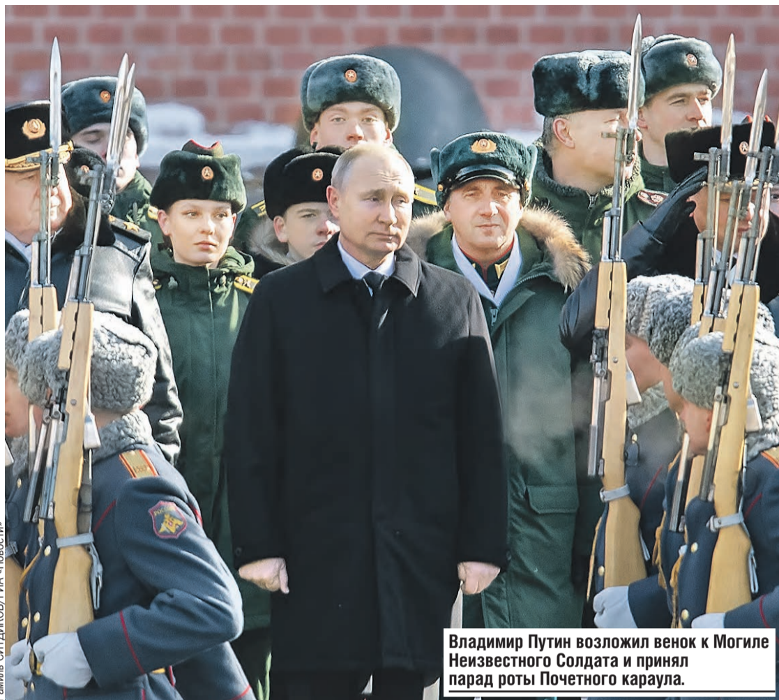
Владимир Путин возложил венок к Могиле Неизвестного Солдата и принял парад роты Почетного караула.