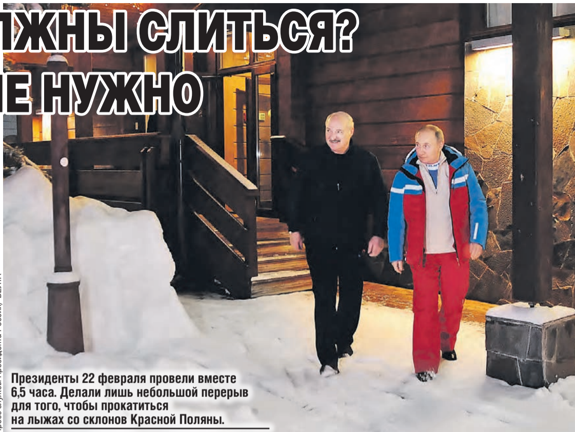
Президенты 22 февраля провели вместе 6,5 часа. Делали лишь небольшой перерыв для того, чтобы прокатиться на лыжах со склонов Красной Поляны.

– Все наши переговоры были основаны на создании единой системы по всем направлениям, чтобы это было еще теснее, чем сотрудничество округов и республик в самой Российской Федерации, – сказал Александр Лукашенко. – У нас есть твердое понимание, что это наше общее Отечество от Бреста до Владивостока, где сегодня существуют два независимых государства.