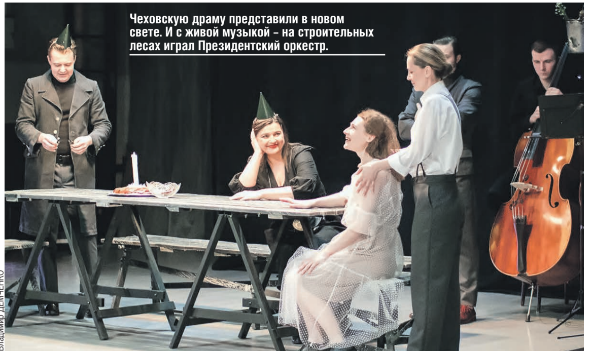
Чеховскую драму представили в новом свете. И с живой музыкой – на строительных лесах играл Президентский оркестр.

где-то там, в этой Москве, будет невероятно хорошо. Но трагедия