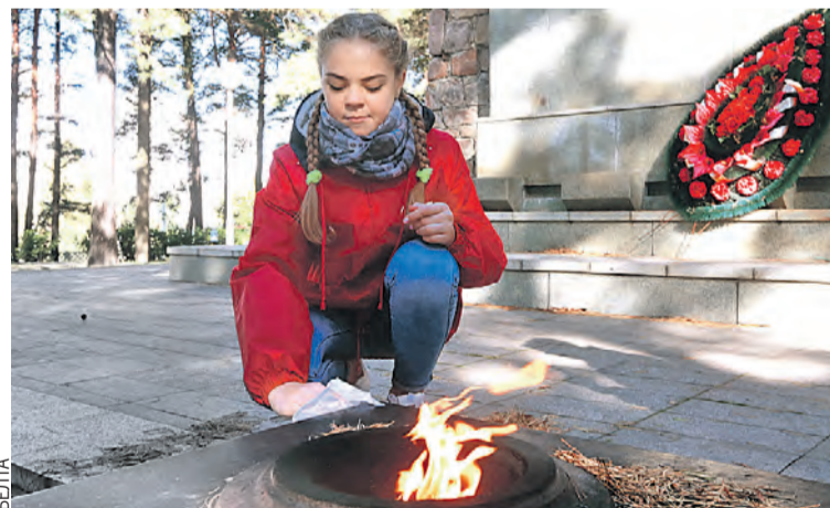
В планах у активистов – привести в порядок больше сотни мемориалов и воинских захоронений.

Инициатив у молодых набралось немало. Оренбуржцы за минувший год провели с десяток мероприятий и в социальной сфере, и в здравоохранении, и в области туризма. Особенно они гордятся международным молодежным фестивалем «Евразия Global» (город расположен на стыке Европы и Азии). В сентябре он пройдет шестой раз. За всю историю существования в нем участвовали больше четырех тысяч