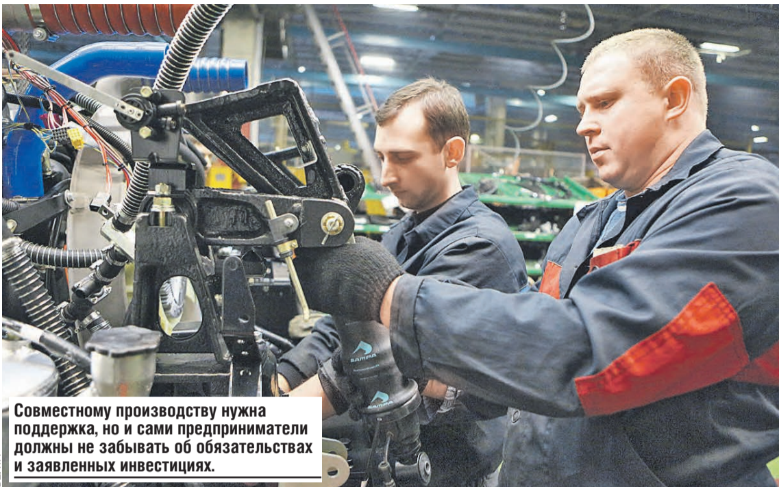
Совместному производству нужна поддержка, но и сами предприниматели должны не забывать об обязательствах и заявленных инвестициях.