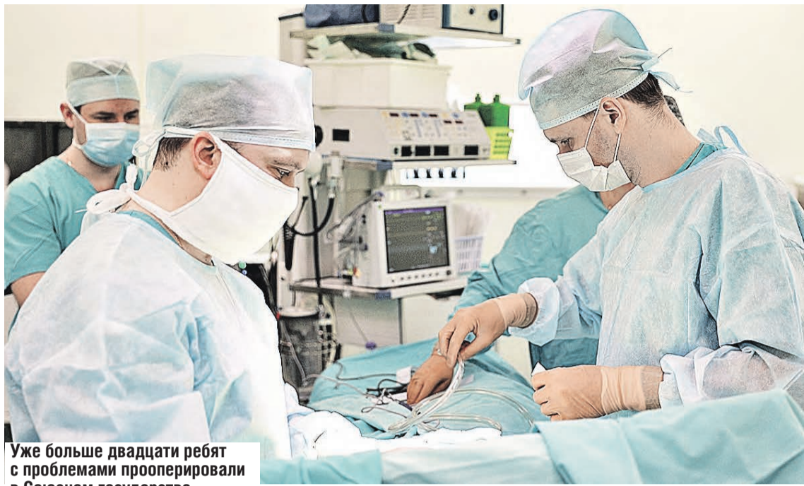
Уже больше двадцати ребят с проблемами прооперировали в Союзном государстве. Новая методика дала им шанс на выздоровление.