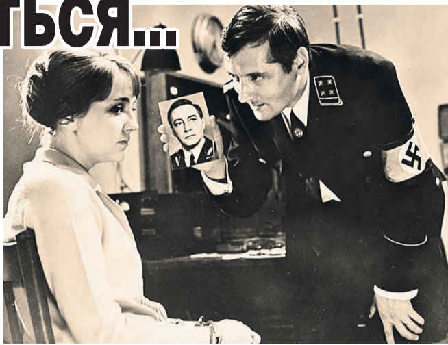
После шпионской драмы в героиню влюбилась вся страна. Да и сам Штирлиц благоволил партнерше...

– Были очень грустные, полные нежности взгляды, –