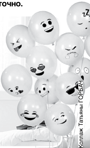
Коллаж Татьяны ГОРБАЧ