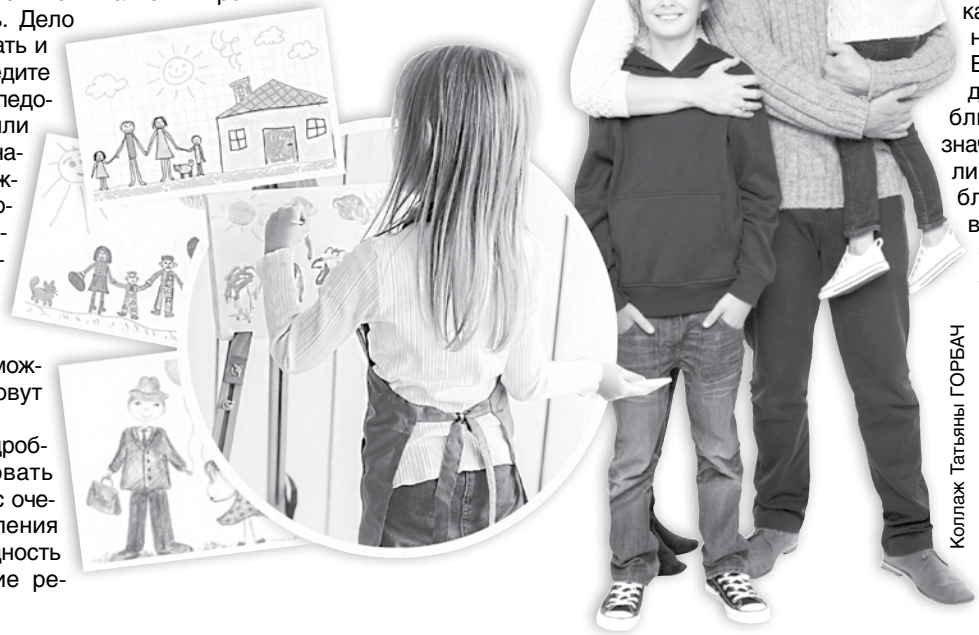
Коллаж Татьяны ГОРБАЧ

Если истолковать рисунок не вышло либо это получилось неоднозначно, попросите ребенка нарисовать семью, которую он бы хотел. Наверняка так будет проще проанализировать, чего хочется и чего недостает малышу.