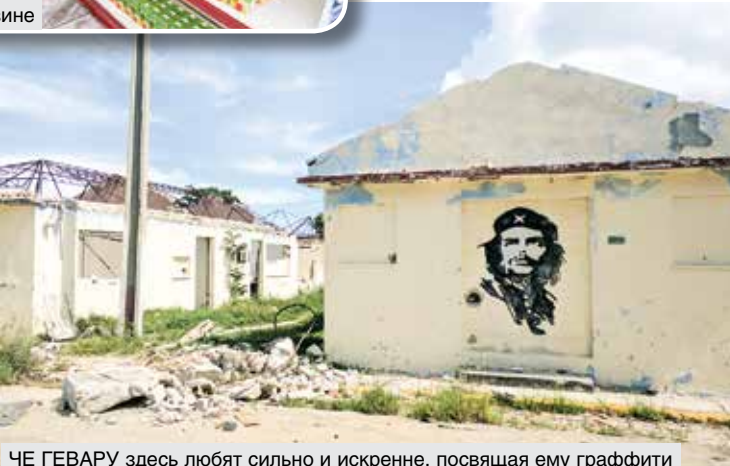
ЧЕ ГЕВАРУ здесь любят сильно и искренне, посвящая ему граффити

ВАРАДЕРО – ЭТО НА САМОМ ДЕЛЕ НЕ НАСТОЯЩАЯ КУБА, А ВИТРИНА ДЛЯ ТУРИСТОВ, ГДЕ ВСЕ ЗАТОЧЕНО ПОД ТО, ЧТОБЫ ОБЛЕГЧИТЬ ИМ РАССТАВЛЕНИЕ С ДЕНЬГАМИ