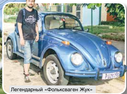
Легендарный «Фольксваген Жук»

Один из главных туристических брендов Кубы – американские автомобили 50-х. Можно приезжать как в музей. В Вара-