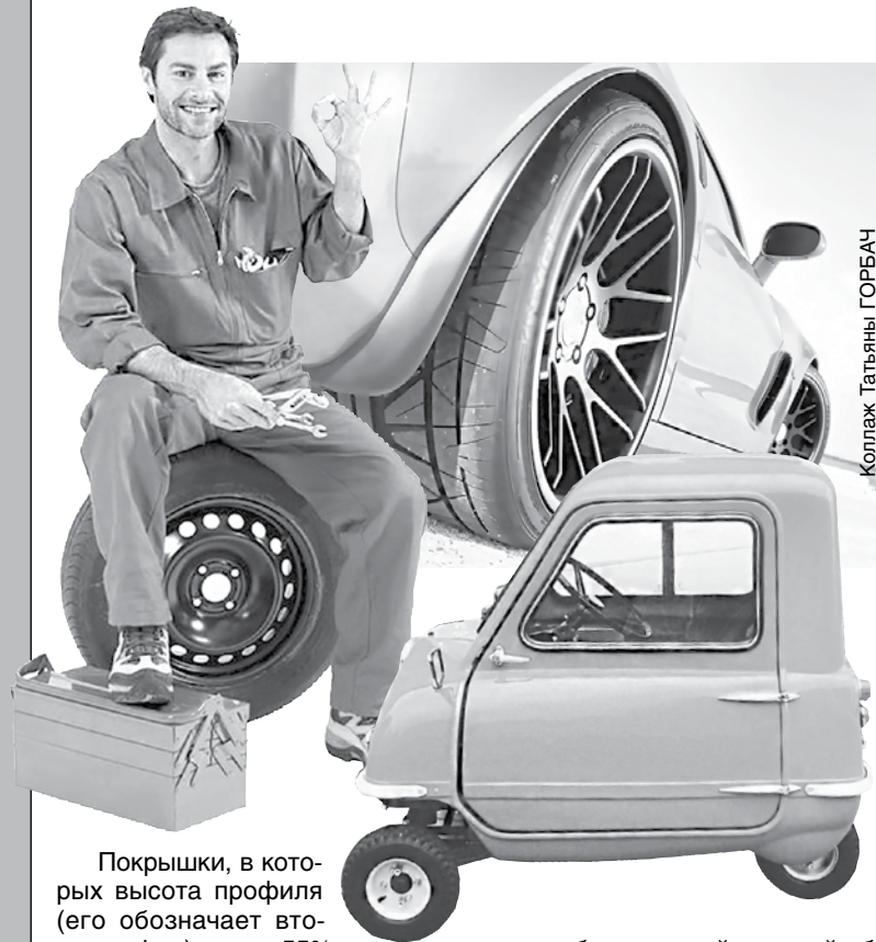
Коллаж Татьяна ГОРБАЧ

Все мы привыкли видеть на дорогах и мощных автомобилях колеса огромного диаметра с низкопрофильной резиной. Как правило, они смотрятся эффектно и придают облику машины агрессивный и динамичный вид. Дешевые малолитражки, наоборот, оснащаются миниатюрными колесами, от которых часто становятся похожи на игрушечные. Выясним, на что влияют размер колес и профиль резины.