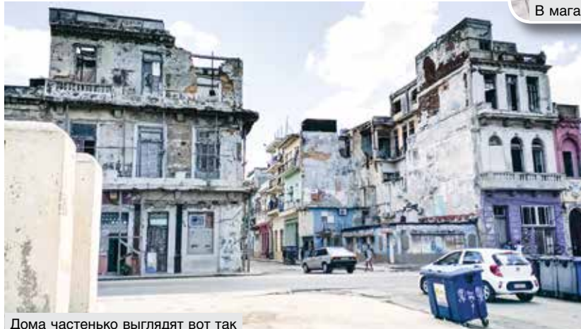
Дома частенько выглядят вот так