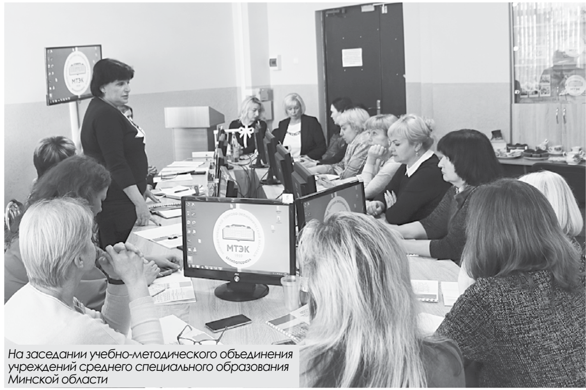
На заседании учебно-методического объединения учреждений среднего специального образования Минской области

ствовать потенциал мобильных устройств при построении учебного занятия. Из множества приложений мы с учащимися выделили для себя Quizlet – ведущую в мире онлайн-платформу для обучения, которая идеально подходит для случаев, когда графическое представление и визуализация необходимы для понимания материала. Ребята, готовясь с помощью карточек, игр и многого другого, значительно улучшили успеваемость. Экономить время, легко и быстро организовывать занятия, эффективно общаться с учащимися позволяет Google Classroom. Эта интерактивная платформа обеспечивает нас набором инструментов для работы с электронной почтой и документами в «виртуальных аудиториях». Для меня мобильные устройства и беспроводные технологии стали повседневной частью обучения.