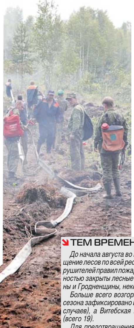
■ Работники Минлесхоза тянут рукав.

Ми-8 (именно такую модель часто используют спасатели МЧС) делает техническую посадку. Сотрудник авиации