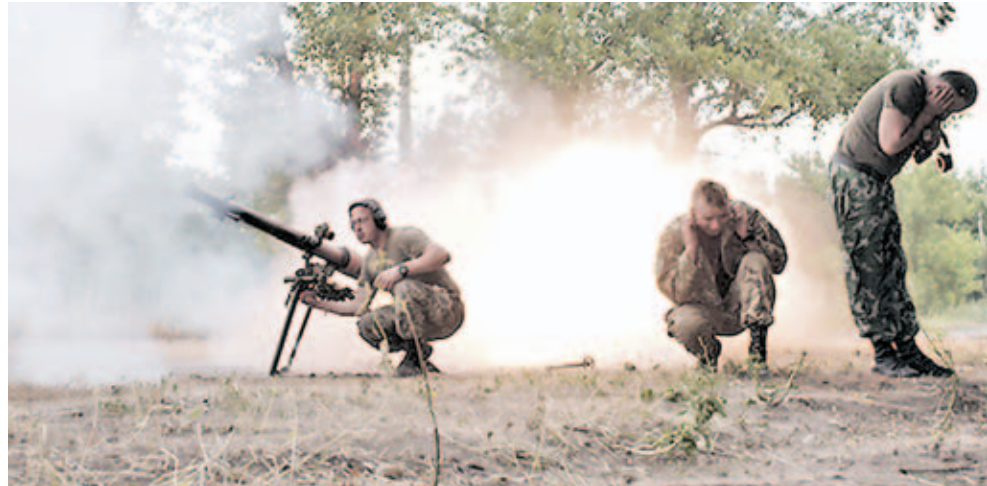
■ Вооруженные силы Украины.