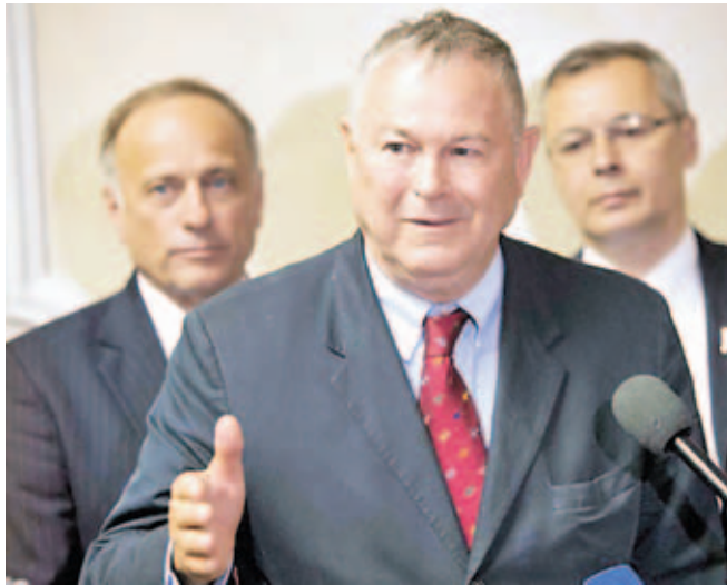
■ Представитель конгресса США — республиканец Дана РОРАБАКЕР 3 августа посетил Национальную академию наук Беларуси.