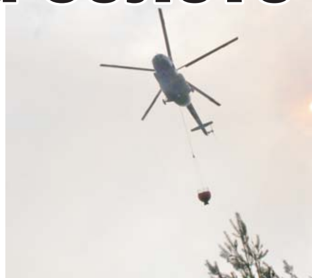
■ Ми-8 участвует в тушении пожара.