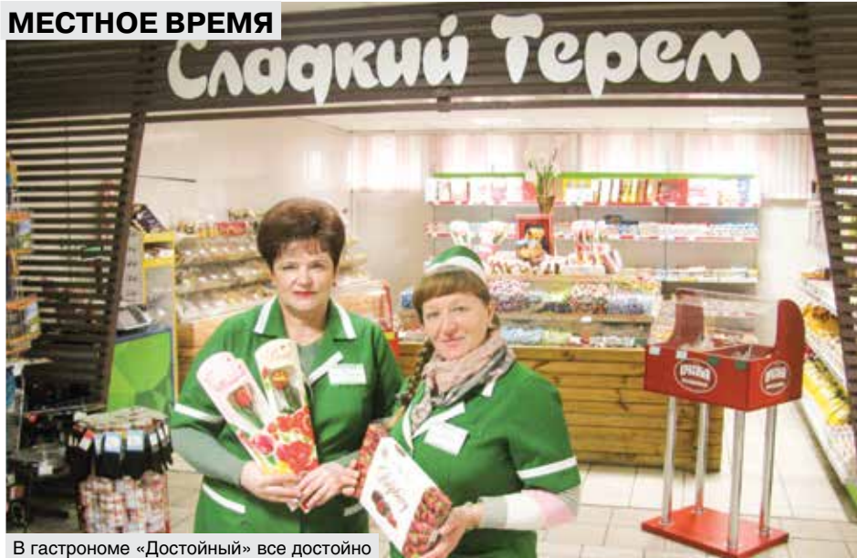
В гастрономе «Достойный» все достойно