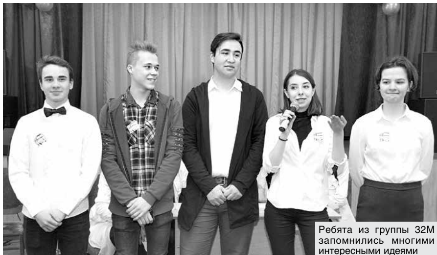
Ребята из группы 32М запомнились многими интересными идеями

Следует иметь в виду, что в случае неисполнения обязательств наследодателя в добровольном порядке в соответствии с пунктом 4 статьи 1086 Гражданского кодекса кредиторы вправе в течение срока исковой давности предъявить свои требования гражданам, принявшим наследство. А до принятия наследства требования кредиторов могут быть предъявлены к исполнителю завещания или заявлены к наследственному имуществу.