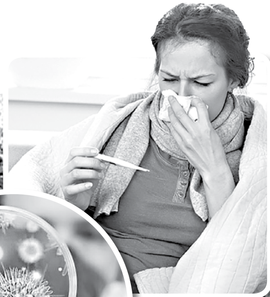
Коллаж: Татьяна ГОРБАЧ