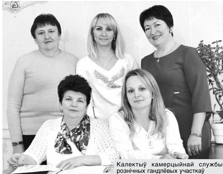
Калектыв камерцыйнай службы рознічных гандлёвых участкаў

вянчання. Карыстаюцца попытам нацыянальных сувенір-ных лялькі, лянныя абрусы, сурвэткі.