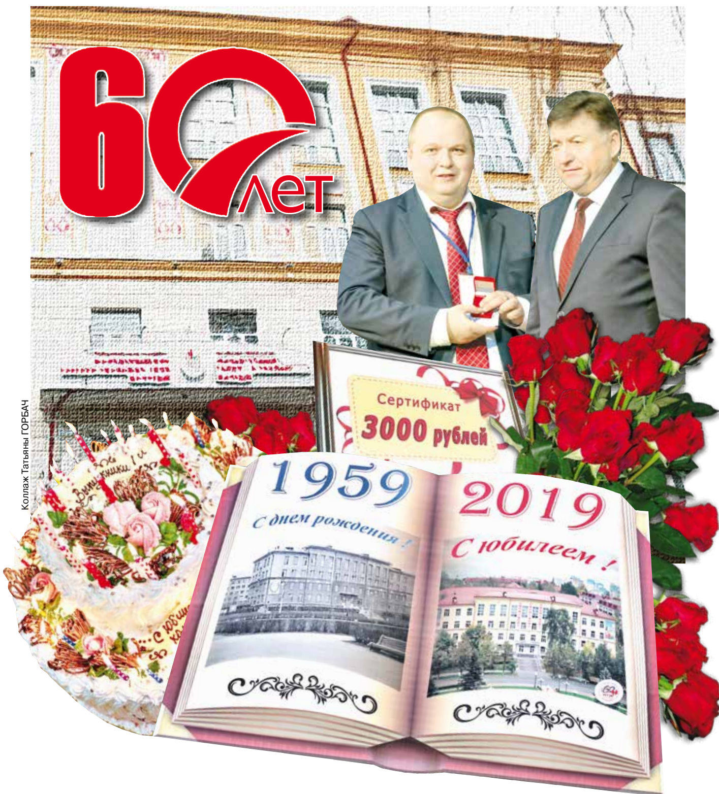
Коллаж Татьяна ГОРБАЧ

А всего за 60 лет подготовлено более 35 тысяч специалистов и рабочих массовых профессий.