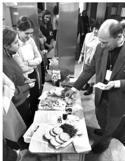
Ярмарка «Здоровое питание – здоровый человек»: во время дегустации

– Все участники очень старались, поэтому для меня они все победители, – едва переводит дух неутомимая