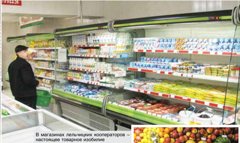
В магазинах лельчицких кооператоров – настоящее товарное изобилие