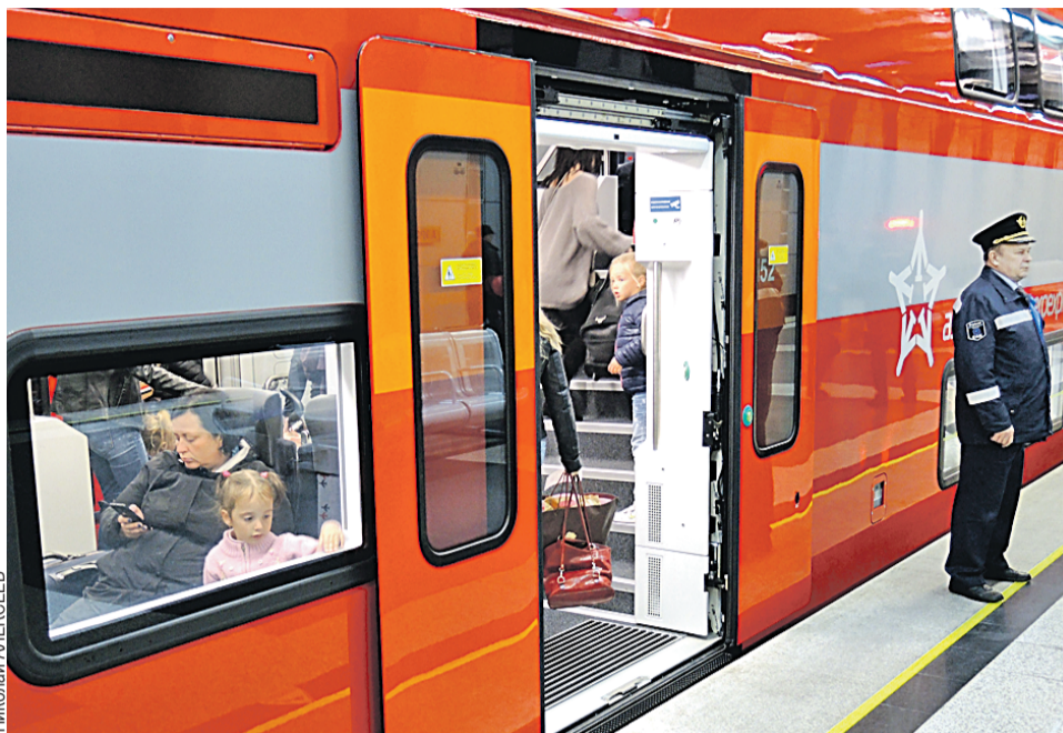
Такие двухэтажные красавцы уже возят из аэропорта москвичей. Возможно, скоро с их удобствами познакомятся и жители Северной столицы.

Новость о том, что скоростной поезд «Аэроэкспресс» планируют запустить к 2020 году от Витебского вокзала Северной столицы до аэропорта «Пулково», пришла с поля недавнего Петербургского международного экономического форума. Там исполнительный директор «Аэроэкспресса» Валерий Федоров и губернатор Санкт-Петербурга Георгий Полтавченко подписали соглашение о намерениях создать железнодорожную линию и запустить скоростную электричку до аэропорта. Бюджет проекта оценивается в 18,8 миллиарда российских рублей, из которых около 10 миллиардов придется на го-