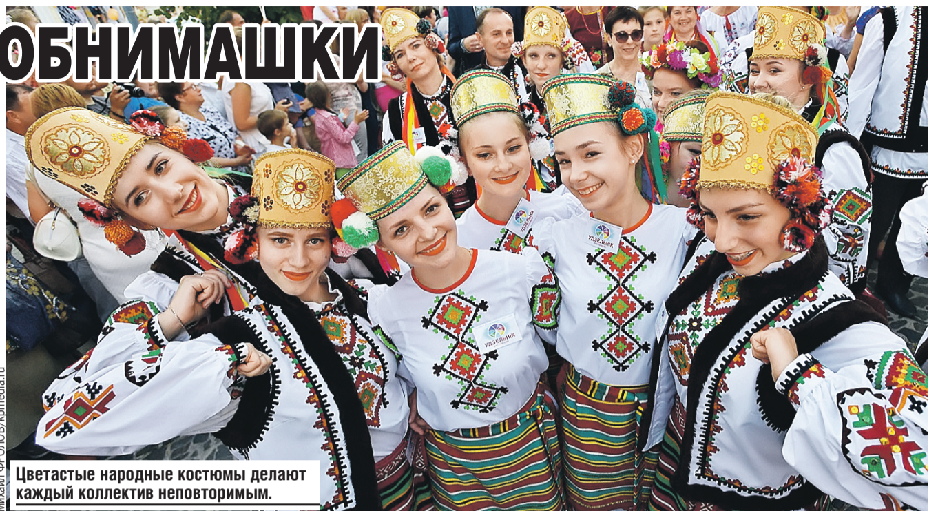
Цветастые народные костюмы делают каждый коллектив неповторимым.

Основательнее всех расположились казахи: привезли с собой юрту, установили качели, всем желающим предлагают сыграть в асык – разновидность игры в кости. Все так оригинально и самобытно, что в итоге именно они и получают Гран-при. На греческом подворье уже готовят свой легендарный салат в невообразимом количестве. Вообще, на фестиваль лучше идти на голодный желудок. Азербайджанцы потчуют шашлыком, украинцы – салом, на еврейском подворье угостят мацой,