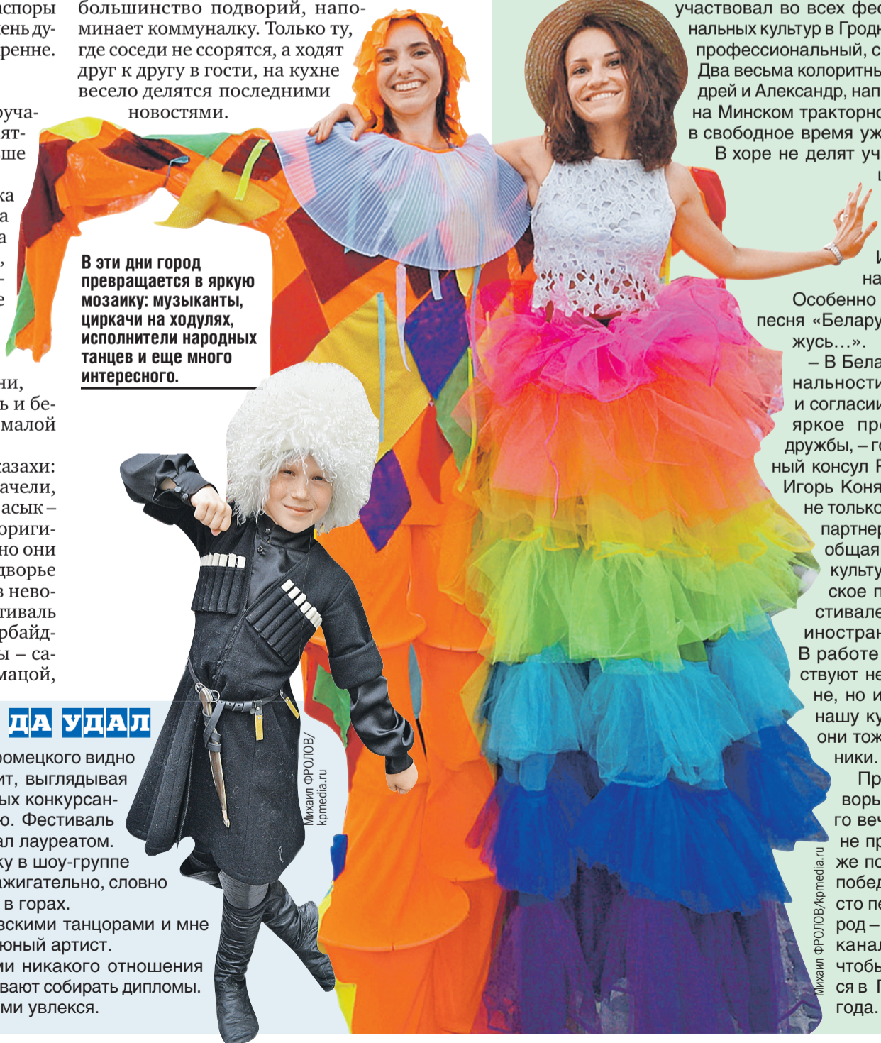
В эти дни город превращается в яркую мозаику: музыканты, циркачи на ходулях, исполнители народных танцев и еще много интересного.

Праздник на подворьях идет до самого вечера, фестиваль не прекращается даже после объявления победителей, он просто переезжает за город – на Августовский канал. Переезжает, чтобы снова вернуться в Гродно через два года.