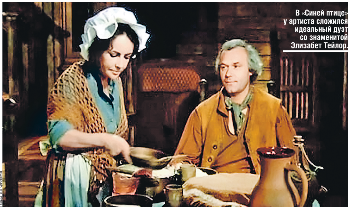
В «Синей птице» у артиста сложился идеальный дуэт со знаменитой Элизабет Тейлор.

нятыми буквами, а он все равно умудрялся исковеркать каждое слово.