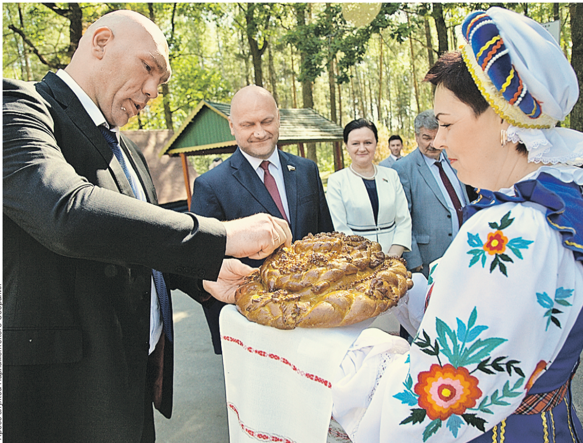
Дорогих гостей в Хойниках традиционно встречают с хлебом-солью на границе района.

На предприятия выстроили цепочку получения качествен-