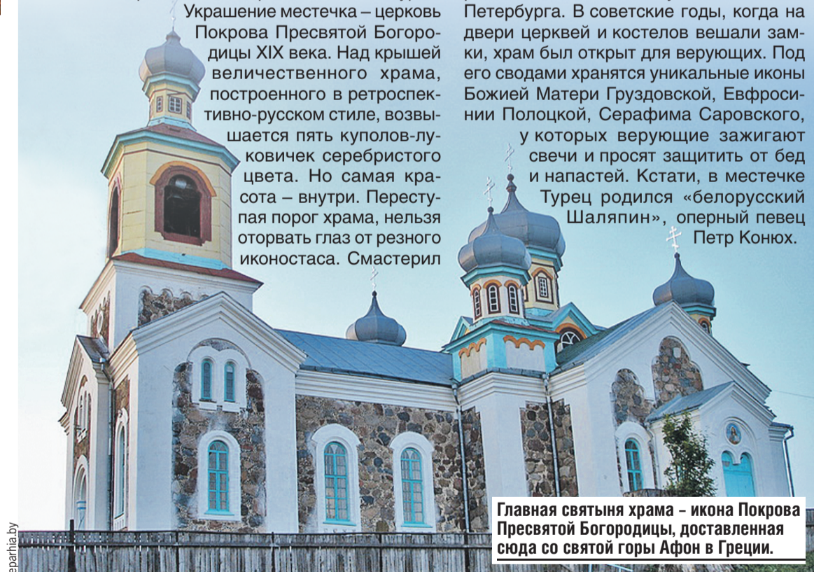
Главная святыня храма – икона Покрова Пресвятой Богородицы, доставленная сюда со святой горы Афон в Греции.