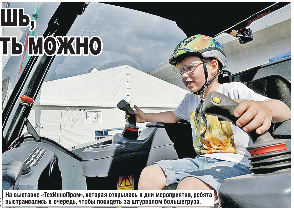
На выставке «ТехИнноПром», которая открылась в дни мероприятия, ребята выстраивались в очередь, чтобы посидеть за штурвалом большегруза.

Но не хлебом единым. Псковская область – единственный российский регион, который граничит сразу с тремя государствами: Латвией, Эстонией и Беларусью. Это не только общая граница, но и тесные гуманитарные и научно-технические контакты, богатая история и культура. Плюс Псковщина – один из крупнейших потребителей белорусской сельхозтехники. Например, «Автоэлектрарматура» делает комплектующие для белорусских тракторов, а двигатели охлаждения для БелАЗов привозят с электромашиностроительного завода. И темпы сотрудничества сбавлять не собираются.