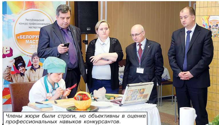
Члены жюри были строги, но объективны в оценке профессиональных навыков конкурсантов.

Не будучи специалистом в области кулинарии, не претендую на объективность собственной оценки профессионализма участников конкурса. На мой дилетантский взгляд, все они без исключения наделены недюжинными способностями в искусстве приготовления блюд и заслуживают похвалы. Тем не менее отдельные творческие работы, признаюсь, поразили, как, впрочем, и