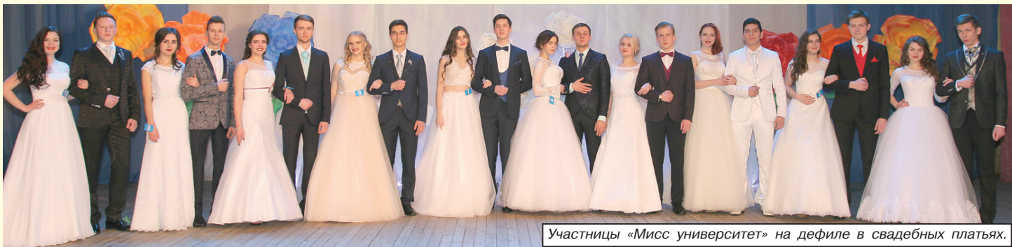
Учасніцы «Місс універсітэт» на дефіле ў свадебных пляцях.