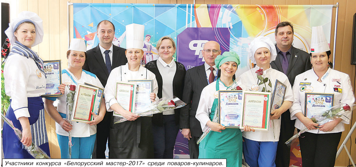
Участники конкурса «Белорусский мастер-2017» среди поваров-кулинаров.

В рамках республиканского профсоюзного фестиваля «Трудовые таланты» состоялся межотраслевой финал конкурса профессионального мастерства