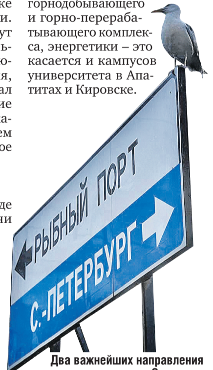
Два важнейших направления в городе: в порт и в Северную столицу, на верфях которой строили ледокольный флот страны.

Прием делегации был сродни погоде, столь же теплый. Хотя речь на многочисленных встречах и круглых столах