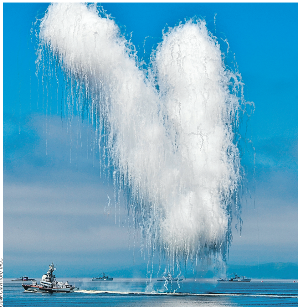
Картина залпом. Во Владивостоке виртуозы-комендоры нарисовали салютными выстрелами огромную букву V.

Праздничные морские парады прошли в этот день везде, где базируются российские корабли. В том числе в сирийском Тартусе. Оперативная эскадра ВМФ России предстала во всей боевой мощи. В парадном строю – самые современные корабли. Среди них, например, подводная лодка «Колпино». В НАТО дизельные субмарины