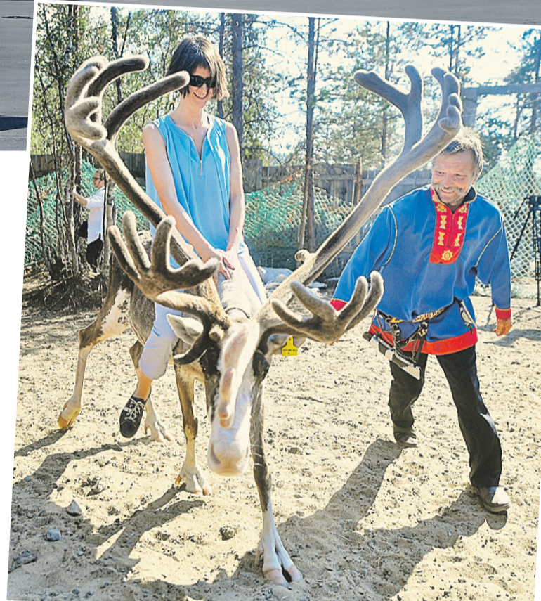
Одно из главных развлечений гостей области – покататься на оленях в деревне саамов – коренного населения Кольского полуострова.

Но гостям Мурманска в этот раз повезло. Вторую неделю на Кольском полуострове стояло не капризное, северное, а настоящее черноморское