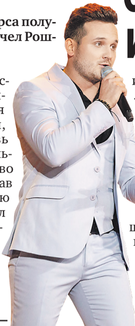
МФИ «Славянский базар в Витебске»

Первую победу Румынии принес певец-молдаванин.