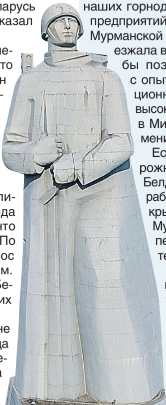
Монумент защитникам Советского Заполярья в годы Великой Отечественной войны мурманчане зовут просто – «памятник Алеше». Он впечатляет размерами: вместе с постаментом 40 с лишним метров. Выше только Родина-мать в Волгограде.

В любви Беларуси во время этой поездки признавались не только в Мурманске, но и в Кировске, Апатитах. И даже в саамской этнографической деревушке Самь-Сыйт. Такое теплое отношение стоит сохранить, никакие арктические льды его уже не заморозят.