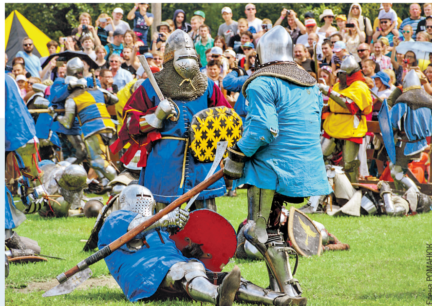
Участники сражений – мастера на все руки: плетут, куют, шьют вручную. Костюмы, доспехи и оружие воссоздаются до мелочей.

А затем гости не жалея ног танцевали под белорусские мелодии, фолк-метал, пауэр-метал и даже шаманский рок. Хедлайнерами средневекового феста выступили группы из Беларуси и России, Ирландии и Германии – «Стары Ольса» и «Мельница», «Эпидемия», Folcore и Cruachan.