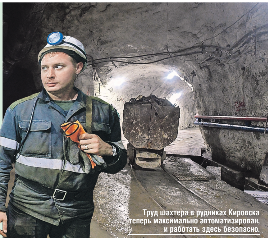
Труд шахтера в рудниках Кировска теперь максимально автоматизирован, и работать здесь безопасно.

Селфи на память: в каске, с фонариком на лбу – все уже почти шахтеры. Опускаемся на глубину, на уровень, где руду дробят, а потом уже поднимают наверх. Фотографы ловят редкий кадр, остальные пытаются услышать экскурсовода. Время под землей и правда летит совсем незаметно. Три минуты – и уже наверху. Подъем оказался столь же стремительным, как и вся поездка в Мурманскую область. Но сюда хочется вернуться еще раз – в ставшее таким теплым для нас Заполярье.