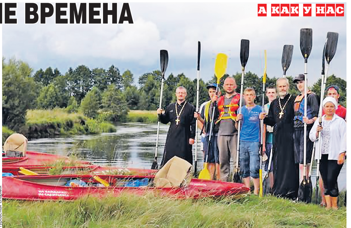
В Новогрудской епархии грандиозное событие отметили шестидневным сплавом на байдарках по рекам Неман и Щара.

Необычное крещение прошло в субботу, в день памяти святого равноапостольного князя Владимира, в Свято-Елисеевском Лавришевском мужском монастыре на Гродненщине. Тем самым старинным способом, которым и была посвящена в новую веру Русь. На песчаном берегу Немана установили деревянный алтарь, украшенный пестрыми цветами и веточками аира. Восемь человек приняли таинство Крещения