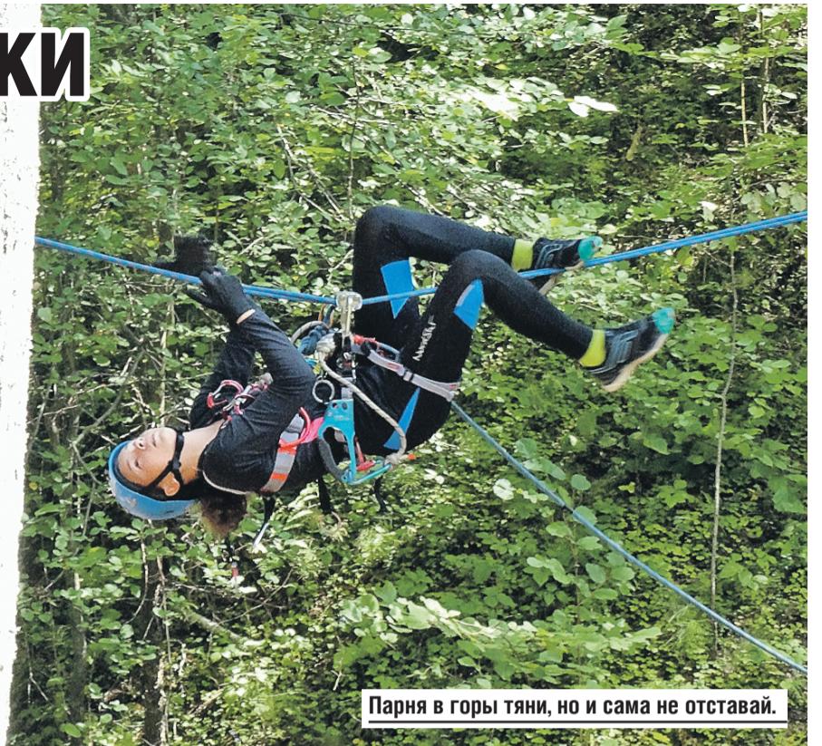
Парня в горы тяни, но и сама не отставай.

– Живем тут как на курорте! По двое в большой палатке, кормят хорошо,