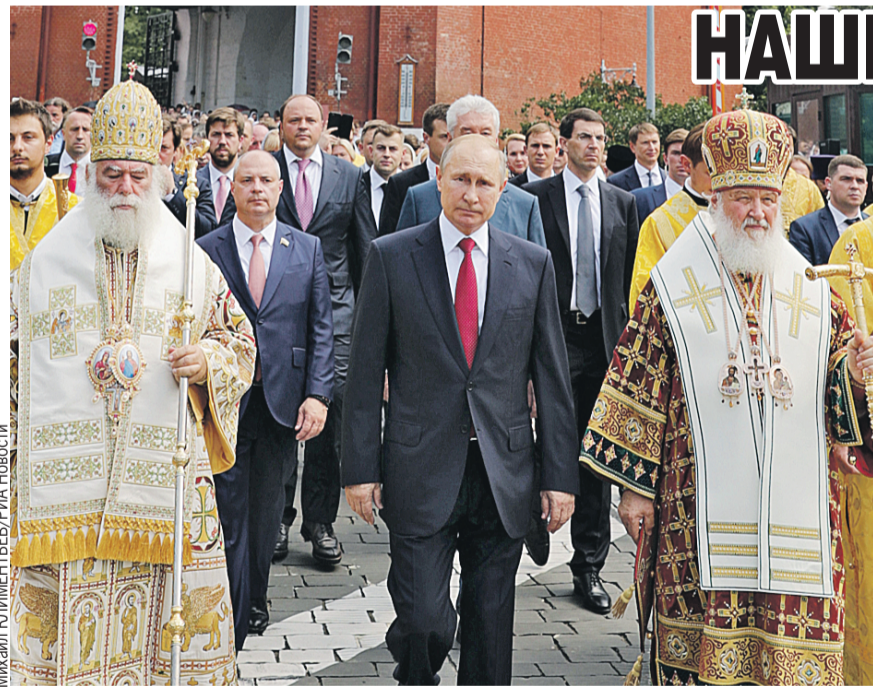
Владимир Путин, Патриарх Московский и всея Руси Кирилл (справа) и Патриарх Александрийский и всея Африки Феодор II (слева) во время крестного хода на Боровицкой площади.