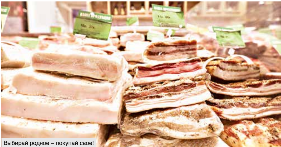
Выбери родное – покупай свое!

цена, закупки сведены к минимуму – и только по тем видам, которые необходимы для внутреннего потребления предприятий. А Белкоопсоюз полностью интегрирован в общегосударственную систему заготовки вторичных ресурсов.