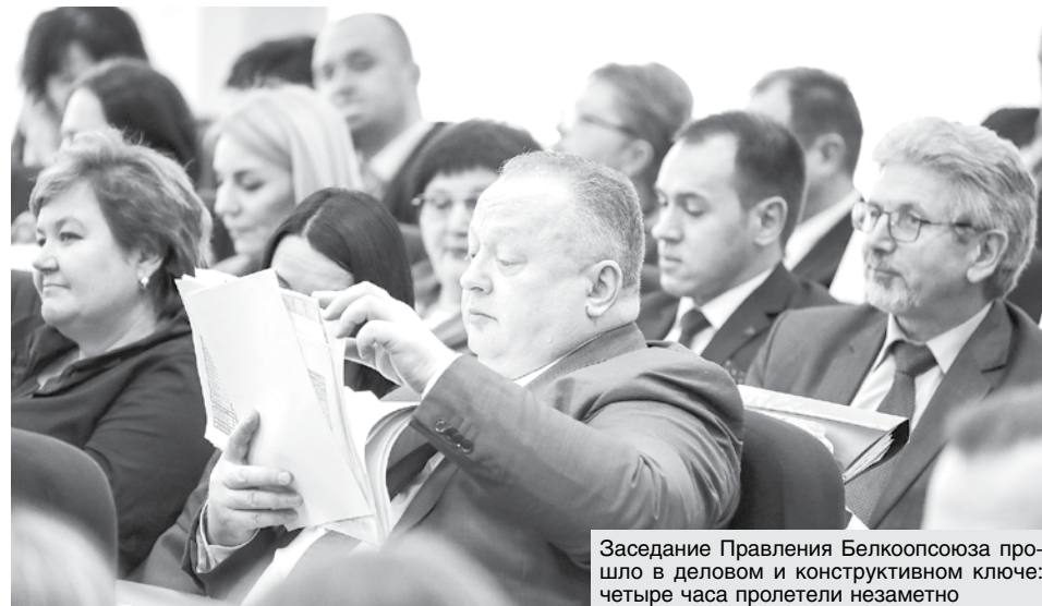
Заседание Правления Белкоопсоюза прошло в деловом и конструктивном ключе: четыре часа пролетели незаметно

лиц, филиалов и обособленных структурных подразделений. Ведется поэтапная работа по централизации товарно-материальных и финансовых потоков с приведением численности работников в соответствие с объемами деятельности. В отдельных случаях функции обслуживания населения передаются от проблемных районных организаций финансово устойчивым.