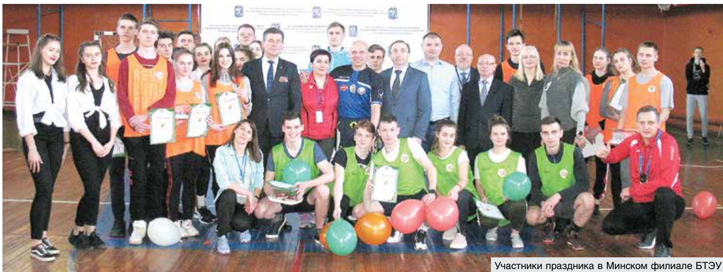
Участники праздника в Минском филиале БТЭУ

Очередное конкурсное задание – спортивная эстафета «Газы, задымление». В каждой из команд по шесть человек (2 девушки и 4 юноши). Игрок в противогазе должен преодолеть полосу препятствий, спасая воздушный шарик, добраться до финиша и передать эстафету следующему конкурсанту. Страсти кипели нешуточные, неудивительно, что участники иногда допускали досадные ошибки. Но продемонстрировали прекрасную физическую подготовку и настоящие бойцовские качества. И неважно, кто в конечном итоге стал первым. Как говорят в таких случаях, победила дружба.