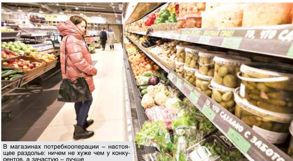
В магазинах потребкооперации – настоящее раздолье: ничем не хуже чем у конкурентов, а зачастую – лучше