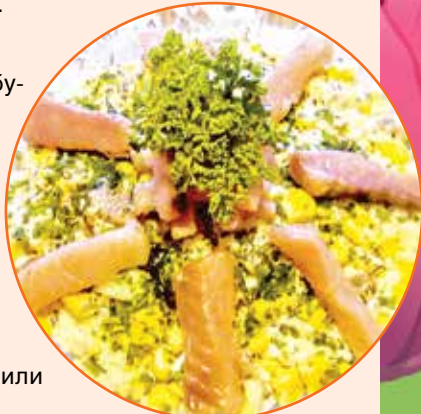
Рис лучше использовать длиннозернистый. Его нужно отварить заранее, чтобы полностью охладился. Лук очищаем, разрезаем на четвертинки и нарезаем тонкой соломкой. Филе горбуши нарезаем на средние кусочки. Кукурузу из банки откидываем на дуршлаг, чтобы полностью стекла

жидкость. Яйца отвариваем вкрутую, очищаем от скорлупы и нарезаем кубиками. Смешиваем все ингредиенты.