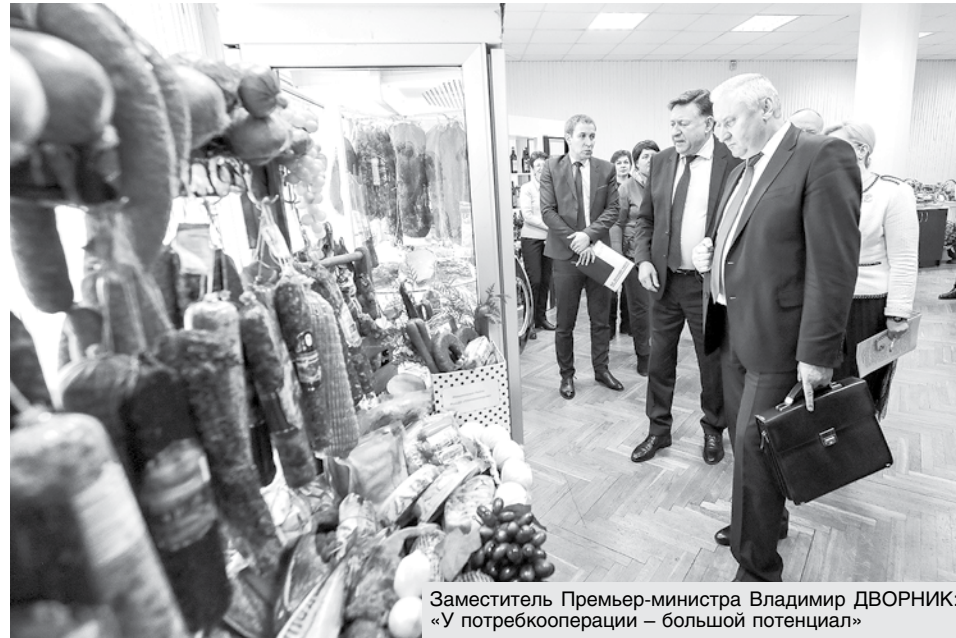
Заместитель Премьер-министра Владимир ДВОРНИК: «У потребительской кооперации — большой потенциал»