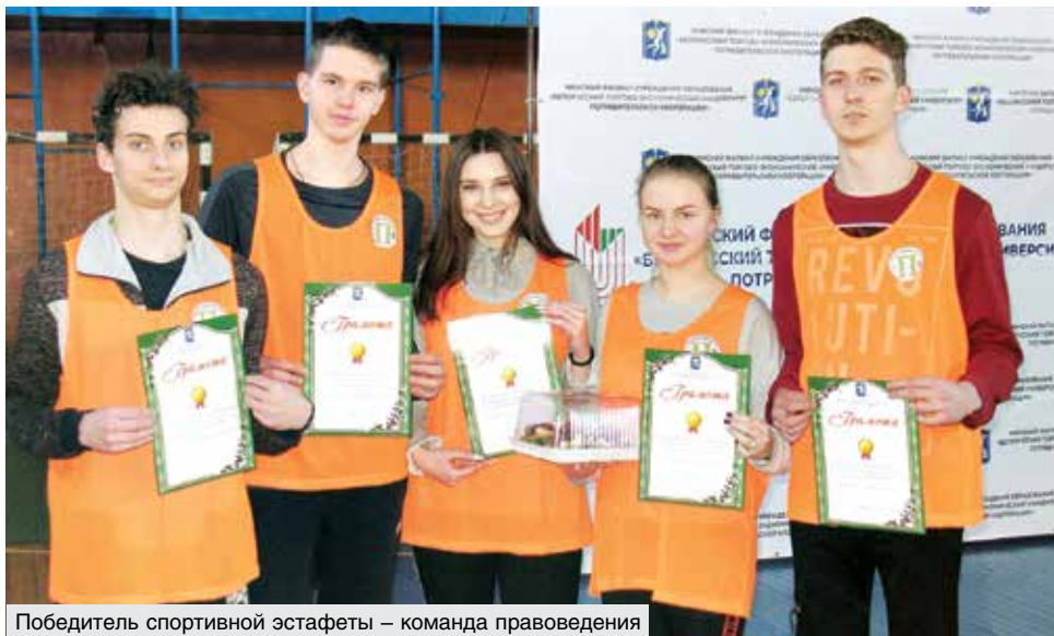
Победитель спортивной эстафеты – команда правоведения