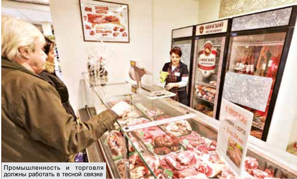
Промышленность и торговля должны работать в тесной связке