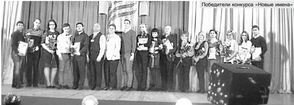
Победители конкурса «Новые имена»

За пять лет наша техническая инспекция труда провела более 2 тысяч проверок и мониторингов, выявила свыше 21 тысячи нарушений. Приостанавливалась работа более 400 единиц производственного оборудования и техники, не отвечавших требованиям безопасности и представлявших угрозу для жизни и здоровья работников. На предприятиях торговли, потребительской кооперации и предпринимательства работает более 4 тысяч об-