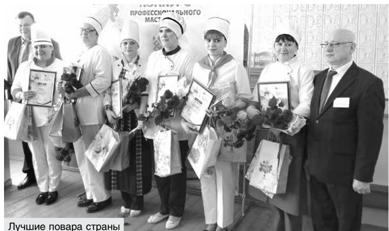
Лучшие повара страны