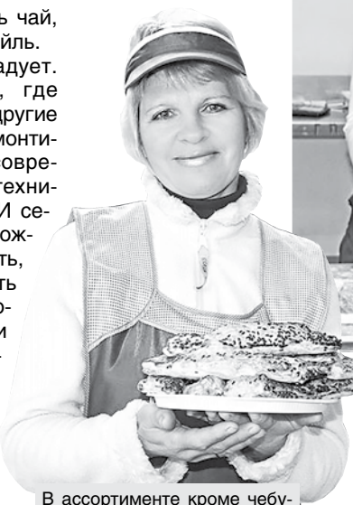
В ассортименте кроме чебуреков есть также блинчики, пирожки и многое другое

Интерьер тоже радует. Старое помещение, где когда-то находились другие торговые точки, отремонтировали, оснастили современными мебелью, техникой, оборудованием. И сегодня в чебуречной можно не только перекусить, но и отдохнуть, поднять настроение. Многие горожане уже успели стать постоянными посетителями новой точки общепита Костюковичского райпо. Вкусную продукцию они нередко берут с собой – чтобы у родных и близких тоже был шанс полакомиться