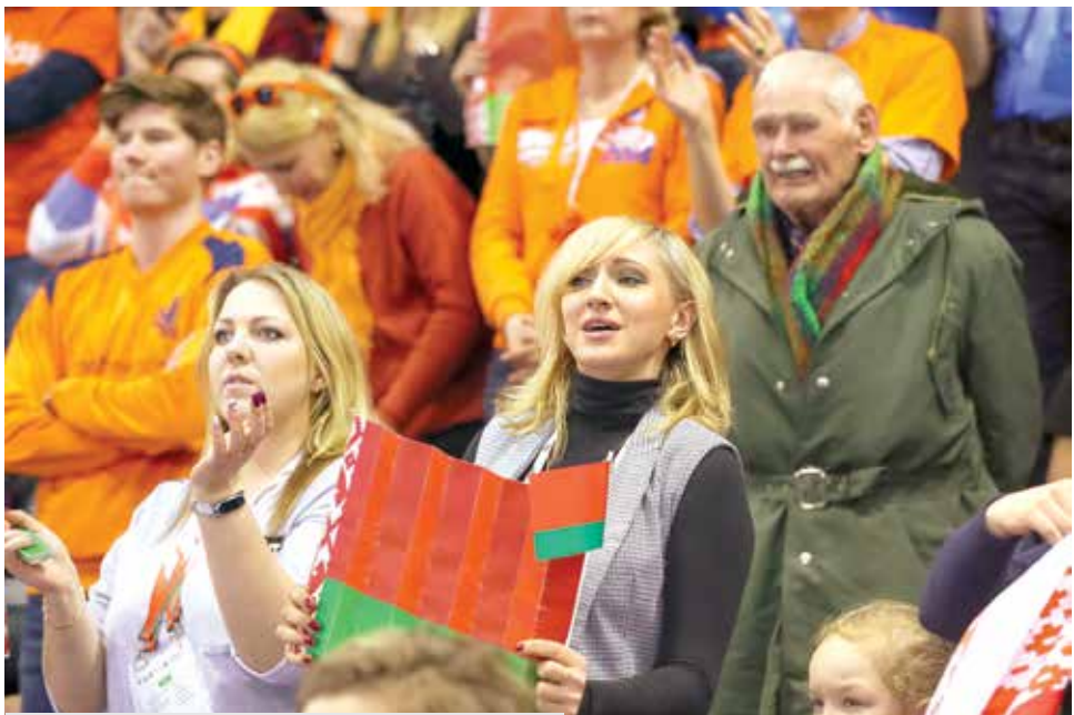
На трибунах эмоционально поддерживали игроков