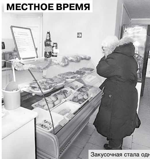
Закусочная стала одним из популярных мест в Костюковичах