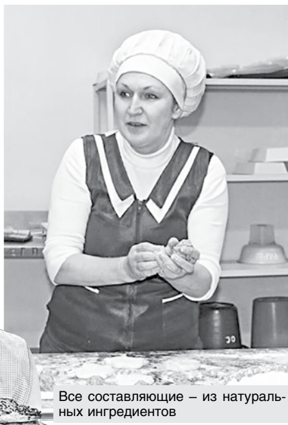
Все составляющие – из натуральных ингредиентов

так понравившимися пирожками или блинчиками, а у старшего поколения – еще и возможность вспомнить вкус детства.