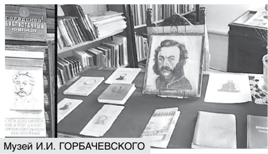
Музей И.И. ГОРБАЧЕВСКОГО