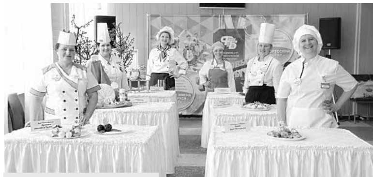
Мастера-кондитеры показали высший класс

С трансформацией экономики в обществе меняются и трудовые отношения. На рынке появилось много самозанятых, ремесленников, домашних работников. У них ведь тоже есть ряд проблем и интересов, решать которые лучше сообща, объединившись. Наш профсоюз взял под свое крыло первичные профсоюзные органи-