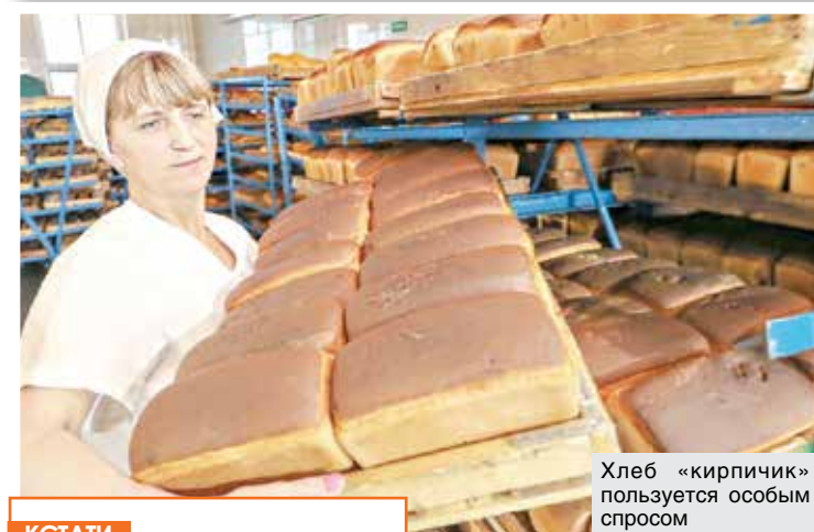
Хлеб «кирпичик» пользуется особым спросом