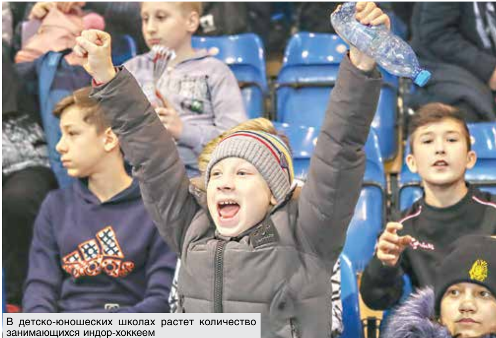
В детско-юношеских школах растет количество занимающихся индор-хоккеем