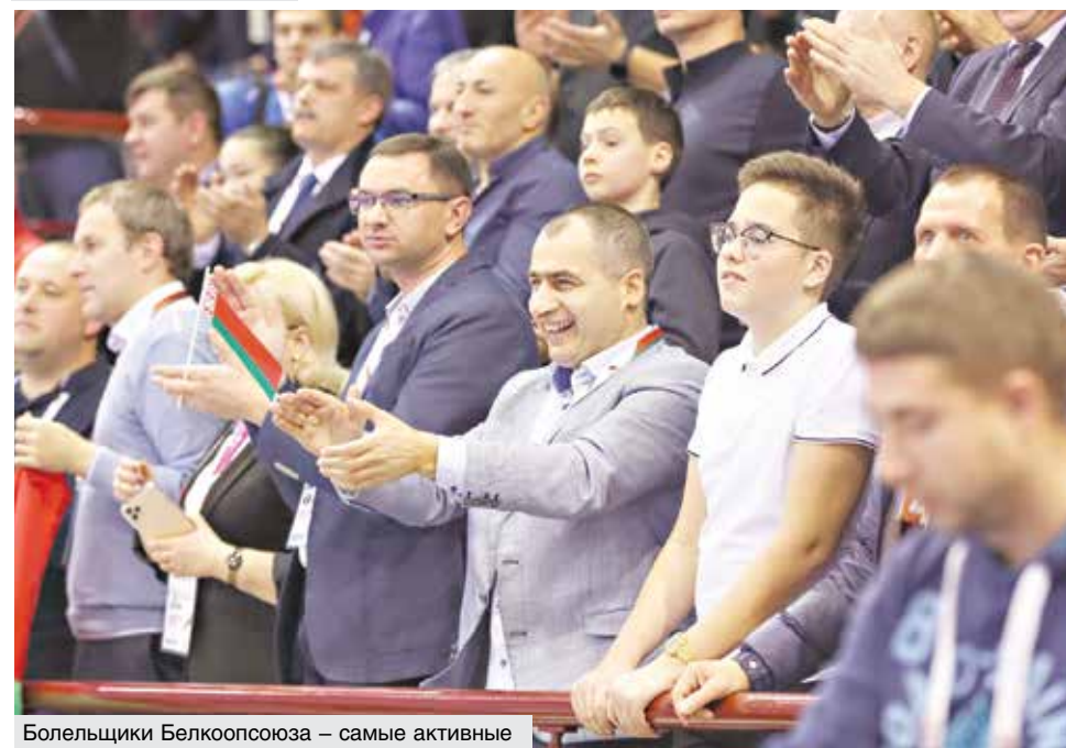
Болельщики Белкоопсоюза – самые активные

ки. А еще мы очень радовались тому, что в один из дней соревнований выпал снег. Словом, все было круто!