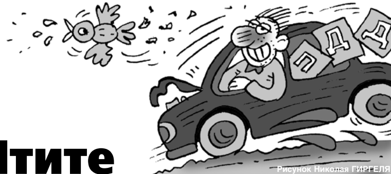
Рисунок Николая ГИРГЕЛЯ