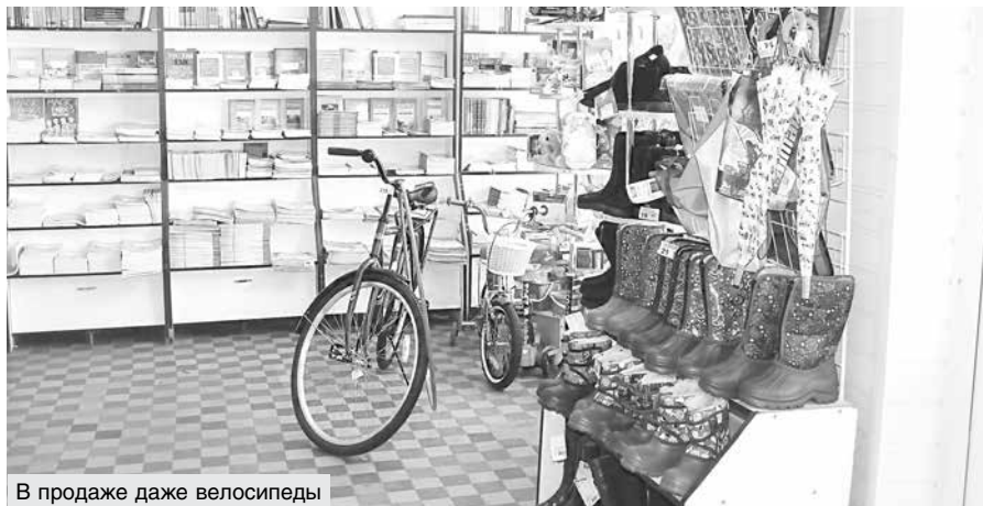
В продаже даже велосипеды