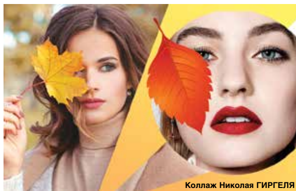
Коллаж Николая ГИРГЕЛЯ

В качестве эксперимента визажисты модных шоу со-