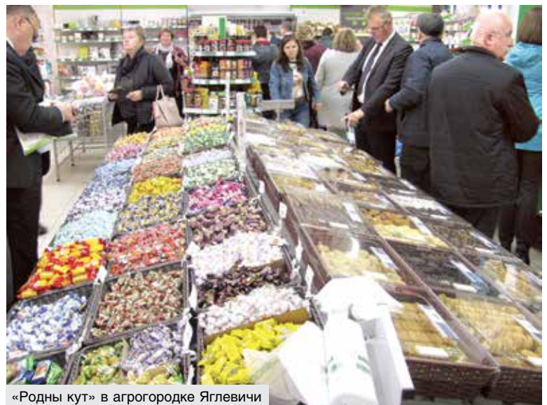
«Родны кут» в агрогородке Яглевичи

мер, секция посуды ЗАО «ТБК» обеспечивает нынче около 11 процентов оборота «Хозтоваров». Со многими производителями рассчитываются по мере реализации.