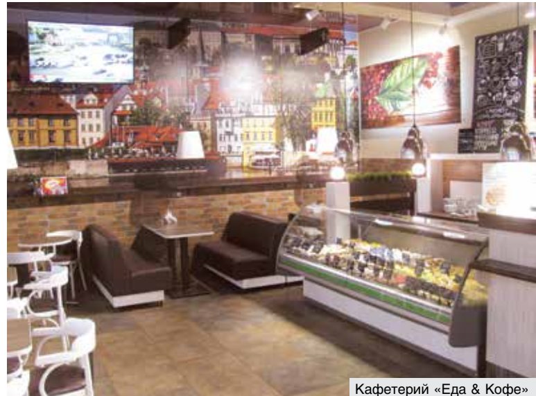
Кафетерий «Еда & Кофе»

Часть овощей, закупаемых у населения и сельхозпроизводителей, направляется в квасильно-засолочный цех. Ивацевичские кооператоры из одной лишь капусты производят восемь наименований продукции, из огурцов, причем работают только с грунтовыми, – четыре, из томатов и яблок – по два. Поставляют все это в собственную розницу, внесистемным потребителям, на экспорт.