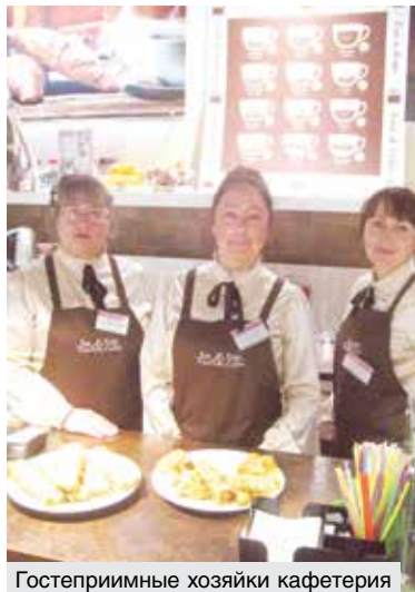
Гостеприимные хозяйки кафетерия

Режим работы кафетерия такой же, как и у торгового объекта, под крылышком которого он расположился. Меж тем работа в связке – это не только общий график: рождающиеся в кофейне ароматы невидимой,