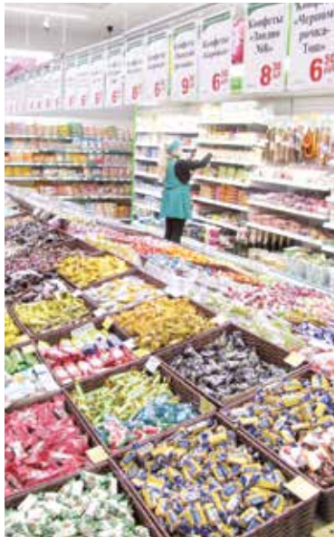
В магазине «Рамонак»