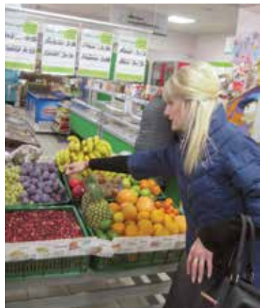
Деревенский магазин нынче не отличишь от городского. Есть даже ананасы и манго

Торговать на селе нынче может любой желающий. А значит, спать в шапку кооператорам уж точно нельзя: зазевавшись – потеряешь. Важно и взаимодействие с местными властями: у них с кооператорами общие цели – обеспечить достойное качество жизни людей независимо от масштаба населенного пункта. Чего не скажешь о временщиках, цель которых исключительно заработать. Вот и в Ивацевичском районе автомагазины кооператоров обслуживают жителей более полусотни деревень – в основном малонаселенных, куда не так просто добраться и где выручишь, как правило, немного. Но