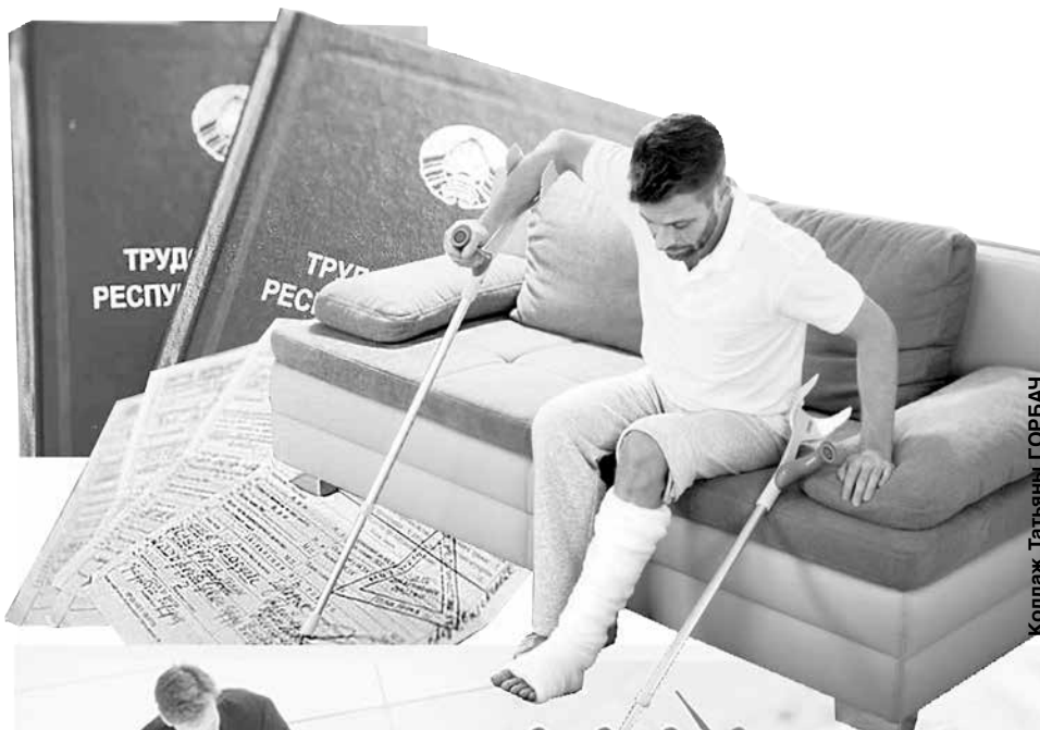
Коллаж Татьяна ГОРБАЧ

При увольнении работника по истечении срока действия контракта основанием является пункт 2 статьи 35 Трудового кодекса. В то же время основания увольнения работника по инициативе нанимателя изложены в статье 42 Трудового кодекса, которая не допускает увольнение временно нетрудоспособного работника (исключение – по п. 6 ст. 42) или ушедшего в отпуск. Исключение: ликвидация организации, прекращение деятельности филиала, представительства или иного обособленного подразделения организации, расположенных в другой местности, прекращение деятельности индивидуального предпринимателя. Иными словами, работник, имеющий на руках больничный лист, по инициативе нанимателя может быть уволен только по пункту 6 статьи 42 Трудового кодекса: в случае неявки на работу более четырех месяцев