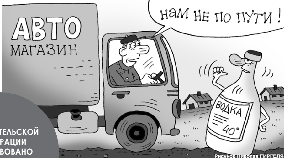
Рисунок Николая ГИРГЕЛЯ

В потребительской кооперации ни одного случая пьянства за рулем