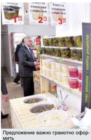
Предложение важно грамотно оформить

темпов роста товарооборота хозяйственных и мебельных магазинов стабильно в секторе положительных значений. Специализацию этих объектов сохраняем, видим хорошую финансовую отдачу.