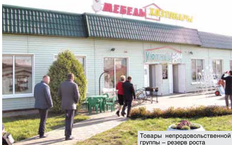
Товары непродовольственной группы – резерв роста