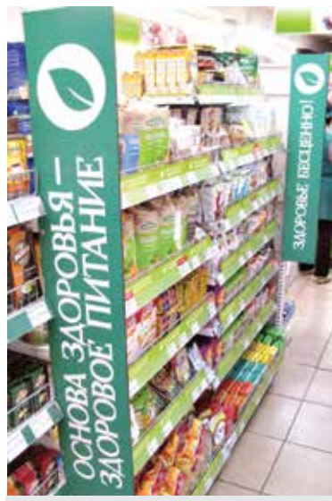
Товары здорового питания – узнаваемая ниша