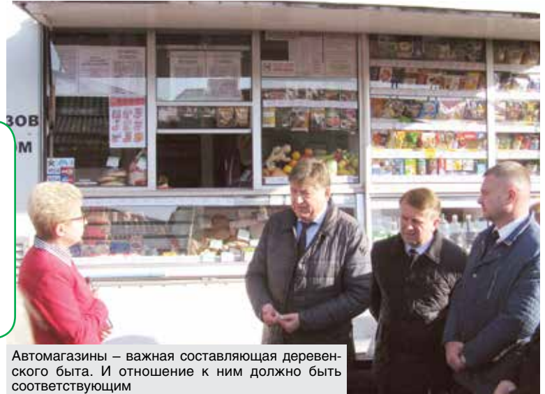
Автомагазины – важная составляющая деревенского быта. И отношение к ним должно быть соответствующим

Два реализующих «непрод» магазина «Мебель» и «Хозтовары» ивацевичские кооператоры объединили под одной вывеской – получился «Уютный дом». В мебельном пошлы по пути комплексной визуализации: здесь представлена мебельровка комнат, что называется, под ключ. Расширение ассортимента сопутствующих товаров (элементов декора, фурнитуры) прибавило к среднемесячной выручке около 3 тысяч рублей. Плюс организовали фирменные секции производителей. Напри-