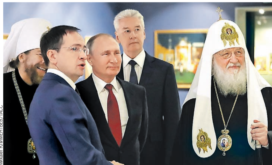
Министр культуры России Владимир Мединский, Президент Владимир Путин, мэр Москвы Сергей Собянин и Патриарх Кирилл осмотрели экспозицию в «Манеже».