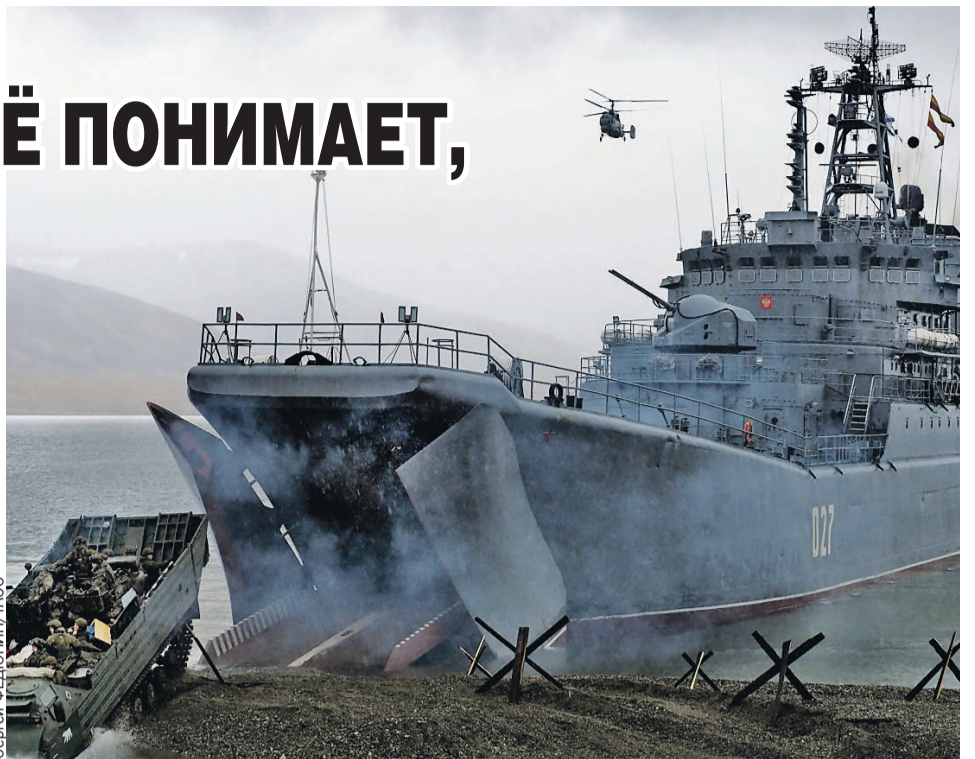
На совместных учениях россияне и белорусы отрабатывают блокировку «террористов» с моря, с воздуха союзные войска поддерживали тактическая авиация и вертолеты.

Но сильно опасаться этого не стоит: у нас будут развязаны руки, чтобы делать то, что считаем необходимым, открыто. Как сказал Владимир Путин, в бюджете на следующий год расходы на создание ракет средней и меньшей дальности заложены. Просто так деньги на них тратить не будут: в банальную гонку вооружений мы не ввяжемся, как в 1960-е годы, когда нас ею заморили. У России есть