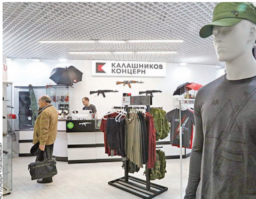
Месяц назад в центре Москвы концерт «Калашников» открыл фирменный магазин.

SOUZVECHNE.RU О СУДЬБАХ ИЗВЕСТНЫХ КОНСТРУКТОРОВ РОССИИ И БЕЛАРУСИ ЧИТАЙТЕ НА САЙТЕ