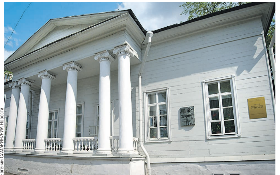
Серый особняк с белыми колоннами москвичи давно прозвали «Домом Муму».

● У Ивана Сергеевича были весьма противоречивые отношения со многими современниками. Со Львом Толстым он как-то поссорился так, что дело почти дошло до дуэли, после чего писатели не общались лет семнадцать, Федор Достоевский изобразил Тургенева в «Бесах» как испившегося литератора Кармазинова, прячущегося за границей. В отместку тот назвал Достоевского «русским маркизом де Садом».