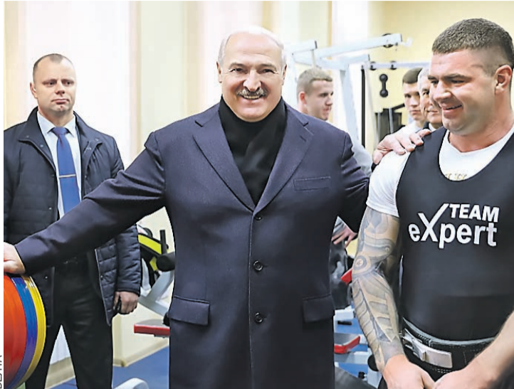
Посещая Дом культуры в Болбасово, Александр Лукашенко, естественно, не мог пройти мимо современного тренажерного зала.

– Здесь прекрасная логистика – международная