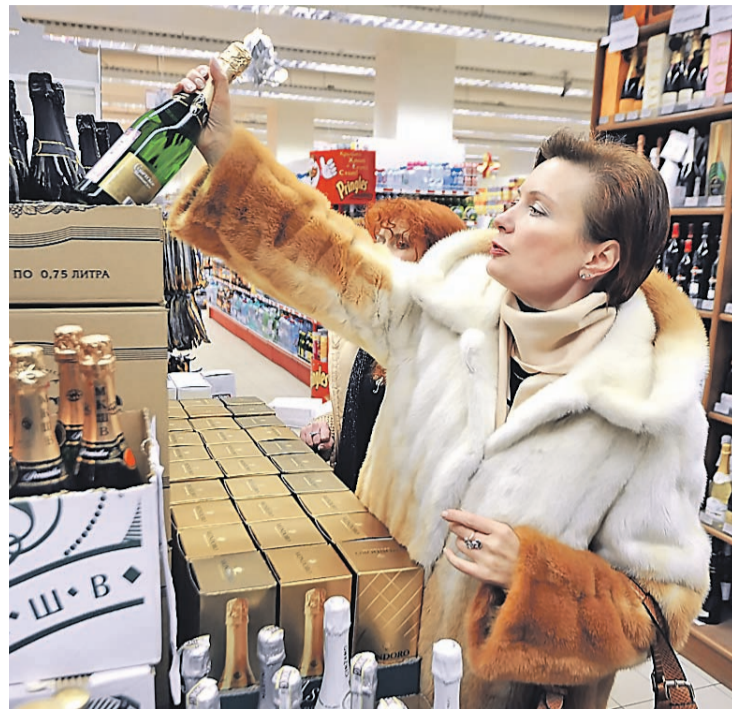
В скором будущем бутылки с горячительным в магазинах могут убрать с глаз долой.

– Что касается возраста, с которого предполагается разрешить покупать алкоголь, – пояснила министр здравоохранения России Вероника Скворцова (по профессии – невролог), – считаю приемлемым 21 год. До этого момента мозг еще находится в процессе формирования.