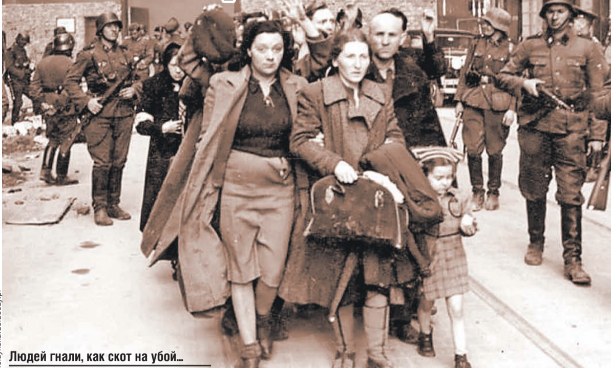
Людей гнали, как скот на убой...

около 80 тысяч человек — минчан, жителей близлежащих поселков и беженцев. В ноябре сюда же пришли первые эшелоны с «гамбургскими» евреями. Так называли двадцать тысяч человек, привезенных из Польши, Австрии, Чехии, Германии.