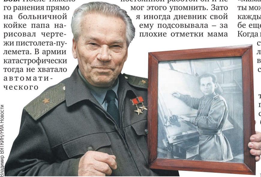
Из армии в конце 1940-х он уволился старшим сержантом, потом не служил, зато в наши дни сразу стал генералом.

оружия. Опытный образец попал в руки Благоврову: «Несмотря на некоторые недостатки, сам подход к теме заставляет смотреть на молодого сержанта как на будущего большого конструктора, которому надо еще учиться», – заключил академик. С рекомендацией папа поехал на центральный полигон стрелкового оружия под Москвой, где и создал затем свой знаменитый АК-47, положивший начало целому семейству автоматического оружия.