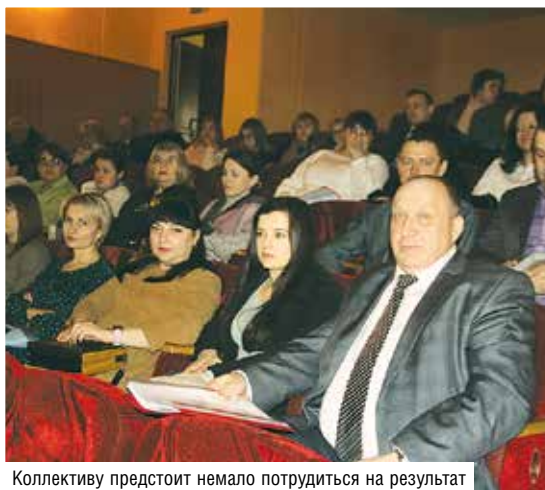
Коллективу предстоит немало потрудиться на результат