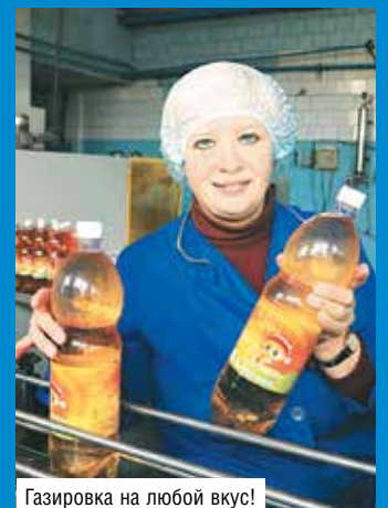
Газировка на любой вкус!

Безалкогольный цех выпускает сладкие газированные напитки «Mr Drink»: «Крем-сода», «Ключик», «Лимонад», «Ситро», «Дюшес», «С ароматом барбариса», «С ароматом тархуна», «Кола».