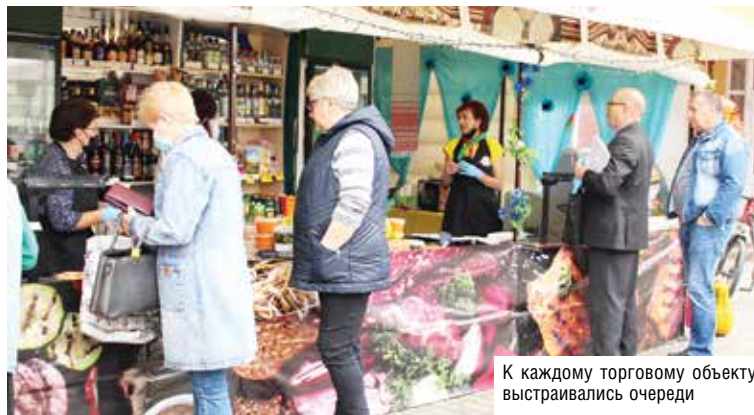
К каждому торговому объекту выстраивались очереди

В нашей истории есть знаковые даты, а теперь в их ряду появилась и еще одна – День народного единства. Торжества по случаю воссоединения белорусского народа 17 сентября 1939 года стартовали в Бресте 16 сентября с акции «Мы едины» и переместились в Березу, где были открыты реконструированный памятный знак рядом со зданием бывшего концентрационного лагеря Береза-Картузская и временная экспозиция внутри здания так называемых красных казарм.