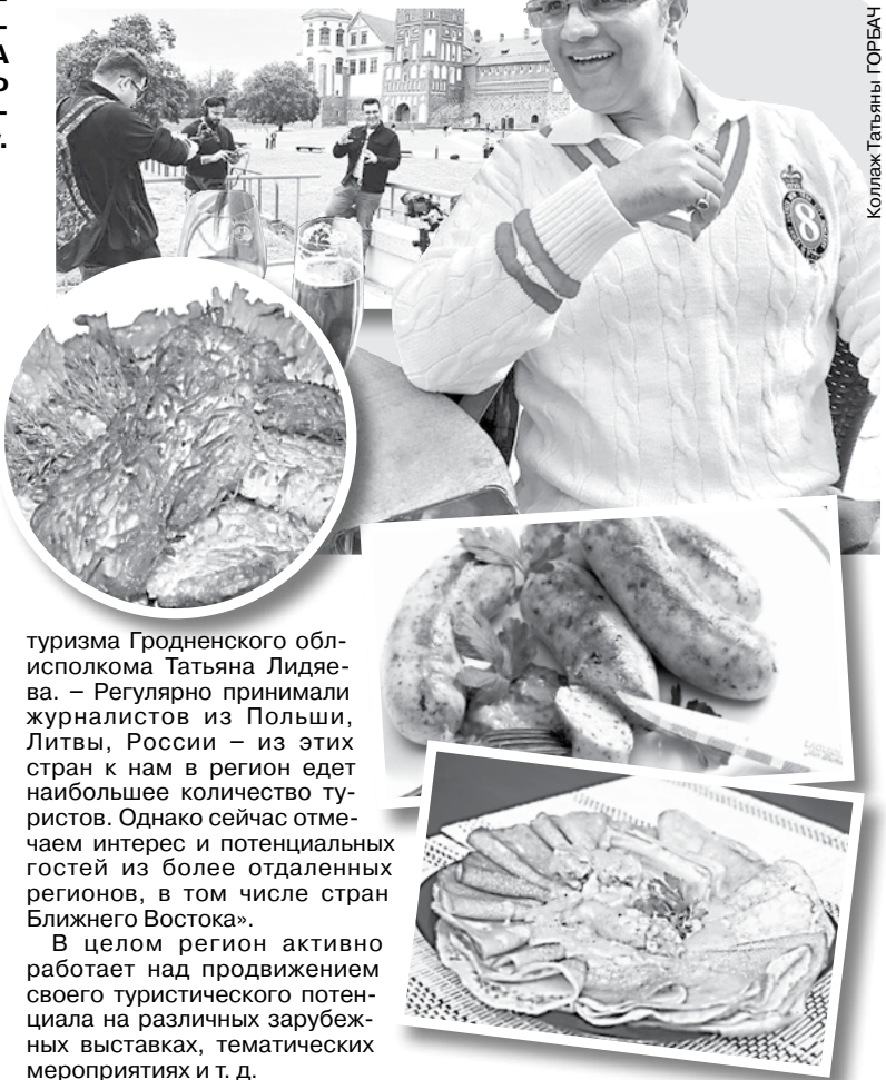
Коллаж Татьяна ГОРБАЧ

После Гродно съемочная группа продолжит работу в Брестской области. «Подобные пресс-туры способны привлечь дополнительный поток туристов, это уже устоявшаяся практика, – обратила внимание заместитель начальника управления спорта и