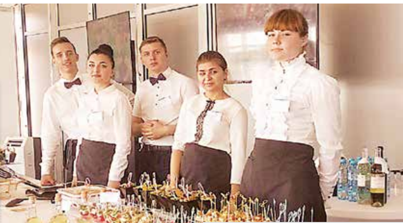
Участники обслуживания фуршета для VIP-персон во время проведения II Европейских игр в г. Минске.

Модернизированное кафе «Линия вкуса» является современной базой практики для учащихся колледжа и ресурсным центром по подготовке и переподготовке специалистов системы потребительской кооперации.