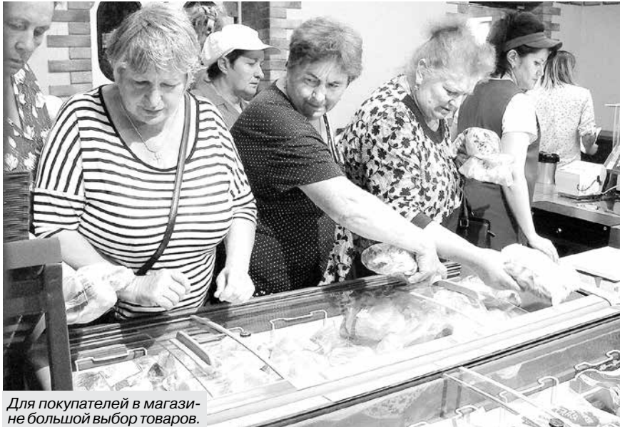
Для покупателей в магазине большой выбор товаров.