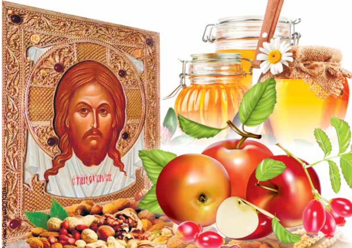
Рисунок Олега ПОПОВА

В наше время на освящение в храм несут корзины с самыми разными фруктами. В народном календаре в этот день провозглают лето. Этот праздник означает наступление осени и преобразование природы. Из-за этого есть даже еще одно народное название