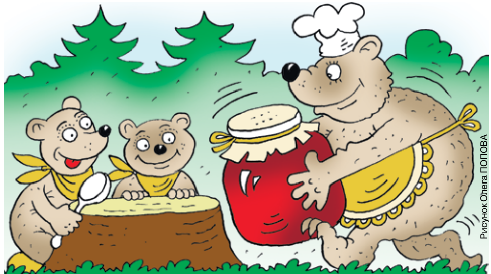
Рисунок Олега ПОПОВА

Хорошо известны полезные свойства малинового варенья. В состав самой ягоды входят углеводы – приблизительно 9 процентов,