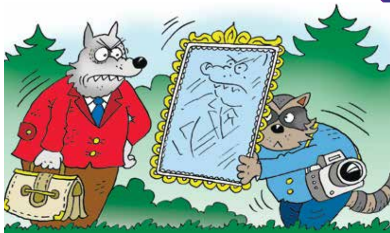
Рисунек Олега ПОПОВА