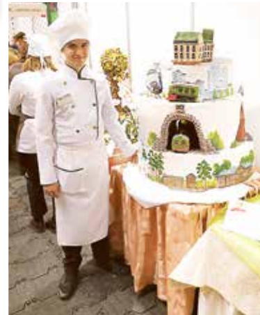
Участник чемпионата и конкурсная работа.

Объект укомплектован новым современным оборудованием, кухонным инвентарем, посудой, приборами.