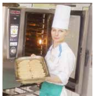
Производственный цех кафе «Линия вкуса».