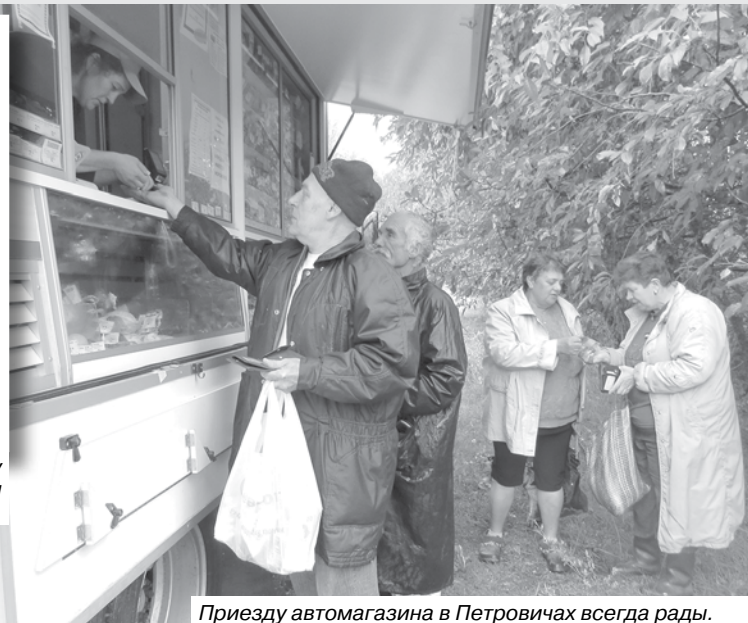
Приезду автомагазина в Петровичах всегда рады.