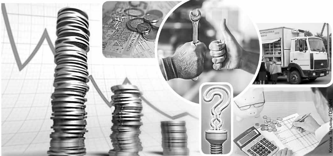
Коллаж: Татьяна ГОРБАЧ

П ятого августа в Белкоопсоюзе состоялось совещание, на котором были рассмотрены принимаемые меры по сокращению затрат на потребляемую электроэнергию и транспортные расходы.