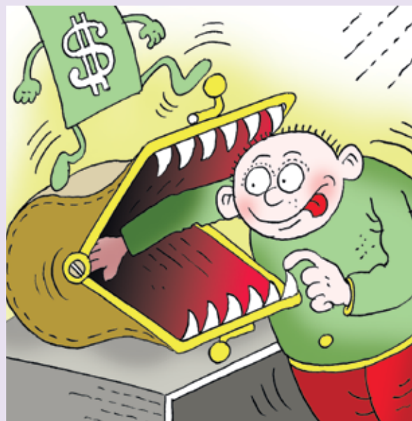
Рисунек Олега ПОПОВА

О, деньги, деньги, деньги, деньги! Порой так не хватает вас. Они доводят до депрессий, Впадаешь в ступор или в транс. Такие случаи бывают, Не застрахован ведь никто, Но когда люди роскошь знают, Сочувствию быть не дано. Всю жизнь встречали по одежке, А провожали по уму. Теперь же кланяются в ножки Не человеку – кошельку. Поддай товар – получишь деньги, Вон лезут с кожи – как их взять? Используют любые средства: Предательство, притворство, власть. Талант, искусство – все за деньги, Затмили совесть до краев. Нетчистоты души – подделка, За деньги купишь и любовь. Безнравственность, пороч- ность в моде, А чувства тут уж ни при чем.