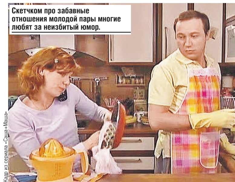
Скетчком про забавные отношения молодой пары многие любят за неизбитый юмор.