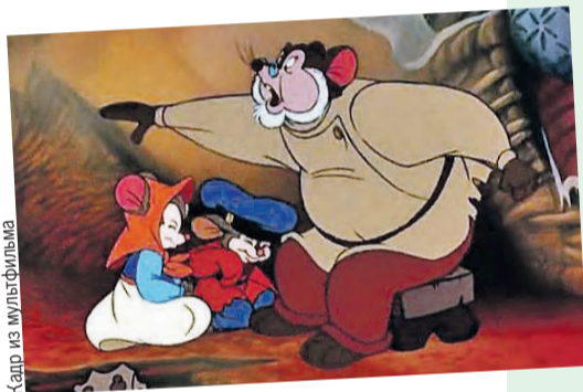
Кадр из мультфильма