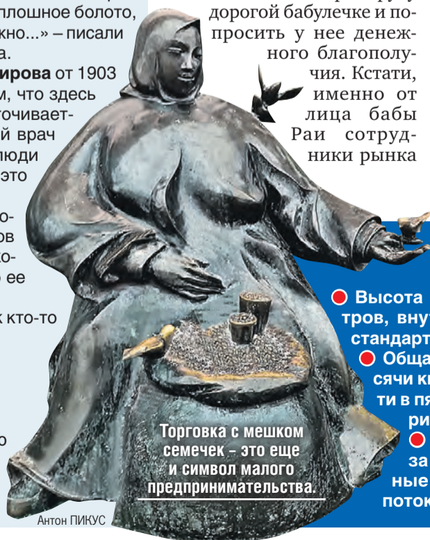
Торговка с мешком семечек – это еще и символ малого предпринимательства.