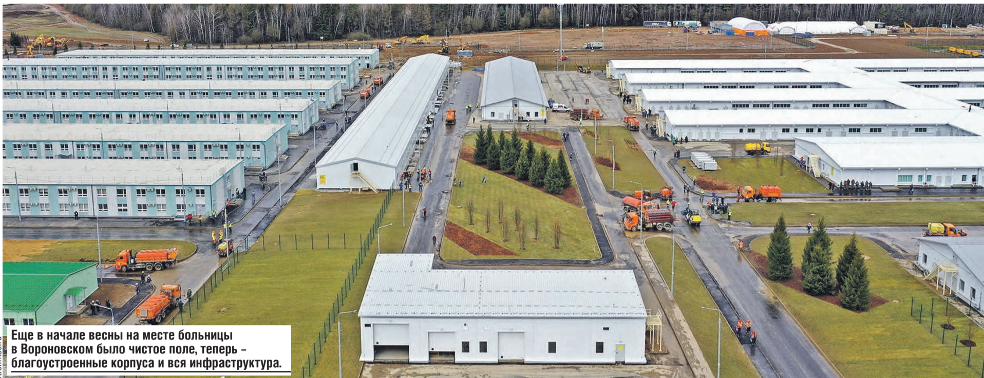
Еще в начале весны на месте больницы в Вороновском было чистое поле, теперь – благоустроенные корпуса и вся инфраструктура.