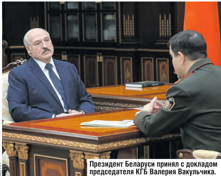
Президент Беларуси принял с докладом председателя КГБ Валерия Вакульчика.

– Это предприятие, которое мы строим под Минском, сродни атомной станции, которую мы в ближайшее время (первый блок) запускаем. Это сродни созданию высокоточного оружия в Беларуси, это космические проекты, которые мы осуществили и продолжаем работать.