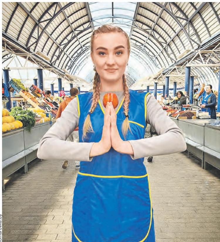
За свежие продукты и хорошее настроение отвечают красавицы продавщицы.

При этом всенародная любовь и популярность ничуть не испортили душевную атмосферу рынка. Покупатели, как и сорок лет назад, еле уносят отсюда нагружен-