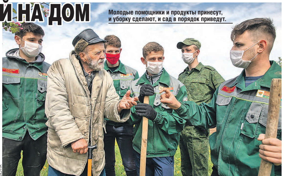
Молодые помощники и продукты принесут, и уборку сделают, и сад в порядок приведут.

У кого нет родственников, о тех заботится государство – в лице территориальных центров социального обслуживания.