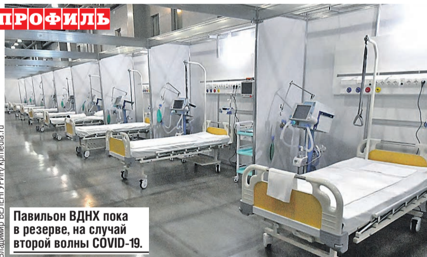
Павильон ВДНХ пока в резерве, на случай второй волны COVID-19.

Временный госпиталь развернули и в парке «Патриот» в Подмосковье. В Санкт-Петербурге под борьбу с коронавирусом отдали 7-й павильон выставочного комплекса «Ленэкспо».