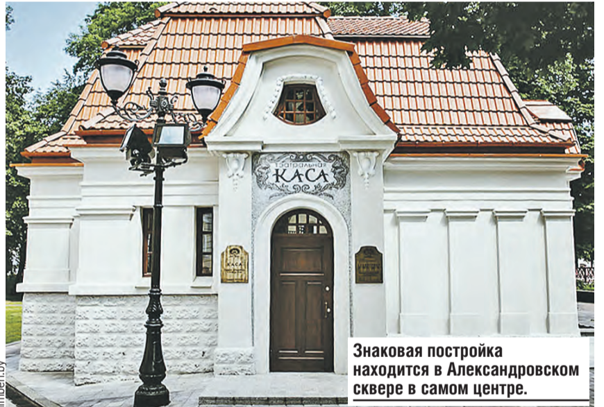
Знаковая постройка находится в Александровском сквере в самом центре.

При этом мало кто даже из коренных минчан догадывается, что, заходя в левое крыло Дома офицеров, они в некотором смысле попадают в... храм. Архитектор Иосиф Лангард не стал разрушать Свято-Покровскую церковь, на месте которой возводил свое детище. А просто вмуровал ее в новую грандиозную постройку. По легенде, именно это и уберегло Дом офицеров от разрушения в годы войны. Попыток взорвать и поджечь немцы предпринимали немало, но все оказались тщетными.