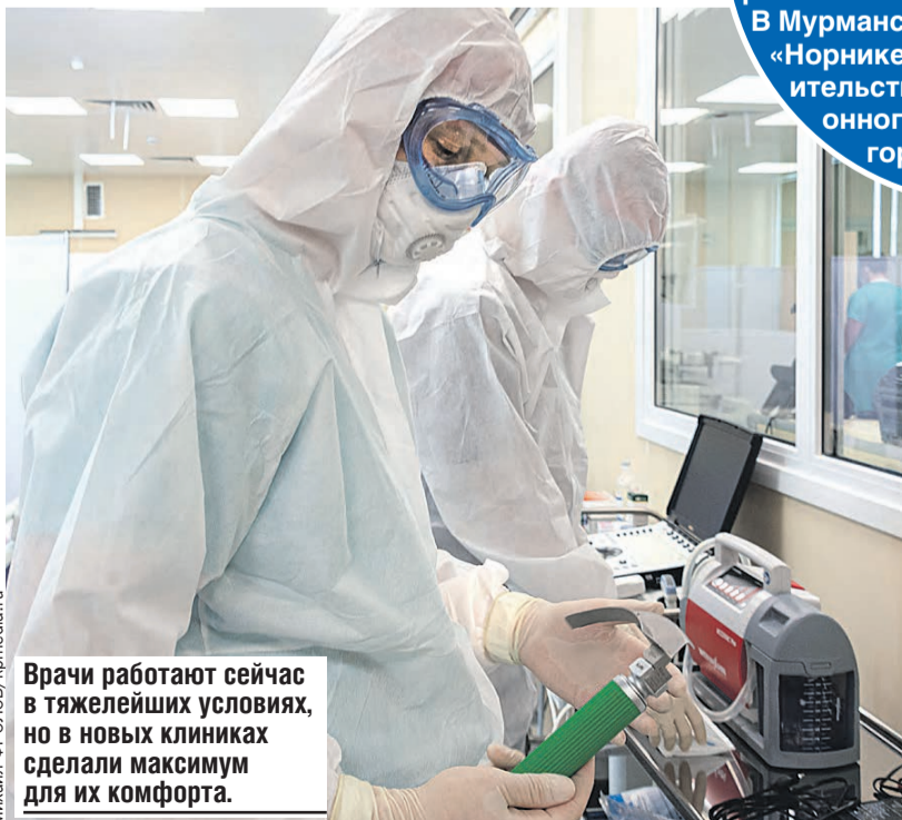
Врачи работают сейчас в тяжелейших условиях, но в новых клиниках сделали максимум для их комфорта.

коммуникаций пришлось проложить более десяти километров. Чтобы дело спорилось быстрее, включали для строителей музыку, переделанную «Песню военного шофера» Марка Бернеса, которая в новой версии звучала так: «Эх, стройка, дорогая, не страшна нам зараза любая. Отступить мы не умеем, на совесть строим – строим на века». Везде висели стимулирующие плакаты: «Закопаем вирус вместе с короной!», «Устал и опустил руки? Уступи место настоящему бойцу».