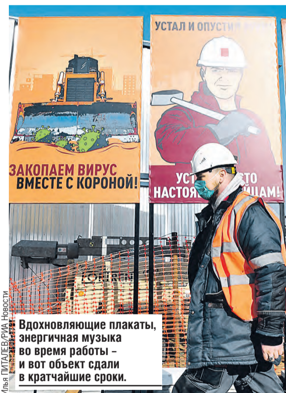
Вдохновляющие плакаты, энергичная музыка во время работы – и вот объект сдали в кратчайшие сроки.

Одновременно здесь в несколько смен трудились одиннадцать тысяч человек и 1,5 тысячи единиц техники: кранов, самосвалов, экскаваторов и так далее. На помощь пришли даже метростроевцы. Одних только