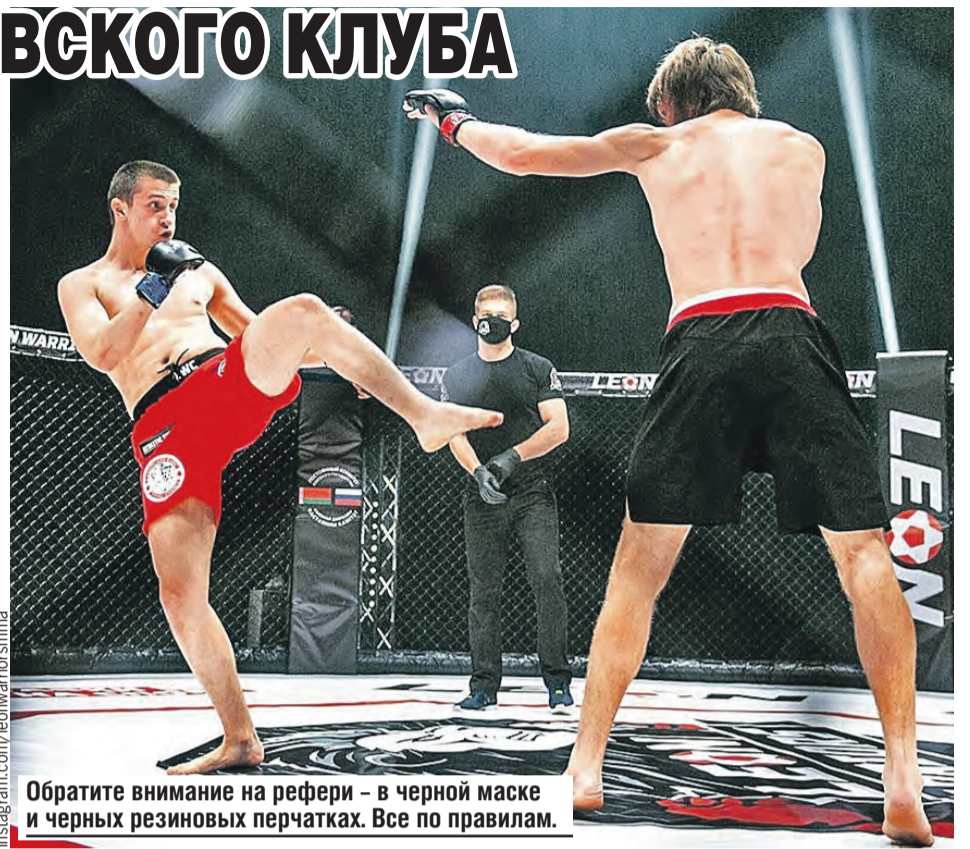
Обратите внимание на рефери — в черной маске и черных резиновых перчатках. Все по правилам.