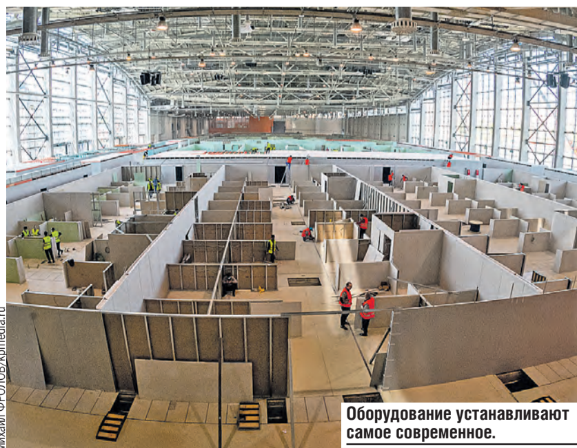
Оборудование устанавливают самое современное.