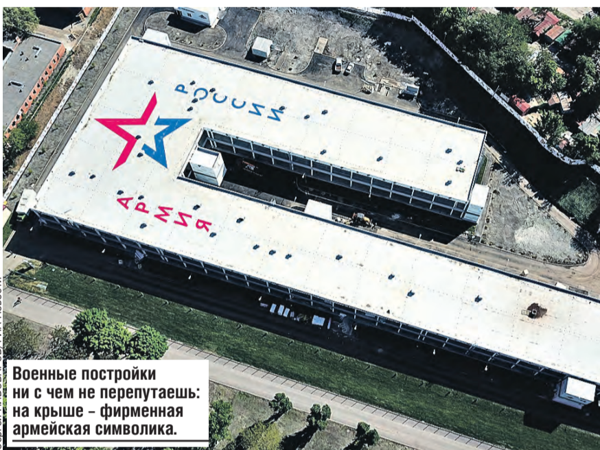
Военные постройки ни с чем не перепутаешь: на крыше – фирменная армейская символика.

Госпитали, в принципе, все однотипные, например, каждая палата в реанимации оборудована аппаратом ИВЛ. Но это только внешнее впечатление. Каждый из них строился с учетом местных особенностей. Так, в Пушкине вокруг здания больницы установили специальную дренажную систему на случай наводнения, укрепили грунт. По словам военных, такой корпус простоит теперь хоть сотню лет. А работать он будет и после окончания пандемии в отличие от клиник в том же Ухане. При этом всего за сутки его можно из инфекционного госпиталя перепрофилировать в хирургическое отделение: все оборудование для этого есть. А на Камчатке фундамент «военной» клиники сделали так, что здание выдержит даже девятибалльное землетрясение.