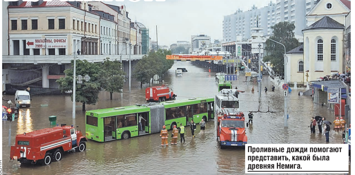
Проливные дожди помогают представить, какой была древняя Немига.

тысячу лет назад «были наполнены кровью»? Старшее поколение минчан еще помнит ее тоненьким ручейком, который рассекал центр города в послевоенные годы. Но в 1950-х решили заключить мелеющую речку в трубу и пустить под землей. Сказано — сделано. Древнее русло безошибочно аккуратно под асфальтом улицы Немига, напоминая о себе лишь в особо дождливые дни, когда на поверхности скапливаются огромные лужи.