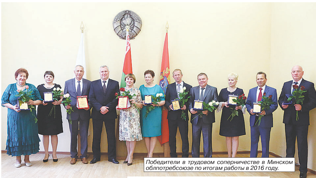
Победители в трудовом соперничестве в Минском облпотребсоюзе по итогам работы в 2016 году.