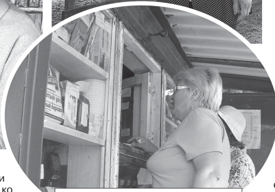
У торгового павильона в садовом товариществе «Купалинка»: кооператоры предлагают дачникам все, что нужно для труда и полноценного летнего отдыха.

идет торговля с тележек — на любой вкус и, так сказать, градус: кому жарко — мороженое, любителям погорячее — с пылу с жару пироги. За углом — стационарные объекты общественного питания, чуть поодаль — универсам «Родны кут» и кафе «Колос». Приобрести товары для дома, приодеться, поесть — у дзержинских кооператоров все это можно сделать практически одновременно.