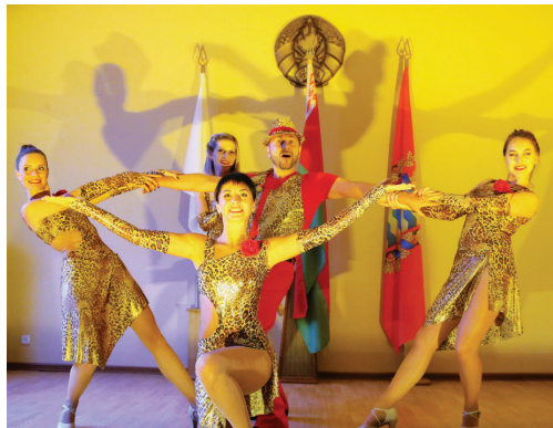
Большую концертную программу для участников праздничного торжества подготовили самодельные артисты Пуховичского района.

Александр РУДНИЦКИЙ