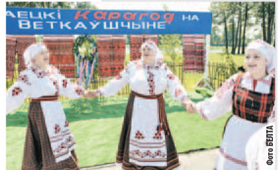
Участники фестиваля — фольклорный коллектив «Луца» из Кормянского района.

▶ Открытый фестиваль народного творчества «Гра-