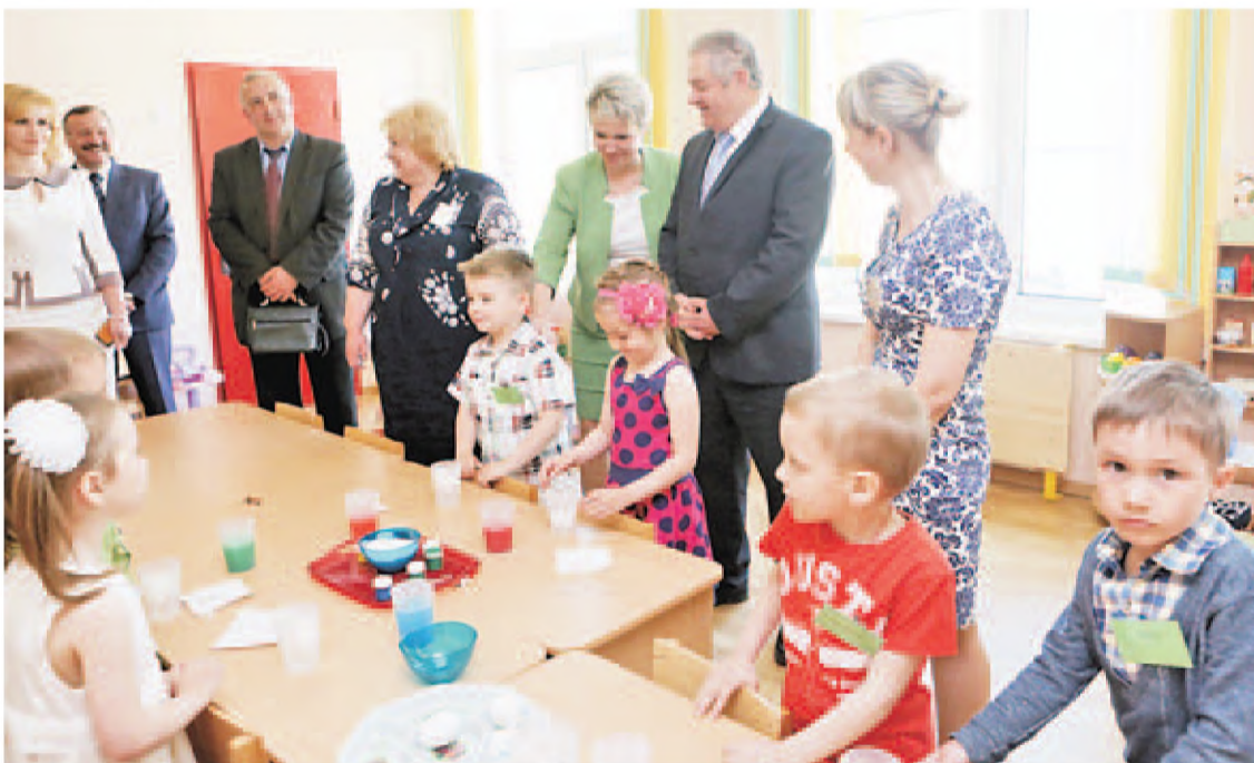
■ Председатель Миноблисполкома Семен ШАПЫРО во время открытия яслей-сада.

В ЦЕРЕМОНИИ открытия принял участие председатель Минского облисполкома Семен ШАПЫРО: «Уверен, что квалифицированный коллектив детского сада вложит сердце и душу в воспитание малышей, чтобы они гармонично развивались и радовали родителей успехами».