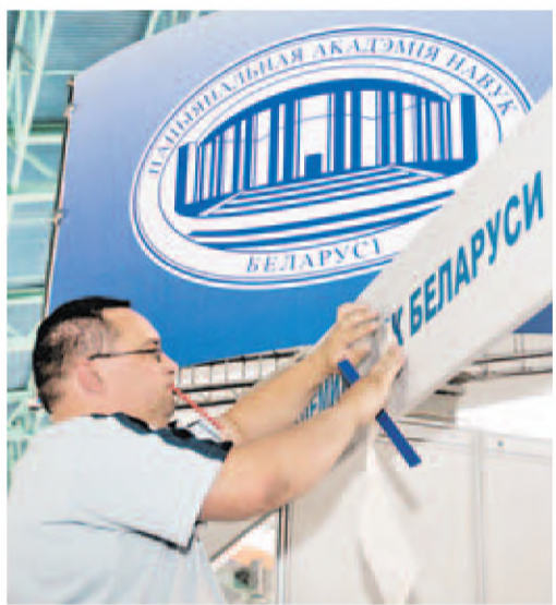
■ Стенд Академии наук Беларуси.

представим модель трактора «Беларус-152». До этого привозили с собой его предшественника — уже зарекомендовавшего