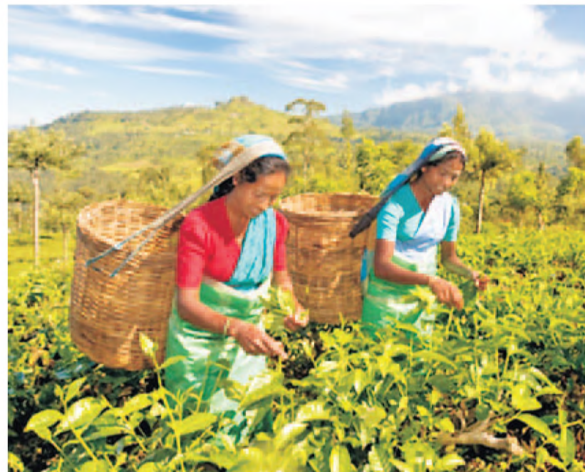
принимала участие в реконструкции энергообъекта в Беларуси.

Индийская горнодобывающая промышленность в настоящее время гото-