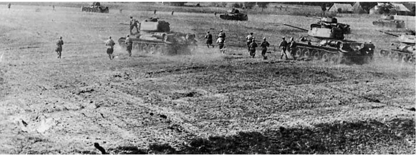
■ Взаимодействие танкистов и автоматчиков на Оршанском направлении. 1944 год.