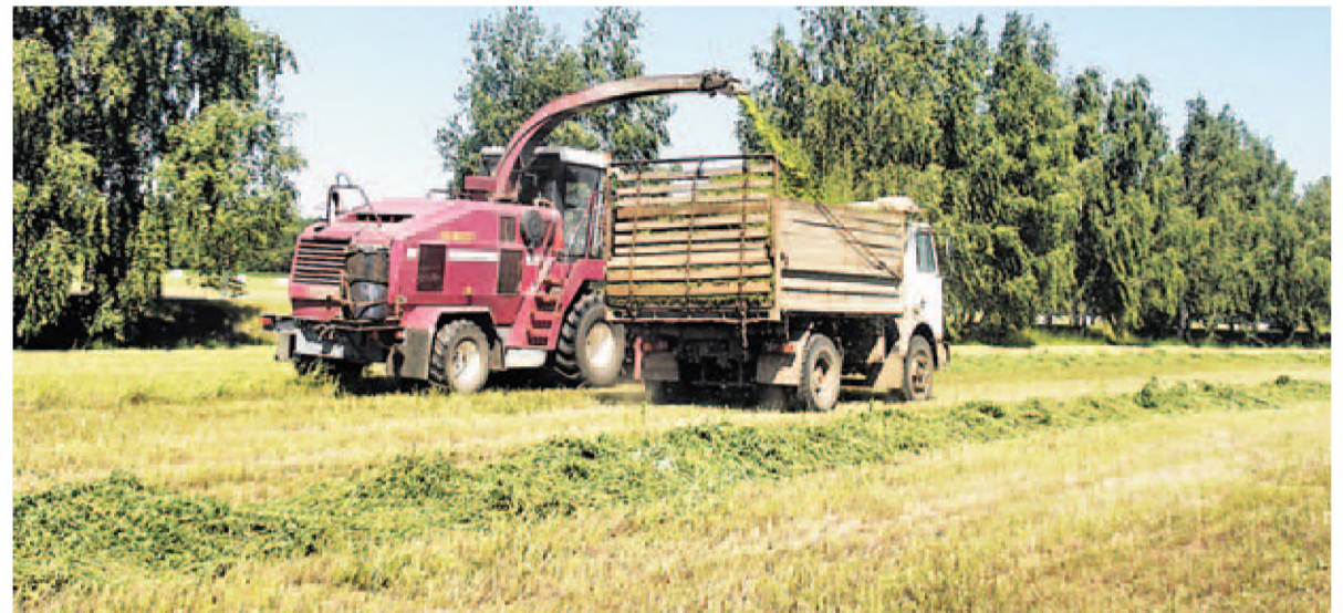
Возле деревни Заболоть Любанского района на люцерновом поле работают «КВК-800» и «МАЗ-555».

Василий ГЕДРОЙЦ, gedroiz@sb.by; Константин КОВАЛЕВ, «СТ», kovalev@sb.by