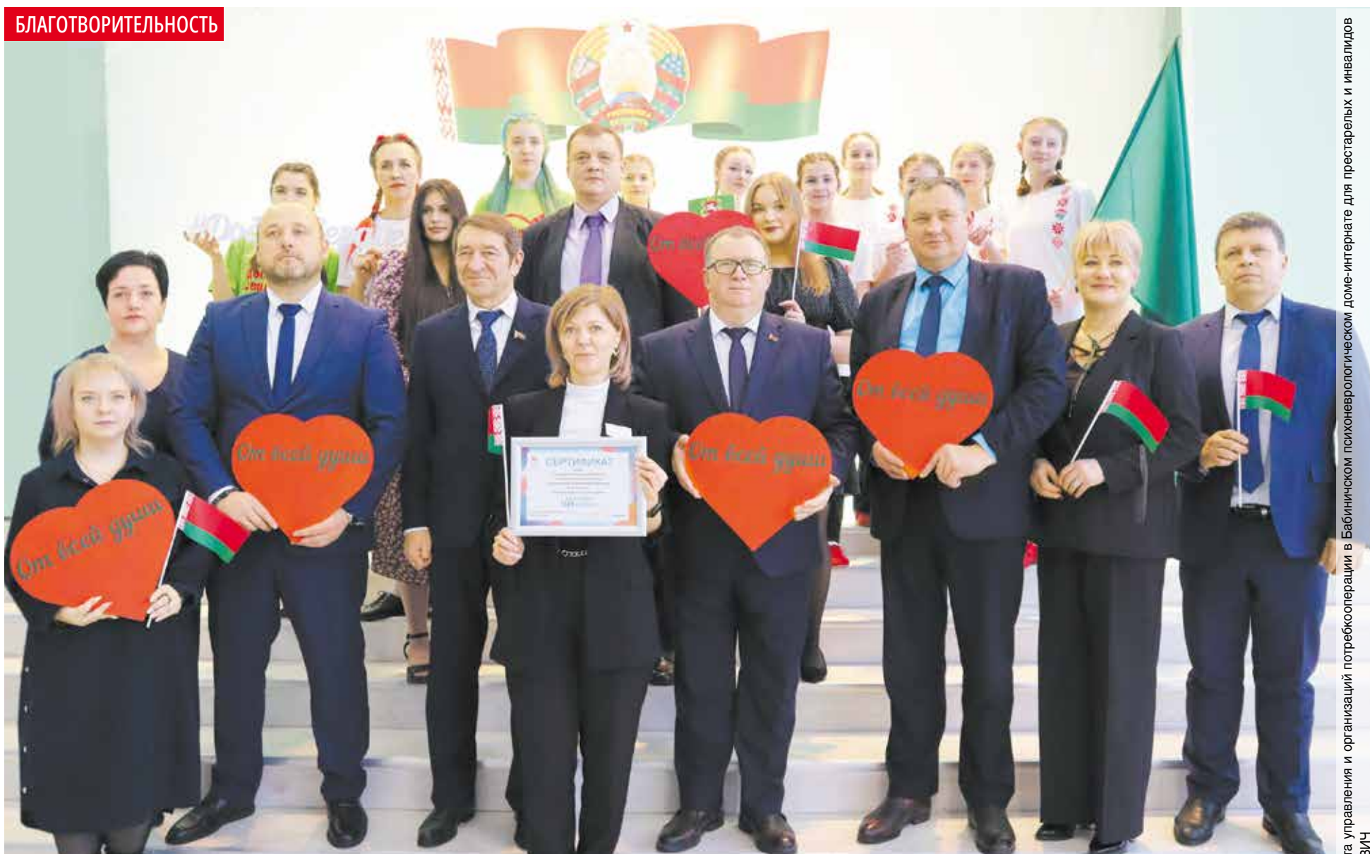
Делегация аппарата управления и организаций потребительской кооперации в Бабиничском психоневрологическом доме-интернате для престарелых и инвалидов