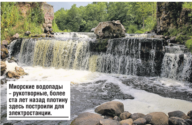
Миорские водопады – рукотворные, более ста лет назад плотину здесь построили для электростанции.

Прямо в центре города – озеро с живописной набережной. Погу- лять здесь в знойный летний денек – особое удовольствие. Главное, не забыть захватить краюшку хлеба: лебеди, утки и чайки, а их у берега много, угощению обрадуются. А еще на Миорщине можно увидеть настоящие водопады. И не спешите скептически качать головой: да откуда им взяться в Беларуси! Ко- нечно, с Ниагарским не сравнить, но на реке Вятя близ Прудников есть падуны, весьма внушитель- ные для равнинного ландшафта, вода в них будто кипит. В XIX ве- ке здесь даже поставили водяную мельницу. Спустя столетие постро- или электростанцию, которая по- давала электричество в городок и соседние деревни.