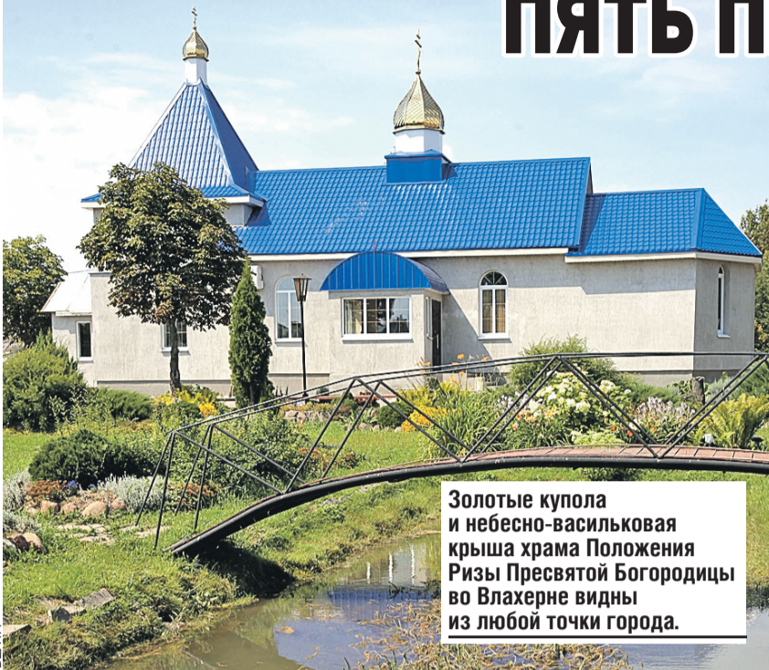
Золотые купола и небесно-васильковая крыша храма Положения Ризы Пресвятой Богородицы во Влахерне видны из любой точки города.