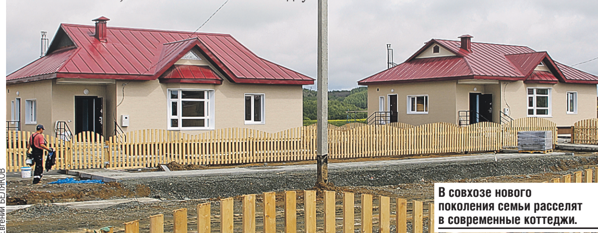
В совхозе нового поколения семьи расселят в современные коттеджи.

– Так и будем теперь путешествовать: то мы к ним, то они к нам – через весь континент, – говорит Ольга.