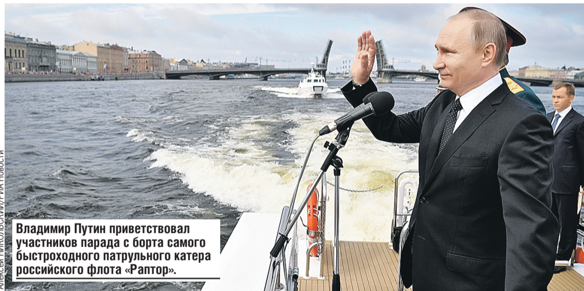
Владимир Путин приветствовал участников парада с борта самого быстроходного патрульного катера российского флота «Раптор».

– Как говорил адмирал Нахимов, у моряка нет трудного или легкого пути, есть только один – славный, – сказал Владимир Путин. – Морское