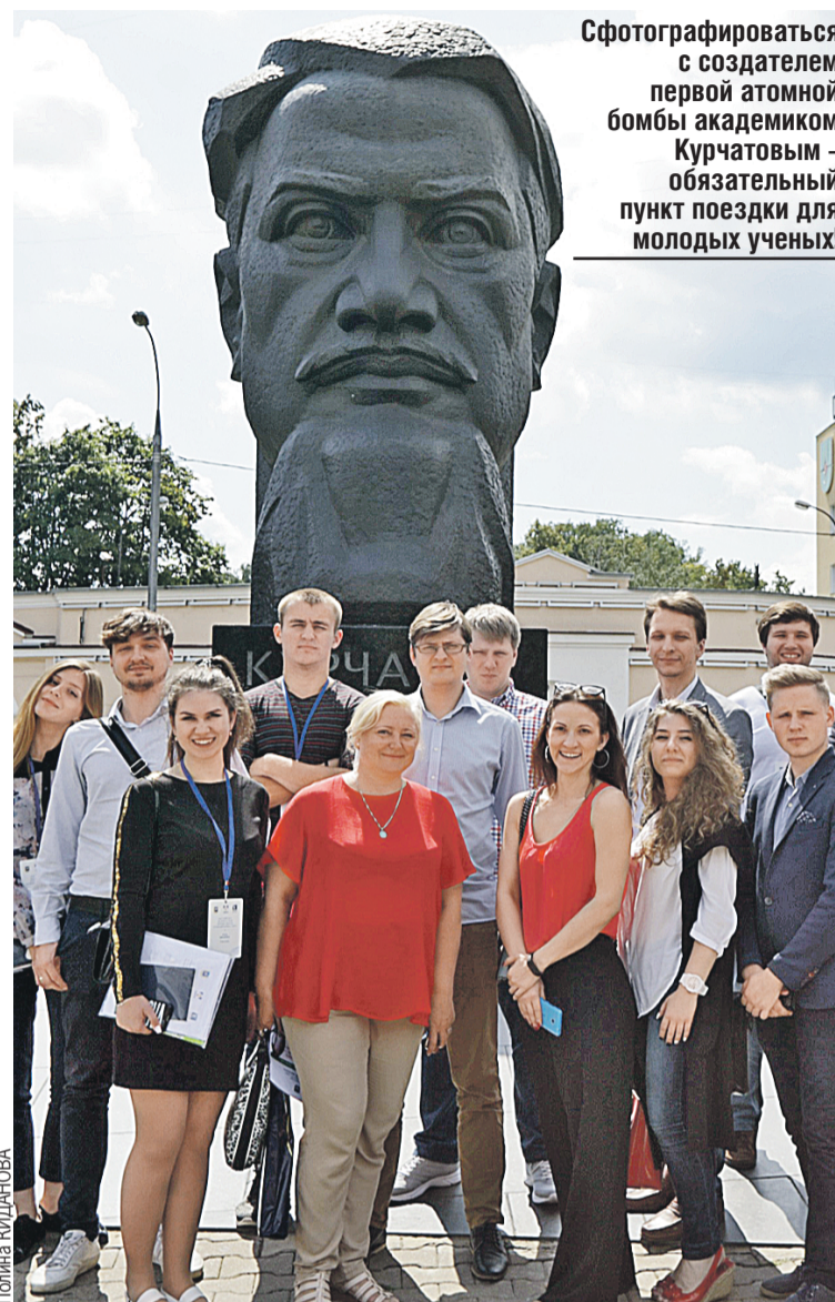
Сфотографироваться с создателем первой атомной бомбы академиком Курчатовым – обязательный пункт поездки для молодых ученых!

– К 2040 году информационное пресыщение приведет к снижению интеллектуальных способностей человека, люди будут более восприимчивы к информационным атакам. У российско-белорусского союза есть два пути: информационный паритет или сдерживание. Либо Союзное государство будет иметь средства защиты и нападения и сохранять информационный паритет с третьими странами, либо недооцен-