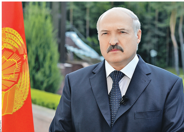
В своем видеообращении Александр Лукашенко призвал военных и дальше встречаться на Играх, а не на поле боя.

– В таком соперничестве заключен глубокий смысл, – обратился к участникам Игр Александр Лукашенко. – Ведь, согласитесь, привычнее видеть людей с оружием в руках на мощной военной технике на поле боя. Поэтому мирные встречи военных на тренировочных площадках – лучшее доказательство доверия между государствами и их Вооруженными силами. Сегодня это особенно актуально. В мире неспокойно. Международный терроризм угрожает всем без исключения государствам. К сожалению, и общая обстановка в мировом сообществе отличается напряженностью. Поэтому