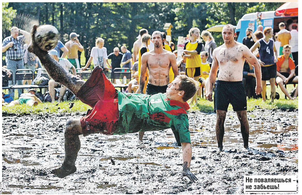
Не поваляешься – не забьешь!

На старт! Внимание! Коси! Белорусы давно решили, что просто убирать высокую траву с полей – это неинтересно. Поэтому решили устраивать каждый год соревнования. Крепкие мужики со старой доброй косой наперевес состязаются, кто быстрее и чище пройдет дистанцию. А после работы можно и отдохнуть. Еще более веселые на «Споровских сенокосах» соревнования по болотному футболу. По колено в грязи, вымазанные по уши, но счастливые спортсмены пинают мяч, выковыривая его из луж. Забавнее зрелище вы вряд ли где увидите.