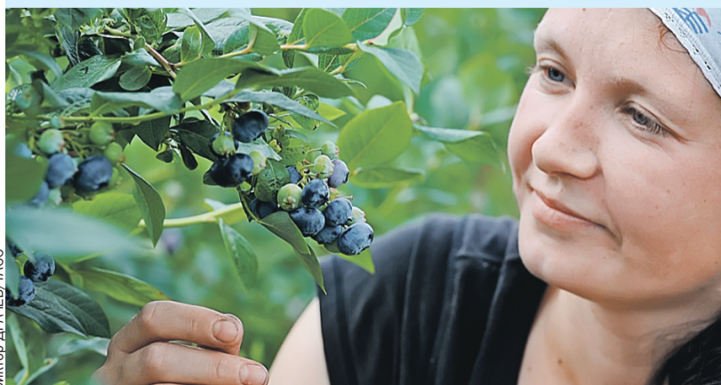
Сбор ягод – работа кропотливая, каждую надо срывать отдельно и бережно укладывать в ведро.

Вообще голубика появилась на полях Беларуси еще в конце 70-х годов прошлого века. Сначала в ботаническом саду и на экспериментальных территориях, затем на колхозных полях. За это время белорусские аграрии «приручили» больше шестидесяти сортов ягоды. Сегодня на голубике специализируется больше сотни фермерских хозяйств по всей стране.