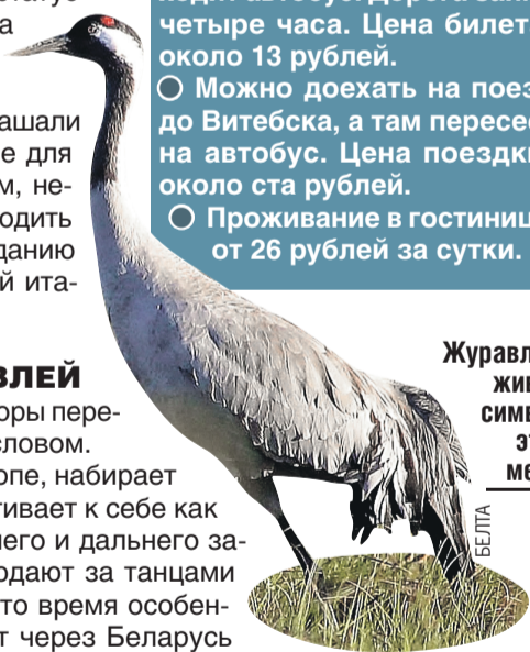
Журавль – живой символ этих мест.