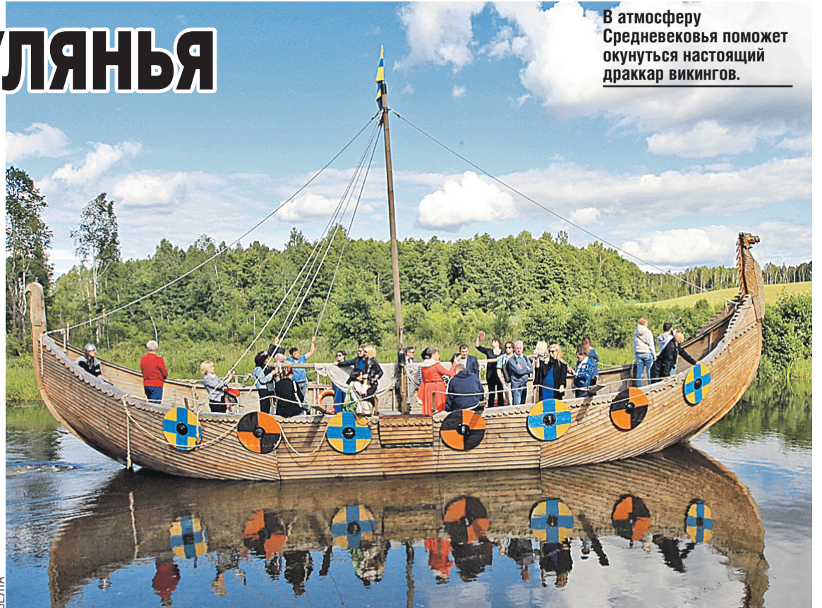
В атмосферу Средневековья поможет окунуться настоящий драккар викингов.

Эту некогда крупнейшую ярмарку возродили в республике несколько лет назад. Известна она еще с начала XVIII века, когда главным товаром здесь были лошади. Сейчас скакуны – скорее символ праздника. Их выводят в нарядной сбруе, запрягают в украшенные по-