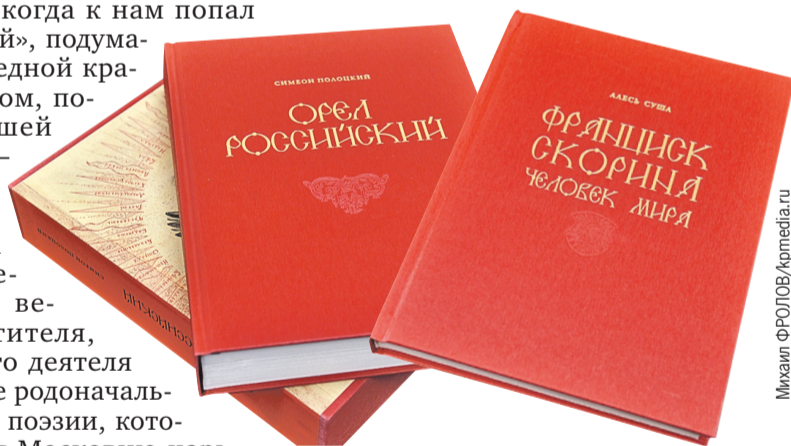
Получить такие красивые издания захочет любой коллекционер.

Книгу «Симеон Полоцкий. Орел Российский» министр культуры области назвала «настоящим произведением искусства» и заверила, что все двести экземпляров (по сто каждой книги) отправятся в библиотеки. Вдобавок в ближайшее время их оцифруют, и в сети появятся электронные версии.