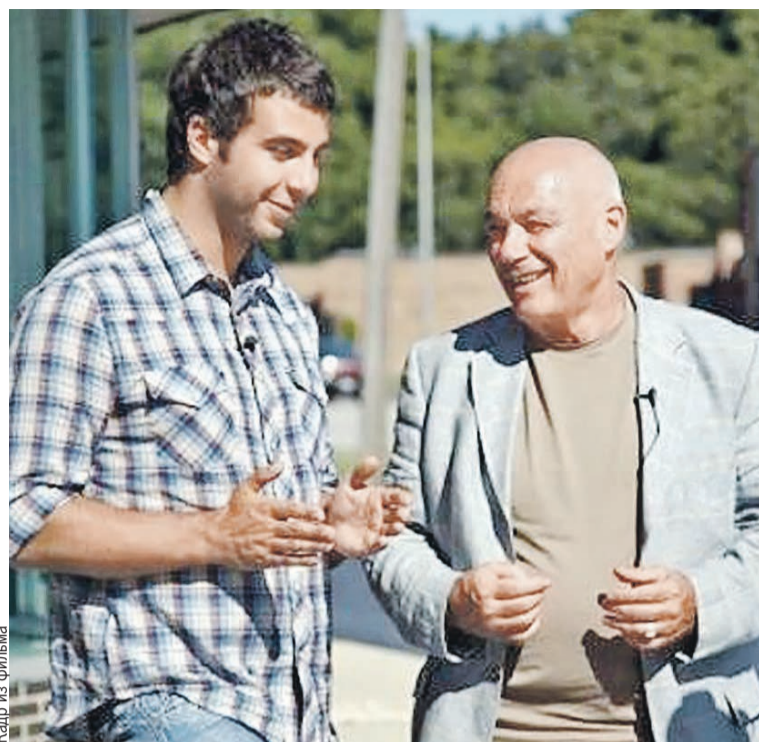
Иван Ургант и Владимир Познер, несмотря на разный возраст, уже стали корифеями отечественных медиа.

– Наши приграничные издания пели одну песню. Мне кажется, что сейчас именно региональным, районным, городским газетам не хватает вот такого общения. Хотя бы в виде пресс-туров. Не только в соседние регионы, но и вглубь России. Центральные СМИ имеют возможность выезжать и писать, так дайте и нам, региональщикам, возможность потрогать маленькие города России, чтобы лучше почувствовать пульс нашей братской страны. А российские журналисты пусть чаще приезжают к нам.