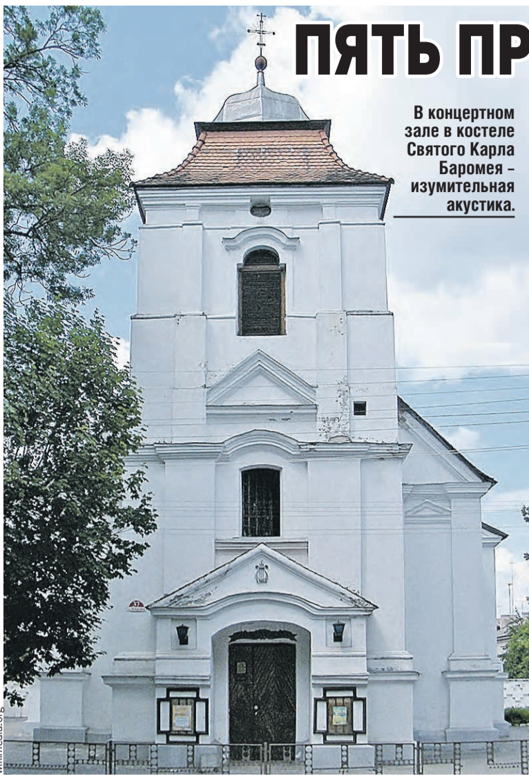
В концертном зале в костеле Святого Карла Баромея – изумительная акустика.