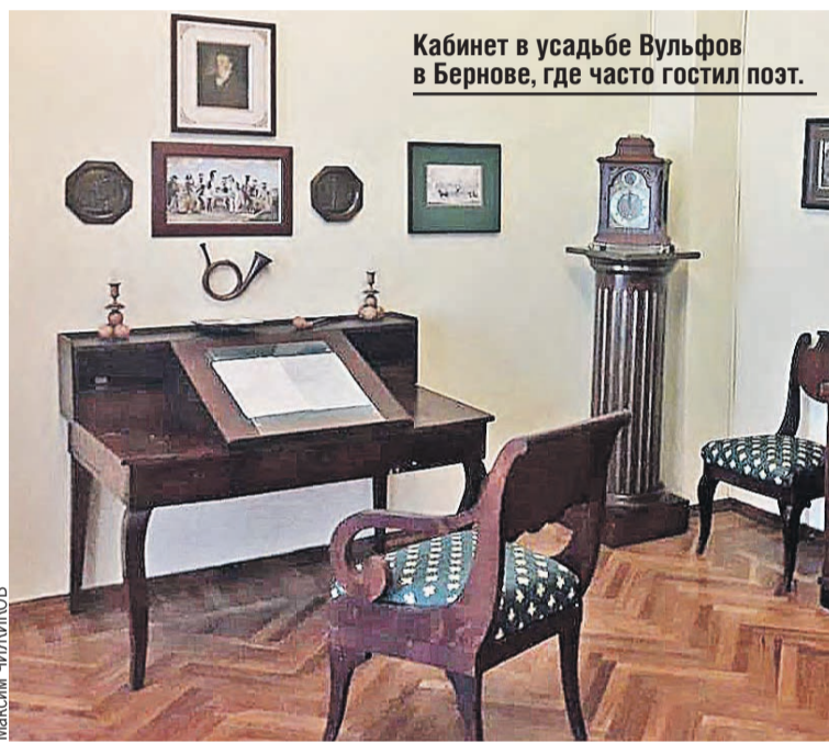
Кабинет в усадьбе Вульфов в Берново, где часто гостил поэт.

Зато Пушкин именно здесь воспринял себя как поэта, когда лицеисты провожали гвардейские полки на войну с Наполеоном. Ему было тринадцать. К остальным учебным занятиям он относился легко и беззаботно. По воспоминанию его одноклассника Ивана Пущина, «все научное он считал ни во что и как будто желал только доказать, что мастер бегать, прыгать через стулья, бросать мячик». Увальнем он уже не был.