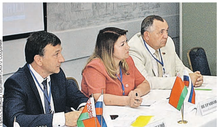
В прениях прозвучало немало острых, но конструктивных предложений. Депутаты Парламентского Собрания взяли их на заметку.

Часть участников семинара, в основном мужчины, восприняли прозвучавшие цифры весьма эмоционально. Дескать, если в соцсетях больше сечет молодежь, то что же – давай поголовное омоложение кадров? И кто придумал, что человек, которому за 60, заведомо ретроград? Опыт показывает, что талантливый человек и в 70 лет может дать фору любому молодому. Таких примеров полно и в Беларуси, и в России. Никто ведь не спрашивает, сколько лет тому же Киселеву, Соловьеву или Познеру.