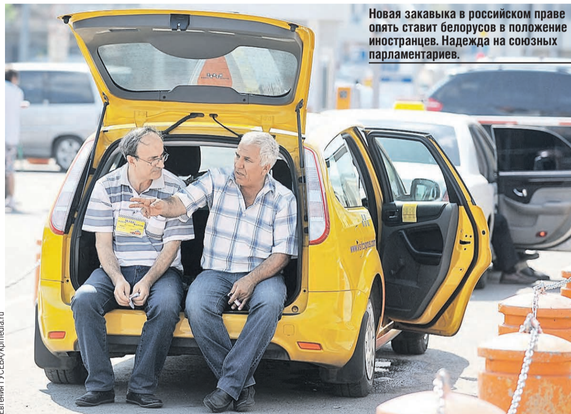
Новая закладка в российском праве опять ставит белорусов в положение иностранцев. Надежда на союзных парламентариев.