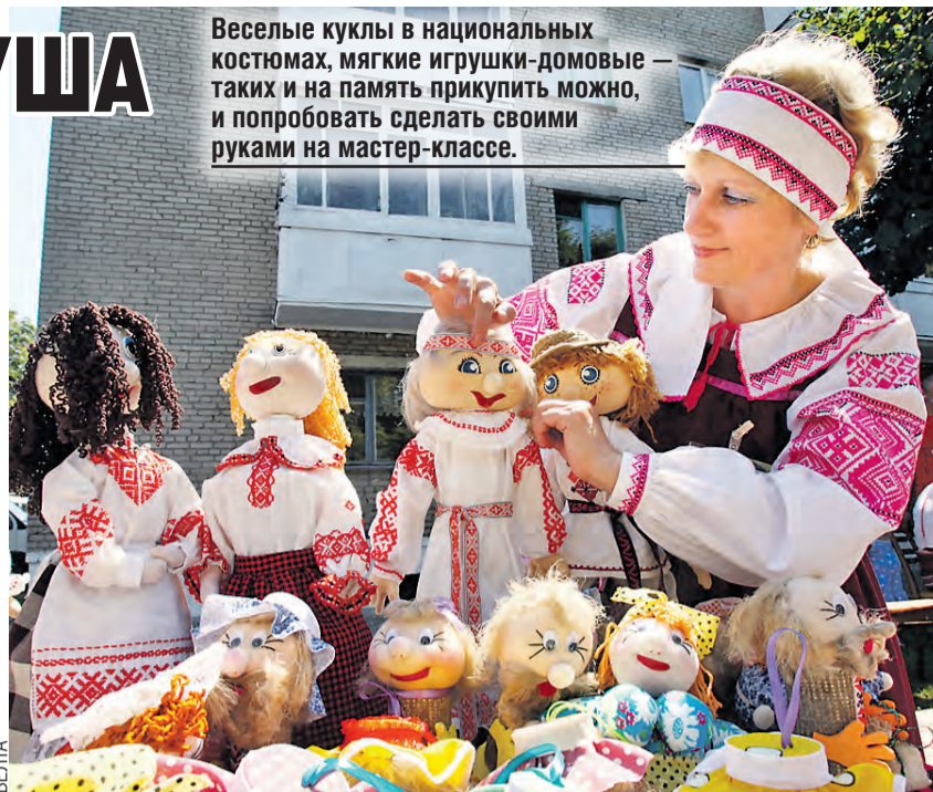
Веселые куклы в национальных костюмах, мягкие игрушки-домовые — таких и на память прикупить можно, и попробовать сделать своими руками на мастер-классе.

Грозовые тучи, молнии, проливной дождь... Природа добавила драматизма — лучшие декорации для пьесы Софокла «Царь Эдип» сложно придумать. Промокшие до нитки, но довольные эффектом, постановку в московском парке «Зарядье» показали студенты Белорусского государственного университета культуры и искусств. Здесь проходит III Международный фестиваль театральных школ стран БРИКС, посвященный древнегреческой трагедии. В этом году, кроме России, Бразилии, Индии, Китая и Южной Африки, к фестивалю присоединились Армения и Беларусь — всего более четырехсот студентов театральных школ.