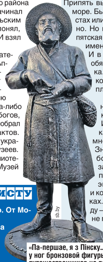
«Па-першае, я з Пінску...» можно прочитать у ног бронзовой фигуры, которая встречает путешественников на пешеходной улице Ленина.

А уж рыбы, птиц и разного зверья в здешних краях видимо-невидимо. И отдых на природе шикарный. Заповедных мест много, выбирай на вкус. Знаменитые Ольманские болота, например. Или заказник «Средняя Припять». Тут вам и пешую экскурсию организуют, и конную, и сплав на байдарках. Главное, беречь природу – костры не разводить, где не положено, и мусор после себя не оставлять.