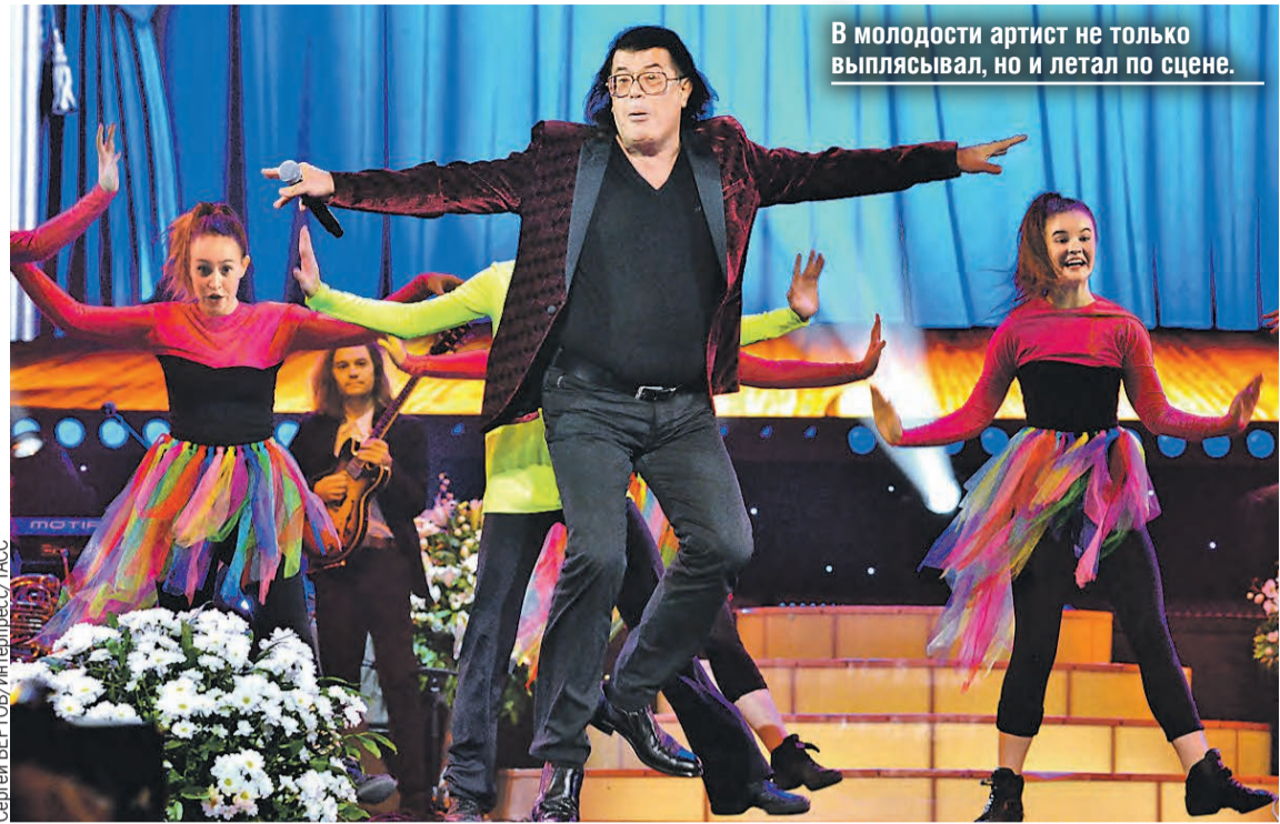
В молодости артист не только выплясывал, но и летал по сцене.

– У Леонтьева были концерты в Питере. И я показал ему песню. Но Валера