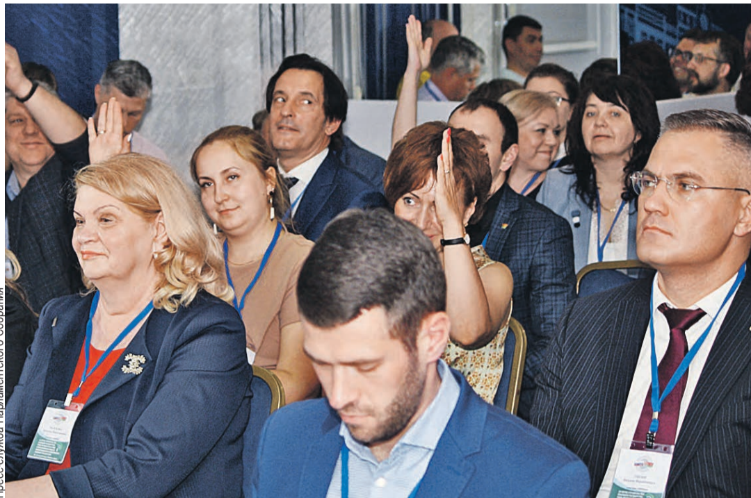
На вопрос, у кого в аккаунте наберется десять тысяч подписчиков, несколько участников семинара подняли руки. Тем не менее продвижение бренда Союзного государства в интернете решено активизировать с расчетом в первую очередь на молодежную аудиторию.

Как раз об этих точках риска, угрозах информаци-