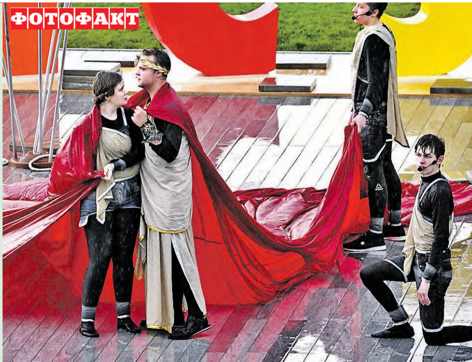
Владимир ПЕЧЕНГУРИА Новости