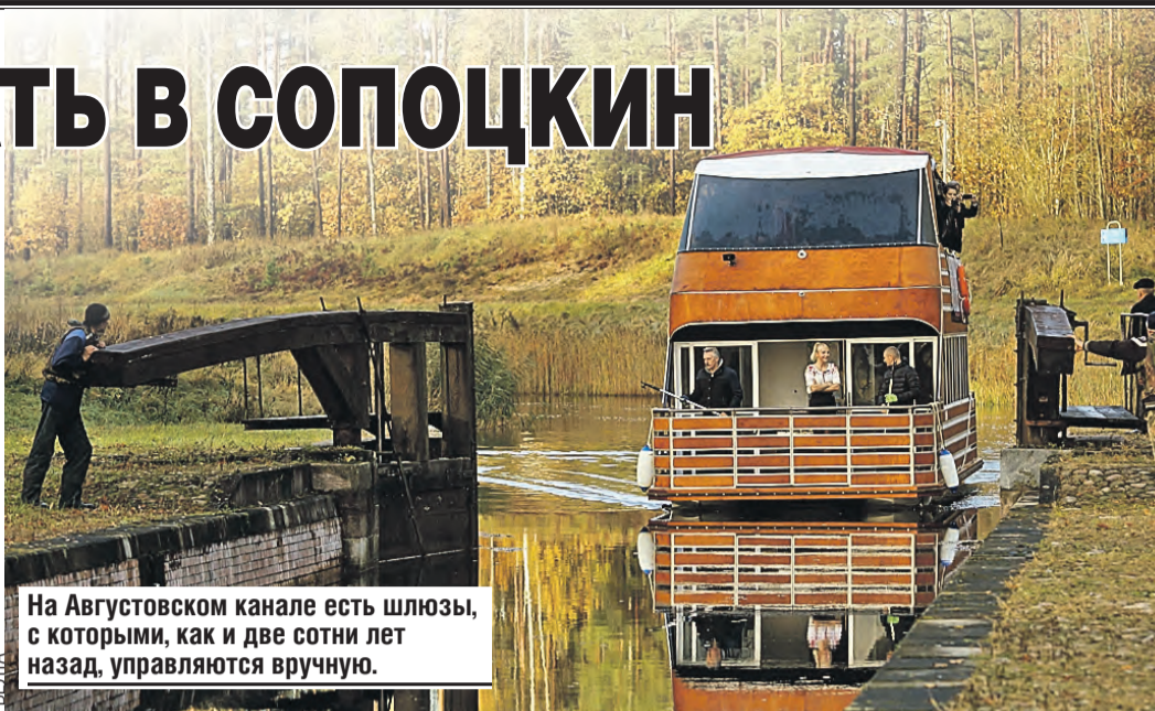
На Августовском канале есть шлюзы, с которыми, как и две сотни лет назад, управляются вручную.

дятся белорусская, польская и литовская границы. Потому местечко с пятивековой историей – симбиоз культур, обрядов и традиций.