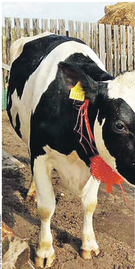
Кормилица быстро адаптировалась к новому дому: теперь только успевай свежее молоко на стол подавать.

Бывший председатель Верховного Совета Беларуси Станислав Шушкевич вспоминал историю, произошедшую в начале 1990-х годов. Будущий Президент Беларуси сделал ему сюрприз – забил багажник личного автомобиля огурцами со своего собственного огорода.