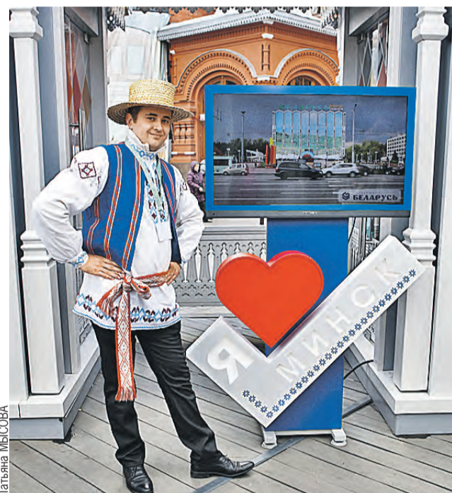
Минские достопримечательности льготно расположились прямо на фоне Кремля и Исторического музея.

В рамках Дней Минска это не единственная площадка, где можно закупиться белорусскими товарами. До 15 октября еще одна ярмарка работает на Профсоюзной улице, д. 41, возле метро «Новые Черемушки». Помимо мяса, сыров и сладостей там продаются обувь производства компаний «Марко» и «Луч» и трикотаж от «Свитанка» и «Калинки». Продуктовая выставка открыта и на ВДНХ – в павильоне «Республика Беларусь».