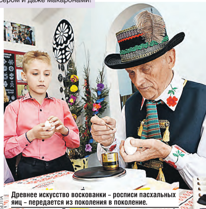
Древнее искусство воскованки – росписи пасхальных яиц – передается из поколения в поколение.