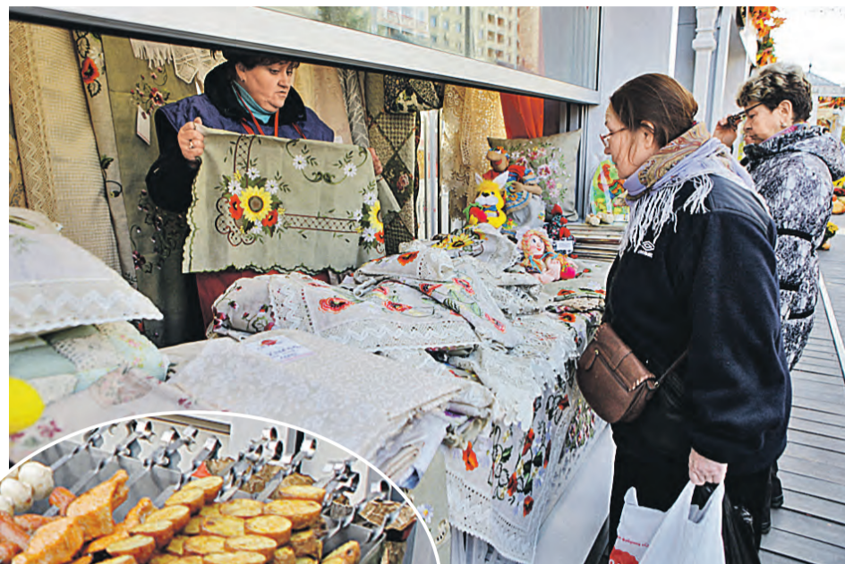
Каждая модница знает, что белорусский лен – всегда качественно и красиво.