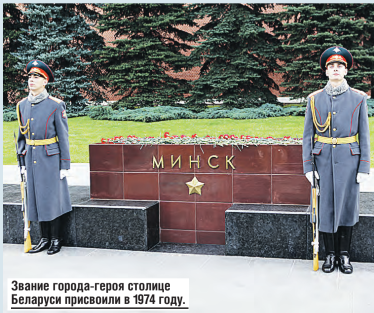
Звание города-героя столице Беларуси присвоили в 1974 году.

Экскурсию для белорусов провел директор парка Па-