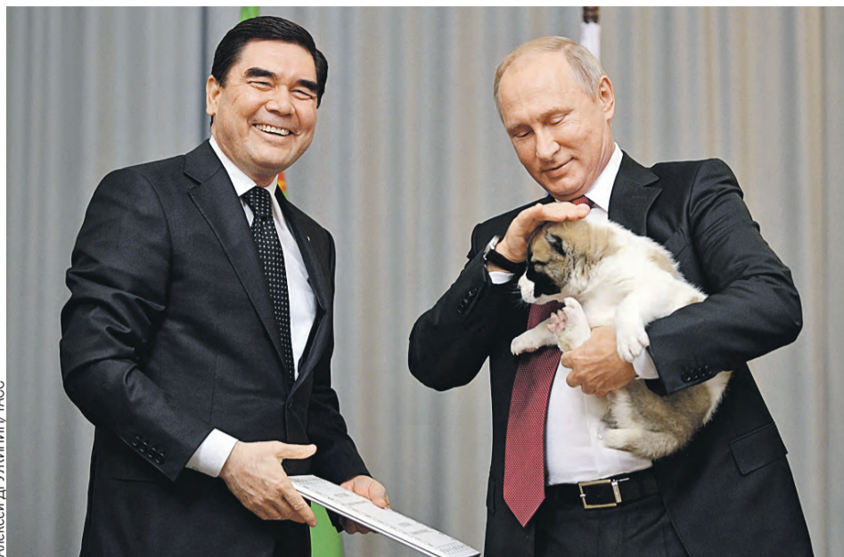
Александр Лукашенко раскритиковал неэффективную работу некоторых структур Содружества и предложил их реформировать.