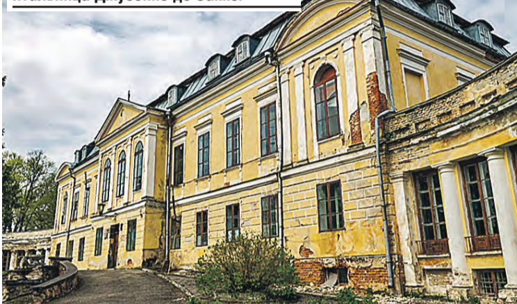
Дворец в Святске строили по проекту королевского архитектора, именитого итальянца Джузеппе де Сакко.

Железные дороги снизили транспортное значение канала. Но вырос интерес у туристов. Между Первой и Второй мировыми на шлюзе Домбровка проводили большую фестиваль – «Праздник моря». Европейские богачи устраивали тут велопробеги и походы на байдарках. От Гродно до Августова и обратно курсировали два колесных парохода. В 2005-м канал после реставрации обрел первоначальный вид, и тысячи туристов снова едут в заповедные места.