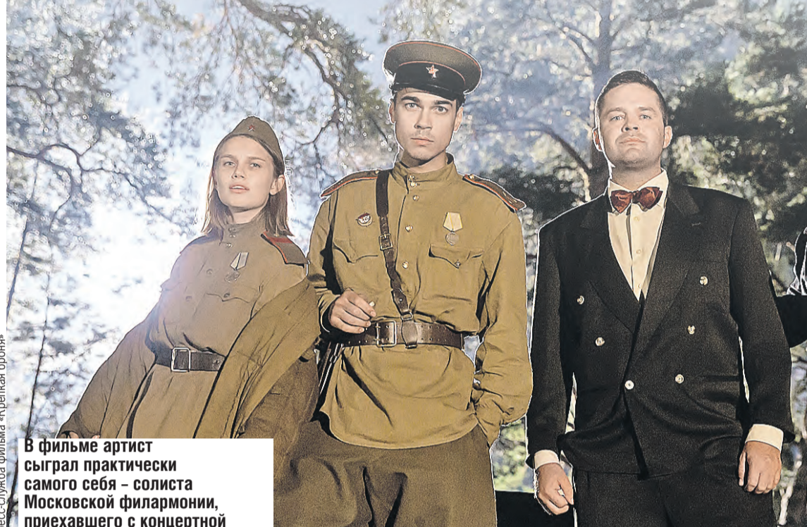
В фильме артист сыграл практически самого себя – солиста Московской филармонии, приехавшего с концертной бригадой на фронт.