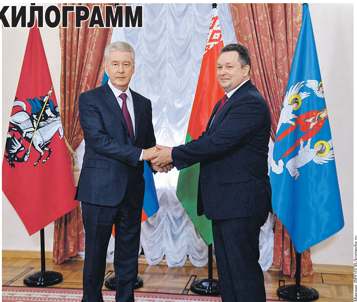
Мэр Москвы Сергей Собянин и председатель Мингорисполкома Андрей Шорец договорились развивать сотрудничество по всем направлениям и чаще ездить друг к другу в гости.

По итогам переговоров мэры подписали совместное заявление глав двух столиц. В документе выделены ключевые векторы, которым будет уделяться особое внимание – это развитие технологий по концепции «умных городов», благоустройство улиц и общественных пространств, развитие транспорта и инфраструктуры, усиление