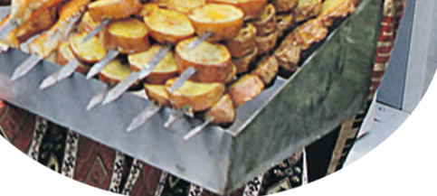
Изобретение гурманов из Беларуси – картофельный шашлык. Расходится на ура!

но грубая ткань, из нее получают хорошие массажные полотенца. Вместо посещения косметолога девушки сами могут нанести пилинг и натереться простой льняной тканью. Эффект гарантирован. Кроме этого, лен обладает антисептическим действием. Но нужно помнить, что изделия из чистого льна нельзя стирать в горячей воде, ткань попросту сядет. Оптимальная температура – тридцать градусов.