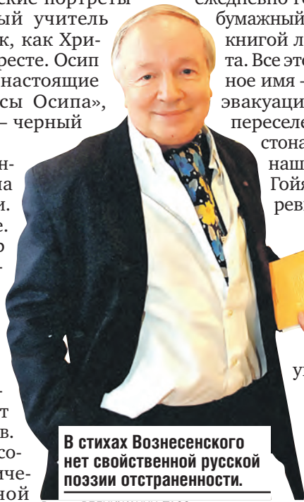
В стихах Вознесенского нет свойственной русской поэзии отстраненности.