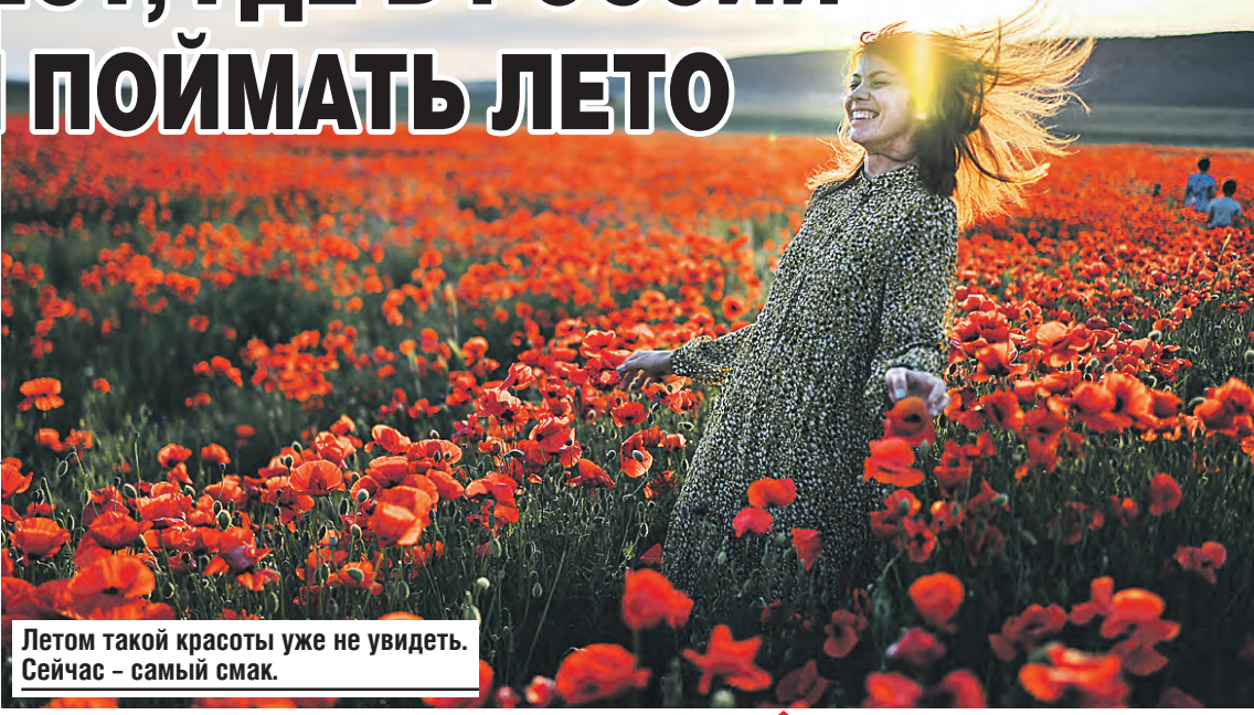
Летом такой красоты уже не увидать. Сейчас – самый смак.