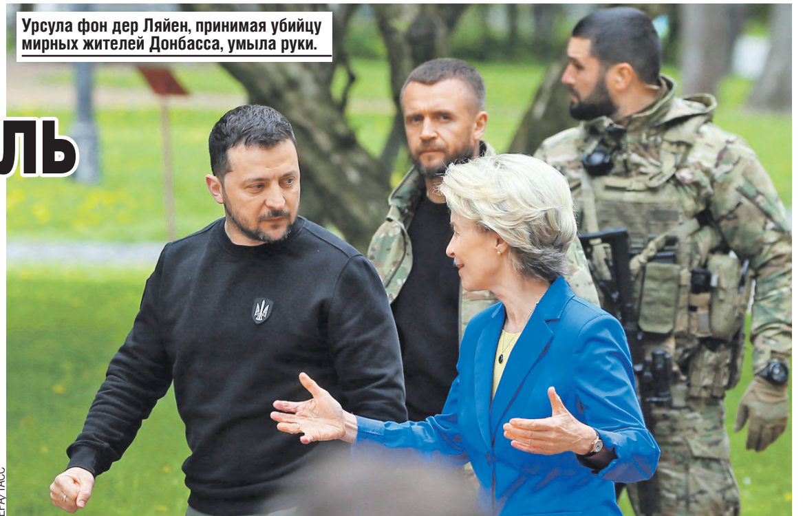
Урсула фон дер Ляйен, принимая убийцу мирных жителей Донбасса, умыла руки.

Вообще-то Старый Свет, который быстро сдался Гитлеру, активно участвовал в преступлениях против советского народа. Здесь разбойничали румыны, финны, венгры, хорваты, голландцы, чехи, албанцы – всех перечислять долго. Итальянцы вторглись в Украину, затем они оказались под Сталинградом. Страшно зверствовали румыны в Одессе, их ненавидели здесь гораздо больше немцев. Если взять поляков, которые считают себя жертвой агрессии