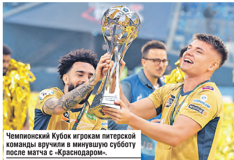
Чемпионский Кубок игрокам питерской команды вручили в минувшую субботу после матча с «Краснодаром».

го острова победным огнем вспыхнули роstralные колонны, что бывает по самым торжественным случаям. Для влюбленного в футбол Петербурга каждое золото «Зенита» – как раз такой случай.