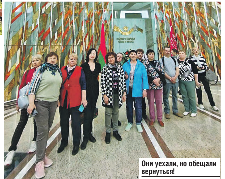
Они уехали, но обещали вернуться!

В обзорной экскурсии по столице гости оценили старинные церкви и костелы, прогулялись по проспекту Независимости, живописным историческим кварталам. Погрузились в эпоху Средневековья и полюбовались на