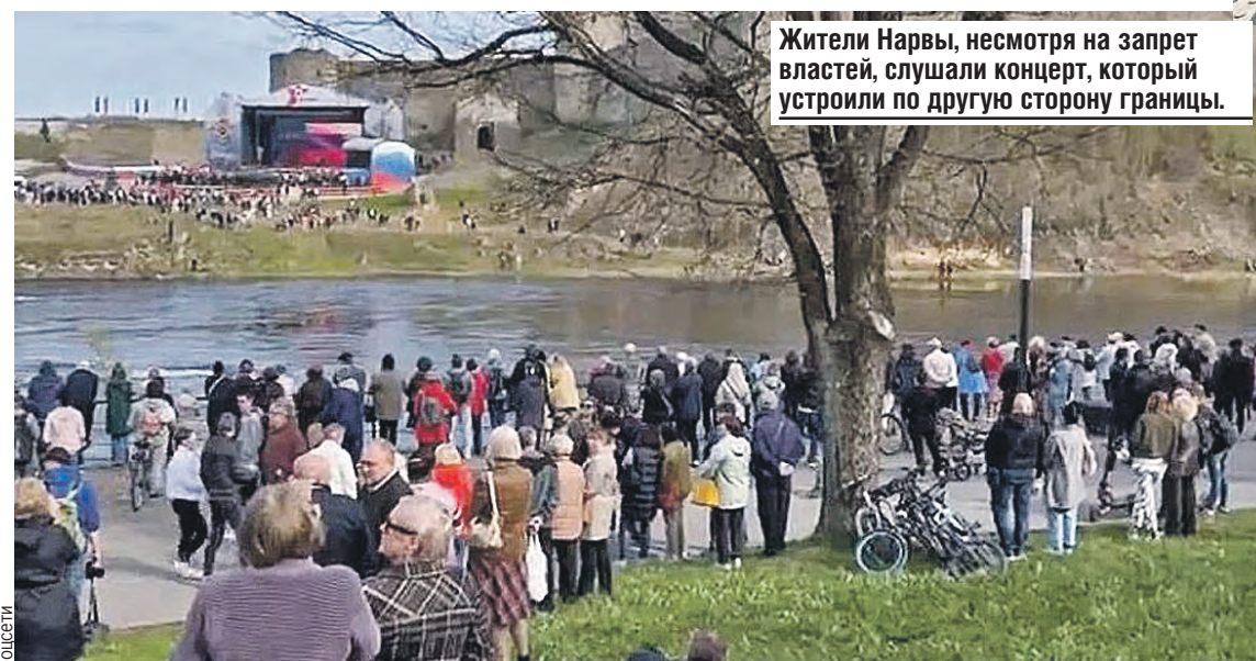
Жители Нарвы, несмотря на запрет властей, слушали концерт, который устроили по другую сторону границы.