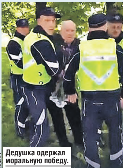
Дедушка одержал моральную победу.

Возлагали цветы и в парке латышского Даугавпилса. К двум мужчинам подошел корре-