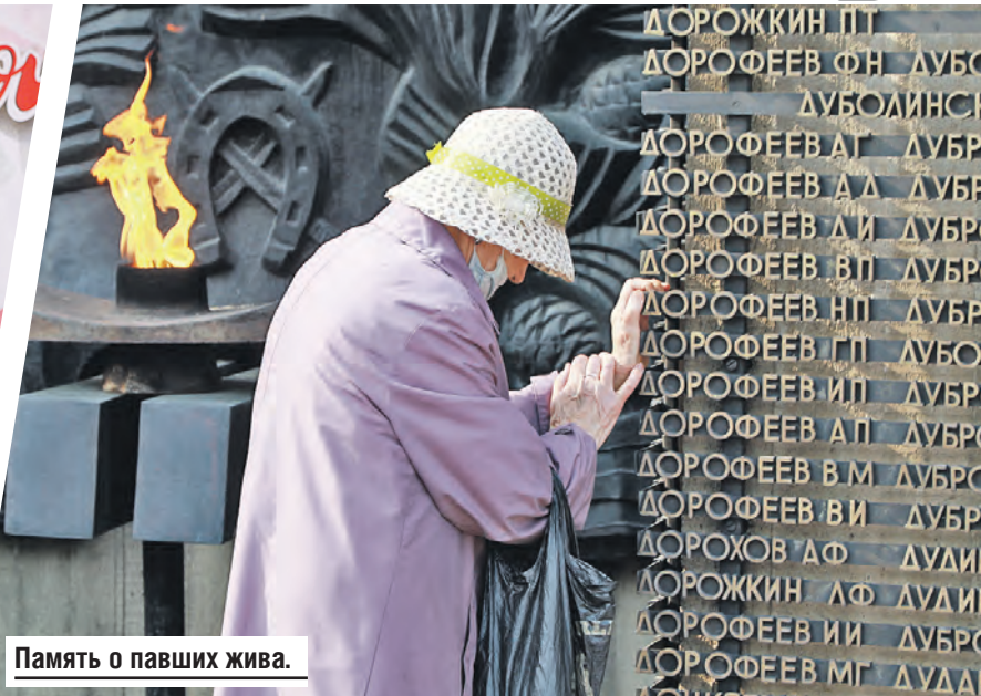
Память о павших жива.