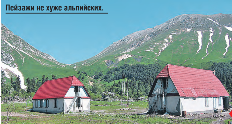
Пейзажи не хуже альпийских.

Обязательно поезжайте сюда, чтобы увидеть полуостров разноцветным. В мае он просто усада для глаз – везде огненные маки, редкие тюльпаны и желтые поля рапса. А еще весной туристов мало, а цены на жилье низкие. Около 25 градусов тепла, но водичка, правда, еще бодрящая – не больше 18–20. Посетите Судак или Оленевку – там очень живописно. В последней песчаный пляж, мелкое прозрачное море, дельфины и сказочные белоснежные обрывы. В Судаке – развитая инфраструктура, незабываемая природа и полно интересных мест. Скучать не придется – посетите крепость, Новый Свет, отправляйтесь на прогулку в горы и на мысы Меганом и Алчак-Кая.