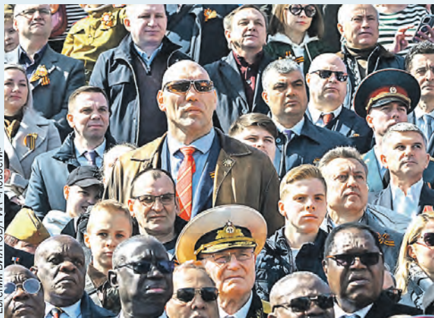
Все равно не запугали: парламентарий еще не раз приедет в Донбасс.

– После Нового года мы приехали в Лисичанск. Вошли в командный пункт, а только что туда ударил «Хаймарс». Но не разорвался. Погиб человек, который находился в соседней комнате отдыха. Ему, к сожалению, оторвало ноги, он скончался от потери