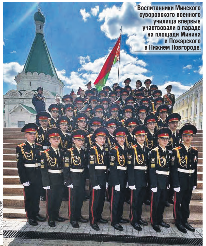
Воспитанники Минского суворовского военного училища впервые участвовали в параде на площади Минина и Пожарского в Нижнем Новгороде.

А на «Линии Сталина» провели зрелищную реконструкцию боя Великой Отечественной «Берлинская операция» с громкой стрельбой и кинематографическим дымом.