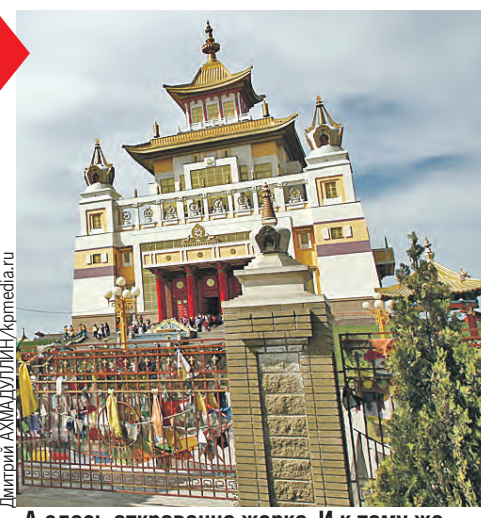
А здесь откровенно жарко. И к тому же можно окунуться в буддийскую культуру.

На столбике термометра в конце весны здесь вполне можно увидеть отметку больше 30 градусов. Летом жара будет невыносимая, поэтому сейчас отдохнуть там самое время.