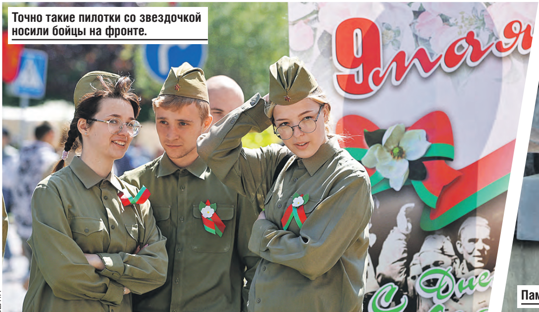
Точно такие пилотки со звездочкой носили бойцы на фронте.