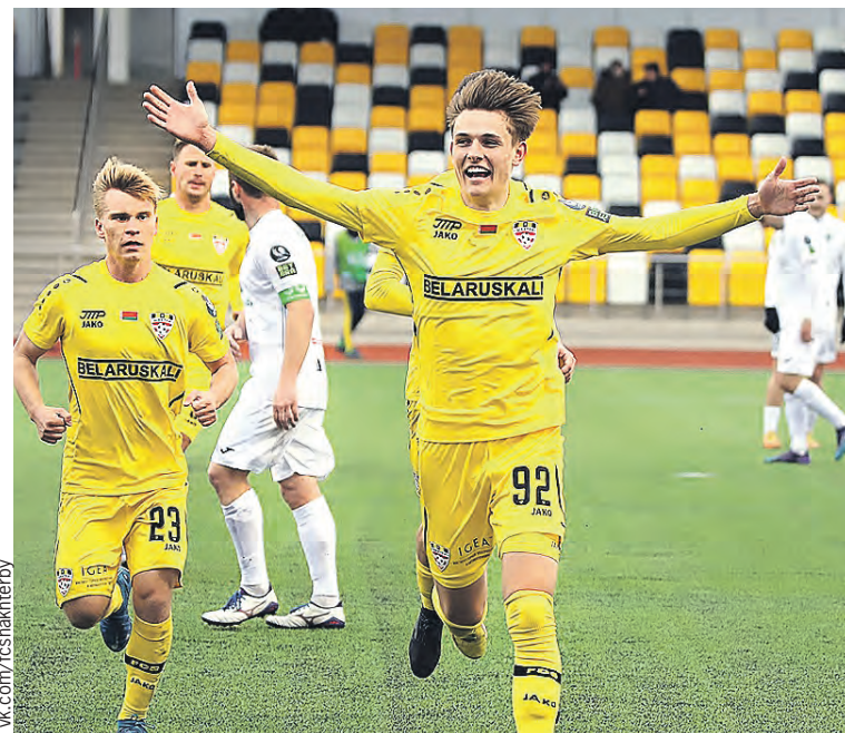
Рано радовались «горняки». Прошлогодняя победа «Шахтера» в первенстве Беларуси оказалась «с душком».

По итогам резонансных решений КДК пересмотру подвергся и список команд, которым предстоит представлять Беларусь в еврокубковых турнирах. Бронзовый призер минувшего первенства БАТЭ выступит в Лиге чемпионов, минское «Динамо» и «Ислочь» – в Лиге конференций. Третьим представителем в этом розыгрыше, скорее всего, станет финалист Кубка страны «Торпедо-БЕЛАЗ» из Жодино. В текущем чемпионате тройку лидеров составляют минское «Динамо», БАТЭ и «Торпедо-БЕЛАЗ». «Ислочь», тренером-консультантом в которой трудится участник чемпионата