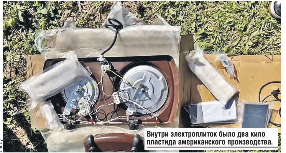
Внутри электроплиток было два кило пластика американского производства.

Ее слезные истории, как и слова Волчек и Григорьева, слишком сильно похожи на те, что в апреле выдавала