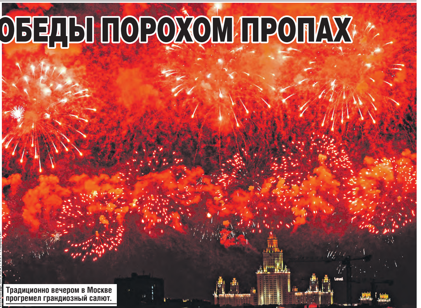
Традиционно вечером в Москве прогремел грандиозный салют.