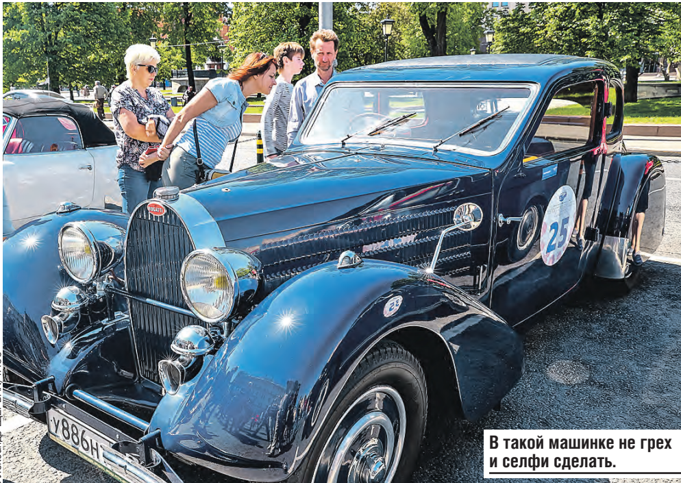
В такой машинке не грех и селфи сделать.

Не зря тема «Ночи» – опыт. Познать новое – не проблема. В музейно-мемориальном комплексе истории Военно-морского флота России гости фактически попадут на