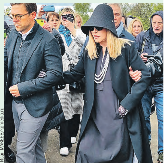
Пугачева попыталась скрыть лицо под шапкой-горшком и темными очками.

– Такие граждане, как она, должны понимать, насколько мерзко их преда-